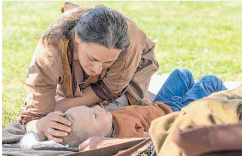
„Az anyukám az én menedékem”

Hogyan látjuk, hogyan éljük meg a gyermek érkezését? Mit meg nem teszünk, hogy mindez megvalósulhasson? Hogyan változott az anyakép a történelem során? Ezekre a kérdésekre kerestük a választ összeállításunkban. Kissé rendhagyó módon felfoghatjuk a következőket úgy is, mint egy téren és időn áthatoló körkapcsolást Mária országában.