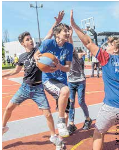
Akárcsak a nagyok!