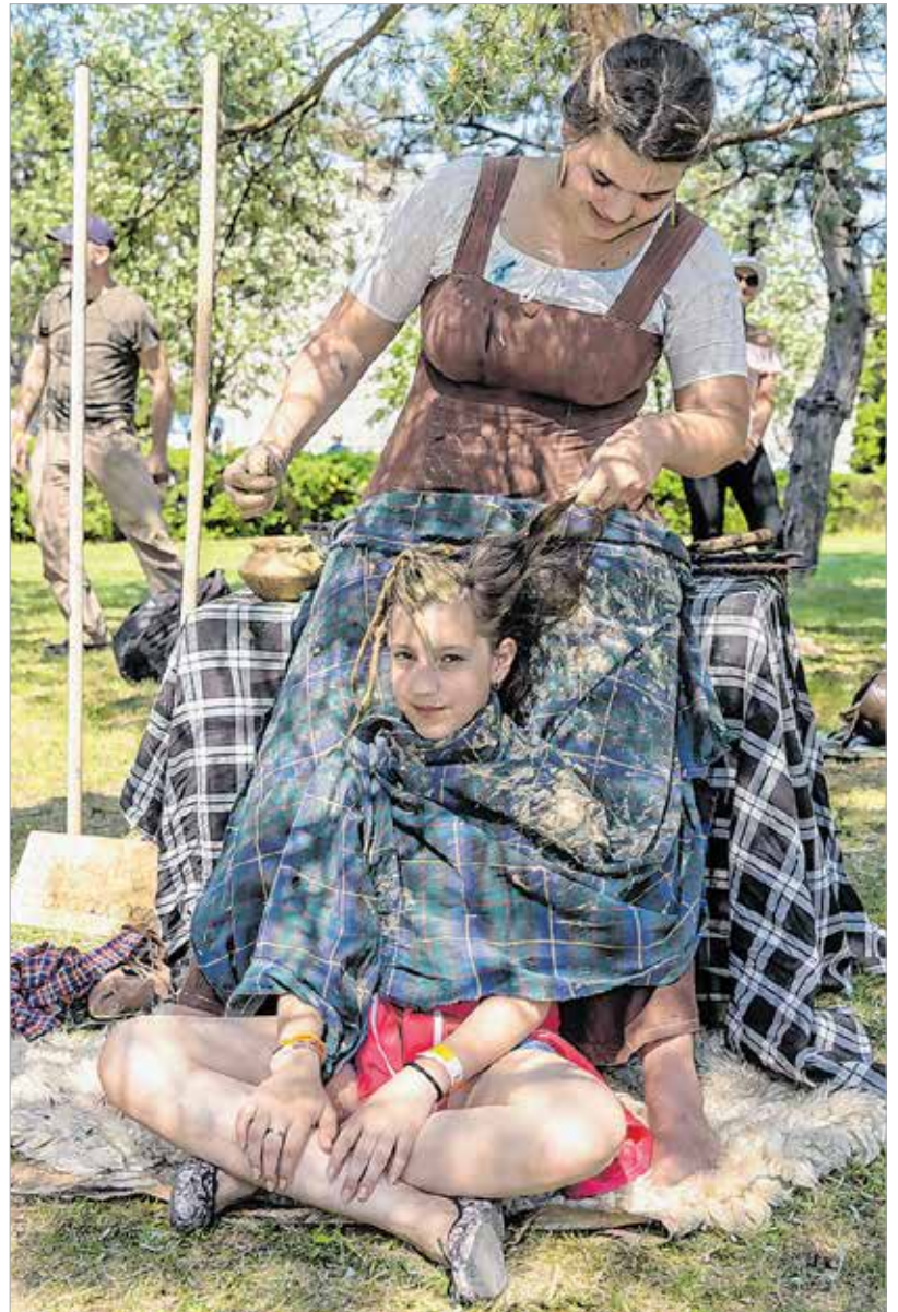
A kézműves foglalkozásokon többek között ékszereket, babér- és virágkoszorút, mozaikképet és bőrsarut lehetett készíteni. Annak aki pedig szeretett volna rómaiává válni, lehetősége nyílt beöltözni egy fotó erejéig.