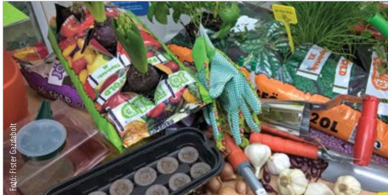
Ideje hozzáfekedni a tavaszi előkészületekhez!

• A burgonya vetése – noha már folyamatosan érkezik az üzletekbe – ahogyan azt az öregek mondták, „április negyediké előtt nem szokott megtörténni.”