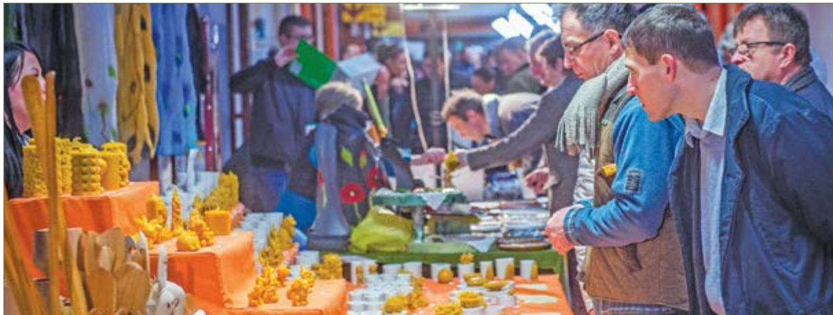
Székesfehérvár vendégei voltak a közép-európai méhészek

Méh+ész, egyenlő méhész, tartja a mondás. Ennek megfelelően a méhészek szakmai közösségének gondoskodó, értékközpontú munkájának köszönhetően tovább erősödhet a magyar méhészet rangja itthon és szerte a világban.