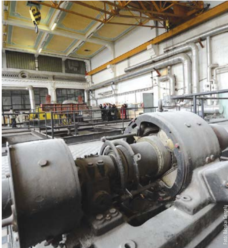
A fűtőerőmű területén többek között hangversenyerem is lehet

„Noha nem szeretnék kifejezetten párhuzamot vonni a kettő között, de a Kommunizmus Áldozatainak Emléknapja megünneplésének alkalmával eszembe jutott, hogy akkoriban Moszkvából mondták meg, mit kellene tennünk, manapság pedig Brüsszelből. Úgy gondolom, hogy a szakmaiságot nélkülöző döntés és indoklás az Európai Unió alapító atyáinak eredeti szándékaival is teljesen ellentétes.”