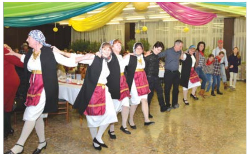
Többnyire a közönség is táncra perdül

pályámra. A település 1950-ben épült a Görögországból érkezett menekültek számára. Mint minden közösségnek, így az itt letelepedett görögöknek is nagyon fontos volt identitásuk megőrzése, hagyományaik ápolása. A görög néptáncscsoport a legelső között alakult meg a településen, mely aztán az első visszatelepülési hullámkor meg is szűnt. Ma is büszkeség tölt el, amikor arra gondolok, hogy a nyolcvanas évek végén, hosszú kihagyás után a néptáncscsoport újjáalakult. Ennek egyik alapító