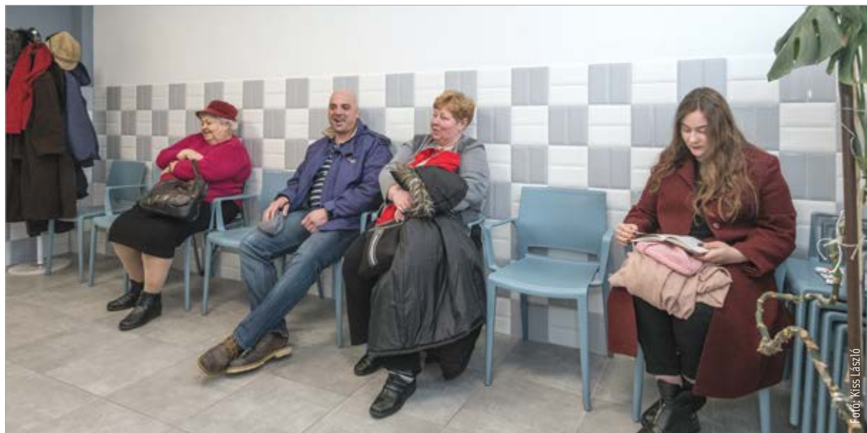
A városban harmincnegyzet felnőtt háziorvos várja a betegeket. Szárazrétén már modern rendelőkben fogadják a pácienseket