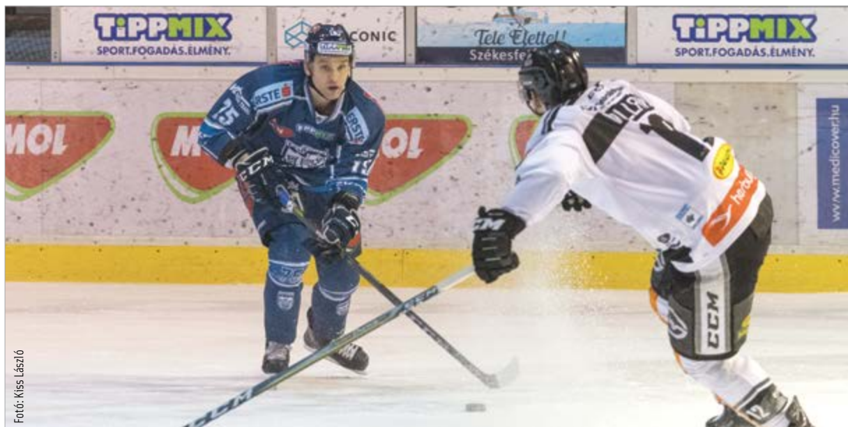
Ha minden jól megy, a középszakaszk végén is lesz ok az örömré!

A támadó a talákozó elején egy kapuvassal jelezte, hogy a gárda mindenképpen szeretné bezsebelni a három pontot, majd Latendresse és Mušič révén gyorsan kétgólos előnybe is került a csapat, amit meg is tudott őrizni az első harmad végéig. A második játékrészt aktívabban kezdték az osztrákok, előbb a vasat találták el, aztán negyven