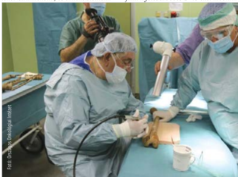
Steril műtői körülmények között folyt a vizsgálat

történelmi jelentőségű felfedezésekre jutni: „Miután az intézetben nagyon hamar elkezdtük a tumor DNS-ek vizsgálatát, úgynevezett szekvenálását, és évente már hétezer vizsgálatot végzünk, úgy éreztem, hogy megvan a képesség arra, hogy DNS-eket vizsgáljunk. Természetesen itt hatszáz-nyolcszáz éves DNS-ekről van szó, ahol nyilvánvalóan számos eltérés van, de az alapismeret ugyanaz. Szakemberek nyitották fel a szarkofágokat, koporsókat. Műtői sterilitás körülményei között átvittük a csontokat az Országos Onkológiai Intézet egyik erre a célra előkészített műtőjébe. Ott minden egyes csontvázról CT-felvételeket készítettünk, majd mintát vettünk. Rendkívül felemelő, nagyon szép munka volt. Ezt követte a mintáknak az előkészítése arra, hogy megpróbáljunk nyolcszáz éves DNS-eket kivonni.