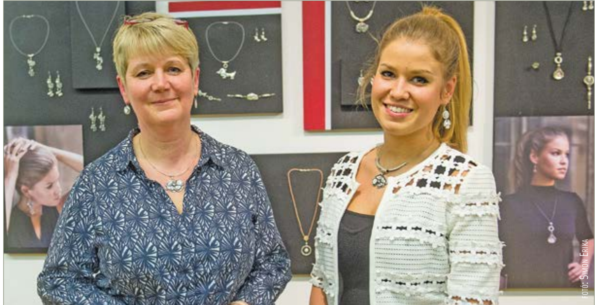
Két Orsi egy húron

A látogatók megtapasztalhatták, hogy az ékszer – mióta világ a világ – vonzza a szemet, kézen fogva jár a szépség és az egyszerűség. A két