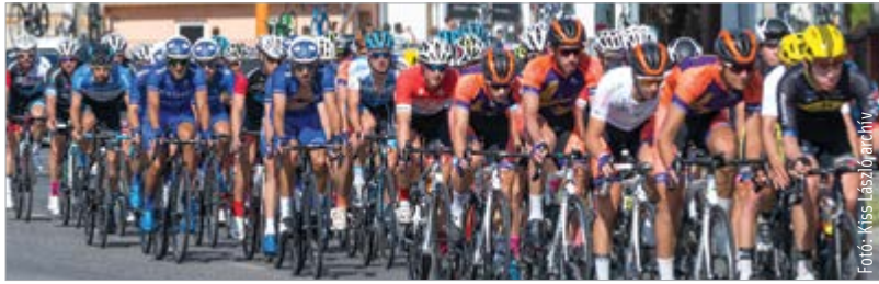
Idén sokkal többet látunk majd a mezőnyből