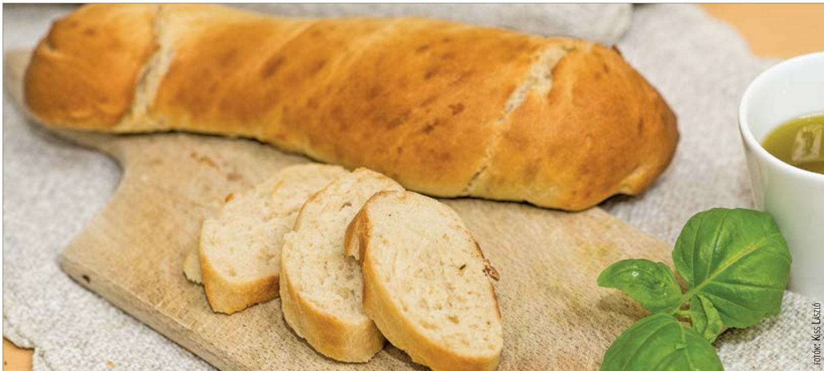
Egy kis fokhagymás olívaolajjal isteni finom!