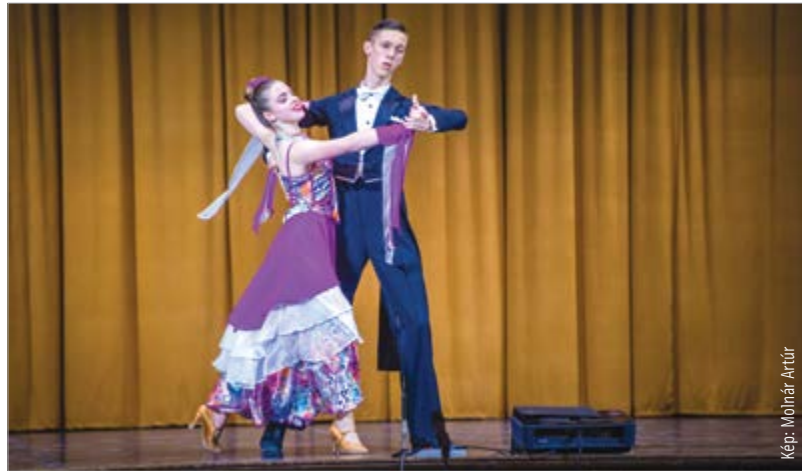
A közönség egy színvonalas műsort is megnézhetett