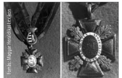
A székesfehérvári káptalan jelvénye

1886. március 8. (BH) Székesfehérvárott hónapok óta időznek a török kormány küldöttei, kik lovakat szállíttatnak Konstantinápolyba s helyieket fogadnak föl kíséretnek. Ezek aztán mind török fezzel a fejükön térnek haza, s büszkén sétálnak végig az ósváros utcáin.