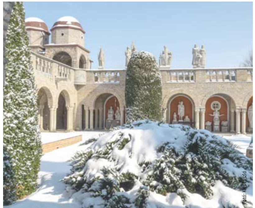
Egy igazi havas mesevilág

március 09. péntek 7:30-15:30 március 10. szombat ZÁRVA március 13. kedd 7:00-19:00 március 15. csütörtök ZÁRVA március 16. péntek ZÁRVA