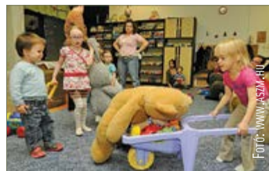
A Bóbita játékszobát tizenkét év alatti gyerekek használhatják

A Szabadművelődés Háza első emeletén működik a Bóbita