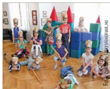
A játékmúzeumban játszani is lehet!

Nem csak a vízvárosiakat várják erre az ingyenes közösségi térre a Budai úton, az ismert hipermarketten szemben. „A mozaikszo a