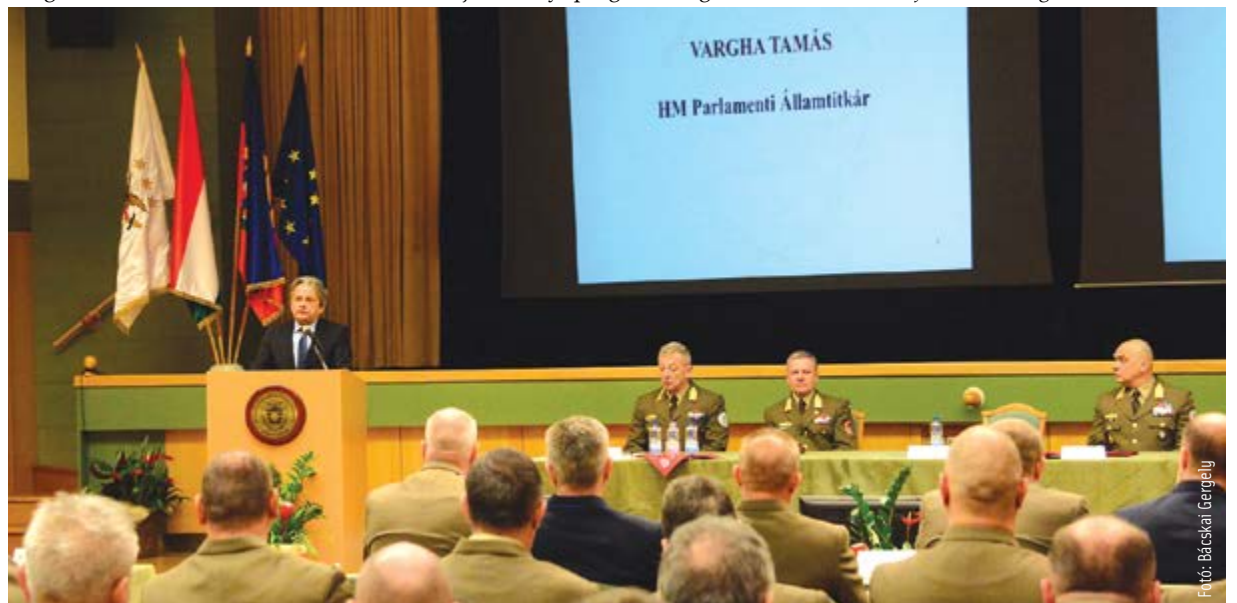
A Magyar Honvédség esküjéhez híven védi határainkat

sát, mely a kormány döntése alapján 2026-ig lehetőséget biztosít egy átfogó hadiipari fejlesztésre illetve a hivatásos és tartalékos állomány megerősítésére: „Egy harmincezer fős hivatásos haderő megalkotását tűztük ki célul a program végére. De emellett nagyon fontos, hogy legyen egy tartalékos haderője is a hivatásosok mellett Magyarországnak. Ezt húszezer fővel, járási alapon hozzuk létre, hiszen úgy helyes, ha a tartalékos katonák a lakóhelyükhöz közel teljesítenek szolgálatot.”