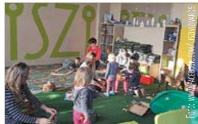
Családi hangulat a közösségi térben

Lakóközösségi Információs és Szolgáltató Iroda megnevezést rejti magában, de szeretnénk, ha az itt lakóknak a szórakozás, a hasznos időtöltés és a kikapcsolódás színonimájává válna. Célunk, hogy egy olyan díjmentesen használható közösségi teret biztosítsunk, mely alkalmas arra, hogy a Vízivárosban élőket korosztálytól függetlenül ki-mozdítsuk a hétköznapiakból, programjainkkal egymás megismerését elősegítsük, helyi összefogásra buzdítsunk és egy nagy, egymásra odafigyelő közösséget építsünk.” – hangzik az ismertető az oldalukon. A LISZI-ben a legkisebbeket és anyukáikat a Babás bandázó foglalkozásai is várják hétfő