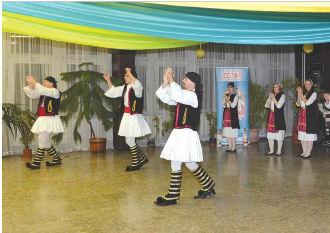
Rendszeresen lépnek fel bálokon, a Szabadművelődés Háza pedig táncházak szervezésével támogatja a csoportot

Nagy sikerrel tart táncházakat hónapok óta a Zorba Görög Néptáncegyüttes a Szabadművelődés Házában, és város- illetve megyeszerte egyre több a fellépésük. A napokban ünnepelték megalakulásuk egyéves évfordulóját: 2017. február 16-án volt az első szereplésük a Széna Téri Általános Iskola szülői farsangján. Ekkora népszerűsége bizony nem számított a maroknyi kis csapat, akik eredetileg egyetlen estére verbuválódtak csak össze. A heteken keresztül tartó próbák, az életteli zenék azonban annyira összekovácsolták a csapatot, hogy hamarosan megbizonyos-