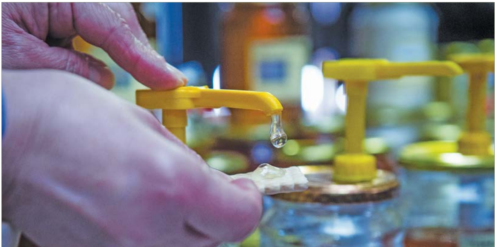
A méz összeköt