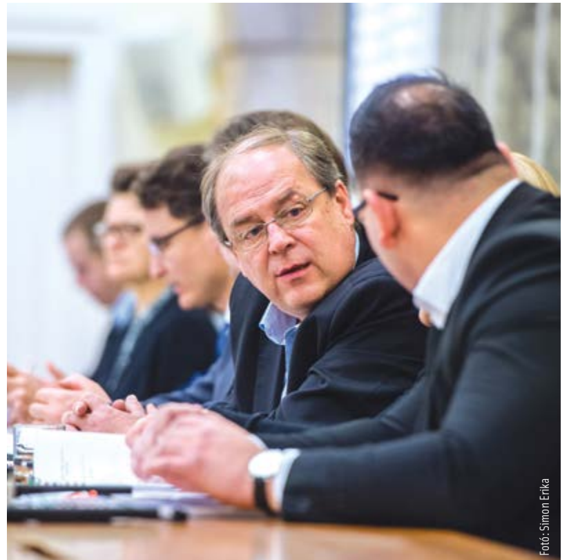
A város sem ismerhette meg a székesfehérvári pályázat bírálatának tartalmi elemeit