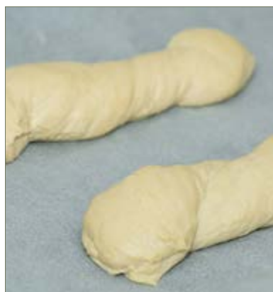
A vekniket sodrás után csavarjuk

A megkelt masszát nyújtódeszkára vagy sütőpapírra tesszük, és kézzel harminc centi átmérőjű körre lapogatjuk. En a sütőpapírt szoktam választani, mert a tészta kidolgozásához nem kell külön lisztezni. A kört képzeletben