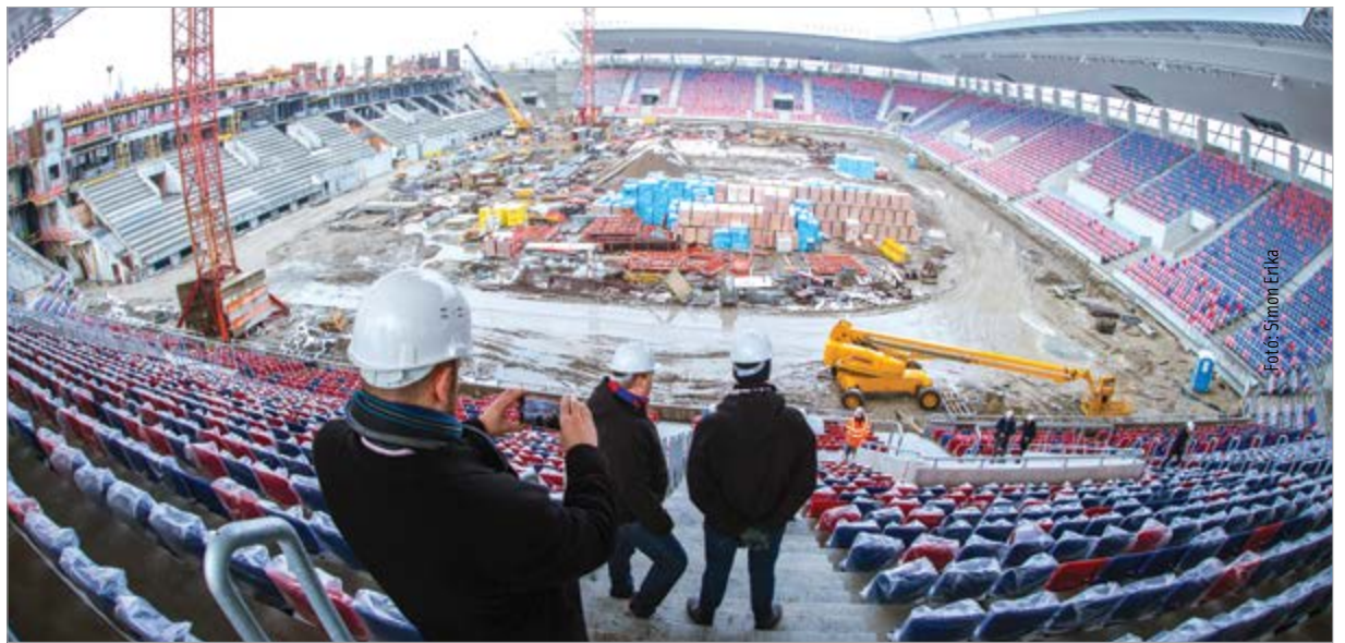
Már van, ami piros-kék, és hamarosan a zöld szín is megjelenik az új Sóstói Stadionban