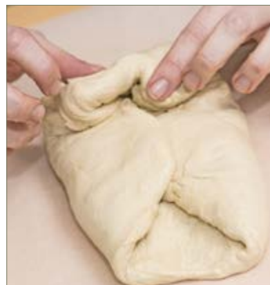
Az oldalakat könnyszerűen hajtogatjuk

Ciabattasütésnél az első és legfontosabb dolog, hogy kenyérlisztből (BL80) készítsük! Így a vekni héja ropogós, a belseje pedig igazán puha lesz.