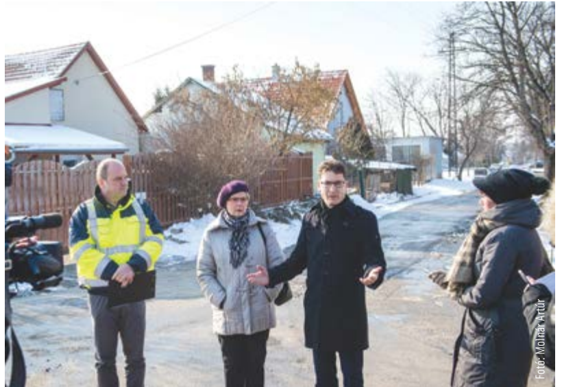
Székesfehérvár valamennyi városrésze érintett az utak, járdák, parkolók megújításában

„Idén csak a fejlesztésekre tudunk annyit költeni, mint amekkora 2010-ben a Városgondnokság teljes költségvetése volt. Az utak, járdák, parkolók fejlesztése pedig nagyon fontos abból a szempontból is,