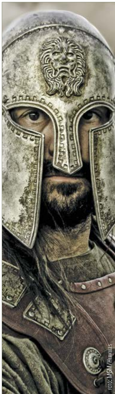
Attila elsőként görög harcos volt a Herkules című filmben

vettünk részt, ami kemény katonai kiképzést jelentett. Ebben többek között katonai szakértők és kaszkadőrök segítettek: meneteltünk tizenöt kilós pájzzsal, be kellett gyakorolni a fegyverrel való harcok koreográfiáját. A forgatásra kimondottan sportolókat kerestek action extra kategóriába, én pedig bokszolok és systemázok, ami egy orosz harcművészet. Hamar kiderült, miért ragaszkodtak ehhez. Már az első napon negyvenhétszer rohantunk le a dombrol, úgyhogy másnapra ötven ember vissza is mondta a munkát. Emberpróbáló forgatás volt, plusz negyven főtől a mínusz két fokig minden hőmérsékletben dolgoztunk, nem ritkán napi három-négy órás alvással.”