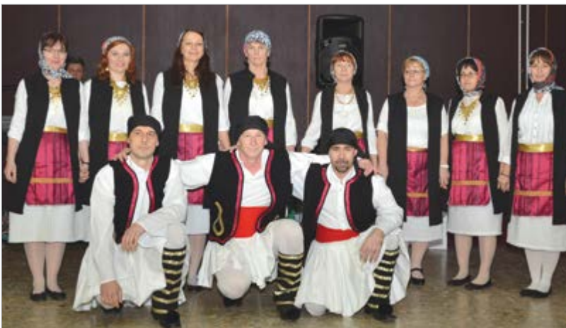
Egyéves a Zorba Görög Néptáncgyűttes

A célkitűzések tehát hosszú távúak, az életöröm pedig töretlen. Görög táncház a tervek szerint legközelebb márciusban lesz a Szabadművelődés Házában.