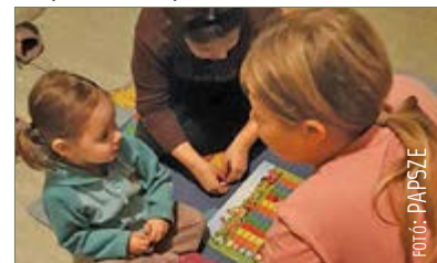
Klubdélután a PAPSZE szervezésében

A Palotavárosban is található egy LISZI-hez hasonló kezdeményezés. A PAPSZE klubhelyiségében, a Jancsár utcában a gyerekeket játékokkal megrakott polcok várják, társasjátékok, a szombati