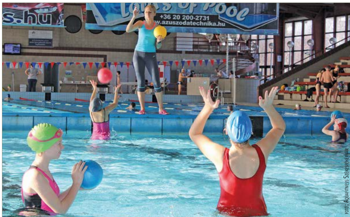
A kis vízben tartott edzések nagyon népszerűek

követhessen, én pedig javítsam őket, ha kell. De ha már mindenki jól ismeri a feladatokat, és fél szavakból, mozdulatokból is ért, akkor bemegyek én is közéjük. Ilyenkor újra rájövök, még mindig mennyire jó ez a sport!” Renivel nemcsak az uszodában találkozhatunk, Megyeház utcai tornatermében várandós tornákat és szülés utáni regeneráló tornát is tart. Tíz éve úzi hivatászerűen a mozgást, és a mindennapokban is hűen képviseli elveit: rengeteget sétál, gyalog jár dolgozni, aktív életvitelt folytat. Szívesen indul kisebb túrákra, városnéző kirándulásokra is. Mivel az állatokat is nagyon szereti, évente néhány alkalommal jótékonyági órákat tart a HEROSZ Allatotthon javára, ilyenkor a teljes bevételét nekik ajánlja fel, és részt vesz nyílt napjaikon, különféle programjaikon. Amikor meghallottam, hogy eredetileg turizmus-vendéglátás szakon végzett közgazdászként, nem tudtam magamban tartani a kérdést: nem gondolt-e arra, hogy világot lát a tudásával? Hiszen a vízitorna nagyon népszerű külföldön, például a tengerparti szállodák vendégei között is: „Sosem akartam külföldre menni, a magánéletben akadtak is nézeteltéréseim amiatt, hogy maradni akartam. Székesfehérváron születtem, mindig is itt éltem. És mindazt a tudást, amit megszereztem, az én városomnak szeretném visszaadni. A turizmus területén végzett tanulmányaimat sem szeretném veszni hagyni, hiszem, hogy