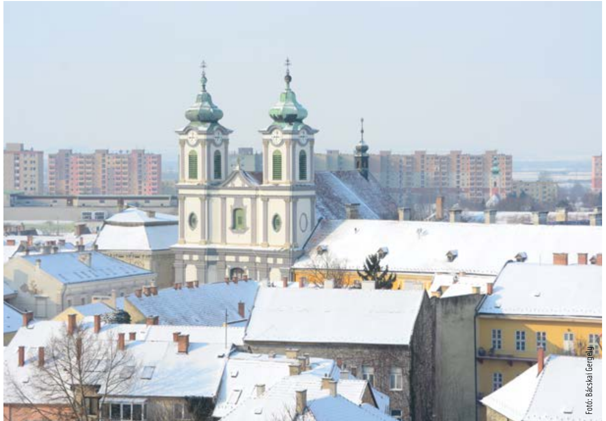
A ciszter templom és a pasztell ötven árnyalata