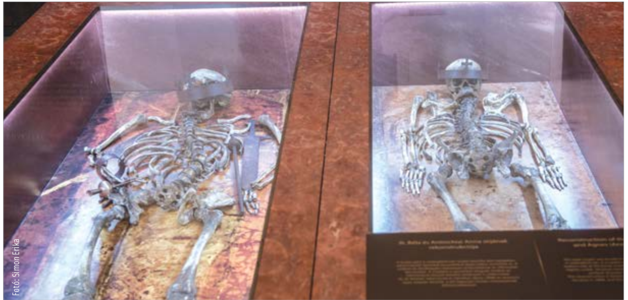
További azonosítások várhatók

A kutatások alapvető motivációja volt, hogy a történelem viszonyosságai miatt feldúlt Árpád-sírok összekevert csontjaiból minél több csontvázat osszerakjanak, lehetőség szerint meghatározzák, hogy ki kicsoda, úgy a királyok, mint a leány-