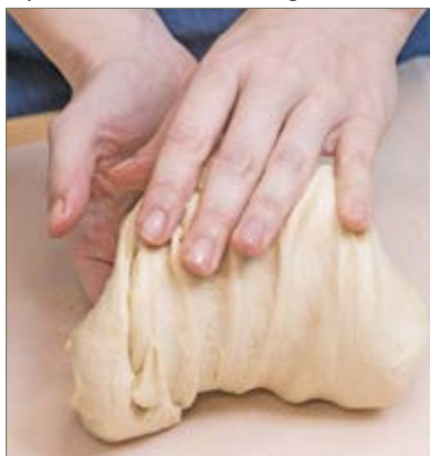
A tésztát csak pár percig kell gyúrni

Az első ciabattát Francesco Favaron, egy olasz pék sütötte 1982-ben Veronában, mert akkor-tájt kezdett a francia baguette