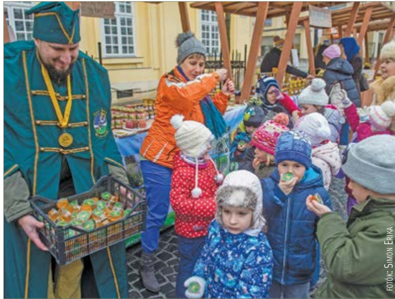
A mézfesztivál minden korosztálynak édes volt

A rendezvény kiváló lehetőséget biztosított arra, hogy az Euró-