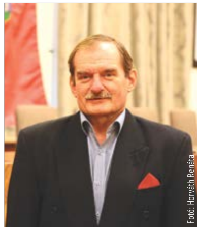
Az ajánlások gyűjtése és az ajánlóívek leadása március ötödikén délután négykor zárul

Az országgyűlési képviselők választásán egyéni választókerületben képviselőjelölt párt jelöltjeként vagy független jelöltként indulhat. Az indulás feltétele, hogy választókerületében legalább ötszáz érvényes ajánlást gyűjtsön össze. A jelöltek ajánlasyűjtése és az ajánlóívek leadása március 5-én 16-órakor zárul.