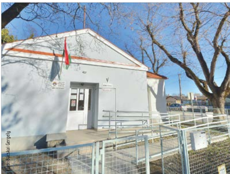
A Kégl György-program keretében újult meg a Berényi úti rendelő is. Közel húszmillió forintból korszerűsítették a fűtési rendszert, elkészült a falak szigetelése, megújult a kerítés és a tetőszerkezetet is lecserélték.