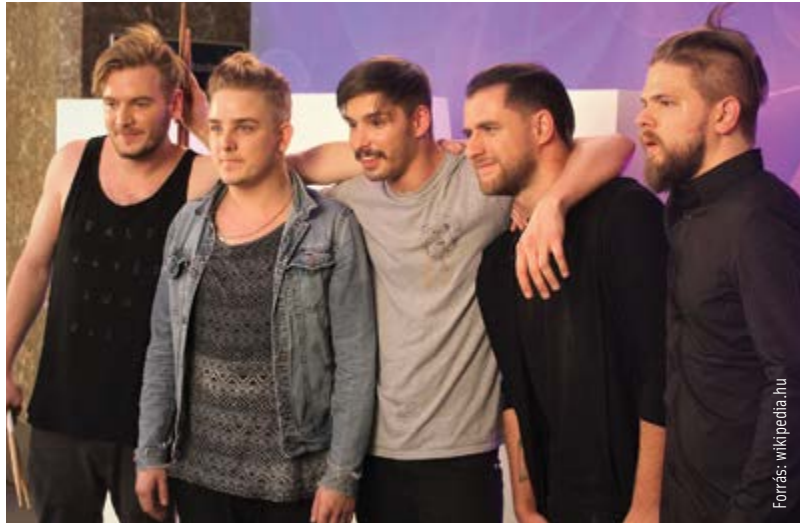
A győzelem pillanatai