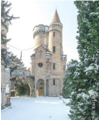
Jégvárás a Bory-várban

Sokan már azt hittük, hogy néhány mínusszal és pár barátságos gázsámlával letudtuk az igazi telet. Nem így lett! Hiába közeledik vészesen a húsvét, február utolsó napjaiban akkora pelyhekben esett a hó, mint a legszebb karácsonyi képeslapokon. A belváros porcukorlepelbe burkolózott. Egy csésze forró kávé mellől a tizedikről kinézve csendben megállapítottuk: a fehér háztetők keresztekkel varázslatosak.