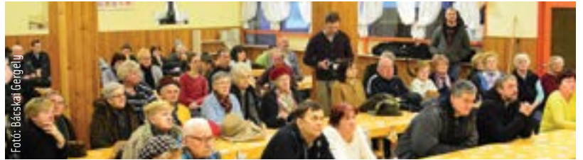
A fórumon többen köszönetet mondtak, hogy az általuk kért kisebb fejlesztések megvalósultak

A fórum elején a város polgármestere, Cser-Palkovics András a 2018-as elfogadott költségvetésről elmondta, hogy több mint hetvenmilliárd forint annak főösszege, ekkora még sosem volt. Mint mondta, egy-egy városrész beruházásain túl nagyon fontosak az egész várost érintő olyan fejlesztések, mint például a kórház új belgyógyászati tömbjének építése. Mészáros Attila alpolgármester, a városrész önkormányzati képviselője foglalta össze a 2017-es tóvárosi beruházásokat. Összesen közel százhetvenkétféle forintos fejlesztés történt tavaly, csak a Tóvárosban. A városrész bekötőútja megújult, az út mellett a járda és tizenhat parkolóhely is új burkolatot kapott. Intézményfelújítások mintegy százhuszmillió forint értékben történtek a Tóvárosban. Felújították a 8. számú bölcsőde belső nagy udvarát és a Tóvárosi Óvodában pedig nyílászárócserét történt. Elkészült a Tóvárosi Által-