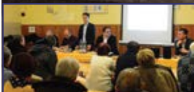
Fórum a tóvárosi fejlesztésekről 10. oldal