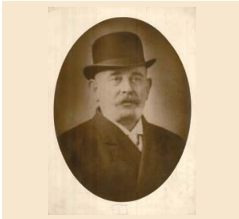
Szterényi József kereskedelemügyi miniszter portréja (Budapest 1918.)

dalmát vasút kiépítésére, az indokoltnál legalább százmillióval drágábban és a konkurencia ajánlatánál még drágábban. A harmadik Wekerle-kormány bársonyszékkel kínálta: kereskedelemügyi miniszter lesz. A feljegyzések arra utalnak, hogy az uralkodó szinte utolsóként, 1918-ban adományozott részére bárói rangot, melynek viselésére saját gyermek hiányában a felesége korábbi házasságából származó örökbefogadott fiát is feljogosította. Figyelemre méltó Régmúlt idők emlékei című írása, melyben az 1918. február közepén lezajlott bécsi útját idézi fel. Wekerle miniszterelnökkel a bécsi hadügyminisztériumba utaztak, hogy háborús megrendelésekről tárgyaljanak. Délután négy óra tájban a közös hadügyminiszter, Salm herceg őrnagy szárnysegédje jelentette, hogy őfelsége, IV. Károly este nyolc órára kihallgatásra rendeli őket Bädenbe a bucaresti béketárgyalások ügyében. A kihallgatás két órát vett igénybe.