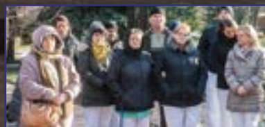
Az ápolók napja Fehérváron 24. oldal