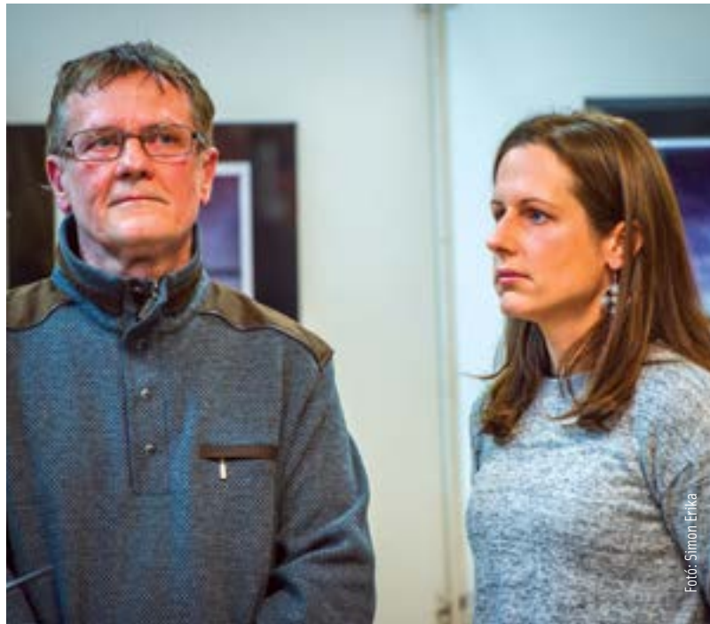
Apa és lánya a kiállítás megnyitón