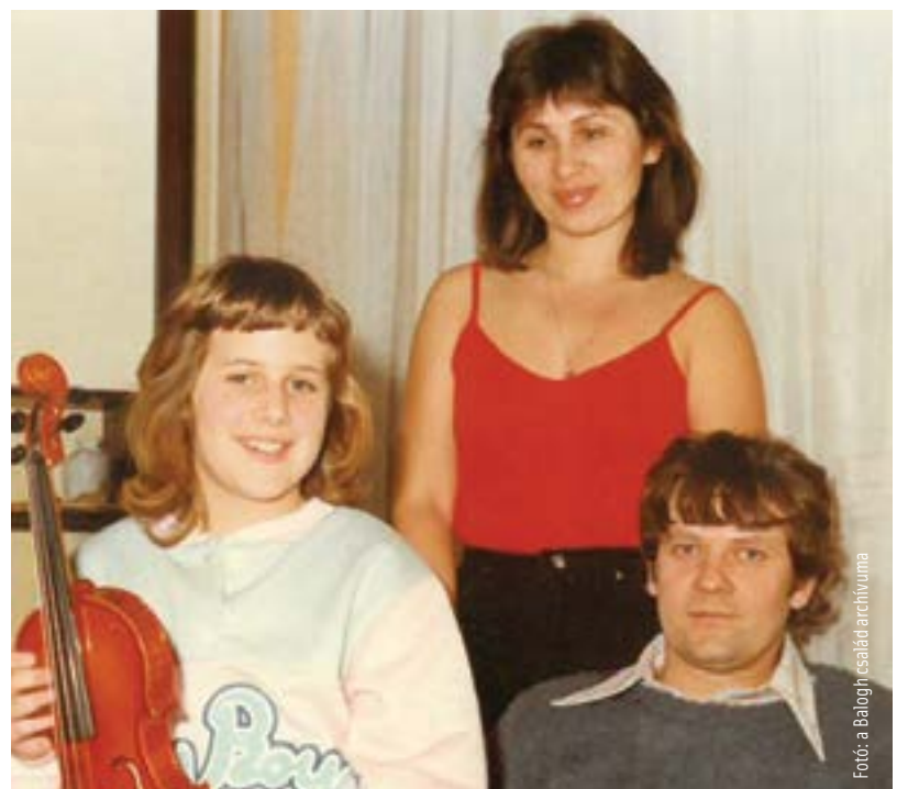
Együtt a család

Az álmom, hogy szeretnék ebből megélni, ne kelljen mellette mást is csinálnom. Szeretnék további további kiállításokat, az engem külön motivál, hogy dolgozom valamiért. Szeretném megmutatni, hogy a legnehezebb helyzetekből is van kiút!