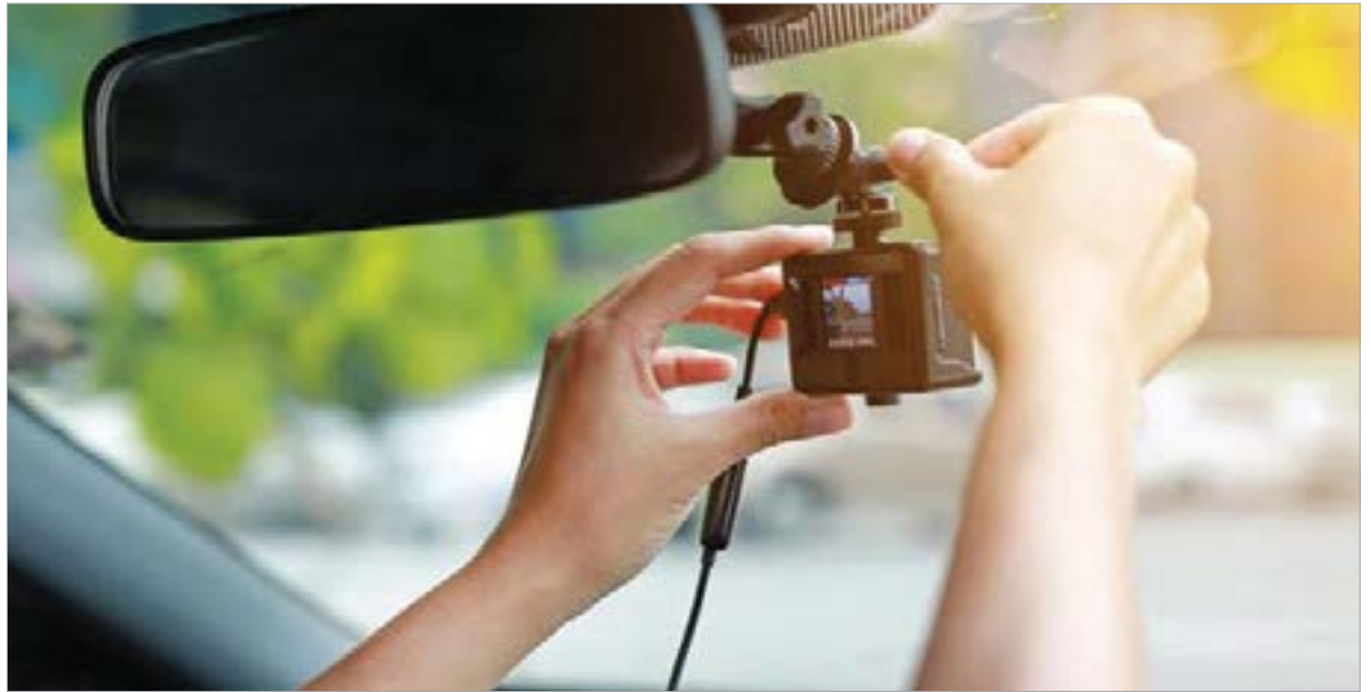
Hasznos segítség lehet egy baleset során, kérdés, van-e bizonyító ereje!

Nos, a helyzet messze nem ennyire egyszerű! Sajnos, mint sok más hasonló technikai vívmány, ez is oly gyorsan robbant be a köztudatba és vele együtt a mindennapi használatba, hogy a szükséges jogi szabályozás még messze nem történt meg. Így volt ez a drónok esetében is, bár ott már készül-