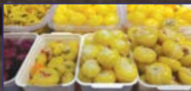
Savanyúságától édes az élet 22. oldal