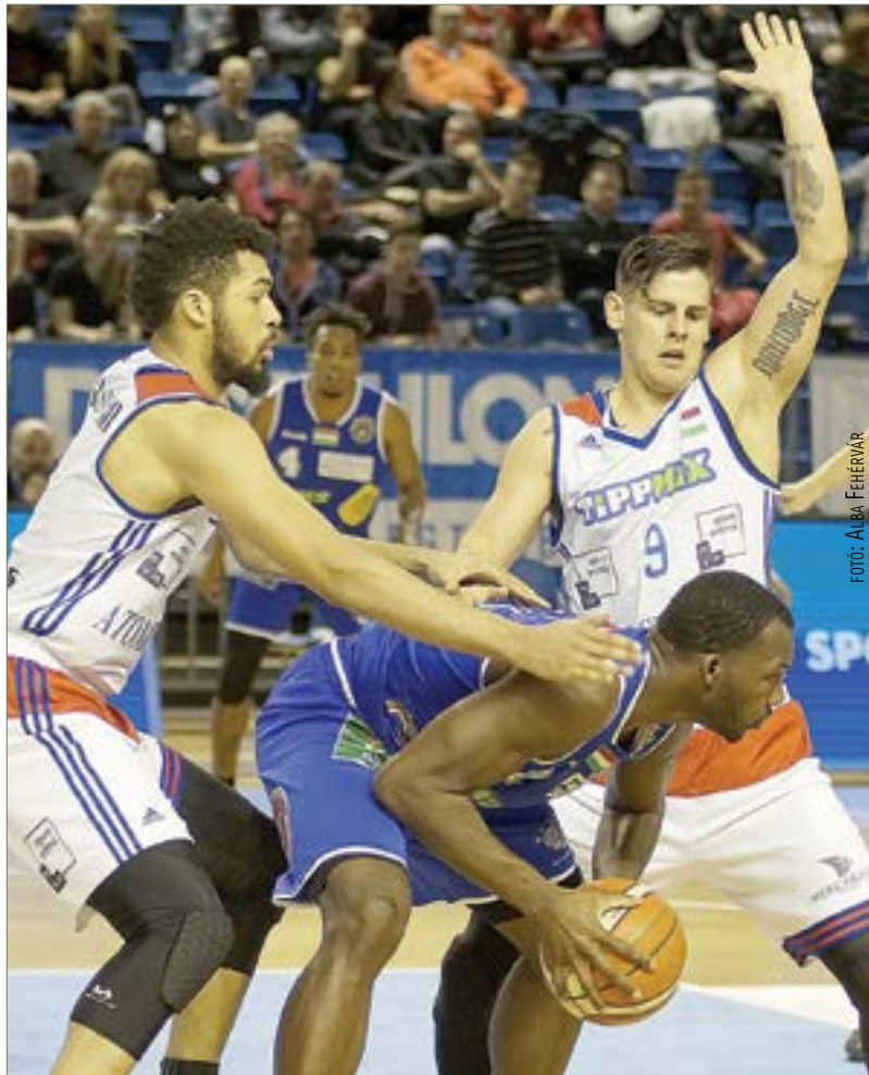
Az utolsó negyedben az Alba fölött nőtt a Paks, így a bronz is elúszott

bedobta a sorsdöntőnek bizonyuló ziccet. A döntőbe jutás csak nűanszokon múlt, majd nagyon