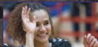
„A mostra kell koncentrálni!” 30-31. oldal

Hyundai i30 már havi 42 990 Ft/hó -tól az Ivanicsnál!