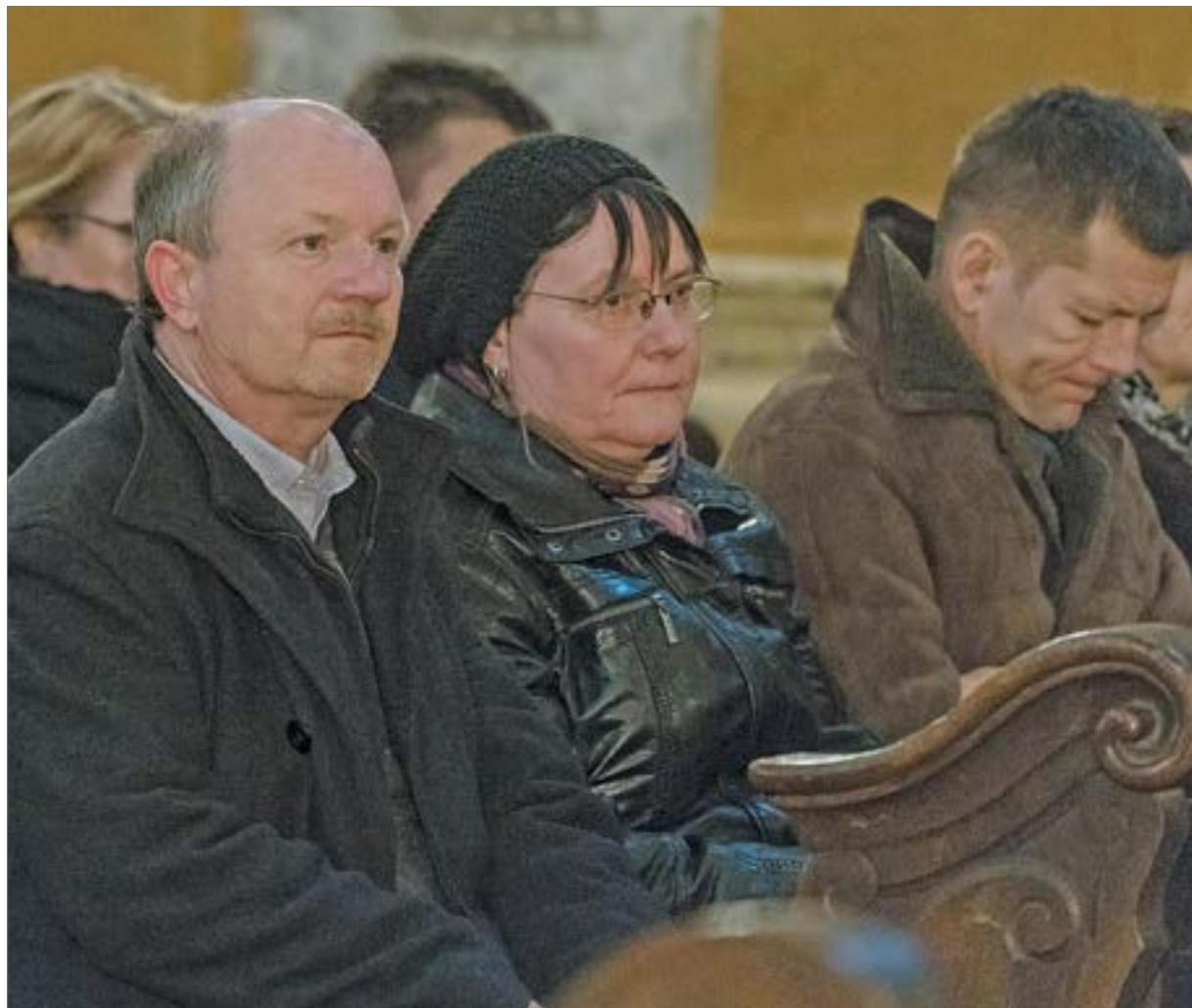
A házasság hetének ünnepi szentmiséjén negyvenhét házaspár újította meg házastársi esküjét