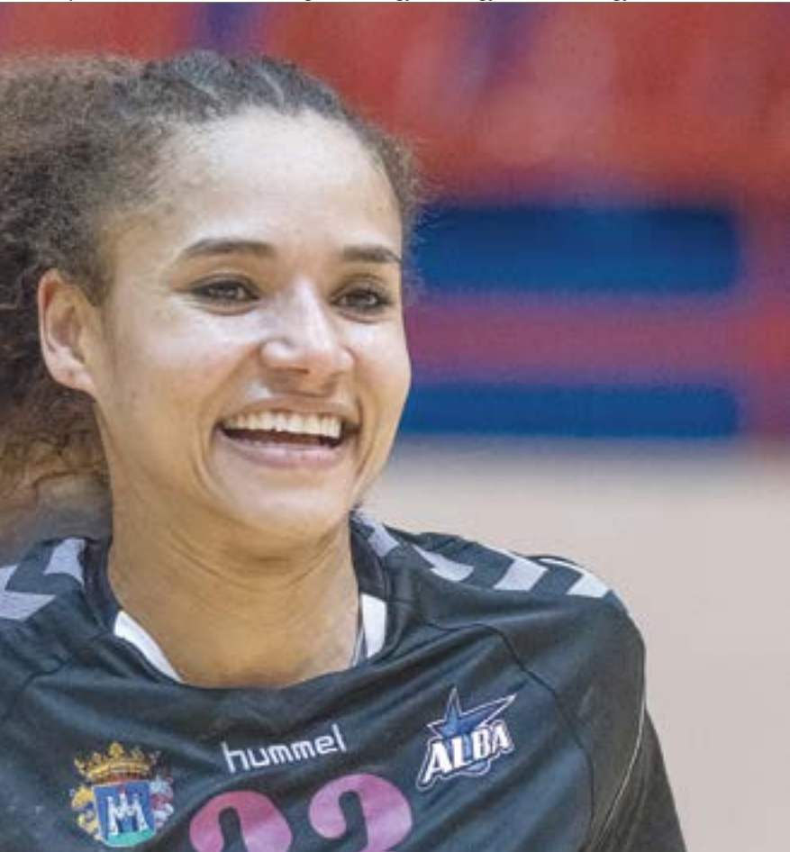
arcát, és úgy tüzei társait

éppen az edzőkkel, egyszerűen csak időre lenne szükségünk! A csapatot képesnek érzem rá, hogy a legjobb négy között végezzon. De látni kell, hogy volt gondunk bőven. Az én sérülésem és kiesésem vagy éppen Herr Orsi sérülése a felkészülés első napján. Aztán ugye jött egy neves kapus, aki nem vált be. Ilyen helyzetben pedig nem könnyű folyamatosan pozitívan látni a dolgokat.