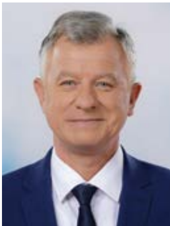
Törő Gábor - Fidesz

Móron születtem 1962. március 7-én, egyszerű, dolgozó szülők gyermekeként. Neveltetésem során a szüleim mindig nagy hangsúlyt fektettek arra, hogy a tevékenységemet kizárólag a tisztesség és becsület fonalát követve végezhetem, hiszen csak így érhető el olyan eredmény, amely méltó az emberek elismerésére. Ebben a szellemben neveltem én is pedagógus feleségemmel együtt a gyermekeinket. 2010. óta vagyok országgyűlési képviselő, 2012. és 2014. között voltam a Fejér Megyei Közgyűlés elnöke, 2015. óta töltöm be a Fidesz Fejér Megyei Választmányának elnöki tisztét. Nyitott, közvetlen embernek ismernek, aki készen áll arra, hogy megoldást találjon egyes emberek és közösségek problémáira. Büszke vagyok a közös sikereinkre: a székesfehérvári elkerülő