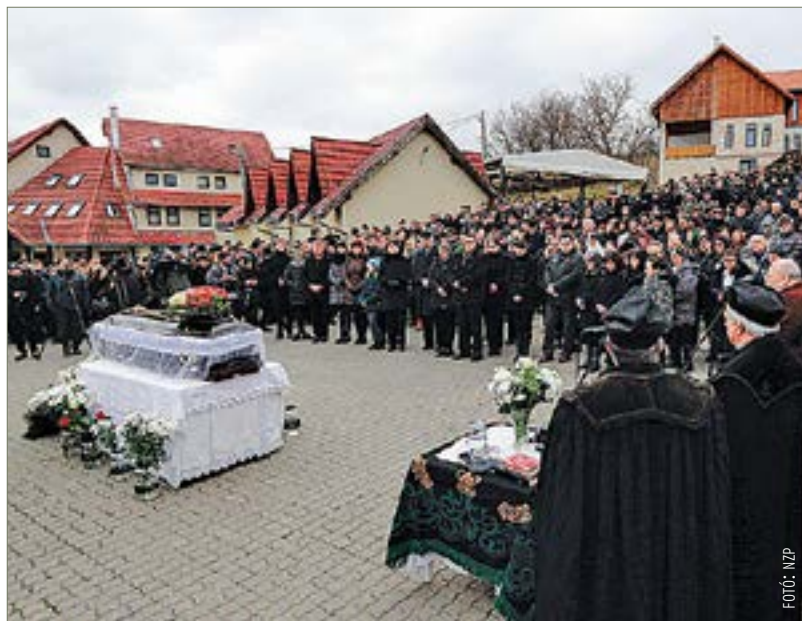
Sírtak a hegedűk Válaszúton