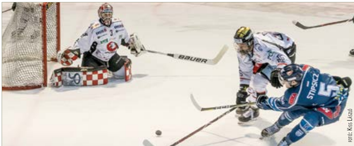
Ez a lehetőség kimaradt – pénteken lehet javítani Znojmban!