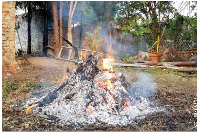
Avarégetés helyett inkább komposztáljunk!

Szuhi Attila, a legszennyezés.hu szakértője lapunknak elmondta, hogy Fehérvár levegőminősége országos viszonylatban nem kirívóan rossz: „Amikor Fehérváron rossz minőségű a levegő, akkor országosan is az. Ugyanis alapvetően nem a kibocsátás határozza meg a légszennyezettséget, hanem a meteorológiai viszonyok. Normál esetben a nap süti a talajfelszínt, ami felmelegíti a fölötté lévő légrétegeket. A meleg levegő könnyebb lesz, mint a környezete, ezért felfelé száll. Az őszi-téli időszakban viszont előfordul, hogy délről meleg levegő áramlik akár ezeröttszáz-kétezer méter magasan a Kárpát-medencébe. A talaj közelében az esti, éjszakai órákban megkezdődik a lehűlés. A felszín