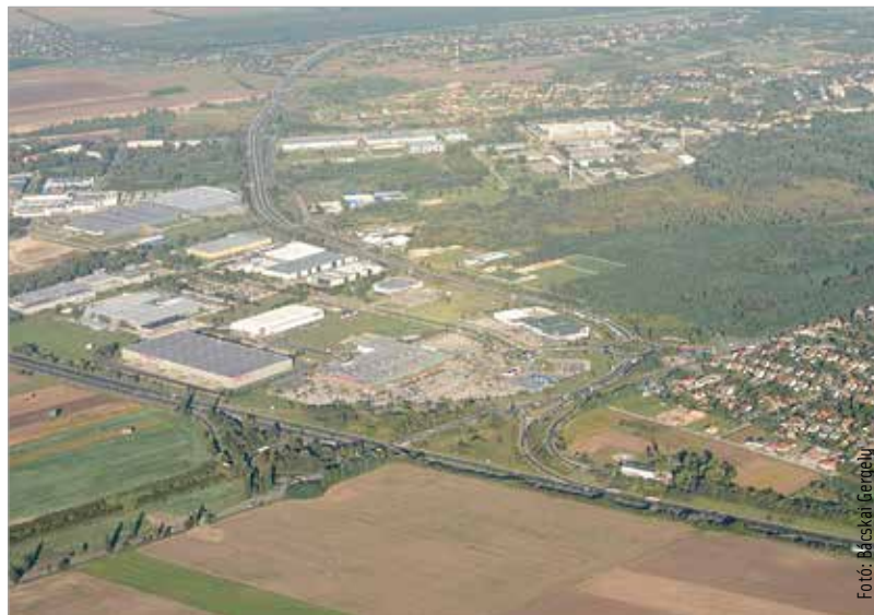
A kiírás tartalmazza az új autópálya-csomópont tervezését is

„Nagyon örülünk, hogy egy olyan, konkrétumokat tartalmazó fejlesztési és tervezési csomag került kiírásra, mely Székesfehérvár és környéke számára választ ad a legfontosabb közlekedési kérdésekre. Fontos a közlekedés biztonságának megteremtése, amely egyrészt a kis kapacitású, balesetveszélyes csomópontok bővítését jelenti, másrészt a tervek megvalósulásával korszerű, négy-sávós út köti majd össze az M1-M7-M6-os utakat, amiktől a balesetek számának csökkenését várjuk. Környezetvédelmi szempontból is előrelépést teszünk, és az új szakaszok jelentős mértékben tehermentesítik majd a város belső úthálózatát is az átmenő forgalomtól. A beruházás a Dunántúli két fontos erőközpontját,