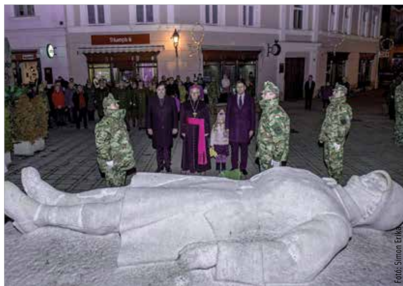
Százegy évvel ezelőtt ért véget az első világháború