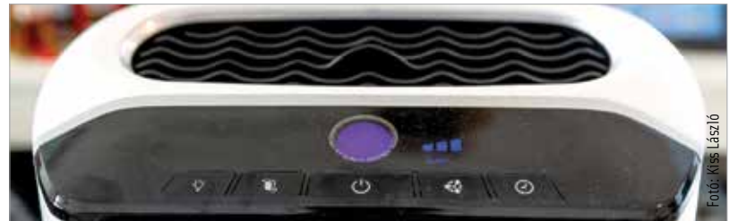
Ma már kaphatók olyan berendezések, amelyek segítenek tisztán tartani a levegőt. Ez főleg télen ajánlott, amikor kevesebbet szellőztetünk.