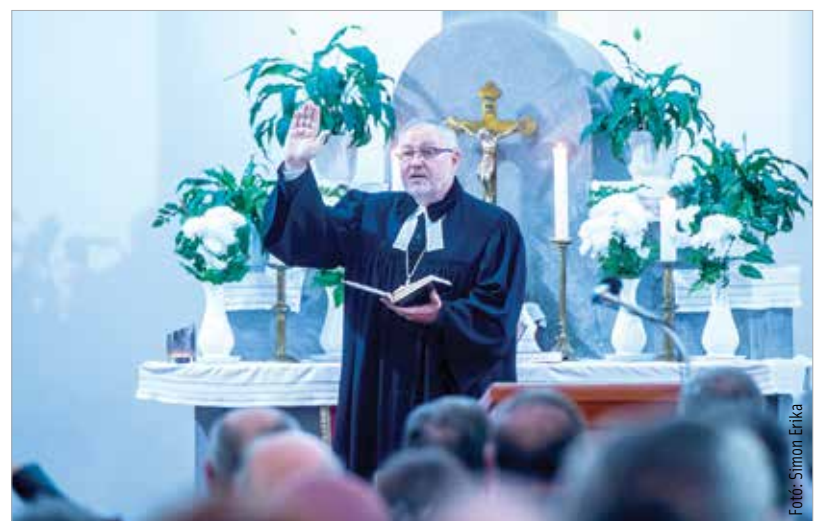
Szemerei János püspök megáldotta az orgonát

reformáció emlékévében felállított bizottság munkájáért, mellyel emlékezetessé tették a program-sorozatot. Szemerei János, a Nyugati Egyházkerület püspöke a kettős ünnepen az egyházi zenével összefonódott hangszer közösségben betöltött szerepéért, a reformációban kapott, az embert felemelő teológiai igazságért mondott köszönetet. Luther gondolatai alapján a zenéről, mint Isten adományáról beszélt, mely felvidítja az embereket, örömet, boldogságot hoz, hiszen a szakrális zene remekműveit megszólaltató hangszer olyan kincs, ami az egyházi zene kíséretén túl erősíti a közösséget is.