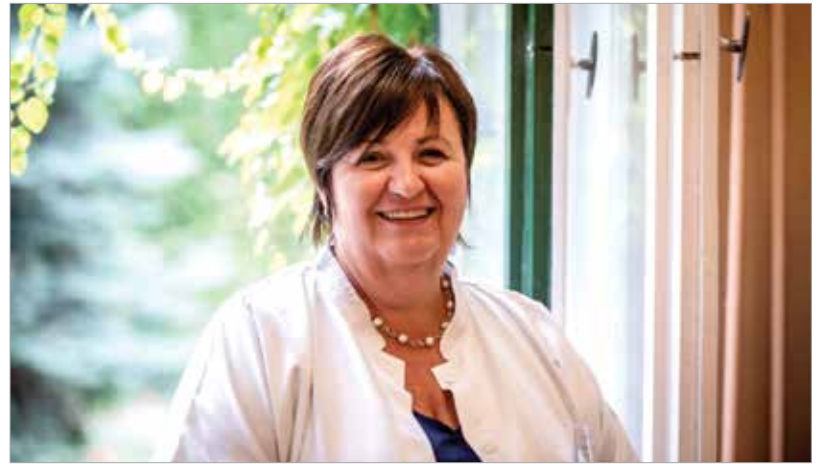
Szülészneként kezdte a pályáját

Igen, a mai napig barátom az egykor a szülészeten dolgozó kollégám, akiből később főnővér lett és én voltam a helyettese. Családi barátság maradt, azóta is minden