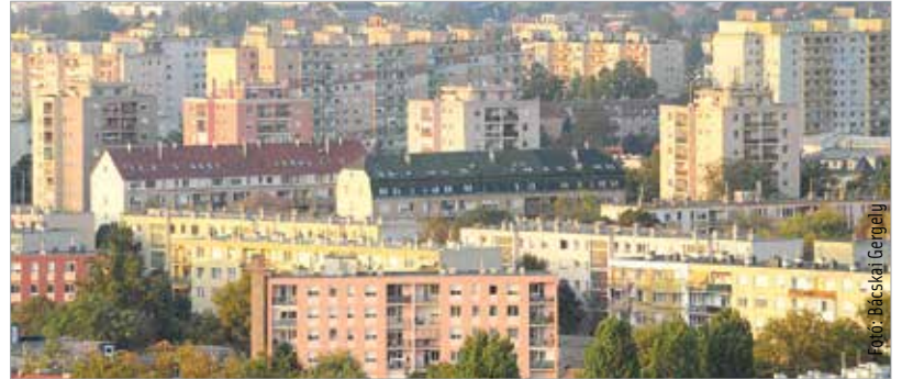
Fehérváron kis mértékben, fokozatosan csökkennek a használt lakások árai

öt százalékra. Ez négy évre szól, és annak érdekében vezették be, hogy meginduljanak a lakásépítések. A négy év lejárt, így 2020. január elsejétől az áfa ismét huszonhét százalékos lesz.