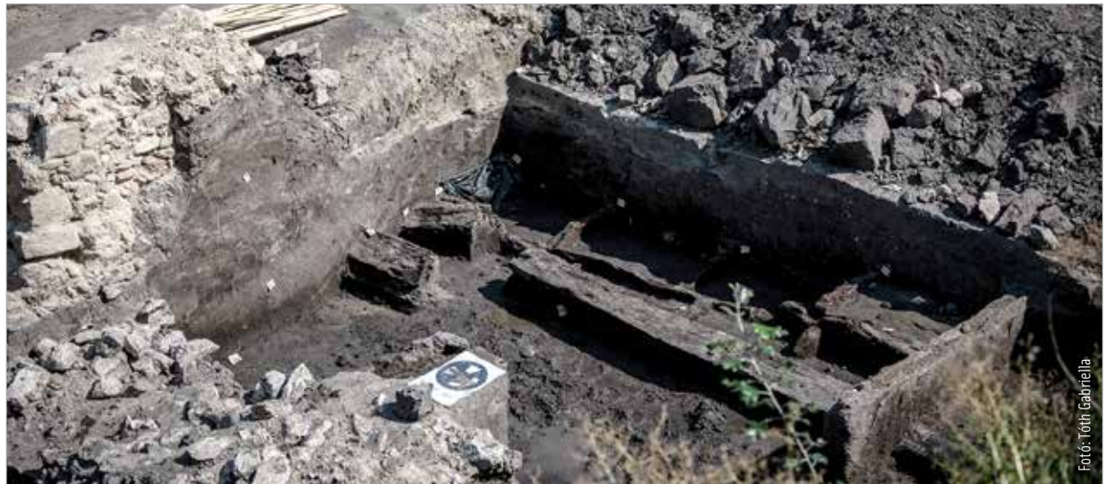
A városfal alapozásához használt fagerendák a Jókai utca 14. szám alatt kerültek elő

„670 és 863 között kalibrált naptári kor” – többek között ez az adat is szerepel azon a vizsgálati dokumentumon, ami most érkezett meg a Szent István Király Múzeumba. A Jókai utca 14. szám alatt zajló ásátás során a városfal alapozásához használt fagerendákból vettek mintát a régészek és küldték el C14-izotópos kormeghatározásra. „A 670 és 863 közötti időintervallumban nőtt az a faévgyűrű, amiből kismetszték a mintát. Ehhez még hozzá kell adnunk valamennyit – ez a most következő sziszifuszi kutatómunka eredménye lesz – hogy pontos adataink legyenek. Az biztos, már első ránézésre látszik, hogy ki fogja adni a 11. századi eredményt!” – tájékoztatott Szücsi Frigyes konzulens régész. A bevizsgált minták a próbafeltárás helyszínéről származnak. A Jókai utca 14. szám alatt az idei évben, a