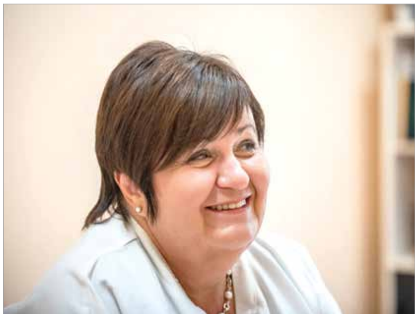
Mindig derűs és energikus

Eleinte tanulás közben nézelődtem, aztán örömmel vállaltam kisebb részfeladatokat, amiket az idősebb