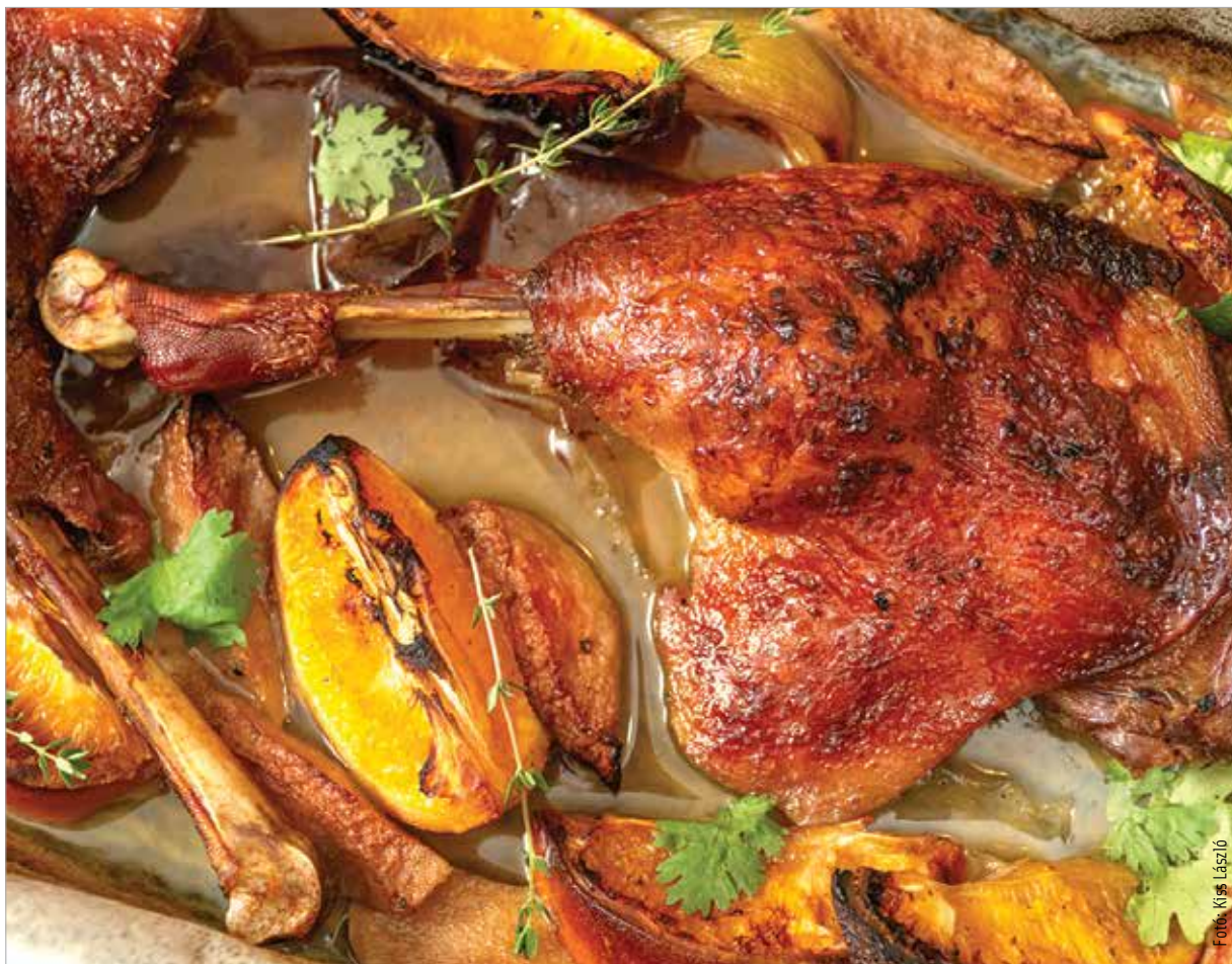
Kívül ropogós, belül szaftos

A lilakáposztát durvára összevágjuk. Egy wokba vagy más