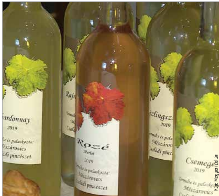
A bírálók számtalan kiváló nedű közül választhatnak

Kiváló esztendőt zártak a borászok Székesfehérváron is, amiről a Noé-hegyi Szent István Borlovagrend Szent Márton-napi újbortünnepén, november 12-én a szakmai zsűri is megbizonyosodhat az idei kínálat mustráján. A borlovagrend Óreghegyi Községi Házban rendezett megmérettetésén a szőlősgazdák szakértő figyelemmel bírálják el az eddig a pincékben pihenő új bort. A hagyományokhoz hűen idén is fehér-, rozé- és vörösborok mérkőzhetnek a Szent Márton bora címért. A kihívás nagy, hiszen az idei esztendő időjárása lehetővé tette, hogy a szőlőtulajdonosok megvalósíthassák álmaikat, és kiváló minőségű borok kerülhettek a pincékbe.