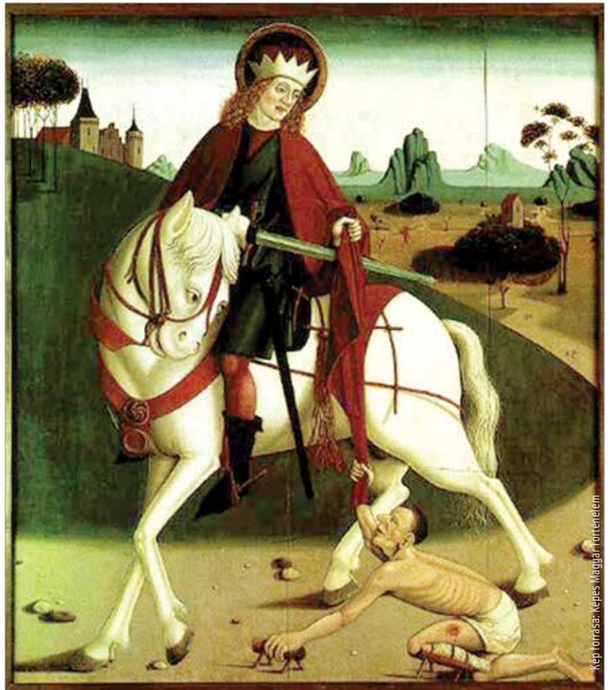
Szent Márton már katonakorában is önzetlen volt

ra. A császár személyesen buzdította harcra a katonáit és mesés ajándékokat ígért nekik, ha becsülettel helytállnak. Márton szembeszállt az uralkodóval, és azt mondta neki: „Krisztus katonája vagyok, nem szabad harcolnom!” Az uralkodó gyávasággal vádolta meg, amire Márton úgy válaszolt: másnap fegyverek nélkül vonul a csatába. Végül a csata elmaradt, mert a frank törzsfő hirtelen úgy döntött, békét kér. Márton ezután kilépett a seregből és egy gall vándorút után visszatért szülei birtokára. Édesanyját megkeresztelte, de apja nem engedte, pogány maradt. Később visszatért Galliába és az ottani falvak lakóit térítette át a keresztény hitre. 361-ben Ligugében megalapította az első európai szerzeteskolostort. Márton népszerűsége folyamatosan nőtt, ezért 371-ben Tours püspökévé választották. A tisztséget nem akarta elfogadni, ezért elbújt egy libaólban. A ludak azonban elkezdtek gágogni, így kénytelen volt elfogadni a püspöki széket.