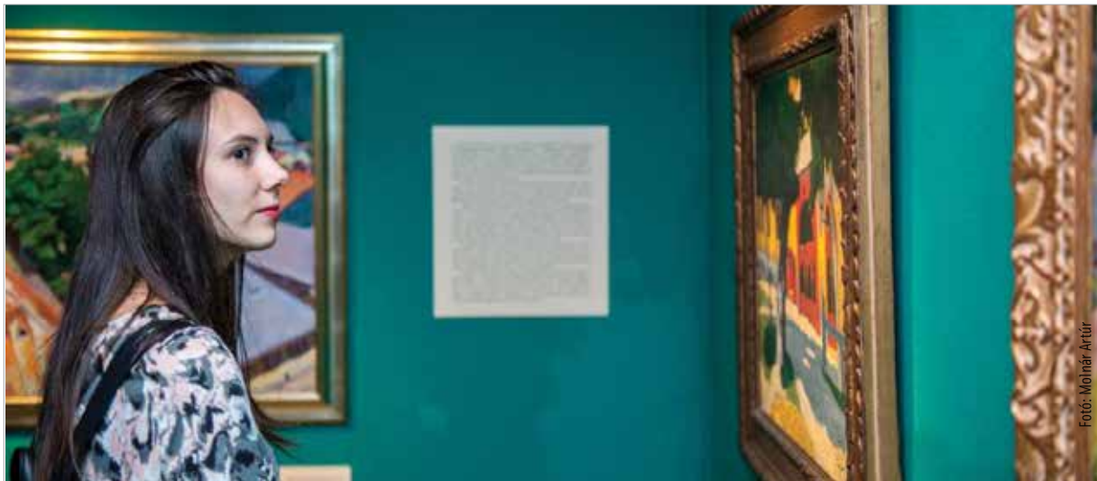
A kiállítás Ziffer Sándor festőművész mintegy hatvan alkotását mutatja be