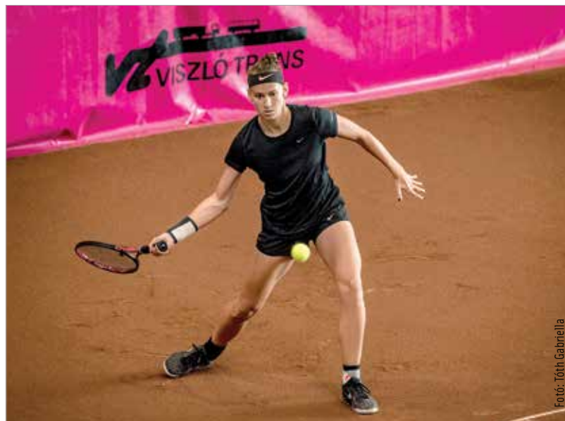
A következő időszak igazi csemege a tenisz szerelmeseinek Fehérváron