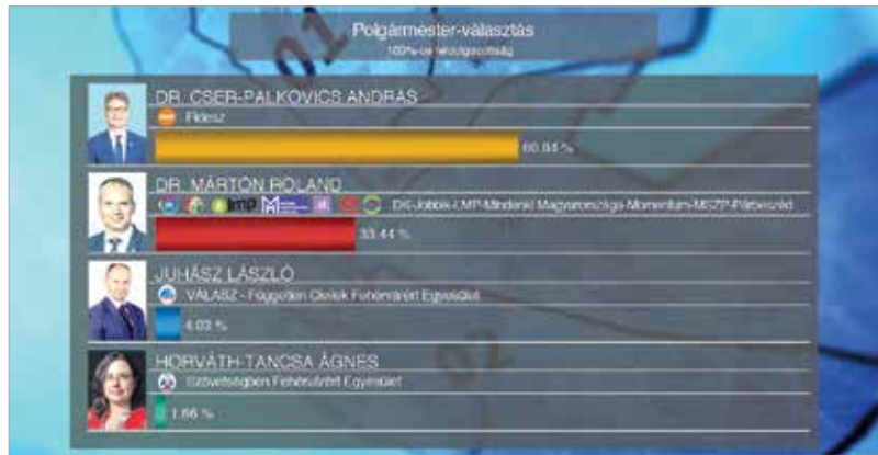
A polgármester-választás végeredménye

A fehérvári ellenzéki összefogás polgármesterjelöltje a szavazatok 33,44 százalékát kapta Cser-Palkovics András több mint hatvan százalékával szemben. A Márton testvéreknek ez volt a harmadik kísérlete a polgármesteri cím elnyerésére: 2010-ben Márton Zoltán, 2014-ben és 2019-ben Márton Roland végzett a második helyen.