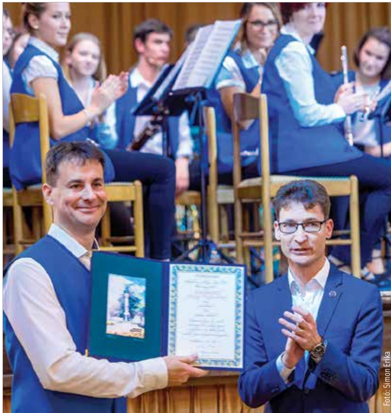
Három évtized a fúvós zene szolgálatában

Talán ez a legsarkalatosabb kérdése az egész együttlétünknek, hiszen amellet, hogy nagyon szeretünk zenélni, ez egy közös-