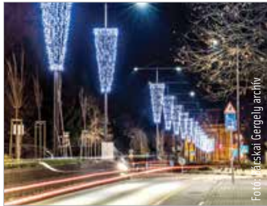
A munkálatok idején forgalomkorlátozásra kell számítani

Október 15. és 19. között illetve október 21-én 23 óra és másnap reggel 4 óra között a Vár körút és a Rákóczi út találkozásánál lévő körforgalom valamint a Szekfű Gyula utca között le lesz zárva az út Brunsvyck óvoda felőli útpályája. Október 21-én az Oskola utca egyes pontjain lesz minimális forgalomkorlátozás.