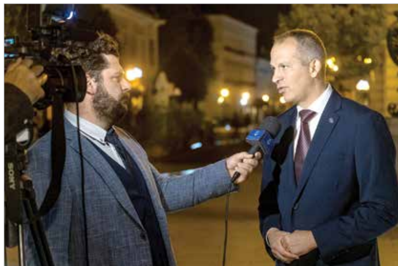
Márton Roland szerint a helyi médiában nem jut szóhoz az ellenzék

polgármestere marad a városnak, ám abban bízott, hogy a kompenzációs listáról lehet esélye képviselőként tovább folytatni a munkát.