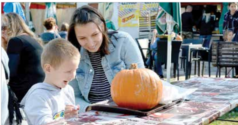
Sok vidám pillanatban lehetett része a családoknak

Tökös finomságok, töklámpásfaragás és tökregatta is várta az érdeklődőket a Velencei-tó partján, az első Velencei-tavi Tökreszálláson. A legnagyobb látványosságot persze az óriási tökökből faragott csónakban evező versenyzők jelentették.