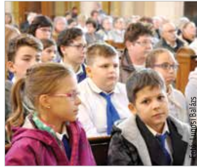
Megtelt a Prohászka-templom, a felnőttek mellett diákok is részt vettek a megemlékezésen

Mózessy Gergely Prohászka katolikus nagygyűléseken elmondott beszédeit elemezte előadásában, melyeket 1900-tól rendeztek. Céljuk a katolikus öntudat megerősítése volt, de arra is jó alkalmat adtak, hogy tematizálják a közéletet. Prohászka Ottokár életében tizenhét ilyen nagygyűlés volt, ezek közül tizenhat alkalommal vezérszónokként lépett fel. Mózessy Gergely elmondta: Prohászka mindig aktivitásra szólította fel a híveket, arra, hogy vissza kell állítani a társadalom etikáját szociális értelemben is, hiszen határozottan kiállt a munkások jogai mellett. A történész előadása után Spányi Antal megyés püspök celebrált ünnepi szentmisét: „A keresztény ember keresztény természeténél fogva