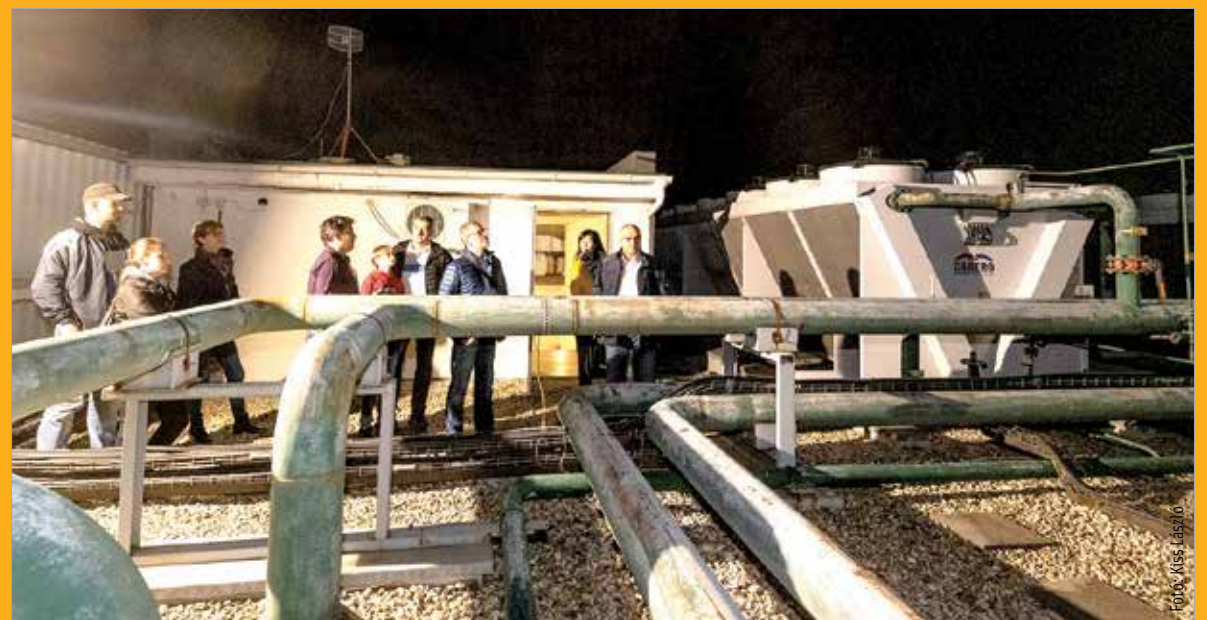
Az éjszakai látogatók kulisszatitkokat is megtudhattak a szakemberektől

Az 1902-ben létesült Király sori erőműben a múlt századi kapcsolt hő- és villamosenergia-