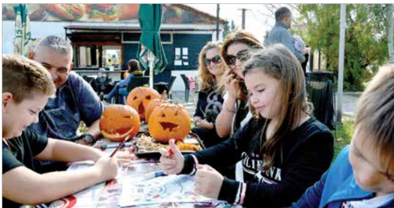
Aki megéhezett a faragásban, tökös ételeket ehetett a strand büféjében: lángost, burgert és fasírtot is készítettek az őszi finomságból