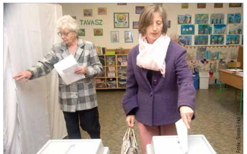
Fehérváron és a megyében a magas részvétel a Fidesz nagyarányú győzelmét eredményezte