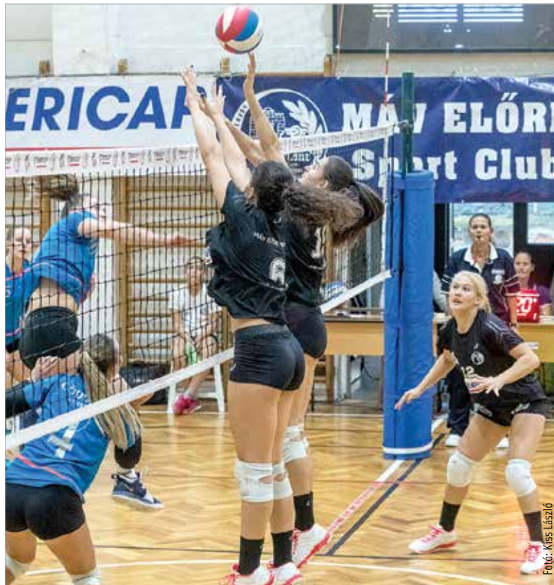
A jó sánccmunka is kellett az első élvonalbeli mérkőzés megnyeréséhez a fehérvári lányoknak