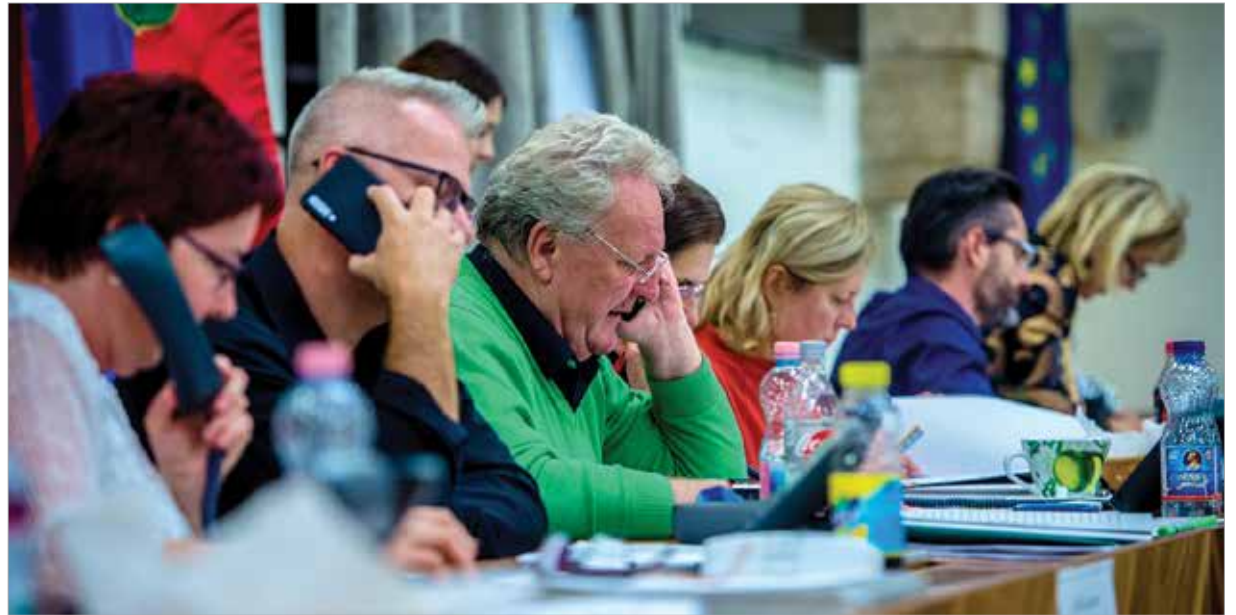
A választások rendben zajlottak, gyorsan ment a szavazatok számlálása