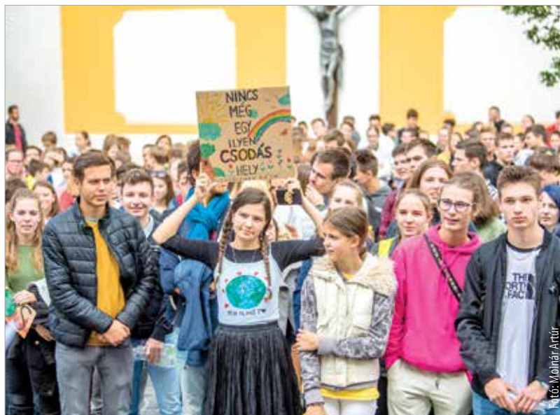
A fiatalok fellépnek saját jövőjük érdekében