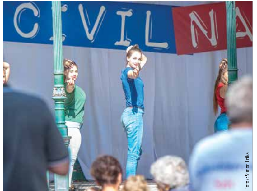
A civilszervezetek bemutatkozása mellett székesfehérvári táncsoportok is tartottak bemutatókat

a rendezvény arra, hogy mindenki kiválassza azt a civilszervezetet, amelyekben szívesen vállalna önkéntes tevékenységet.