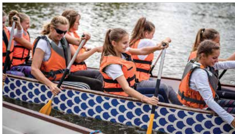
Pénteken a nebulók ragadtak evezőt

Batman, a Tóparti Gimnázium 9.BÉ és a kápolnásnyéki Vörösmarty Mihály Általános Iskola és Gimnázium csapatainak szurkolhattak a nézők. A szombati nap folyamán pedig a felnőttek volt a tó. A sárkányhajósok által méltán kedvelt koronázóvárosi versenyhelyszín most is különleges kihívást jelentett a résztvevő csapatok számára, hiszen a sprintverseny és a kétezer méteres futamok a sok kanyar miatt nagyon látványos küzdelmekre adtak lehetőséget.