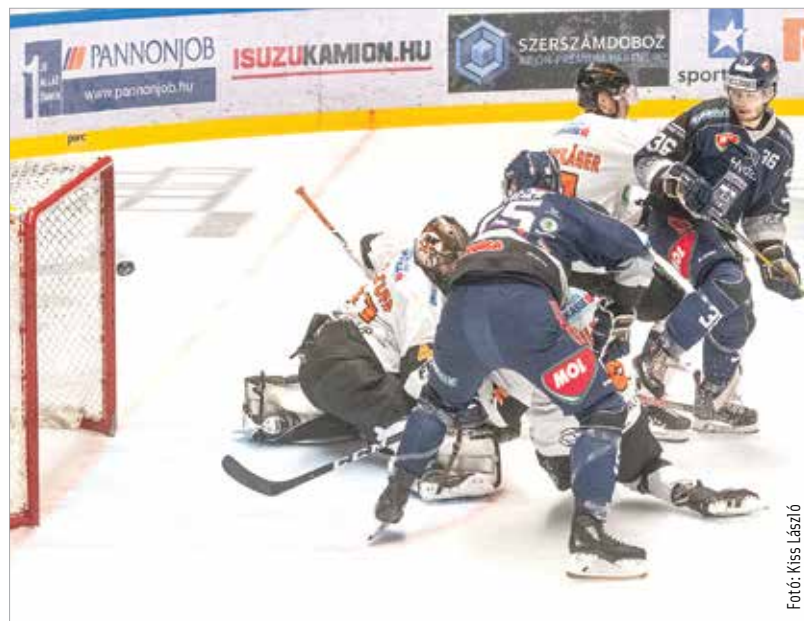
Két góllal nyitott itthon a Volán a Graz ellen, mégis pont nélkül maradt a csapat

ban 4-3-ra kikapott, azaz elvesztette hazai veretlenségét a Volán. Hét meccs, hét pont, hetedik hely – ez a csapat mérlege az EBEL idei kiírásában. Az előző szezonban az alsóházban végző gardák ellen eredményes a szereplés, de az első hatban záró Graz és Klagenfurt ellen egy pontot sem sikerült szerezni. Pénteken a bécsiek várát kellene bevenni. A tavalyi ezüstérmest legutóbb két éve tudta legyőzni a fehérvári garda. Vasárnap pedig a Bécs mögött az ötödik helyen álló Znojmo érkezik a Raktár utcába.