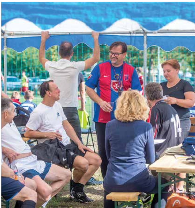
Futballtornát és családi napot szervezett szeptember utolsó vasárnapján az Alapítvány a Székesfehérvári Fogyasztóvédelemért Palotavárosban, a Csapó utcai játszótéren, ahol a kicsik és nagyok egyaránt jól szórakoztak. K. T.