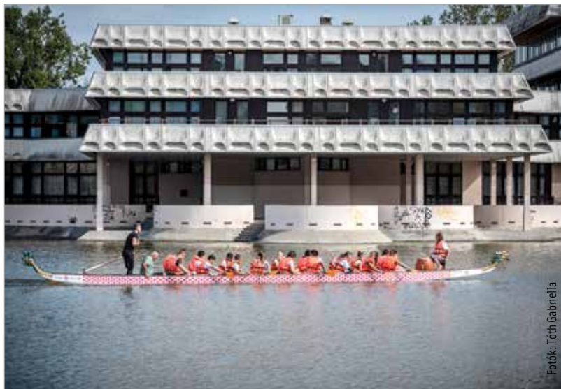
Látványos küzdelmeknek lehettünk szemtanúi