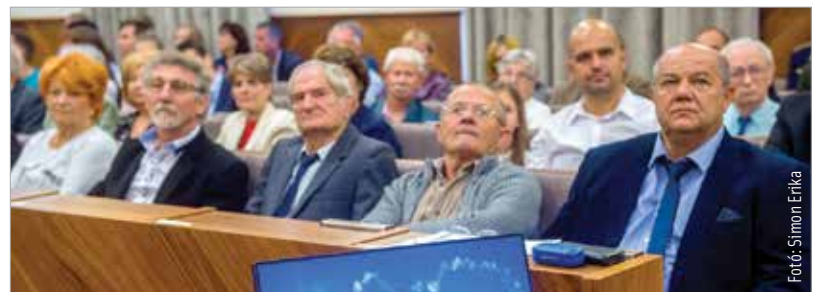
A tíz fővel alakult egyesület mára száznál is több tagot számlál

Szilády Dezső elmondta, hogy az egyesület a megalakulásakor nem örökölt eszközöket, ingatlanvagyon, a semmiből teremtette meg a repülősportok lehetőségét. A tíz fővel alakult egyesület mára száz fővel is több tagot számlál, tagjai között nemzetközi sikereket elért sportolók, világbajnoki bronzérmes és magyar bajnokok is vannak.