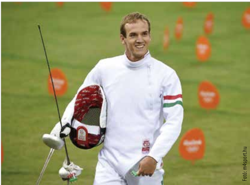
Különösen nagy élmény, ha élőben versenyezhet a fehérvári közönség előtt

A pályafutásomnak már a közepevége felé tartok. Legszívesebben a sport területén maradnék, mert úgy érzem, sokat tudnék segíteni és ez az, ami boldoggá tesz. De nem alapozhatok csak erre, nem olyan sportág ez, aminek elég biztos a jövője. Az öttusa az elmúlt időszakban kicsit megingott az olimpiai programban, volt már róla szó, hogy leveszik. Amíg ez nem történik meg, a sportág létjogosultsága biztosítva van. Ha mégsem alakulnak jól a dolgok, akkor más irányba lépek. Hamarosan befejezem Dunaújvárosban a műszaki menedzser szakot, logisztikai területen is el tudom magam képzelni. Bár nem tanultam, de nagyon érdekel a sportrendezvények szervezése. Sőt a katonaság felé is kacsingatok! De úgy érzem, akár még egy olimpiára is kijuthatok, ha az egészségi állapotom és a lendületem engedi. Még szívesen folytatnám!