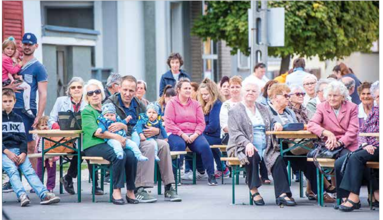
A házatóra összegyűlt Felsőváros apraja-naguja

A régi tárgyakat főként az idősebbek őrzik, a gyerekek már nemigen, a régieknek meg a szívük szakad meg, hiszen a múltjukat, örömeiket, bánataikat, történeteiket, fiatalságukat őrzik ezek a tárgyak. A Kertalja utca 8. tehát nem múzeumnak készült, hanem az élő emlékezetnek, ahová a berendezést, a tárgyakat a helyiek viszik be, és a következő generációnak csupán annyi dolga van, hogy megőrizze, továbbadja a hagy-