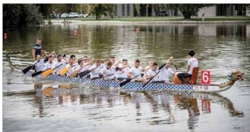
A Csónakázó-tó remek helyszíne