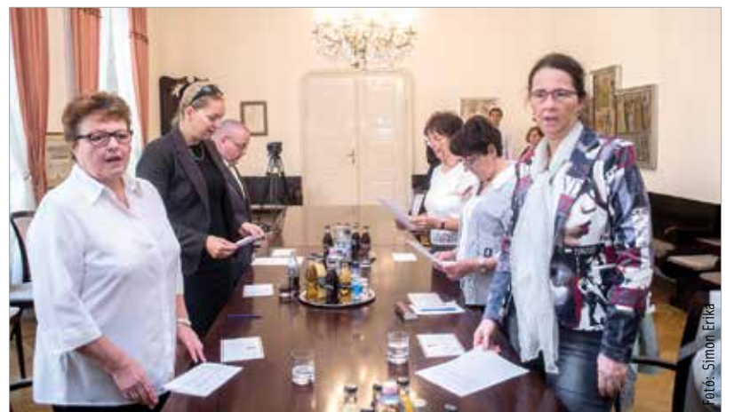
A bírósági ülnökökre az ítélkezés során fontos szerep hárul

A bírósági ülnökökre az ítélkezés során fontos szerep hárul, hiszen a bírókkal egyenértékű jogaik és kötelezettségeik vannak. Az ülnökök, csakúgy, mint a hivatásos bírák, nem lehetnek tagjai pártnak és nem folytathatnak politikai tevékenységet, ugyanakkor az ítélkezéssel összefüggő tevékenységük során mentelmi jog illeti meg őket. Az ítélkezési tevékenységük során joguk van az iratanyagot teljes körűen megismerni, de ezzel kapcsolatban titoktartási kötelezettségük is van.