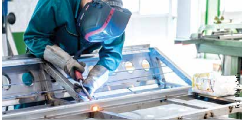
A feldolgozóipar folyamatosan várja a munkaerőt

Bár tizenkét hónap alatt közel hat-ezren helyezkedtek el a feldolgozóiparban – ahova a kulcsfontosságú autógyárak és egyéb, az ágazathoz köthető beszállítók is tartoznak – évek óta itt a legmagasabb az üres álláshelyek száma. Arányait tekintve látható, hogy mennyire magas: 2019 elején 18 640 betöltetlen álláshelyet regisztrált a Központi Statisztikai Hivatal a feldolgozóiparban, míg a második legtöbb dolgozót váró humán-egészségügy és szociális ellátás területén feleannyi, vagyis 9382 betöltetlen álláshely volt országwide. Ám míg az előbbi területen valamelyest csökkent a munkaerőhiány, addig az utóbbin nőtt: egy éve ugyanis 7811-en hiányoztak a pályáról. A KSH adatai alapján csökkent viszont