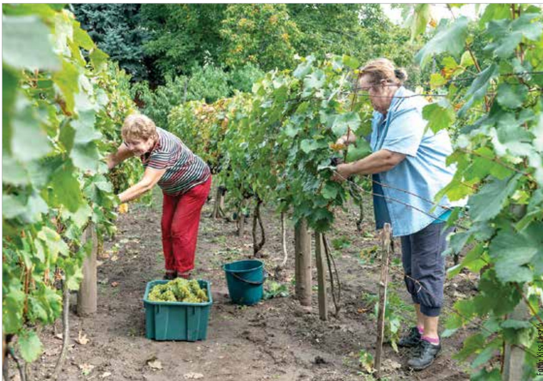
Önkéntes szüretelők az Öreghegyen