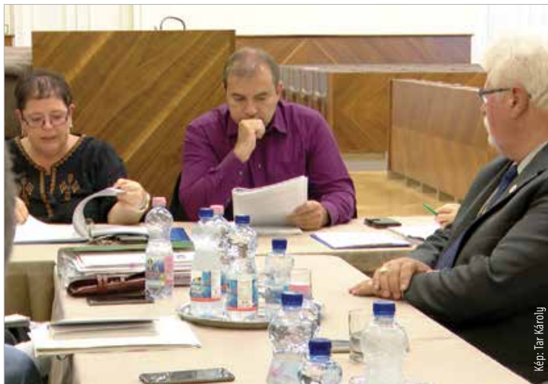
A Helyi Választási Bizottság a benyújtott képviselőjelölti és polgármesterjelölti adatok hitelességét vizsgálta