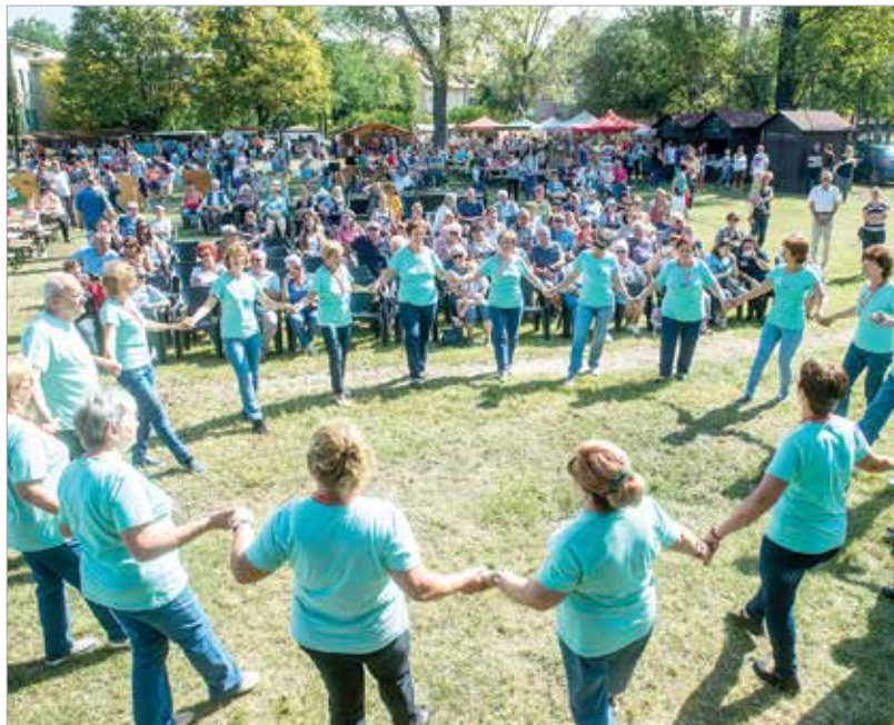
A senior csoport tánca is fokozta a jókedvet