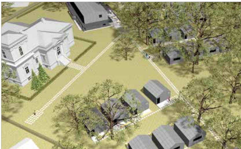
Téliesítik a főépületet, a tizennyolc házban összesen százkét férőhely lesz