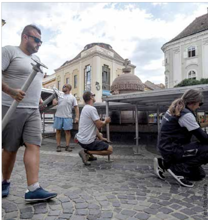
Székesfehérváron egyre bizakodóbbak a munkavállalók

A BNP Paribas Cardif biztosító és a Medián első negyedévet vizsgáló kutatásából az is kiderül, hogy az ország középső részén, vagyis itt, Székesfehérváron is – kicsivel ugyan – de jobban bíznak a munkavállalók. A jelentésben több érdekes adat is olvasható: 91 pontot mértek azzal kapcsolatban, hogy mennyire bíznak a jelenlegi munkahelyük fennmaradásában a munkavállalók. Ez egyértelműen pozitív változást mutat, de sokkal jelentősebb az emelkedése annak, hogy a munkavállalók mennyire érzik biztonságosnak a jelenlegi pozíciójukat. 2018 első negyedévéhez hasonlóan idén is 89, ám az előtte