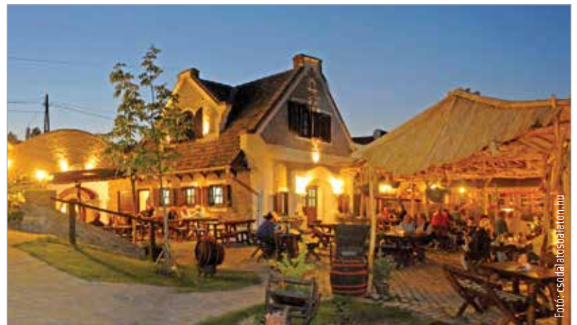
Szüret idején különösen hívogatók a hévízi borospincék