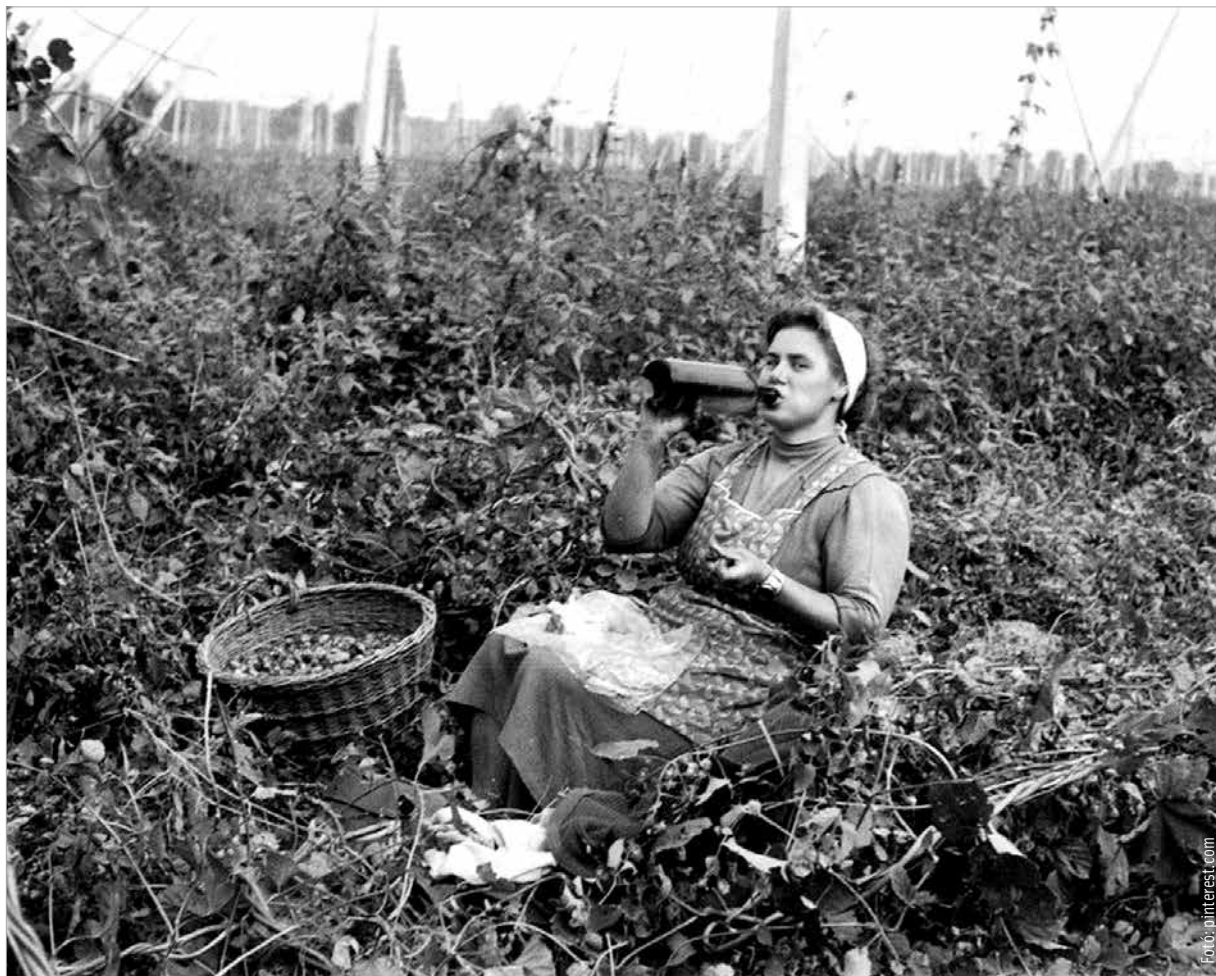
Komlózüret 1962-ben Horvátiklén

Az idők során folyamatosan nemesítették a komlót, új fajtákat hoztak létre, s ez a folyamat a világ összes komlótermő vidékén mind a mai napig tart. Az ember szeret gondoskodni önmagáról.