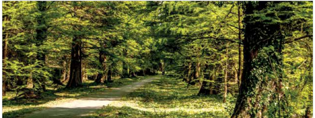
Az erdő megvéd és energiával tölt fel

Ha a Székesfehérvártól mintegy másfél órányira található Hévíz felé vesszük az irányt, az imént felsorolt élmények mindegyikét megtalálhatjuk. Nemcsak a világhírű termálfürdő, hanem a tavat körülvevő természeti környezet is hívogató. A tavat egy úgynevezett védérdő veszi körül, melynek nevéhez hűen védelmi funkciója van: a levegőben terjedő szennyeződésektől és zajtól valamint a szélétől, a kihűléstől is