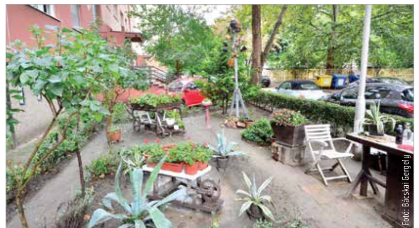
Az erdélyi ihletésű Budai úti panelkert adott otthont a bejelentésnek