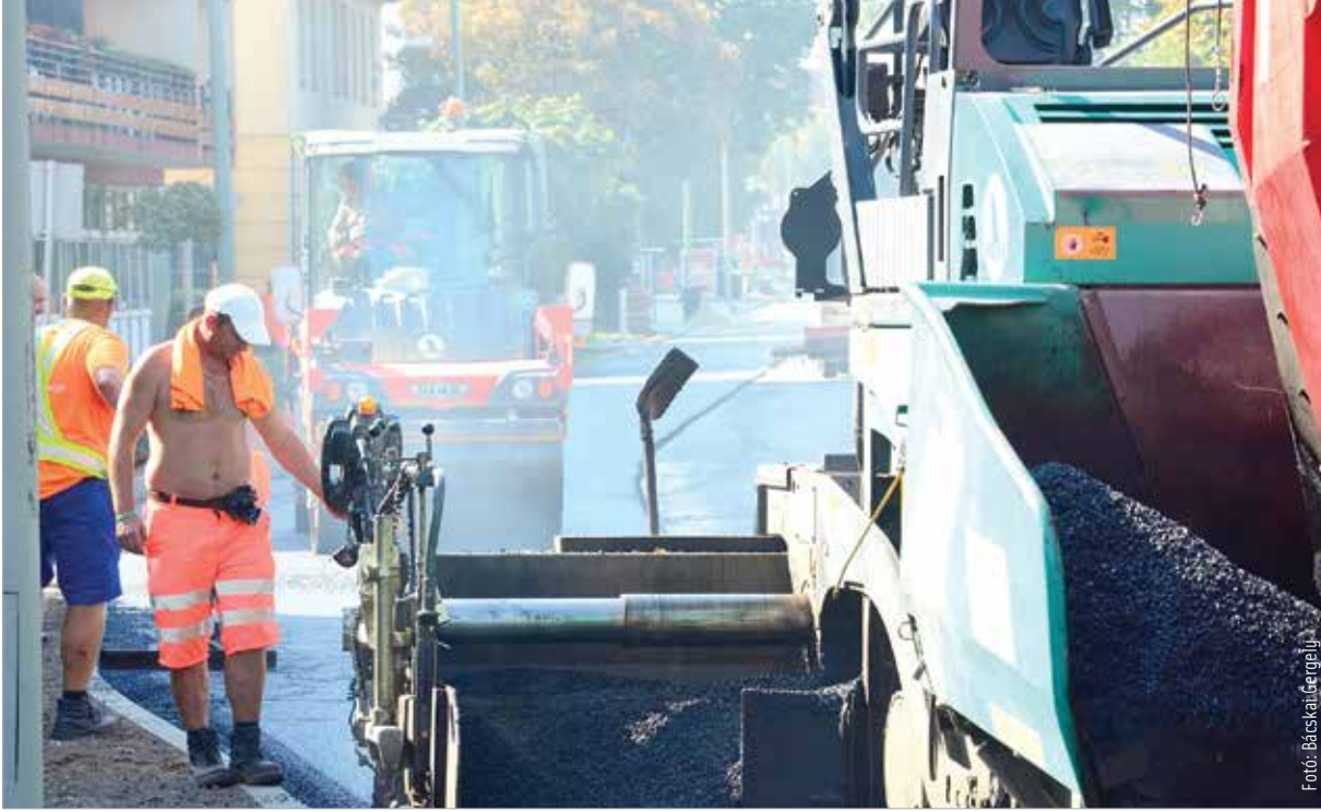
Az álláskeresőknél a férfiak futnak neki magabiztosabban

cég meg fog szűnni, 27 százalékuk pedig úgy gondolja, hogy nincs elég szakember illetve a cég nem találja meg a megfelelő kollégákat. Közel egyharmaduk (29 százalék) azt jósolja, hogy nagy eséllyel leépítés várható, amelynek során tőle is megválnak.