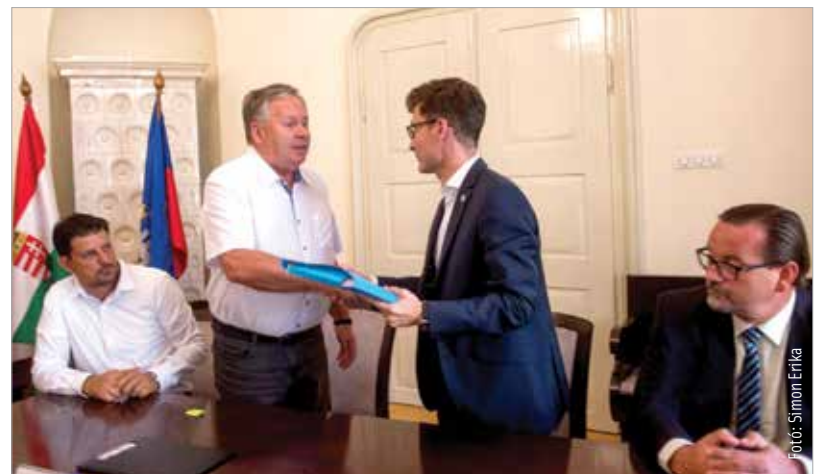
2361-en az infrastruktúra-fejlesztés mellett

támogatását kéri az állami fejlesztések megvalósulásáig. Úgy tűnik, a kérésrel tárt kapukat döngtetett az egyesület. Cser-Palkovics András polgármester a Fehérvár Tv híradójának így nyilatkozott: „Látunk erre forrást, hiszen az abai önkormányzattól már megvásároltunk egy jelentős, a repülőtérhez tartozó területet. Az ehhez kapcsolódó forrást az államtól megkapjuk, ennek egy részéből ezt a fejlesztést vagy annak elindítását lehetne finanszírozni.” Egy-két éven belül akár el is készülhetnek a beruházással a reptéren, aminek becsült értéke 200-300 millió forint lenne. A fejlesztés később részévé válhat a Modern Városok Programjába foglalt 14 milliárdos beruházásnak is.