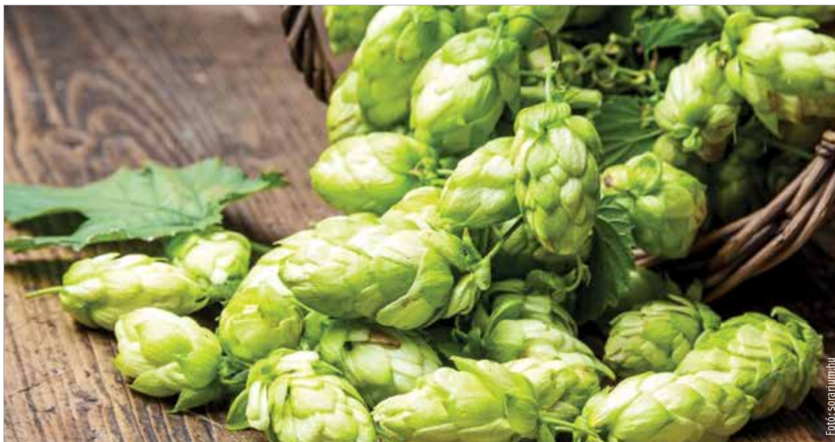
A komlót nem csak inni, de nézni is megnyugtató

A Humulus lupulus , azaz a komló a kenderfélék családjába tartozó évelő, zöld, toboz alakú virágokat hozó kétlaki kúszónövény. A komlónövény nagyon