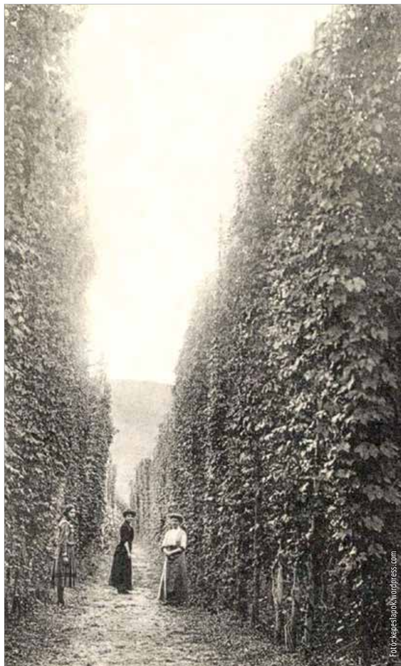
Komlókert 1908-ban Székelykeresztúron

fényigényes, a sok nedvességet, a mély talajt és a szelek ellen védett helyeket szereti. Az európai fajok négy-hét méter magasra nőnek. Söripari célra a meg nem termékenyített nőivarú virágzatát, tobozát használják, aminek a felépítése a következő: a szárból növő toboznyél folytatása az orsó. Az orsó ágacskaín helyezkednek el a toboz- és murvalevelek. A tobozlevelek feladata a virág védelme, a murvalevelek alsó végénél találhatók a magkezdemények és a lupulinszemcsék. Ezek a sárga szemcsék tartalmazzák a sörfőzés alapanyagait, a keserűanyagokat, az olajokat és a cseranyagokat. A komlótohoz tartalmaz még vizet, fehérjét, monoszacharidokat, cellulózt, lignint, lipideket, viaszt, hamut és aminosavakat. A komló keserűanyagai a sör keserűségét adják. Kétfélet különböztetünk meg: a keserűsavakat és a gyantákat. A keserűsavak két nagy csoportja: az \alpha -savak, azaz humulonok és a \beta -savak, azaz lupulonok. A gyanták lehetnek lágy és kemény gyanták. Az illékony komlóolajok a sör aromáját biztosítják. Nyugtató és gyökfogó hatásuk van, s a komló legaktívabb aroma-komponenseiként a kellemes illatokat kölcsönzik a sörnek. A muskátliszerű illatot a mircénnek, az édes, virágos, citrusos illatot a linalolnak, a balzsamos illatot az \alpha -humulénnek, a vaníliaillatot a vanillinnek, az édes, mézes illatot a transz-fahéjaldehidnek és a fenilacetátsavnak köszönhetjük.