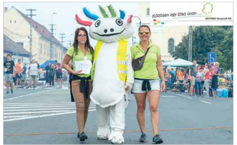
Gyűjti és csapata a Lecsófőző Vigasságon is jelen lesz

tájékoztatóval, mely leírja, hogy mi az, amit a sárga zsákba lehet helyezni. A Depónia kabalája, Gyűjti napközben többször is körbejár a rendezvényen és megnézi, melyik csapat miként gyűjt. Az a csapat, amelyik jól végzi a szelektálást, „Ön jól Gyűjti!” matricát kap. A látogatás alkalmával a résztvevők beszélgethetnek, feltehetik kérdéseiket a szelektív gyűjtésről, Gyűjti és csapata szívesen válaszol.