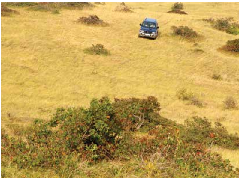
Jól teljesített az eddigi teszteken az autó, már csak néhány apróbb módosítást terveznek

A Budapest–Bamako a kezdetek óta jótékonyági célt is szolgál, minden csapat adományokkal felszerelve érkezik. Erre is készülnek a fehérváriak, hiszen szeretnének részesei lenni a karitatív eseménynek.