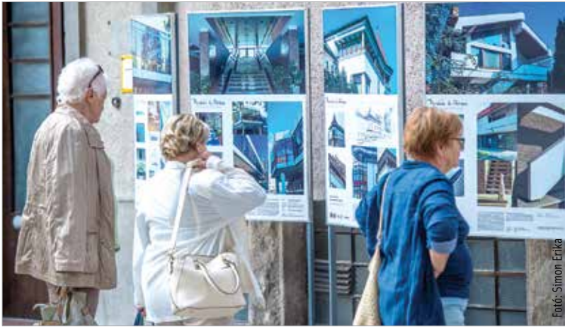
A Pordán Horváth Ferenc által tervezett épületek kiállták az idők próbáját

kenységét: „Pordán Horváth Ferencre érdemes emlékezni, mert nagyon szerezni ember volt, és egy kicsit az utókor emlékezete is szerény. Ezt szeretnénk áttörni! Talán a legfontosabb, amit építészetéről mondhatunk, hogy azok az épületek, amelyek jellemzőek rá, amelyekről köztudott, hogy ő tervezte – akár a Brunszvik óvoda, akár a Béke téri iskola bővítménye – bármennyire is hihetetlen, hatvanéves épületek! Hatvan évvel ezelőtt felépíteni valamit úgy, hogy ezek két emberöltőnyi idő után is modernnek, frissnek, örökérvényűnek hassanak, a tehetség és a jó ízlés mértékadó, tanulságos példája a ma építészeti számára is.”