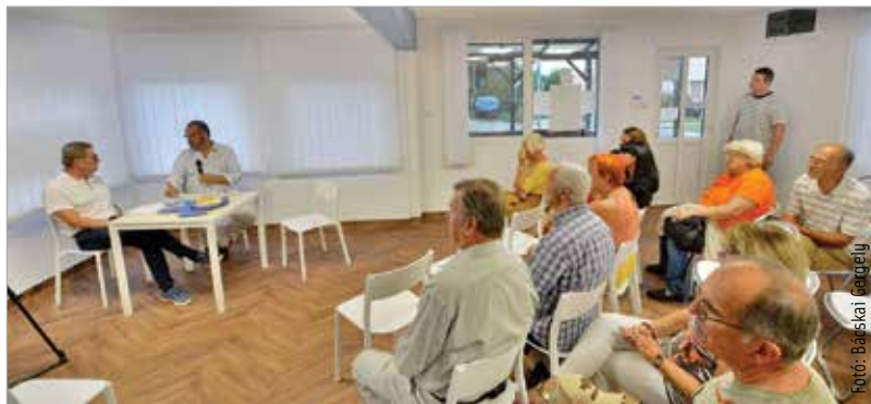
Az új közösségi tér az önkormányzat saját forrásából valósulhatott meg

saját forrásból valósította meg. Az ingatlant a Szabadművelődés Háza üzemelteti és gondoskodik a lakosság részére szabadidős programok, kulturális rendezvények szervezéséről. Az első rendezvényen Kégl György életével és munkásságával ismerkedhettek meg az érdeklődők: Vakler Lajos, a Fehérvár Média centrum szerkesztő-riportere beszélgetett a festőművésszel. Kégl György igazi világpolgár, hiszen Párizsban született, Londonban járt iskolába, de élt Ausztriában és Németországban is. Grafikai képzettséget Düsseldorfban szerzett, otthona Magyarország. A festőművész az arisztokrata Kégl család leszármazottja, akiknek Székesfehérvár városa is sokat köszönhet. Úkapja, Kégl György Fejér vármegyében jelentős közéleti szerepet játszott, alapítványt hozott létre, így épülhetett meg a Szent György Közkórház. Az 1878-ban Csalapusztán építettett kastélyuk még ma is áll.