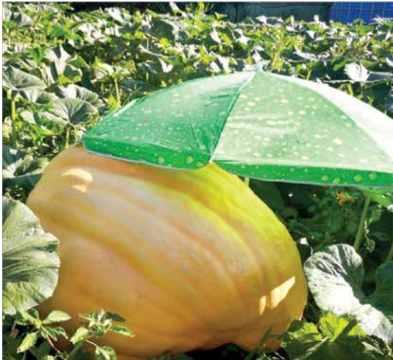
Panka és napernyője

világ legjobb óriásnövény-termesztői között tartásuk számon. Utóbbira szerinte néhány éven belül esélye is lehet: „Az elmúlt években leginkább tapasztalatot gyűjtöttem, de legkésőbb két év múlva már ötszáz kilós vagy nagyobb tököt szeretnék növesztetni. Ezzel felkerülnék végre a világranglistára is!”