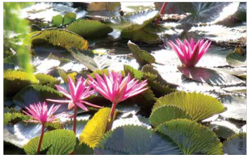
Több mint kétszáz éve pompáznak a tündérrózsák a tavon

óvja a tavat. Az erdő telepítése I. Festetics Györgynek köszönhető, ő csapoltatta le a tavat körülvevő mocsarat és lehelte életet az első erdősávba. Ma már több mint kétszáz éves platánokban gyönyörködhetnek az erre járók, és számos más őshonos faj mellett olyan különlegességekben, mint a mocsári ciprusok. A 2010-ben átadott Berkli tanösvényt bejárva megismerhetjük a tavat, az azt körülvevő láprétet, a berek növény és állatvilágát.