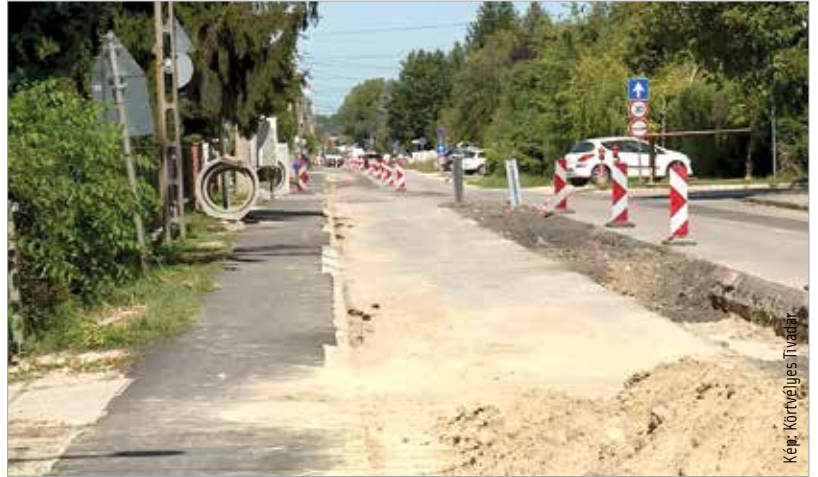
Sávlezárás a Fiskális úton: megéri türelmesnek lenni, hiszen korszerűbb lesz az út és kerékpársávot is kialakítanak