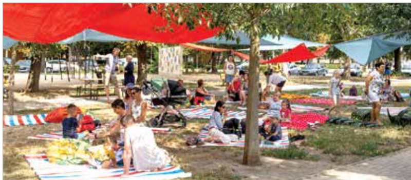
A Széna téri fák árnyékát kendőkkel egészítették ki

Fesztelen köztéri partit tartottak a Széna téren. Az első Pokrócpikniken minden korosztály megtalálhatta a megfelelő kikapcsolódást: a családi eseményen volt lehetőség sportolni, énekelni, táncolni, kézműveskedni és persze piknikezni is.