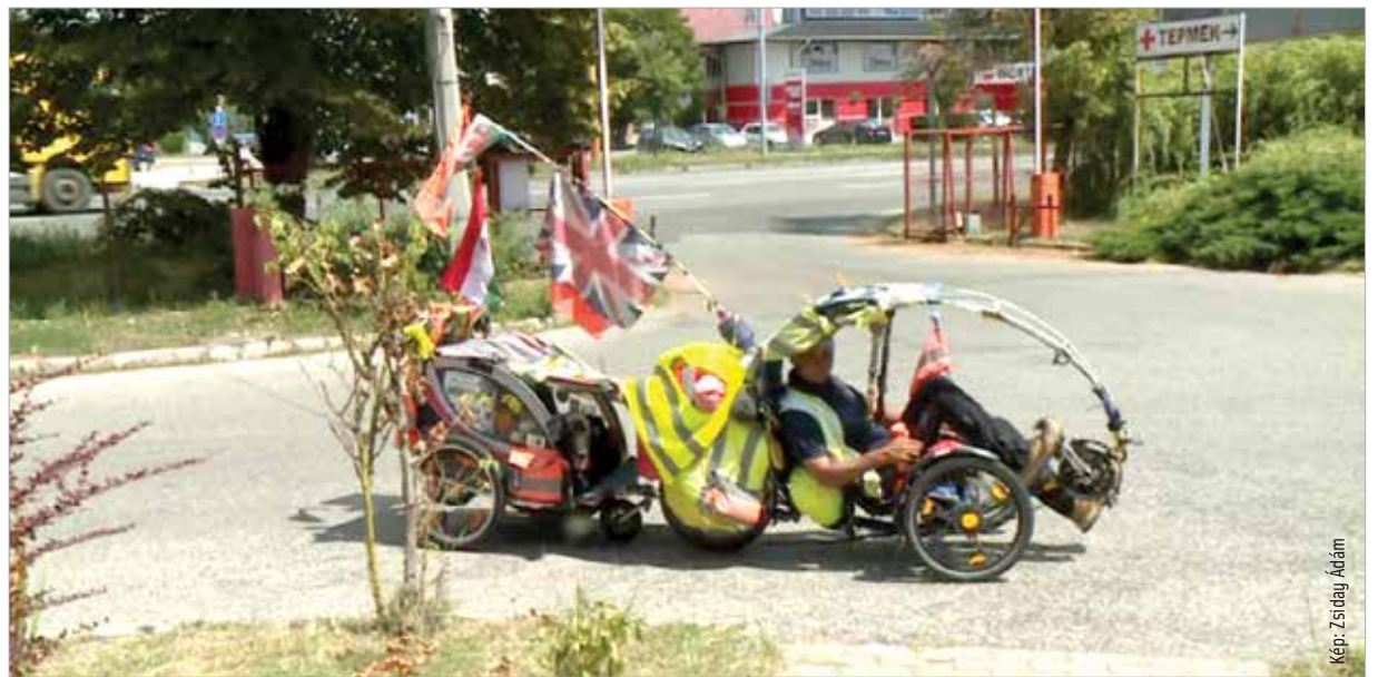
Starsky és Hutch Fehérváron