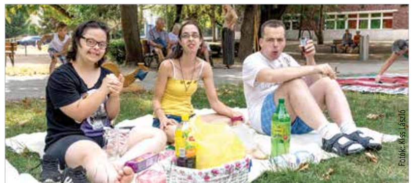
Nincsen piknik kosár nélkül, nincsen kosár finomságok nélkül

Munkaközösségünkbe nevelési elvekben érett, lelkes óvodapedagógust keresünk, teljes munkaidőben, 2019. szeptember 01-i kezdéssel.