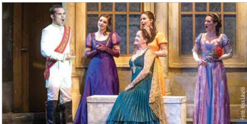
A klasszikus, komolyabb darabok is helyet kaptak a nyári gálaműsorban