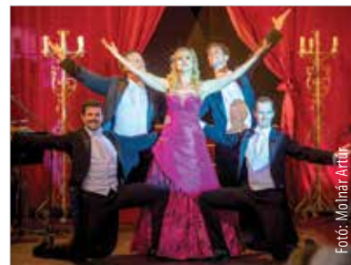
Primadonnák, bonvivánok, szubrettek – jövő-re is visszatérő karakterek lesznek