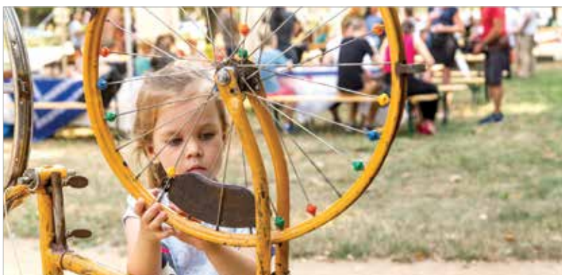
Különleges ügyességi játékokat próbálhattak ki a gyerekek