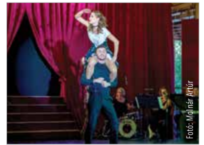
Látványos, szórakoztató, virtuóz – ezek a jelzők illettek leginkább a hétvégi operettgálára