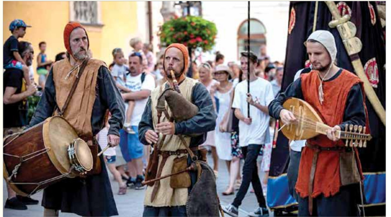
A Sub Rosa együttes Fehérvár belvárosában

Velem kezdődött, mert a középkori, azon belül kimondottan a 13. századi zene szerelmese vagyok. Régen egy szomszédom angol népzenei lemezein bukkantam rá néhány középkori dallamra, aztán amikor Angliában éltem, még jobban beleástam magam. Alapvetően tehát nem magyar hagyományörzéssel foglalkozunk. Magyarországon ebből a korból nem maradt fenn túl sok