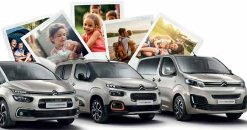
CITROËN GRAND C4 SPACETOURER