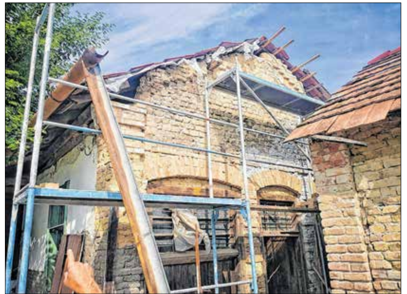
Még maradt bőven munka kint és bent is

És bár az elmúlt két évben tényleg óriási előrelépést tett a kőműves mester, azért rengeteg munka vár még rá, míg a Say család egykori nyaralója régi fényében tündökölhet.