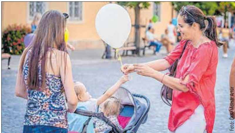
Egész napos rendezvénysorozattal készült a Népesedési Világnapra a Magyar Városkutató Intézet, a Prosperis Alba Kutatóközpont, a Kodolányi János Egyetem, a Titkok Háza Tudományos Élményközpont és a Székesfehérvári Család és KarrierPont. Délelőtti módszertörzével és vitafórummal, délután családi nappal és civil korzóval várták az érdeklődőket. G.P.