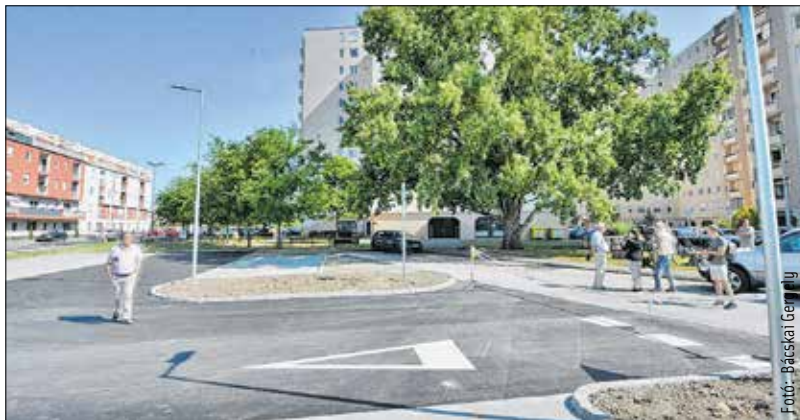
A Cserepes köz 2. szám mellett tizenhét új parkolóhely létesült az elmúlt hetekben, mellette pedig egy fasort is telepítettek ősszel