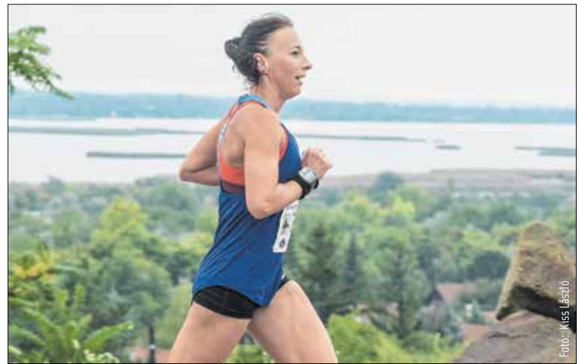
Látnivaló is lesz bőven a Bence-hegyi futáson