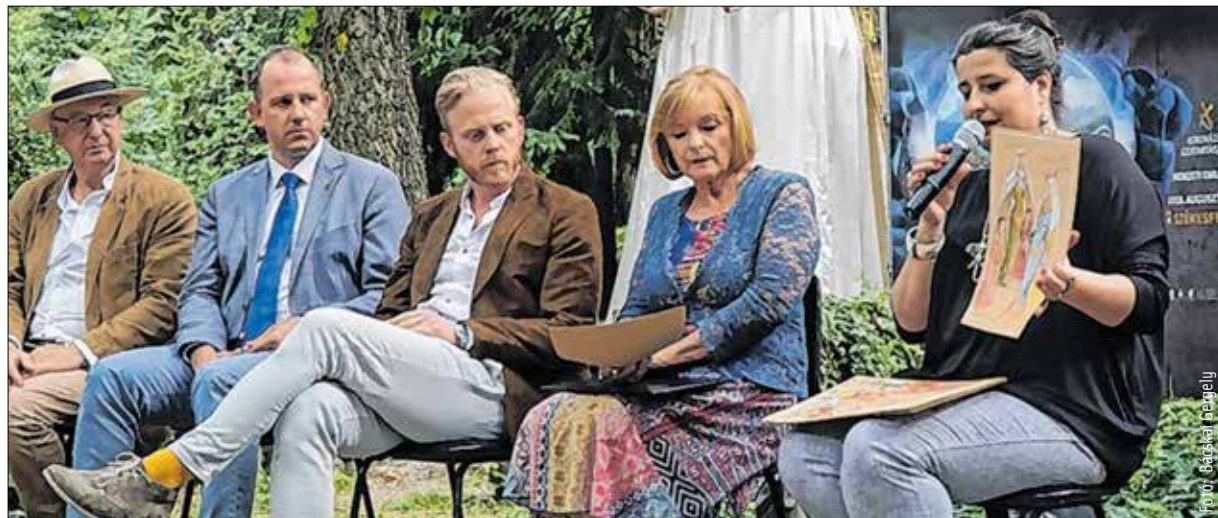
Az idei szertartásjátékot augusztus 17-én, 18-án és 19-én láthatják a Nemzeti Emlékhelyen

Fontos párhuzam a tavalyi előadással Margit jelenléte: egyszerűbb élete okán dramaturgiailag kevésbé hangsúlyos a szerepe, mint Erzsébeté, de személyében a második meghatározó szent lányt tisztelhetjük és ez jelentőssé teszi. – emelte ki Szikora János. Hozzá is kapcsolódik egyébként az előadás alcíme. Az élet magja kifejezés egyrészt természetesen a „második honalapító” uralkodását örökíti