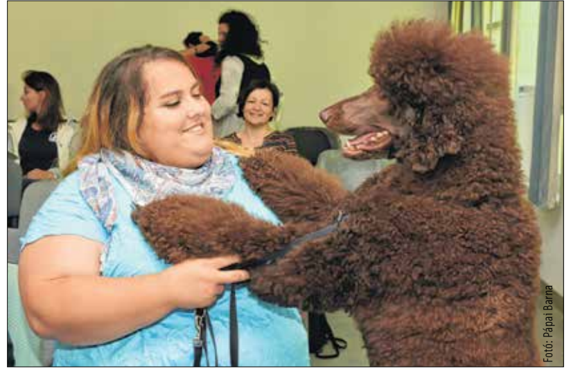
Derűs pillanat a Pata és Mancs Terápiás Egyesületnél