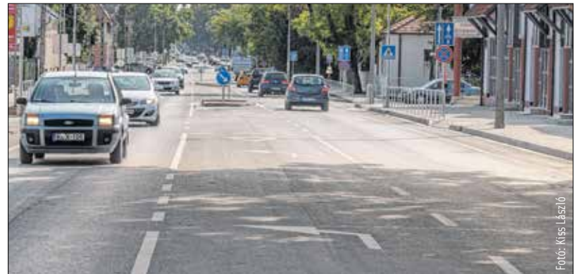
A megújult Berényi úton kanyarodó sávokat is kialakítottak