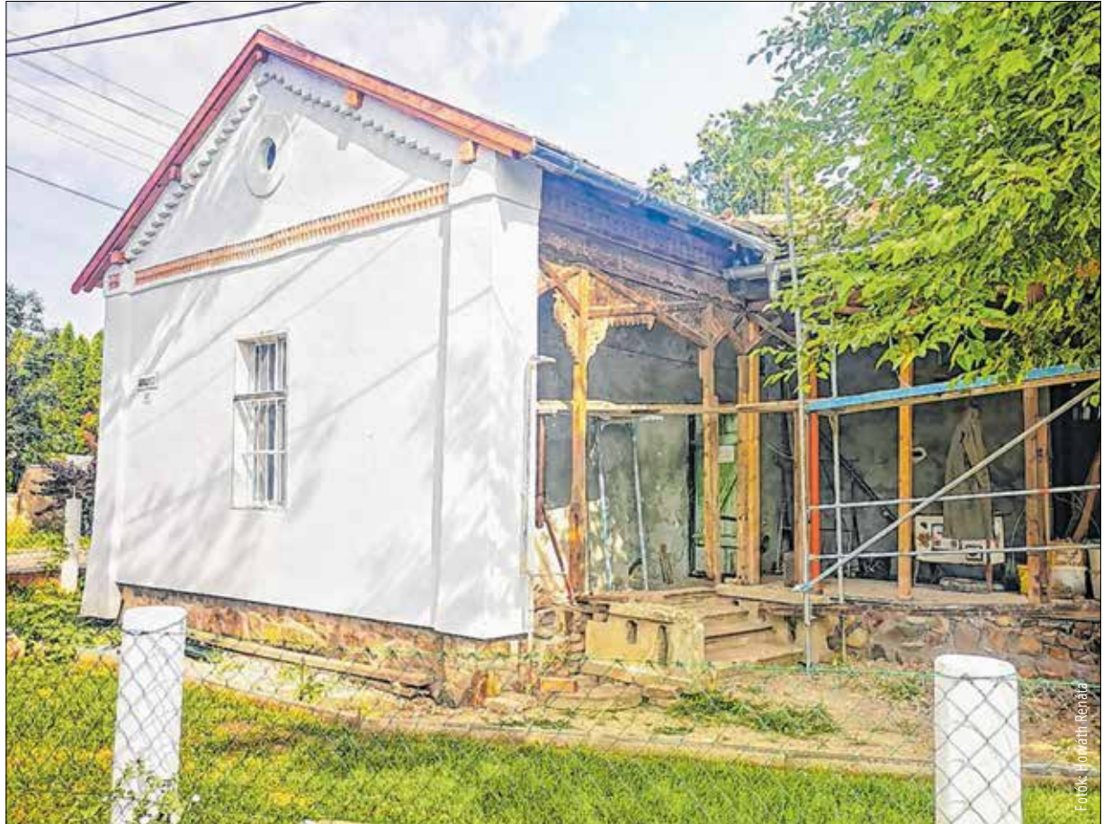
Gyönyörű részletek a házon

Jelenleg egyébként az Öreghegyen közel kétszáz olyan présház és még több pince van még lábon, amelyet