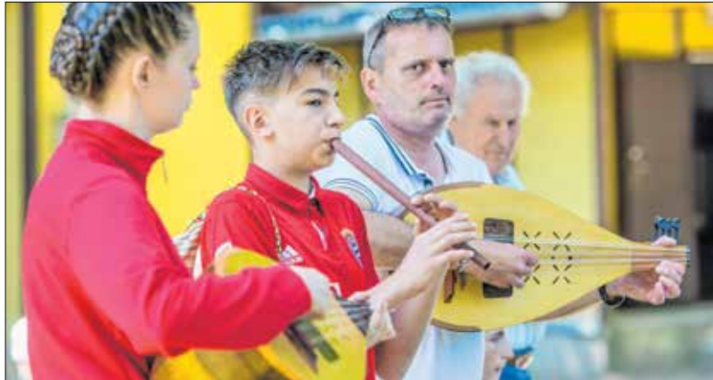
A csángómagyar gyerekek és felnőttek azt mondták, már nagyon várták, hogy újra jöjjenek

A csángómagyar vendégek július 17-én, szerdán délelőtt a Bregyó-közi Sportcentrumban zajló Napraforgó Városi Napközi Táborba is ellátogattak, majd délután csángó misén vettek részt a Ciszterci templomban. Este pedig zenékel, táncokkal, mesékkel fűszerezett, varázslatos estet adtak a Hiemer-ház báltermében.