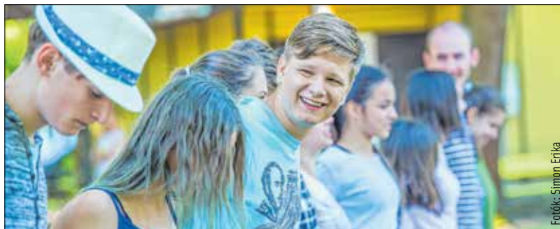
A tábor legfőbb célja, hogy a helyi gyerekek ismerkedjenek határon túli kortársaikkal, népi kultúrájukkal