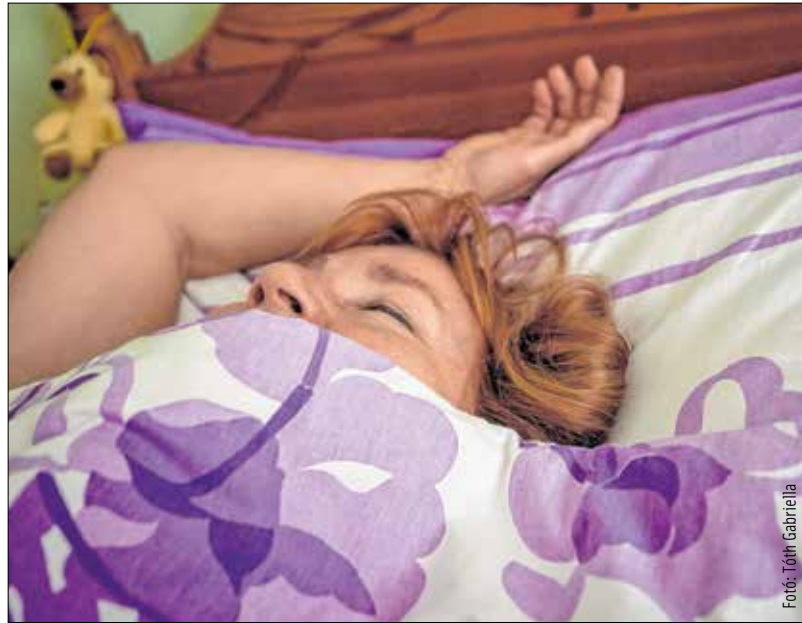
A kialvatlanság a legkisebb baj

Többnyire a férfiak. Egyes felmérések szerint a férfiak negyven