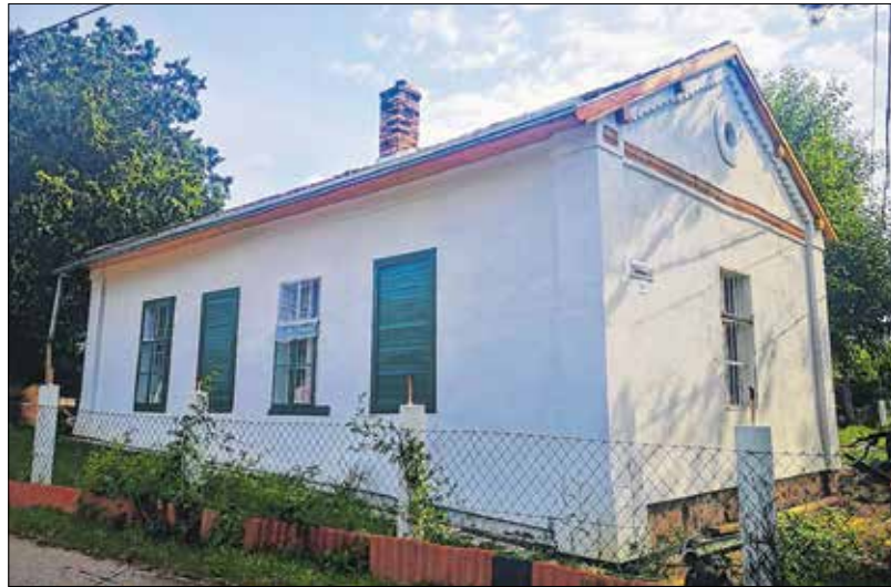
Az utcafronti változás látványos

részben vagy egészben eredeti funkciójában tartottak meg tulajdonosai, és akad olyan is, amelyik új feladatot kapott. Sajnos néhányukból évek múlva egészen biztosan csak sittkupac lesz, de szerencsére többségük most is présház feladatkörben, ékköként szinesíti az utcaépet.