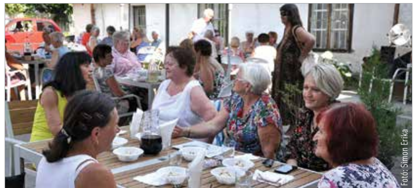
Sütés-főzés, kötetlen beszélgetés – szerdán délután megtartották záró kerti partijukat a nyári szünet előtt az Öreghegyi Nyugdíjasklub tagjai Öreghegyi Községi Ház újonnan felújított kertjében. Többek között ezt a teret is ünnepli a klub, de a névnapokról is megemlékeztek.