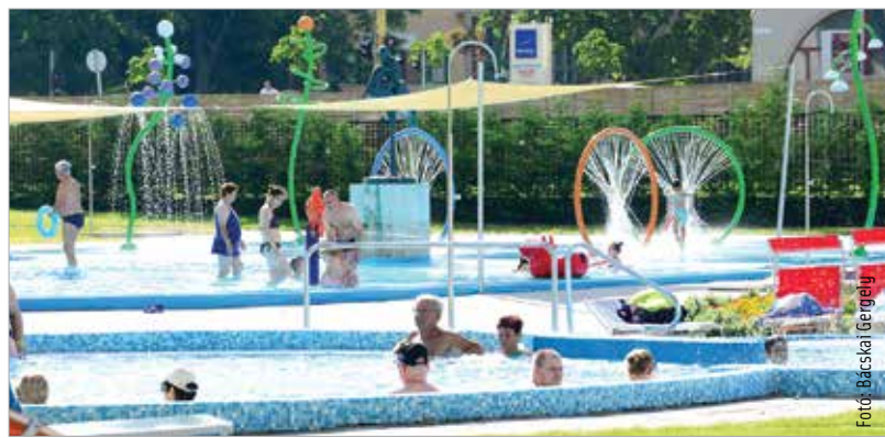
A városi strand minden generáció szórakozási igényeinek megfelel, de itt is várható még fejlesztés

csupán mintegy negyedét fedezi a jegybevétel – addig a strand nyereséget hoz: „Az uszoda és a strand alapvetően jóléti beruházása a városnak, így nem a profit a cél, de tény, hogy a nyereséget további fejlesztésekre lehet fordítani.” Terv az is, hogy ha az uszodabővítés megvalósul, a strand nagymedencéjét is élménymedencévé alakítják. Az elképzelés egy hullámmedence, tengerpartjellegű kiülőlével, ezzel a legnépszerűbb helyszínek zsúfoltsága csökkenne, miközben még több élményelem szolgálna a fehérváriak pihenését.