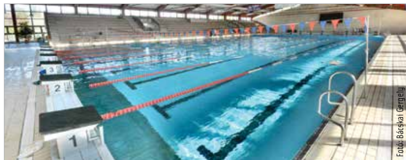
A mostanihoz hasonló nagymedence és egy kisebb tanmedence is szerepel a bővítési tervekben

Míg az uszoda nagy veszteséget termel – az üzemeltetési költségnek