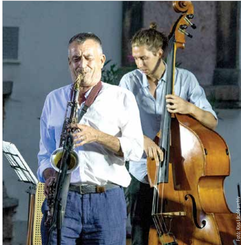
Alba Regia Feszt 2018-ban

Hagyományteremtő szándékkal rendezik meg első alkalommal július 26. és 28. között a Királyi Operettnapokat Székesfehérváron. A Feketehegy-szárazréti Közösség Központ szabadtéri színpadán a Királyi Operettgála, a Bob herceg valamint a Sybill operett látható és hallható majd. Az előadások előtt és után zenés-táncos műsorral, kabaréval ígérnek könnyed nyáresti szórakozást a szervezők. Az operettnapok felvezetőprogramjaként július második és harmadik hétvé-