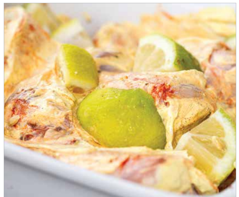
Minél többet pihen a hűtőben, annál jobban összeérnek az ízek

és teljesen átsütjük. Ez nagyjából húsz perc. Miután kivettük őket, hogy tökéletesek legyenek az ízek, alufólia alatt húsz percig pihentetjük. Néhány levél korianderrel, a raitával és – ha hozzájutunk vagy megsütjük magunk – naan kenyérral tálaljuk!