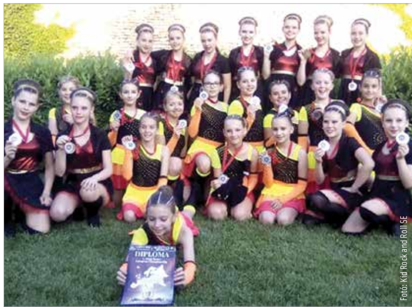
Minden nyakra jutott érem