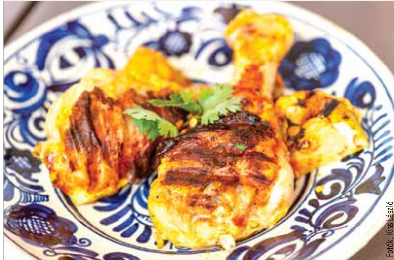
A joghurtos csirkét néhány friss korianderlevéllel tálaljuk

Barnás színű, általában csípős fűszerkeverék. Általában tesznek bele fahéjat, babérlevelet, római köményt, koriandert, kardamomot, borsot és szerecsendió-virágot, de létezik szexuális és fokhagymás változata is, ha csípős, akkor van benne valamilyen chili is. Az arányok családonként változnak. Ez a fűszerkeverék remekül illik zöldségekhez, például a cukkinihez és a padlizsánhoz.