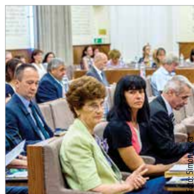
Intézményvezetői megbízásokról is döntöttek a képviselők

A közgyűlés oktatási programokról is döntött: létrehozzák a város első „okostanteremét” a Széna Téri Általános Iskolában, ennek kialakítása az Alba Innováron keresztül történik meg. Állami beruházásban valósul meg egy hasonló „okostanterem” a Széchenyi Szakgimnáziumban középiskolások számára. Az önkormányzat mindkét esetben összegyűjti majd a működési tapasztalatokat, hogy hosszabb távon minden iskolában meg lehessen valósítani ezeket az oktatásfejlesztési programokat. Az Alba Innováron mintegy negyvenmillió forintból felnőttképzés indul a digitális kompetenciák növelésére: „Fontos, hogy a munkavállalóknak is tudjunk képzési lehetőséget kínálni. A cégekkel közösen