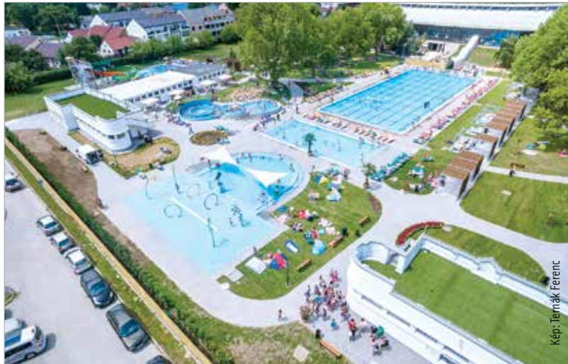
Az uszoda épületét a strand nagymedencéje melletti zöldterületen tudják növelni, megkétszerezve ezzel a most rendelkezésre álló vízfelületet

„Nemcsak felújítás történik, hanem kibővítjük a mostani épületet.” – tudtuk meg Bozai Istvántól. Székesfehérvár városgondnoka szerint az 1989-ben elkészült uszodára igencsak ráfér a felújítás, sőt ennél még sürgetőbb feladat a strand nagymedencéje gépészetének korszerűsítése. Idén a strand nyitása is azért csúszott egy hetet, mert a medence 1982-ben lerakott vízforogatórendszerét rendbe kellett tenni. Ennek végleges megoldása is a jövő