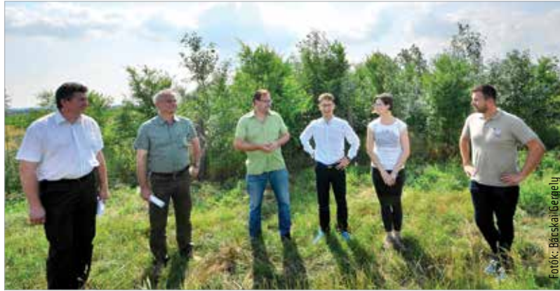
A Vadex, a Városgondnokság, az Erdőért Egyesület és az önkormányzat szakemberei együtt keresték és találták meg a megoldást a város zöldfelületeinek növelésére

A mostanra kialakított háromhektáros erdőről jól látni Palotavárosra és Szedreskertre, sőt Alsóváros szélé is látótérbe kerül. Az erdő és a város között jelenleg termőterület és nádas húzódik. Évtizedek múlva azonban erdősávok lesznek itt, amely azt a környezeti „tüdőkapacitást” fogja biztosítani a város számára, amire szükség van. „A következő évek egyik legfontosabb fejlesztéséről van szó. Ez egy erős iparral rendelkező város, ami az egyik oldalon előny, hiszen ilyen jellegű fejlesztéseket a gaz-