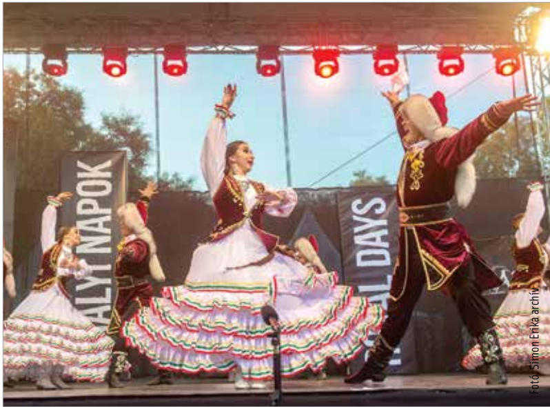
A Nemzetközi Néptáncfesztivált lassan negyed évszázada rendezik meg

17. és 19. között. Utóbbiban a Nemzeti Emlékhelyen IV. Béla koronázása elevenedik meg. A Királyi Napok keretén belül népesíti be a belvárost a VII. Fricsay Richárd Regionális Katonazenekari Fesztivál is augusztus 16-án Veszprém, Tata, Budapest és Székesfehérvár katonazenekaraival. Idén sem maradnak el a könnyűzenei koncertek a Zichy színpadon: augusztus 10-én a Budapest Bár, augusztus 17-én Rúza Magdi lép fel, a nyár lezárásaként pedig ugyanezen a színpadon köszönhetjük majd augusztus 29-én a Neoton Famíliát. Mindenről részletesen a kiralyinapok.szekesfehar.hu oldalon olvashatunk.