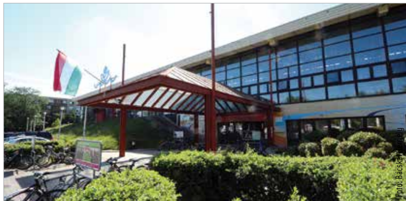
Az uszoda épületét 1989-ben adták át, azóta kinötte a város, így bővítésre és korszerűsítésre is szükség van a közeljövőben

beruházási költséget TAO-támogatásból illetve állami finanszírozásból szeretnék előteremteni. – „Nem kis volumenű fejlesztésről van szó, azonban ha ez megvalósul, a következő húsz-harminc évre megoldja a fehérvári vízes sportok és az úszni vágyók gondjait.”