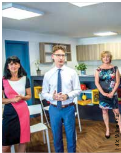
A közel húszmillió forintos fejlesztést Székesfehérvár önkormányzata saját forrásból valósította meg

Székesfehérvár önkormányzata saját forrásból vásárolta meg a (csalái) Fő utca 1/A. alatti ingatlant nyolc és fél millió forintért, továbbá a közösségi funkció kialakítása érdekében közel tízmillió forint értékű felújítást valósított meg. Az ingatlant a Szabadművelődés Háza