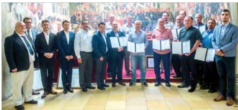
A városháza dísztermében vehette át oklevelét az a tizenegy fő, akik az Alba Innovár és a város közös felnőttképzési programjában végeztek

„A jelenleg is zajló digitális átalakulásra készíti fel a program a ma munkavállalóit.” – mondta el köszöntőjében a város polgármestere. Cser-Palkovics András szerint az új generációknál a digitális tudás alapkövetelmény, a változások azonban már most is zajlanak, sok fehérvári cégnél jelenleg is a világ legkorszerűbb technológiáit alkalmazzák – ezért támogatja a felnőttképzési programot a jövőben is az önkormányzat a költségek egy részének finanszírozásával. A következő képzésben résztvevő negyven „diák” hamarosan megkezd tanulmányait. Az országosan egyedülálló program pedig nem kizárt, hogy állami támogatásban is részesül majd a jövőben – hiszen várhatóan beváltja a hozzáfűzött reményeket, vagyis a naprakész szakmai tudást, a termelés hatékonyságának növelését és a szakképzett munkaerő hiányának enyhítését.