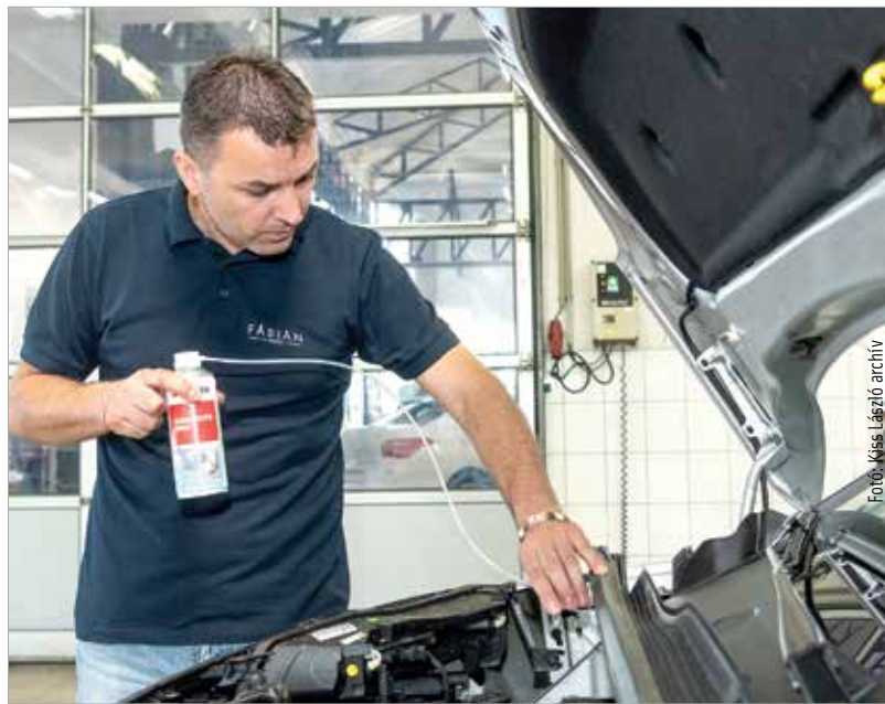
Fontos, hogy időben nézzessük át járművünket!

A klíma tisztítása évi rendszerességgel mindenképpen javasolt a pollenszűrő cseréjével egybekötve. „Itt oszlatnék el egy tévhitet, miszerint az eljárás után a légkondi hidegebbet fúj. A klíma tisztítása a légkondicionáló hatásfokára semmilyen hatással