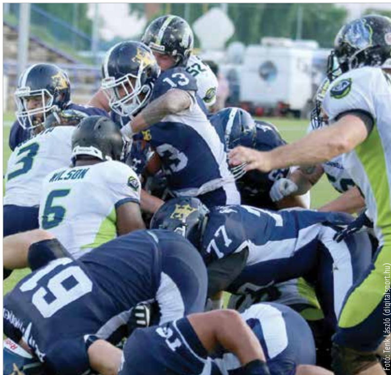
Története legnagyobb sikerét aratta az Enthroners, és még nincs vége a szezonnak!

A derbin a második negyedben tört meg a jég: egy mezonnyal 3-0-s vezetést szereztek a fehérváriak, de jött a válasz a Cowbellstől: touchdown és egy kimaradt extra pont – 6-3-as vezetésre tettek szert