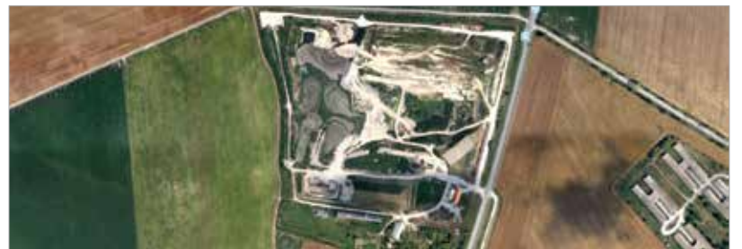
A vállalkozó Székesfehérvár önkormányzatához fordult, hogy bővíthesse telephelyét, az önkormányzat erre nemet mond

ményt adott ki: „Székesfehérvárnak nem érdeke, hogy máshonnan idehozott iszapot rakjanak le és hasznosítsanak, így ezt a tevékenységet az önkormányzat nem támogatja. Két kormányhivatal illetékes a Fehérvári Téglaiipari Kft. által végzett tevékenység engedélyezésében. Az engedélyt a Fejér Megyei Kormányhivatal adta ki – nem veszélyes hulladékok felhasználásával bányagödör-rekultivációra. A külföldről származó szennyvíziszap behozatalát pedig a Pest Megyei Kormányhivatal engedélyezte. A vállalkozó Székesfehérvár önkormányzatához fordult a Helyi Építési Szabályzat nagyarányú telephelybővítést engedélyező módosítására vonatkozó kéréssel. Az önkormányzat erre természetesen nemet mond.” – áll a közleményben. Szerkesztőségünk megkereste a két említett kormányhivatalt is, melyek tájékoztatást ígértek, de válasz lapzártánkig nem érkezett.