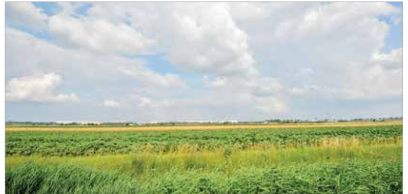
Ezen a területen a következő években jelentős kiterjedésű erdősávokat telepítenek a szakemberek