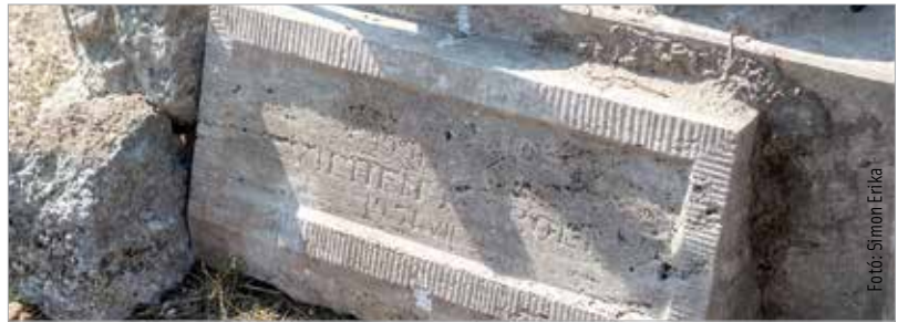
Augusztus végéig újul meg a Vásárhelyi út legrosszabb állapotban lévő szakasza. A beruházás során máris izgalmas történelmi emlékek kerültek felszínre: a múlt héten megtalálták egy 1931-ből származó repülő emlékmű maradványait.