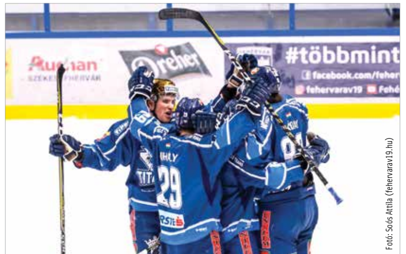
Ezután Győrben is hazai pályán ünnepelhetnek a Fehérvári Titánok hokisai

A hároméves megállapodás első ütemében a Fehérvári Titánok csapata legalább tizenkét hazai mérkőzését Győrben, a 2019-ben átadásra kerülő Nemak Jégcsarnokban rendezi meg (ezekre indít majd szurkolói buszokat Fehérvárról a győri klub), majd a második évben a gárda összes hazai mérkőzésének helyszíné Győr lesz. Az együttműködés harmadik évére az együttes megjelenésében, megnevezésében is markánsan megjelenik a győri klub, emellett folyamatosan beépítik az erre szakmai értelemben alkalmas székesfehérvári és győri, saját nevelésű játékosokat is.