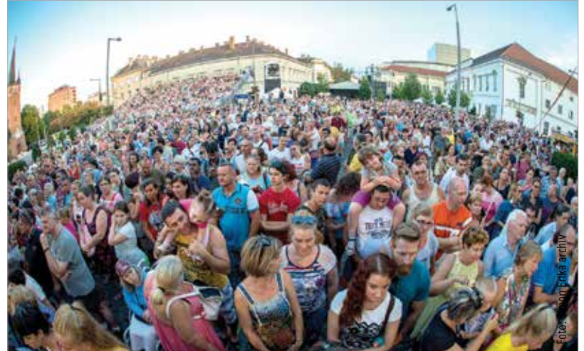
Tavaly is tömegeket vonzottak a programok

Idén is peregnek a dobok és zengnek a trombiták, harsonák és kürtök a belvárosban az augusztus 10-i Fehérvári Fúvósfesztiválon. A házigazda, a harmincéves Székesfehérvári Ifjúsági Fúvószenekar ezúttal a Várpalotai Bányász Fúvószenekart, a dunaujvárosi Pentele Bandet és a Martonvásári Fúvószenekart látja vendégül. A program a fehérváriak térzenéjével veszi kezdetét délután öt órakor