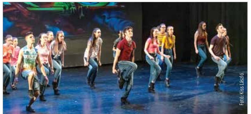
A születésnapos Megadance Táncegyüttes fergeteges estével ajándékozta meg a kortárs tánc barátait a Vörösmarty Színházban