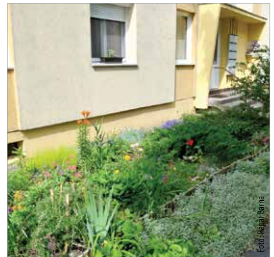
A másik harmadik helyezett a Szedreskerti lakónegyedben