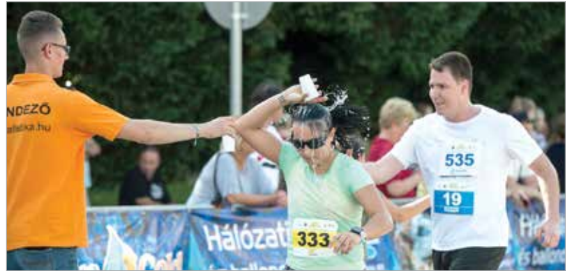
Ha nem is életet mentett, de nélkülözhetetlen volt a folyadékpótlás – kívül-belül egyaránt a tikkasztó hőségben

június elején, néhány éve pünkösd hétfőjén. Az időpont a hirtelen jött nyárban egyben kánikulát is jelentett, de ettől függetlenül több százan futottak. Egy, három vagy hét kört lehetett letudni a belvárosban, egyéniben vagy családi, munkahelyi csapatban. A záró számként rendezett Depónia-futáson pedig egy összelapított PET-palackkal nevezhettek a cserébe ajándék pólót kapó fehérváriak, akik így zöldbe borították a Vár körutat.