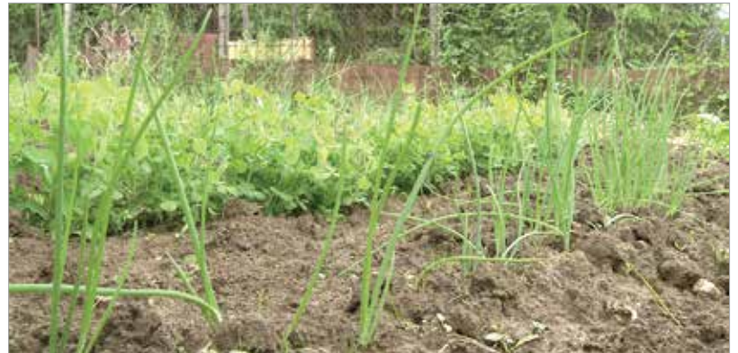
A csókakői család az adományból az egész éves zöldségszükségletét megtermelheti

tani a portát, rendezni az udvart, elszállítani a hulladékot. Egy-egy