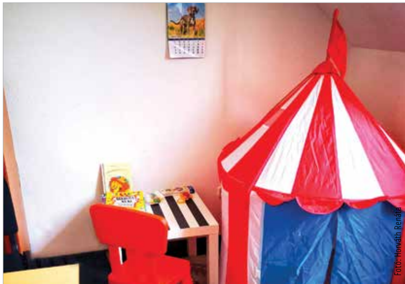
Új gyereksarok a Fehérvár Média centrum szerkesztőségében

Ha azonban a gyerek még kicsi a táborozáshoz, marad az óvodai ügyelet és a nagymama. Ötéves kor alatt a pedagógusok nem nagyon javasolják még a napközis tábort sem, a csemete számára ismeretlen felnőttek, gyerekek és adott