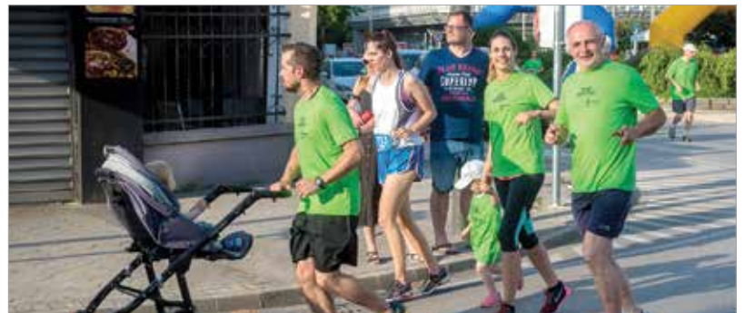
A Depónia-futás hagyományosan lehet akár séta is, lényeg, hogy kicsik és nagyok demonstrálják a környezetvédelem fontosságát

Amatőrök és profi sportolók együtt vágta neki a választott távnak. Az első rajtnál az egyéni indulók és a kétféle csapatverseny nevezői is ott voltak.