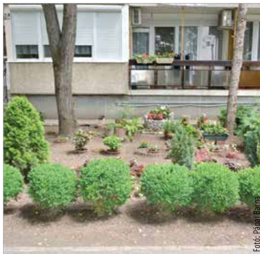
Az egyik harmadik helyezett a Fáy András-lakótelepen