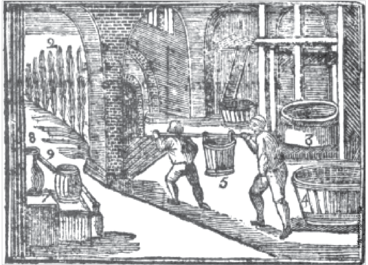
Jan Amos Komenský rajzán a serfőzés folyamata követhető nyomon. Baloldalon látszik a komlóültetvény, szemben, a létra fölött a malátát szárítják, jobbra hátul a főzőüst, azaz katlan, előtte a hűtőkád, középen a serfőző legények viszik a serlét a pincébe.

A ház mögött volt a pince, azzal átellenben, az út másik oldalán a vízimalom. Volt egy egyjágányú szárazmalom is, zsindegyel fedve és minden hozzávalóval ellátva. A molnár szalmatető házában lakott. Kézelfogható az a racionalitás, ami a serfőzőházat, a vízi- és szárazmalmot, a tégláégetőt, a kádárműhelyt és a mindezeket működtető mesterek lakását egy egységben kezelő gondolkodásként mutatja fel. Elképzelhetjük, ahogyan a molnárök őrlik a gabonát, a tégláégetők pakolják ki a kemencéből a téglákat, halljuk, ahogyan a kádár huzatókalapácsával üti az abroncsokat a készülő hordók dongái körül, s érezzük a főzött maláta kellemes gabonaillatát. A verpeléti sörház épületét