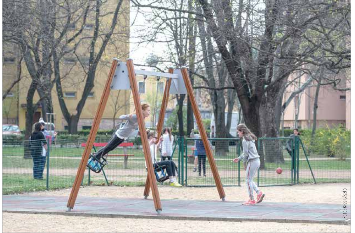
A parkokat, játszótéereket az iskolások is szívesen használják