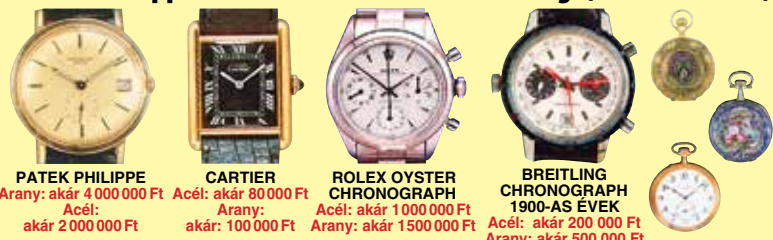
PATEK PHILIPPE Arany: akár 4 000 000 Ft Acél: akár 2 000 000 Ft

Keresek Angelus, Heuer, Marvin, Doxa, Bovet, Tavannes, Breitling, Vetta acél stopperos órákat 100 000–300 000 Ft-ig! (akár hibásat is)