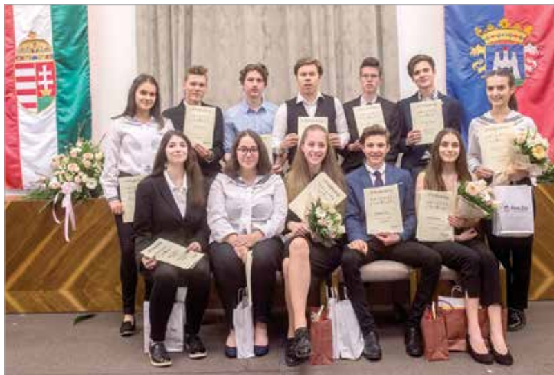
A döntősök részt vehetnek a székellyföldi verstanóban

mondhatjuk, hogy a város kulturális és oktatási életének hagyománya lett ez a rendezvény. Székesfehérvár polgármestere köszönetet mondott mindenkinek, aki segített ebben, különösen a Fehérvár Médiacentrumnak, a zsűri tagjainak és a tehetséges diákok tanárainak.