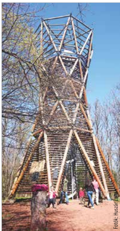
Az ingyenesen látogatható Kisfaludy-kilátó tetejéről körpanoráma tárul elének

A sárga jelzés mentén egy meredek lépcsősoron indulhatunk meghódítani a hegyet. A kaptató végén egy kis pihenő- és kilátóhelyet találunk, itt van a híres Rózsa-kő. A legenda szerint ha egy fiatal pár háttal a