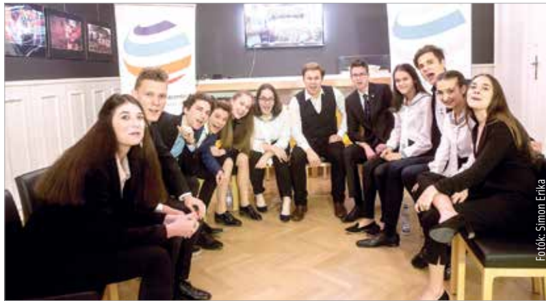
A pihenőszobában mindenki szurkolt a másíknak

A szavatok után a zsűri visszavonult, majd a döntés után a rendezvény két fővédnöke, Spányi Antal és Cser-Palkovics András köszöntötte a versenyzőket és a hallgatóságot.