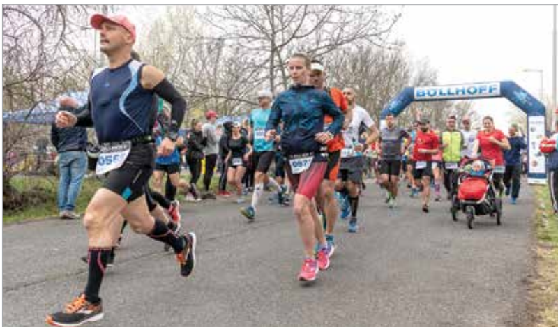
Az agárdi rajt – volt, aki babakocsival vágott neki a tótkörnek

Nem verseny, nem is úgy indult – eredetileg egy baráti összejövetelként, amolyan baráti tótkörként kezdődött. Vasárnap pedig közel ezren álltak oda a XIV. Böllhoff Tóparti Futóparti rajtjához, hogy teljesítsék a huszonnyolc kilométeres kört a Velencei-tó körül.