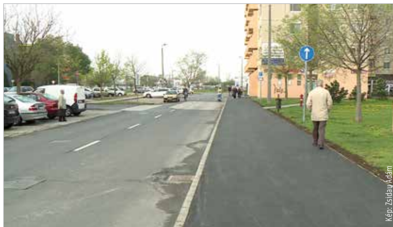
A Jancsár és a Sziget utca több szakaszán az elfáradt, elöregedett, repedezett burkolatot eltávolították és újra cserélték a szakemberek

A képviselő hozzátette: az évek során több mint kétszázmillió forintot fordított az önkormányzat a Palotavárosban a járdák rekonstrukciójára. Ezúttal a Jancsár utca 1-5., 39-41. és a Sziget utca 33-35. környékén újultak meg a járdák. A Sziget utca 41-es lépcsőházáig megújultak a belső utak, valamint a 47-51. közötti járda is új burkolatot kapott. A járdafelújítások tovább folytatódnak Palotavárosban.