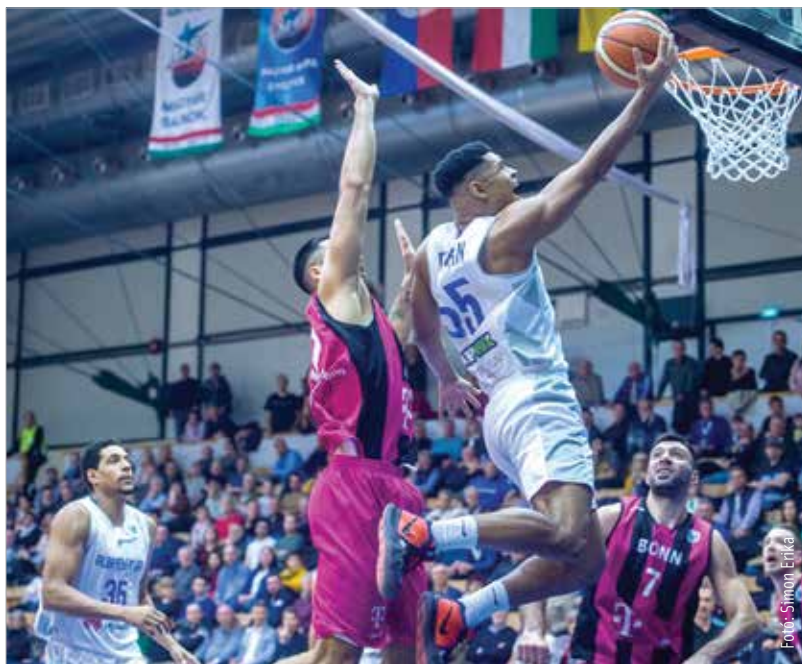
Szárnyalt az Alba a németek ellen, a szezon bravúrája lett belőle

A harmadik negyed a németek kezdték, mégpedig Mayo második triplájával, amivel egyenlítették és