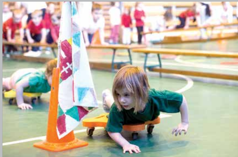
Ha arra volt szükség, négykézláb gurultak az árok mélyén