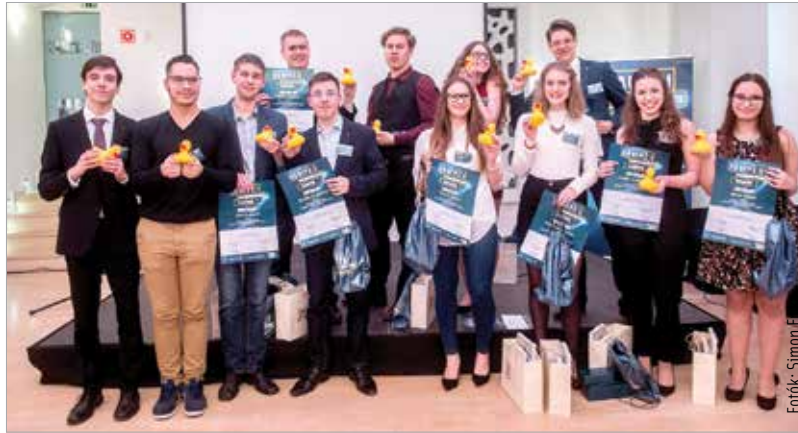
A tizenkét döntős