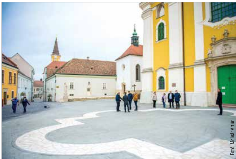
A tér a magyar nemzet történelmének egyik legfontosabb helyszíne

régészeti feltárást követően kezdődött. A belvárosban zajló felújítási program újabb állomása ez, aminek eredményeként az egykori négykaréjos templom alaprajza valamint a feltárt középkori sírok helye is kövel kirakott mintázattal bemutatathatóvá vált. A területre még ládákban virágok és cserjék kerülnek, de tájékoztató táblákat is terveznek a szakemberek, melyek az egykori bazilikáról és az ásatások eredményeiről számolnak be. Ezt követően teljesen bejárható lesz a tér és környéke. A terület teljes megújulása 2022-re várható, hiszen a Géza nagyfejedelem tér a bazilika belső felújítását követően készül majd el.