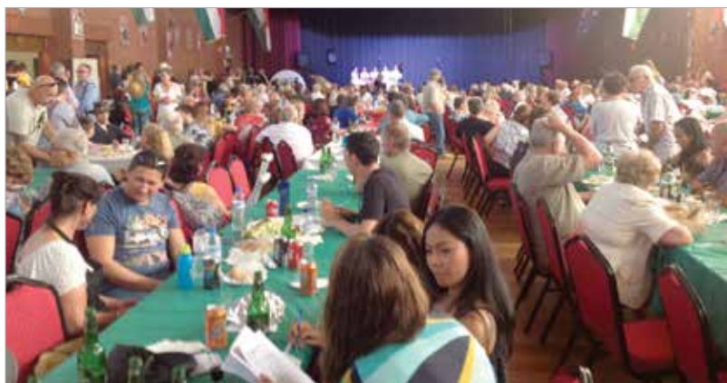
Mindkét helyszínen telt ház előtt ünnepelt a magyarság