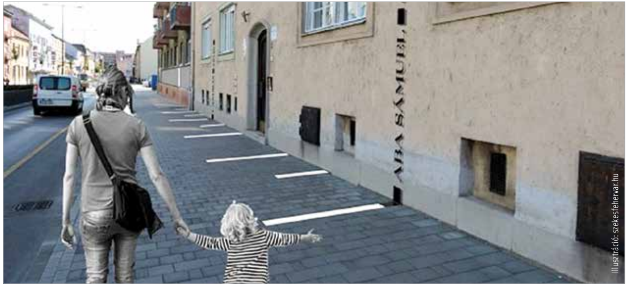
A Nemzeti Emlékhelytől indul majd a barangolás, melynek során a városunkban koronázott, temetett királyokat ismerheti meg a sétáló. Az épületeken éjszaka is jól látható, kivilágított feliratokon olvashatjuk a meghatározó neveket, évszámokat.