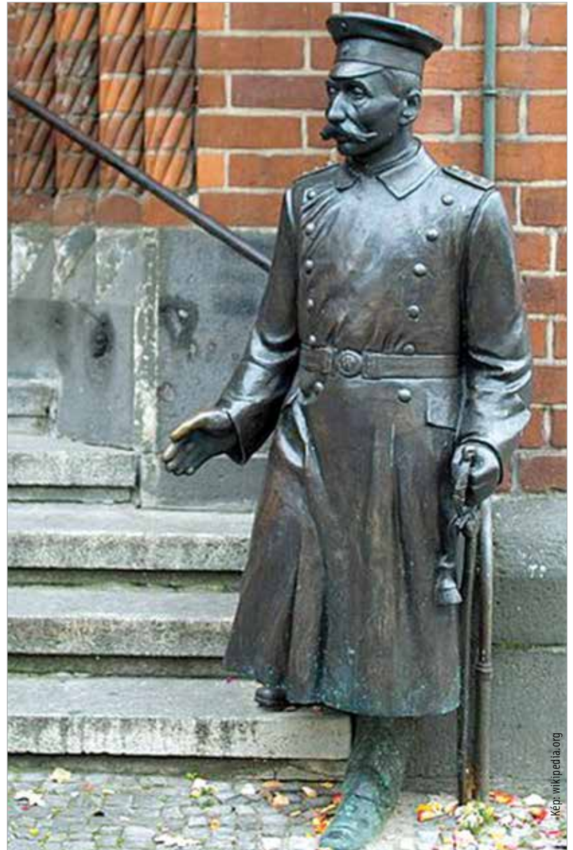
A kapitány szobra a köpenicki városháza előtt