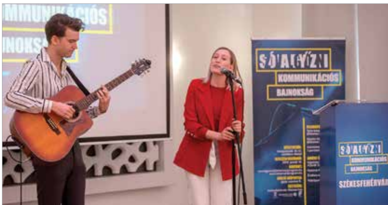
Amíg a zsűri tanakodott, a Blahalouisiana zenélt