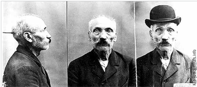
A Wilhelm Voigtról készített rendőrségi fényképek 1906-ból

Wilhelm Voigt 1849. február 13-án született a kelet-poroszországi Tilsitben és 1922. január 3-án hunyt el Luxemburgban. Kalandos életének szenvedélyes, de a jó lapjást nélkülöző kártyás édesapja adta a lökést, aki addig verte a blattot, amíg a családját koldusbotra nem juttatta. Az ifjú Wilhelm csavargóvá vált, s az egyik rendőri pofon segítette őt eljutni a másik rendőr pofonjáig,