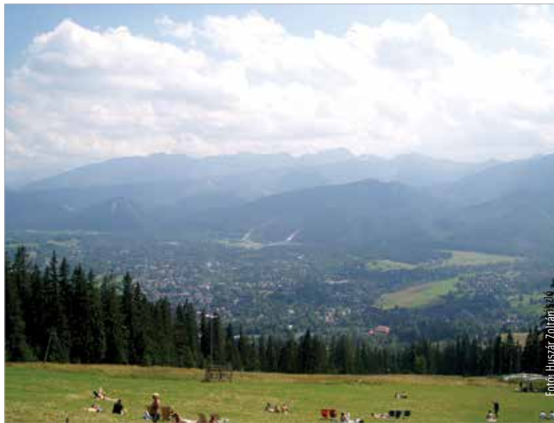
A Gubalóvkáról szép kilátás nyílik a Tátra északi oldalára. A hegyek lábánál terül el a város.

A Magas-Tátra lengyel részének nemcsak legfontosabb, de egyik legelbűvölőbb városa is, így méltán