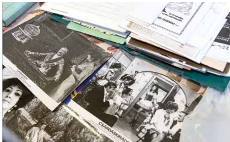
Moziplakátok a múltból