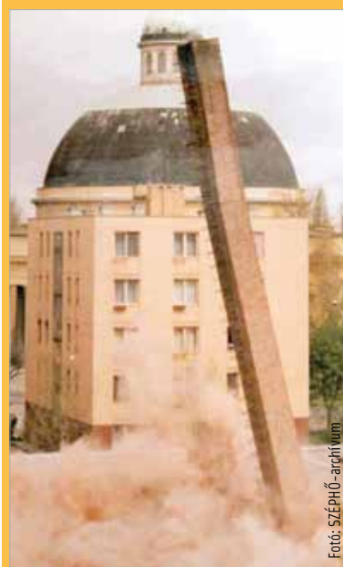
Kéményrobbantás a Prohászán