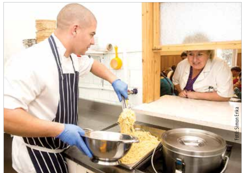
Megújult a tálalókonyha az Arany János iskola Ezredéves tagiskolájában. Az idej tanévtől a Hatpátytós Nonprofit Közhasznú Kft. vette át a diákok étkeztetését, és jelentős felújítások történtek a konyhában. A vállalkozásnál munkahelyi gyakorlatot is töltenek az iskola 11. illetve 12. évfolyamos tanulói.