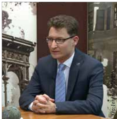
A 2019-es költségvetésről készült polgármesteri beszélgetést megnézhetik a Fehérvár Média centrum Youtube-csatornáján!

Az utóbbi években folyamatosan nő Székesfehérvár adóbevétele, a 2018-as 25,1 milliárdos bevétel idén több mint a költségvetés harmadát jelenti. Ezek a bevételek az utóbbi években folyamatosan nőttek, mintegy évi tíz százalékkal. „A több mint húszmilliárdos iparűzési adó-bevételt tekintve leegyszerűsítve elmondhatjuk, hogy ennyivel növekedett Székesfehérvár gazdasága, és ez jóval nagyobb növekedést jelent, mint a szintén szépen növekvő országos adatok. Ez egyrészt jóval magasabb foglalkoztatási szintet is jelent, ami uniós összehasonlításban is nagyon szép eredmény. Másrészt pedig növeli az önkormányzat adóbevételeit úgy, hogy nem kell hozzá adót emelni. Tehát nem azért emelkedik az adóbevétel, mert növeljük az