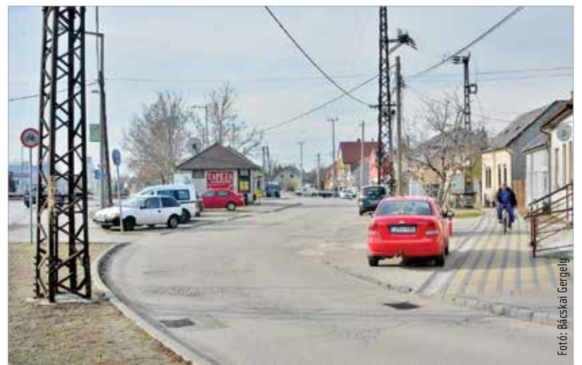
A Szilvamag Maroshegy kiemelt része, így nemcsak út, hanem parképítést is tartalmaz a felújítási terv