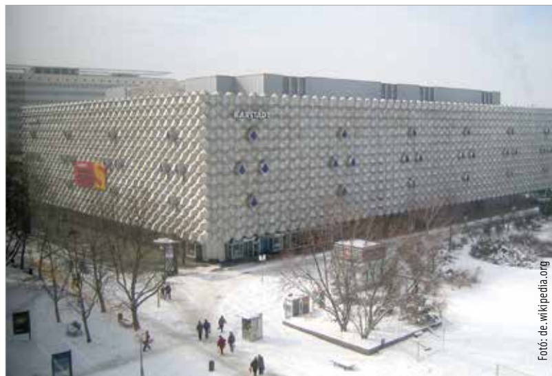
A drezdai Centrum áruház

Hasonlóan a megmentett iratokhoz, Drezda egykori pompájából is megmaradt egy kis szeglet, a Weisser Hirsch, azaz a Fehér Szarvasnak nevezett városrész. Csodálatos dolog, hogy a földig lerombolt szász főváros egyik külső, Elba-parti kerülete szinte érintetlenül vészelte át a bombázást. Az egyik magyarzata lehet a megmaradásnak, amit Dominik Graf A Vörös Kakadu című, 2005-ben megjelent filmjében a politikai felügyelő félrészegen mond el. Története szerint egy kollaboránsnak, egy informatornak volt köszönhető, hogy Drezda nem lett teljesen lebombázva, ugyanis