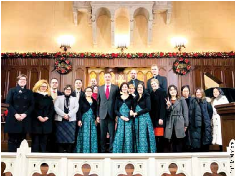
A koncert után Magyarország Sanghaji Főkonzulátusának munkatársaival

A legtöbb időpontjukat éppen ezekben a napokban, hetekben konkretizálják, de egy biztos: a fehérvári közönség is sokszor láthatja, hallhatja idén is a MusiColore énekegyüttest.