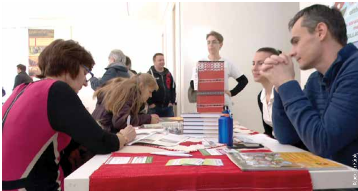
Sokan több rövidebb utat terveznek