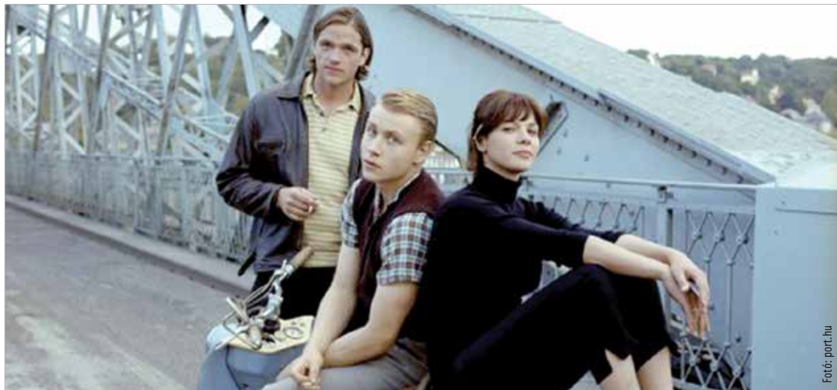
A Vörös Kakadu főszereplői a Weisser Hirschhez vezető hídon, a Blaues Wunderen

Február 13-a egy olyan napnak az emlékét őrzi, mely joggal pályázhatna a világ legborzalmasabb napja címre. Töménytelen rémséget követett el a náci Németország, de