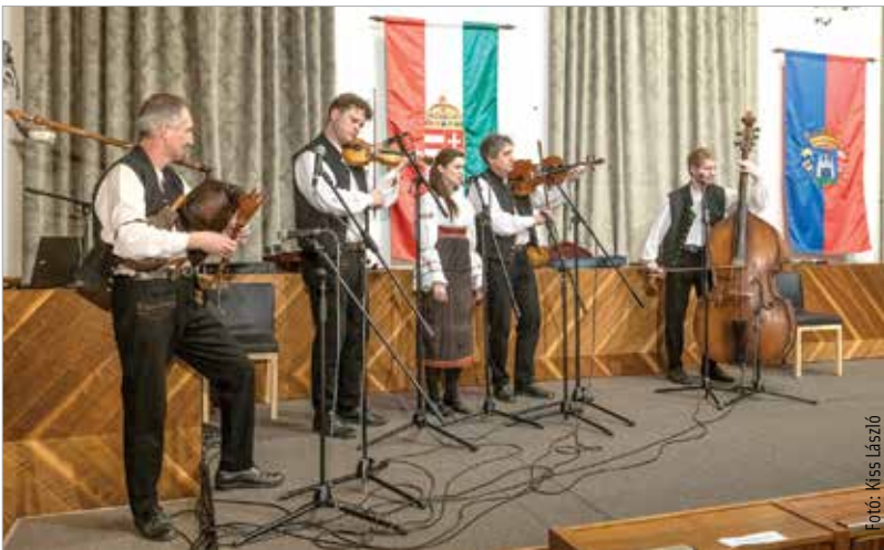
Fergeteges hangulatú koncerttel búcsúzott a Kákics

A zenekar a Hajts, kocsisom szép hazámon, nagy Magyarországon át! című összeállításával utazott el, és ezt a programot mutatták be indulás előtt a hazai közönségnek is, melynek dallamai lefedik a teljes kárpát-medencei népdalkincset.