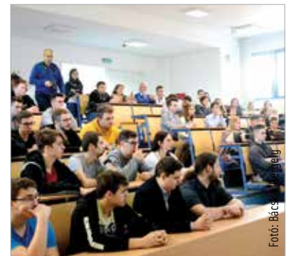
A januári nyílt nap az Óbudai Egyetemen

A pontszámítás alap- és osztatlan képzésen valamint felsőoktatási szakképzésen ötszáz pontos rendszerben történik: a tanulmányi és érettségi pontok (maximum negyszáz pont) mellé különböző jogcímenek legfeljebb száz többletpontot lehet kapni. Mesterképzésen legfeljebb száz pont szerezhető, a pontszámítás szabályait a fel-