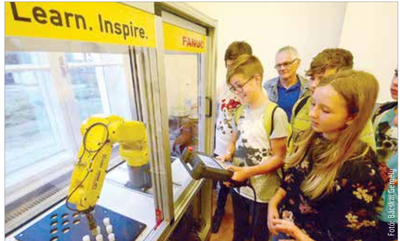
Ha a mérnöki pályát választjuk, biztosra mehetünk!

Hogy miért érdekes ez a kutatás a pályaválasztás kapcsán? Mert azoknál a szakmáknál, ahol bátrabban lépnek az emberek, ennek legfontosabb okaként a bérviszonyokat jelölték meg, és ezt követte a versenytársak munkaerő-elszívó hatása. Vagyis nemcsak a létbiztonságot nem veszélyeztető döntés számukra munkahelyet váltani,