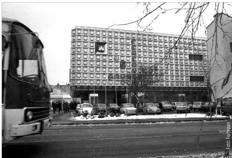
A Fehérvár Áruház

Simon Ferenc e sikeres munkája után még két áruház tervezésére kapott megbízást. A dunaiújvárosi Szövetkezeti Áruház mellett az ő tervei alapján építették 1979-ben a székesfehérvári Fehérvár Áruházat is, melynek homlokzatán vissza-köszön a drezdai áruháznál megismert alumíniumburkolat. Drezdát és Székesfehérvárt egyaránt pusztította tűz, így jelképesnek tekinthető az a baráti látogatás, amit a székesfehérvári tűzoltók 2010 júniusában tettek Drezda Übigau tűzoltóállomásán. Az idő többszörösen elmúlt, az áruházakban már másfajta árukat kínálnak, mint építésükkor, de Drezda és Székesfehérvár újjászületett fényében él.