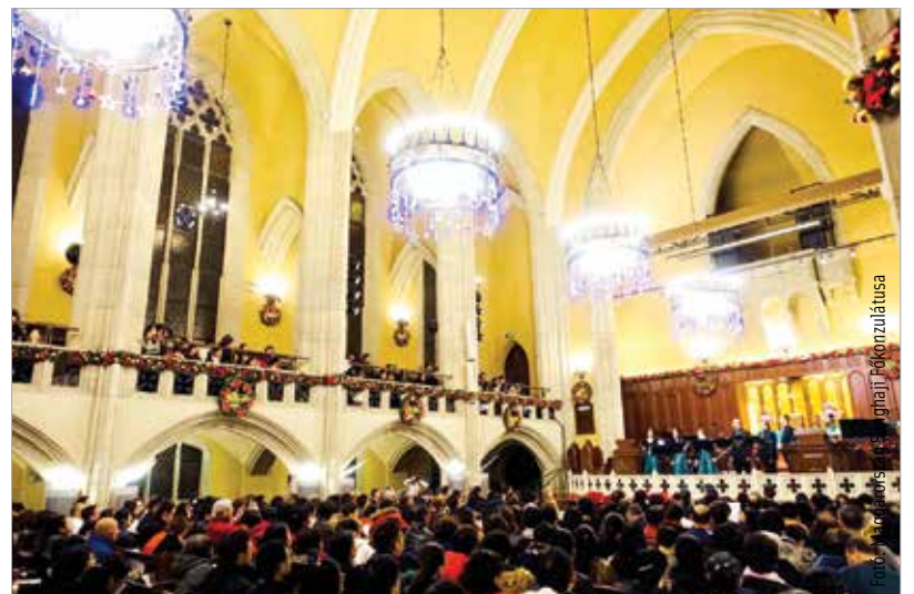
Telt házas koncertet adtak

„Sanghajban egy nyolcszáz férőhelyes templomépületben énekelünk, ahová állítólag nyolcszázötven személy zsúfolódott be.” – mesélte