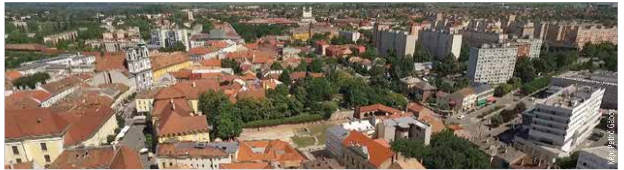
Fehérvár életében is mérföldkő az a fejlesztés

A székesfehérvári katonák létszáma a következő években jelentősen megnő, a családtagokkal együtt várhatóan kilenc-ezren költöznek Fehérvárra. Benkó Tibor honvédelmi miniszter azt is bejelentette, hogy a NATO keretében magyar kezdeményezésre egy többnemzetiségű hadosztályt hoznak létre 2020 végére. Az egység állandó felelősséggel tartozik majd a közép-európai térség biztonságáért. Ennek a székhelye szintén Fehérvár lesz.