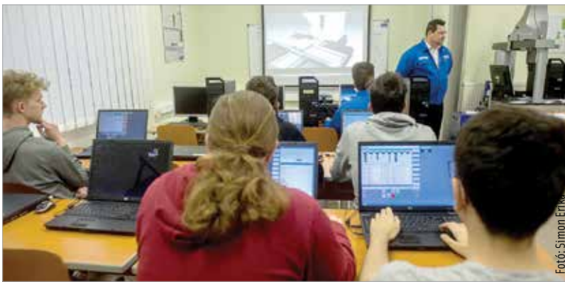
Informatikai szakemberekre mindenhol nagy az igény

torban okozza a legnagyobb kihívást a munkaerő elvándorlása. Az alábbi munkakörökben a legnagyobb probléma a munkaerő pótlása: mérnök, adminisztrátor, orvos, tanácsadó, informatikus, fizikai dolgozók, könyvelő, értékesítő. Ha csak a versenyszférát nézzük, akkor a listát az informatikusok vezetik, őket követik a karbantartók, a programozók, a gépkocsivezetők és a repülőgép-szerelők. A közszférában főleg a mérnökökre van nagy igény, az egészségügyben pedig