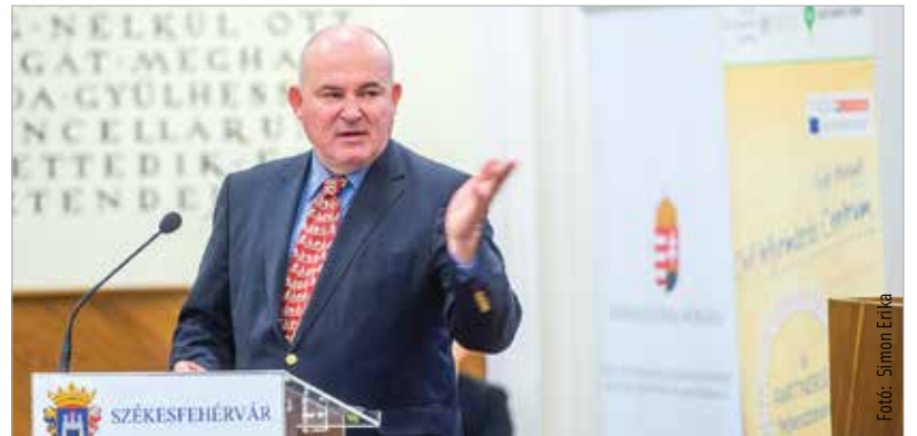
Előszörban az érték- és közösségteremtő pályázatokat honorálják

2018-ban Székesfehérváron kétszázharmincnyolc szervezet részesült több mint háromszáz-huszonhatmillió forintos önkormányzati támogatásban. Cser-Palkovics András polgármester arra hívta fel a szervezetek figyelmét, hogy használják ki az állami pályázati lehetőségeket is, melyekben jóval több lehetőség van, mint amivel a fehérváriak eddig éltek.