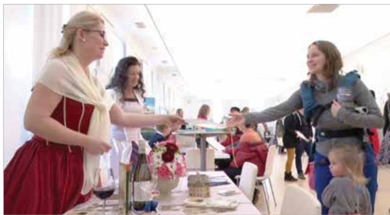
Idén is színes programokkal várták a fehérváriakat a kiállításon

Székesfehérvár a fővárosi utazási kiállításon is képviselteti magát, melyet február 21. és 24. között rendeznek meg a Budapesti Vásárközpontban. „Az élményekhez Székesfehérvár is hozzájárul, mégpedig az A pavilon 311A standján. Az év legfontosabb turisztikai seregszemléjén városunkat az önkormányzat támogatásával