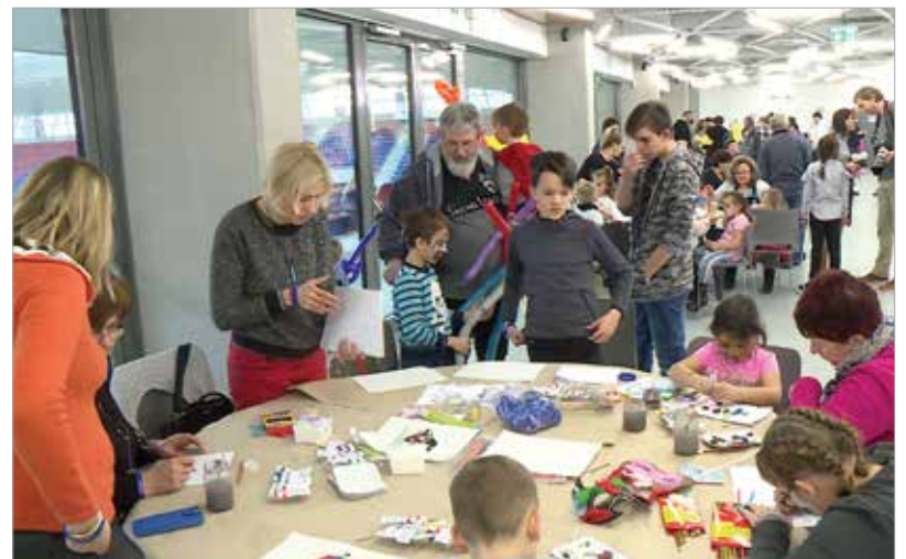
Kézműves foglalkozásokkal, arcfestéssel várták a nevelőszülőket és a gyermekeket

tevékenység is. Fejér megyében jelenleg kétszáz, Székesfehérváron pedig nyolc olyan család van, ahol különböző okok miatt rászoruló gyermekek élnek – hangzott el a program tájékoztatóján.