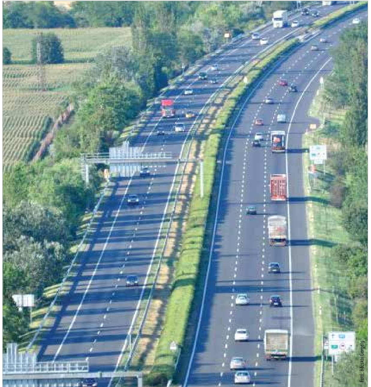
Gondoljuk át, mely útszakaszokat szeretnénk az év során használni!

Az online vásárlás lehetőséget ad arra, hogy mérlegeljük, melyik matricatípussal járunk a legjobban. Ha még az utazás előtt számításokat végzünk, megtervezzük és átgondoljuk