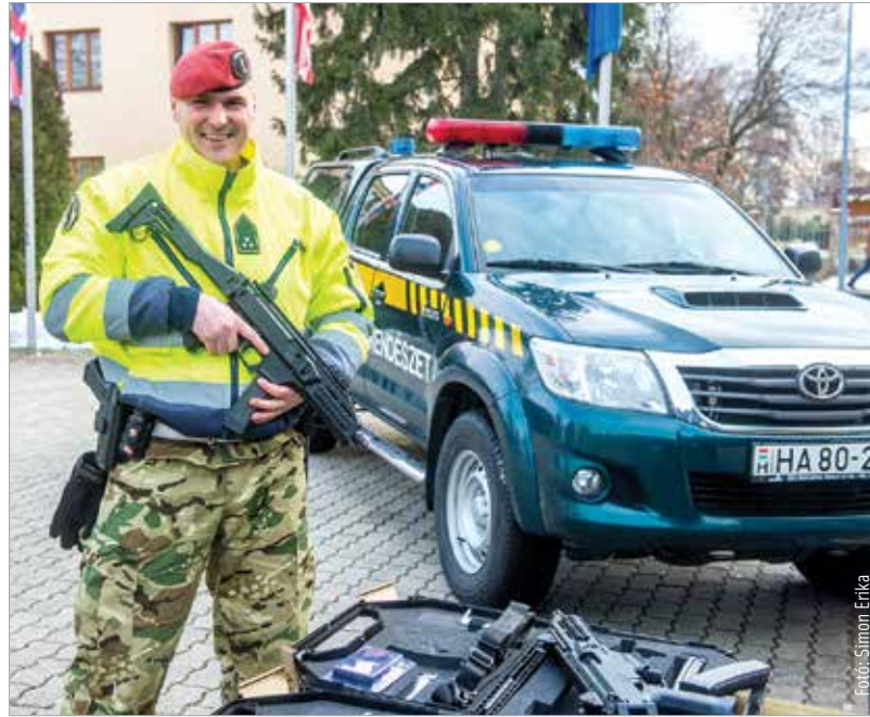
Az új géppisztolyt hamarosan Magyarországon kezdik gyártani

A fejlesztési program mellett a honvédség szervezeti átalakulásáról is szó esett. Január elsejével a honvéd vezérkar kivált a Honvédelmi Minisztérium egységéből, és összeolvadt a műveleti felada-