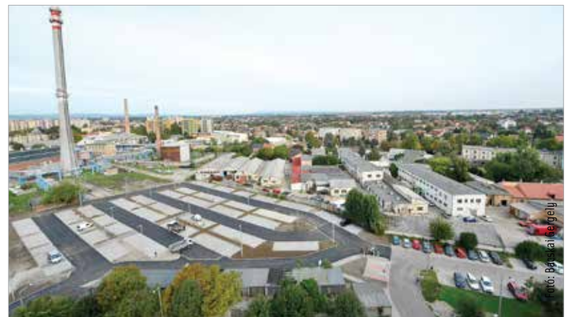
A Sarló utcában egy új, több mint kétszáz férőhelyes parkoló működik a tavalyi évtől

kilencezere nőtt Székesfehérváron. Beszédés adat az is, hogy harmincnolcezer-nyolcszáz csak az ingázó munkavállalók száma a városban. Ez a parkolóigény folyamatos növekedését jelenti, éppen ezért tavaly összesen négyszáztizenegy új parkolót létesített Székesfehérvár, és 2019-ben is folytatódik a parkolók számának növelése. Cser-Palkovics András kiemelte, hogy a kórházfejlesztés négyszázhetvennégy parkoló építését tartalmazza, és az intermodális központ mellett is több száz parkoló létesül a vasútállomás környékén.