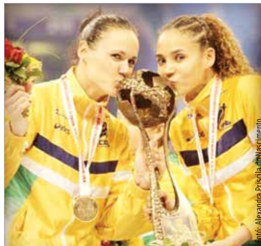
Fotó: Alexandra Priscila do Nascimento

Négy évig vártam rá, végre megérkezett, majd úgy kezdte, hogy szeretné megkérdezni, udvarolhat-e nekem. Nagyon furcsa volt, mert Braziliában ezt nem szokták megkérdezni, hanem találkoznak, megcsókolják egymást, és akkor egyértelmű. Úgy tűnik, Chilében ez máshogy van.