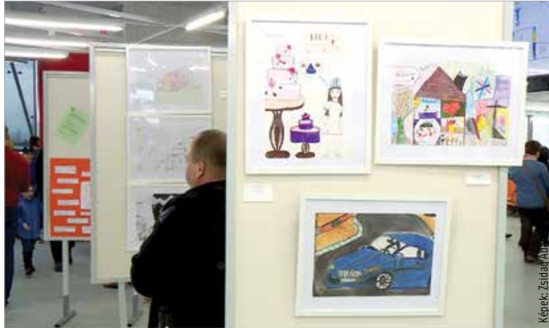
A rendezvényen kiállítás várta a látogatókat: a gyerekek a Lehetetlen nincs! című rajzpályázatra küldhettek be műveket

„Fontos számunkra, hogy kiszélesítsük a nevelőszülői programot, hiszen minden gyermeknek az a legjobb, ha családban nő fel. A programnak köszönhetően akik eddig nem jelentkeztek nevelőszülőnek, ám érdekelné őket ez a hivatás, mindenféle tájékoztatást és támogatást megkapnak.” – mondta Fülöp Attila. Az államtitkár azt is hangsúlyozta, hogy a nevelőszülői GYED bevezetése is ezt a célt szolgálja. Ennek érdekében indul el a nevelőszülői program weboldala is,