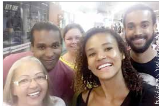
A reptéren mindig a családja várja