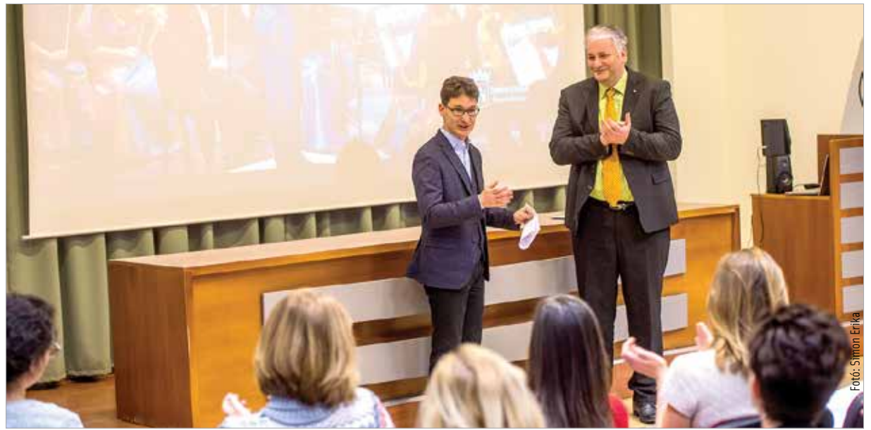
Az önkormányzat elkötelezettsége töretlen a zenekar terveinek megvalósításában

Az eseményen Cser-Palkovics András polgármester megköszönte a zenekarnak azt a színvonalas programsorozatot, amely segítette megismertetni és megszerettetni a székesfehérváriakkal a klasszikus muzsikát, majd tájékoztatta a zenekar tagjait és munkatársait a