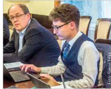
Az idei első Facebook-fogadóórán több mint száz kérdésre válaszolt a polgármester a város szakembereinek közreműködésével

Kérdés érkezett arról is, hogy mikor használhatják újra a fehérváriak a Lépcső utcát. „Sajnos elhúzódtott a munka. Részben régészeti feltárást kellett végezni, részben műszaki problémák akadtak. A kellemetlenségekért mindenkitől elnézést kérek! Ahogy az időjárás lehetővé teszi, folytatódik a munka, és tavasszal be is fejeződik.” – írta a polgármester. Többen kérdeztek a maroshegyi Szilvماغ felújításáról is. Jó hír a kérdezőknek: tavasszal, amint az időjárás lehetővé teszi, folytatódik a munka, és még ebben az esztendőben befejeződik a teljes felújítás illetve a parkrendezés is. Többen kérdeztek a Berényi út – Mikszáth Kálmán utca csomópontjában kialakított ideiglenes körforgalomról is több kérdés érkezett. A válaszban elhangzott,