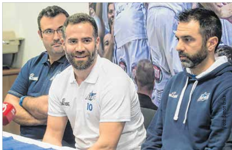
A sztár mosolyog, a vezetőedző (jobbra) pedig mintha el sem hinné, hogy ilyen játékos a van