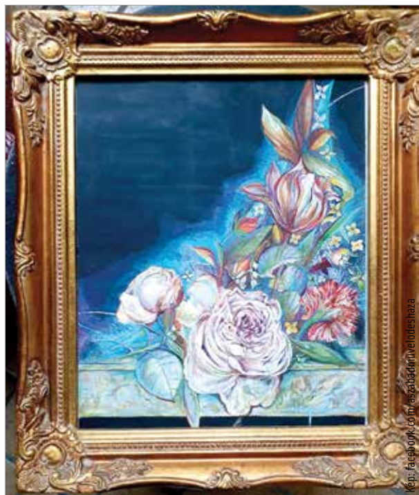
A festmény a kiállítóterem faláról tűnt el