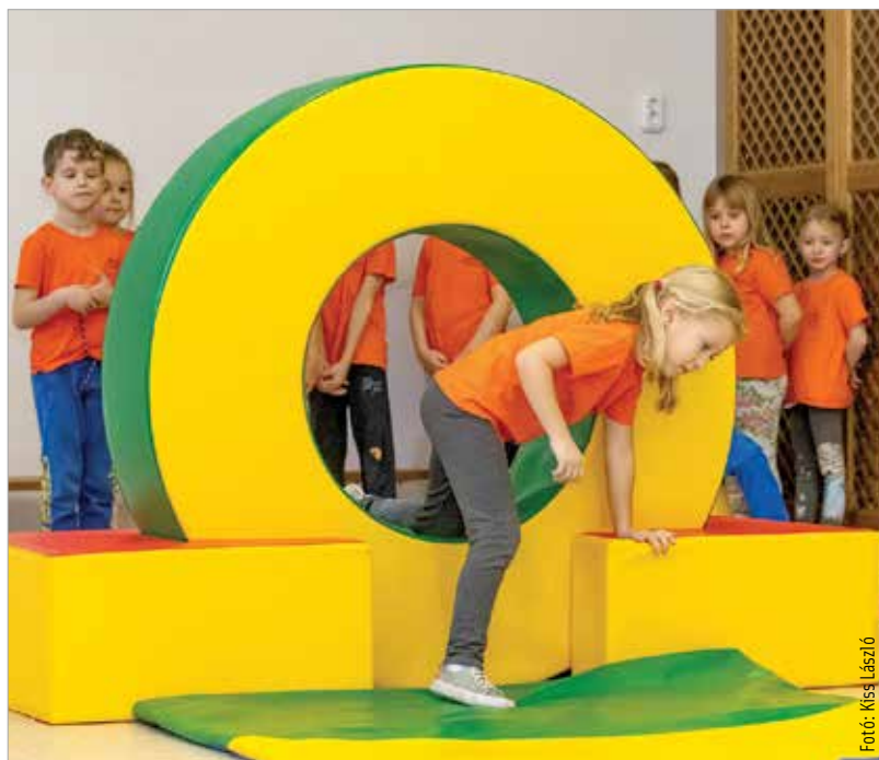
A mozgásfejlesztés elengedhetetlen a megfelelő tanulási készségek kialakulásához

Gósy Mária nyelvész szerint legalább akkora kihívás egy nagycsoportosnak az iskolakezdés, mint a tizennyolc évesnek a munkába