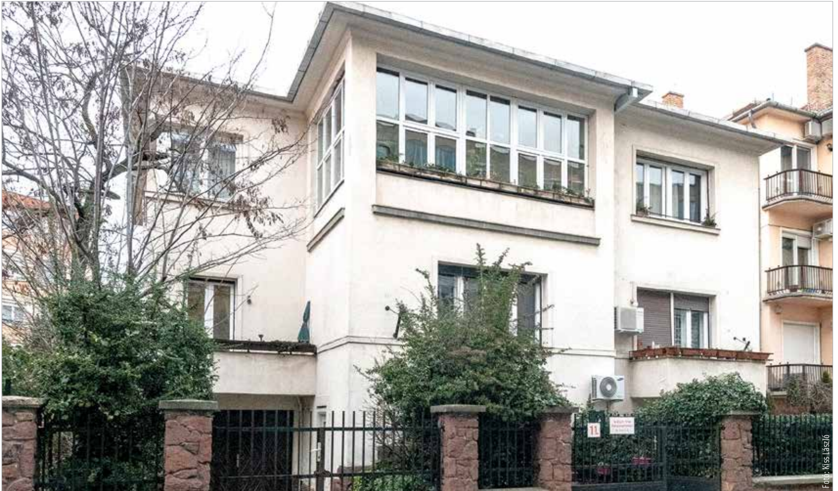
A Koch László utcai villa ma is áll, s történetét ismerve talán már máshogy halad el mellette az ember