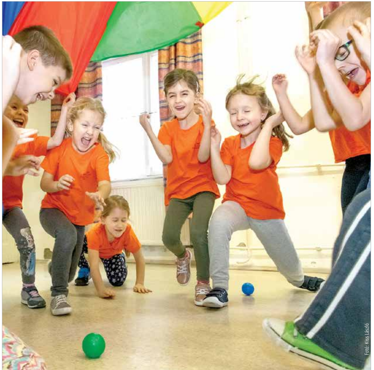
Az óvodában ugyan még játékosan, de már komoly feladatokra készítik fel a gyermekeket

megújulás nagyon fontos. Ebben segíti a digitális megújulás pályázata a székesfehérvári iskolákat.” A tankerületi igazgató a beiratkozás időszakának közeledtével arról is beszélt, hogy mindenképpen szükséges a gyermek nevére kiállított személyi igazolvány, a laccímkartya valamint az iskolaérettséget tanúsító igazolás az intézménybe kerüléshez. Megemlítette a Klebelsberg Képzési Ösztöndíj Programot is, mely az öt éven belül induló nyugdíjazási hullám után jelentkező tanárhiányt orvosolhatja: „Ez egy olyan ösztöndíjrendszer, ami az osztatlan pedagógusképzésben résztvevő leendő tanároknak ad havi rendszeres pénzösszeget. Tanulmányi eredménytől függően huszonöt-, ötven-, illetve hetvenötezer forintot kaphat havonta egy hallgató akár öt éven keresztül azért, mert vállalja, hogy a diploma megszerzése után pedagógus lesz, és az általunk felajánlott álláslehetőségek közül egyet kötelezően elvállal. Optimista vagyok, mert egyre több ösztöndíjas van az országban.”