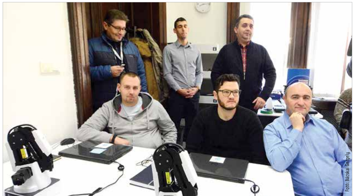
Az Arconic Európai Keréktermék Kft., az Alba Innovár, a KIK-EDU és az Óbudai Egyetem együttműködésével egyedülálló programot valósítanak meg