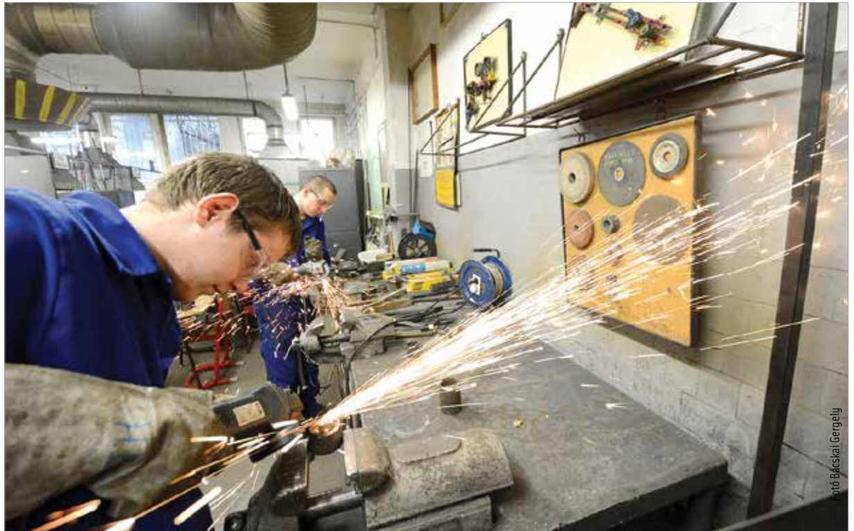
Ötvenöt szakmában már most kiváltható lenne az emberi munkaerő

Ugyanakkor jó ideje a mindennapjaink része az emberi munkaerő robotokkal való kiváltása, és itt most nem kell tudományos-fantasztikus magasságokba kalandozni: gondoljunk csak az önvezető autók lassú, de biztos térhódítására, vagy éppen a napokban, a Las Vegas-i éves Consumer Electronics Show (CES) előtt debütált BreadBot nevű robotra, ami (aki?) nem kevesebbet tud, mint huszonnégy órában hat percenként elkészíteni egy kenyeret az alapanyagok összegyűrésétől a pékárú polcra juttatásáig.