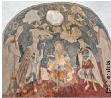
A Kézdiszentléleken található Szent István-, más néven Perkő-kápolna freskója, mely együtt ábrázolja Gellért püspököt, Szent Istvánt, Szent Lászlót és Könyves Kálmánt

Korabeli marketingfogás, aminek máig van hatása, és persze alapja is? A történelmi alap adott, ehhez társítottak egy legendát, melynek mozzanatait tetten érhetjük