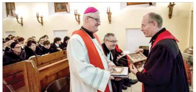
Az ökumenikus imahét célja a keresztény egység erősítése