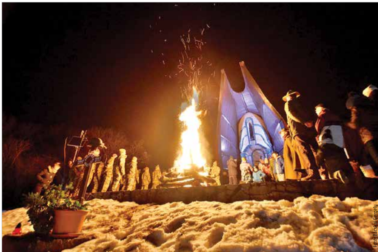
Világháborús hősökért égett a tűz

A második világháborúban, az urivi hídfőnél megindult támadásban elesett közel százharmincezer magyar katona emléke előtt tisztelegtek Pákozdon, ahol 1993-ban emeltek kápolnát, és itt helyezték örök nyugalomra a Roszkino falu mellől hazaszállított ismeretlen magyar katona földi maradványait, méltó emléket állítva a doni hősöknek