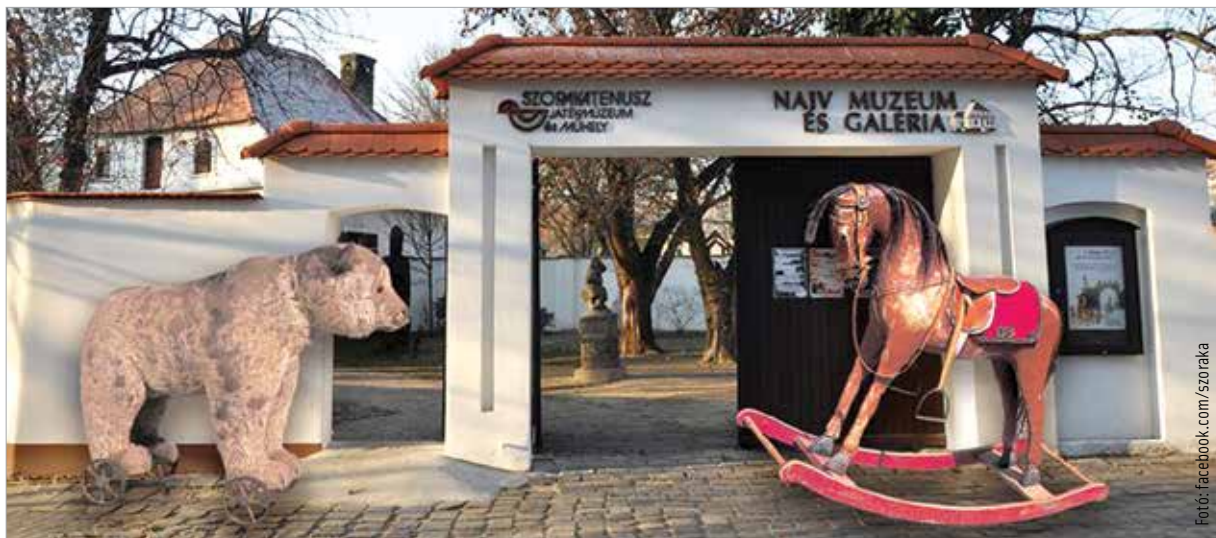
A Szókraténusz Játékmúzeum Kecskeméten várja a látogatókat

Sokan leginkább a tavaszi, nyári hónapokban szeretik felkeresni az állatkerteket, amikor jó idő van. Pedig érdemes valamelyik állatkertbe szervezni egy kiadós sétát télen is. Az ország több állatkertje, köztük a pécsi és a veszprémi is az év minden napján, még ünnepeken is várja a látogatókat. A Pákozdsukorói Arborétum és Szabadidőparkban a vadállatok téli etetését is megtekinthetjük. A Fővárosi Állat- és Növénykertben pedig igazán szívhez szóló családi programot kínálnak a közeljövőben: hagyományosan február első hétvégéjén