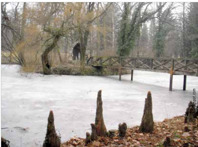
Az Alcsúti Arborétum télen is gyönyörű

fákkal. Egy hétféle kiruccanás érdekes ellátogatni akár oda is. Ha közelebbi célpontot szemelünk ki, mehetünk a télen is gyönyörű Alcsúti Arborétumba, ahol az ország egyik legrégebbi, angolpark jellegű kertje várja negyven hektáron a frissítő sétára vágyó látogatókat.