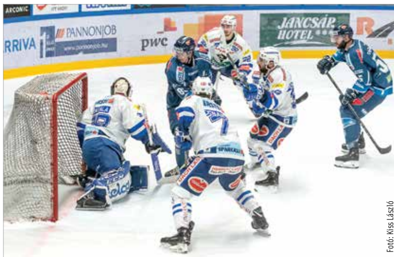
Kevesebbet lőtt kapura, de hatékonyabb volt a Volán a Villachnál