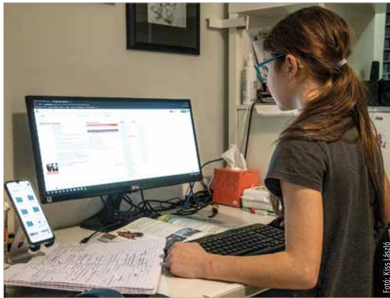
A digitális oktatás a szülőket és a gyerekeket is kihívás elé állítja

A koronavírus-járvány egy külső stresszfaktor az emberek életében. Nem magunk idézzük elő, hanem egy befolyásolhatatlan tényező. Nehezen lehet alkalmazkodni hozzá. Nemcsak a gyerekeket, de a felnőtteket egyaránt érinti. Mint minden stressz, ez is egy általános feszültségi állapotba helyezi az idegrendszerünket. Beáll egy védekező vagy támadó álláspontra a szervezetünk, és megpróbálunk ezzel a stresszel megküzdeni. A mostani helyzetben bizonytalanságérzet van bennünk, hiszen ez a helyzet hirtelen jött, nincsenek rá kialakult megküzdési módjaink. A problémával való megküzdés nem a probléma megoldásában gyökerezik, hanem abban, hogy elfogadjuk: most ez a