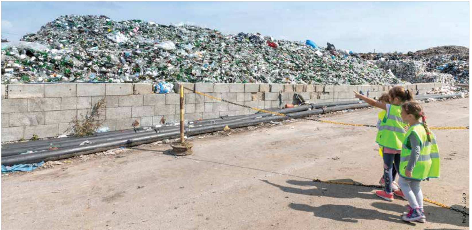
A Depónia rendszeresen szervez nyílt napot a családi hulladéklerakó telepén, a járványt követően újra lesz majd erre lehetőség

„ programpontunknál másként értelmeztük ezt a láthatatlan hulladékot: olyan gyümölcsökből főztünk lekvárt, amelyek más esetben lehet, hogy a szemétkosárba végeznék. Elmentünk a piacra, hogy vásároljunk, de amikor elmondtuk, hogy a hulladékcsökkentési hétre készítettünk feldolgozott termékeket és olyan gyümölcsöt keresünk, ami a szemétkosárba ki,