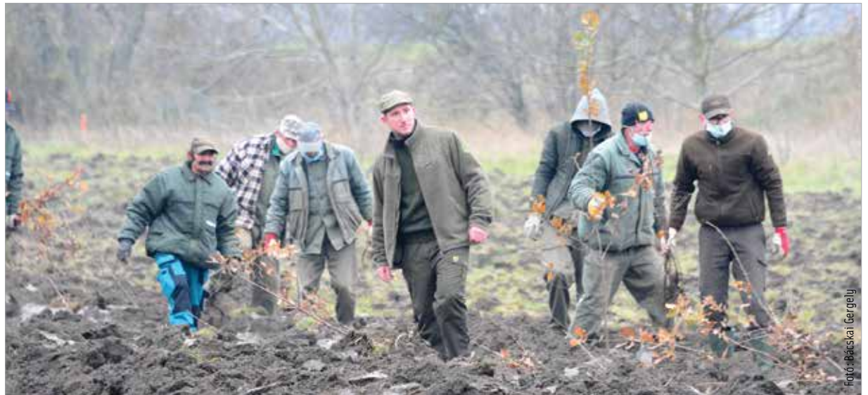
A most elültetett fák tíz-tizenöt év múlva alkotnak lombos erdőt