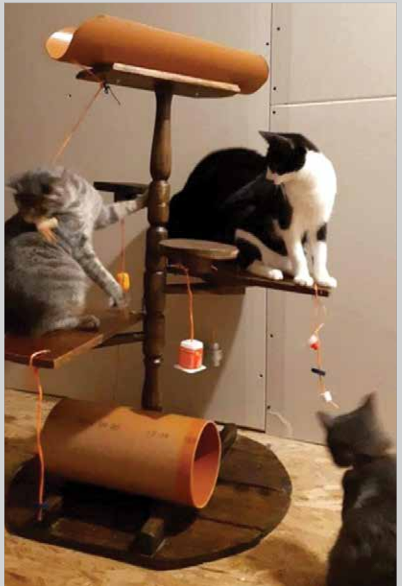
2. helyezett: Hedlicska Ágnes – „Cicajátszóter”