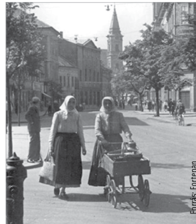
Hazafelé a piacról valamikor a hatvanas években

A helyi legenda úgy tartja: aki megsimogatja az orrát, annak szerencséje lesz, ezért a szobor orra az évek során kifényesedett. Az egykori fertályos asszony családja is mindig megáll a szobornál, de ők nem az orrát, hanem a kezét szokták megsimítani.