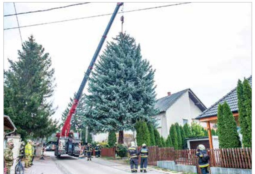
Miután kivágták a tűzoltók az ezüstfenyőt, a katonaság egyik kamionjára rögzítették és a fővárosba szállították azt