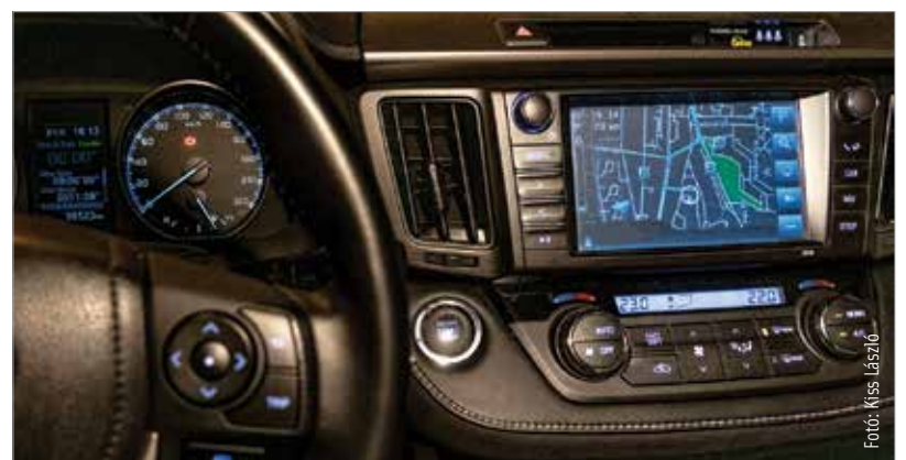
A számítógép az autóban is átveszi az irányítást?

Az újításra azért van szükség, mert ezek a felszerelések csökkentik a közúti balesetből származó halálesetek számát, segítve a fáradt vagy figyelmetlen sofőrt a veszély érzékelésében. Az intelligens sebességszabályzó rendszer például térkép és közlekedési táblák alapján figyelmezteti a sofőrt, ha túllépi a sebességkorlátozást. Ugyanakkor nem korlátozza a sebességet, és a sofőr bármikor kikapcsolhatja. Az új személyautókba fejlett vészfékező rendszer és vészhelyzetben működésbe lépő sávartó rendszert is be kell majd szerelni. A legtöbb fenti technológia bevezetése az új modellekben már 2022 májusától, 2024-től pedig az összes létező modellben kötelező.