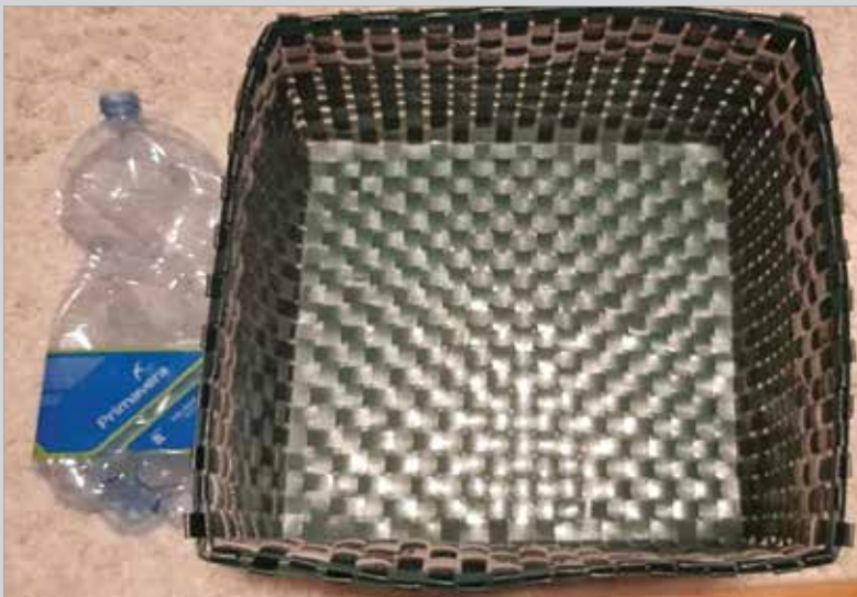
1. helyezett: Balogné Szórád Gizella – „Használt pántolászalagból kosár”