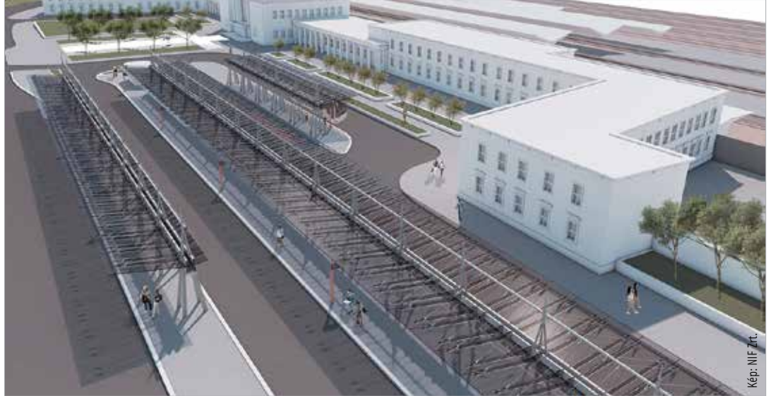
A buszmegálló vázlati terve

Két területen is létesül nagyobb kapacitású parkoló: a vasút déli oldalán, a gyalogos-felül-