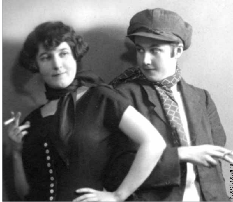
A fehérvári kéj nőket rendszeresen ellenőrizte orvos (képünk illusztráció)

1863-ban a helytartótanács a korabeli viszonylatban tetemes összeget, 1786 krajcárt fordított a szifilisz betegek kezelésére. (Az előző években ennek csak a harmadát.) Városunkban az új, Budai úti kórház pácienseinek nagy része is ezzel a betegséggel küzdött. A helyzeten valamelyes javíthatott az