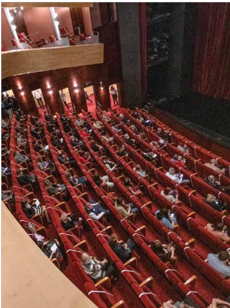
Már a szerdai balettszínházi előadást is az új rendelet előírásai szerint tartották meg

Fehérváron már elkezdtek kidolgozni a helyi buszok járatsűrítésének tervét: a járatszámokat az utazók számának figyelembevételével növelik