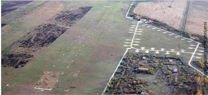
A börgöndi reptér az állam és a város közös fejlesztése