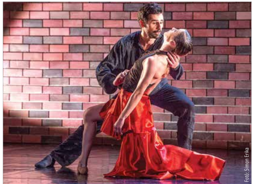
Don José a gyönyörű, ámde csélcsep Carmen hálójában