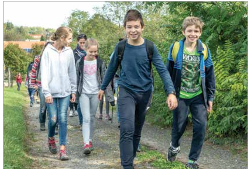
Szaporán szedték a gyerekek a lábukat, mert nemcsak tizennégy kilométer volt előttük, hanem egy mini erdei koncert is