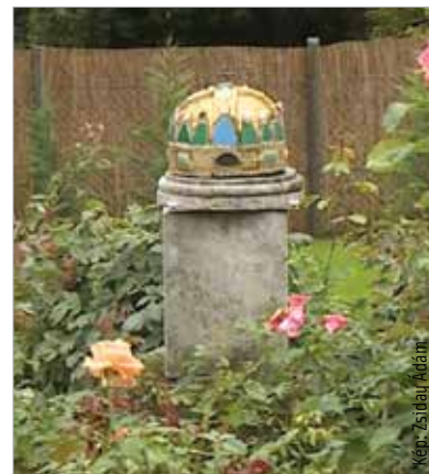
A Bory Jenő által tervezett emlékmű egy része, a mozaikkal kirakott Szent Korona ma a Bory-várban látható

„Állítsuk helyre azt az emlékművet, amivel a város lakossága tisztelgett a Nemzeti Hadsereg és Horthy Miklós fővezér előtt!” – fogalmazta meg a petíció lényegét annak egyik ötletgazdája, Kónyi-Kiss Botond, a Hatvannégy Vármegye Ifjúsági Mozgalom alelnöke. A szervezet a Fejér Szövetséggel együttműködve állítaná vissza az 1946-ban lerombolt emlékművet. Ennek kapcsán egy éve gyűjtöttek aláírásokat. A petíciót az október 19-én, hétfőn öt órakor a maroshegyi székelykapunál tartandó megemlékezést követően mind a városi, mind a megyei