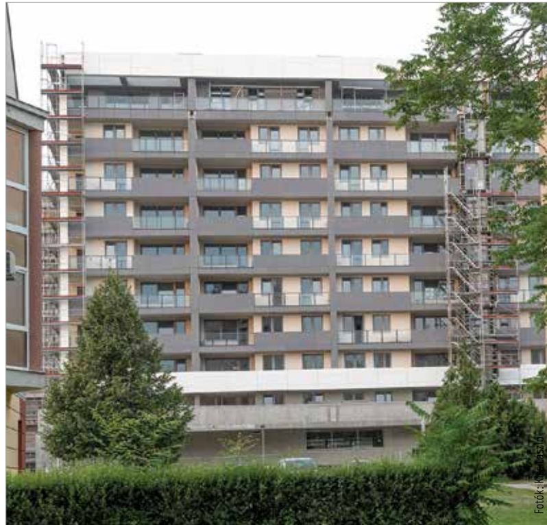
Fehérváron nagyon sok új építésű ingatlan van, a kedvezményes áfa hatására még több várható

A kormány előzőleg 2015 decemberében döntött az új lakások