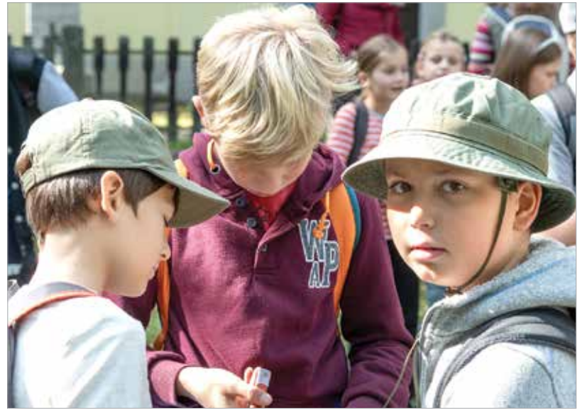
Találkozó a gánti templom előtt