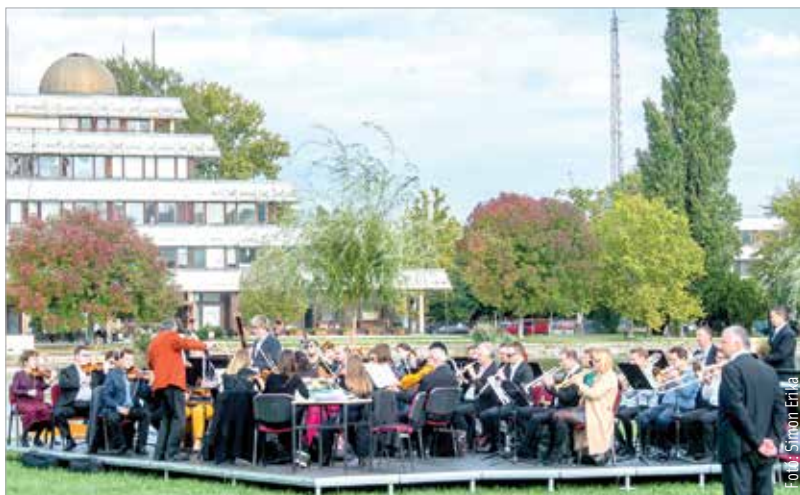
Méltó helyszín volt a Csónakázó-tó a szimfonikusok koncertjéhez

nem tudjuk elindítani a Partitúra bérletsorozatunkat az ifjúság számára. Az oka, hogy a koronavírus-járvány időszakában az iskolák nem tudják elhozni a gyermekeket a koncertekre a Vörösmarty Színházba. Ezért döntöttünk úgy, hogy a szabadban, a Csónakázó-tó szigetén fogunk találkozni, és klasszikus zenével örvendeztetjük meg őket. Karakterdarabokat játszottunk a koncerten, melyeket egy olyan témakör köré fűztünk, ami mindenkit érdekel és érint: az otthon és a család. A darabokban egy család életét jelentettük meg zenés formában.”