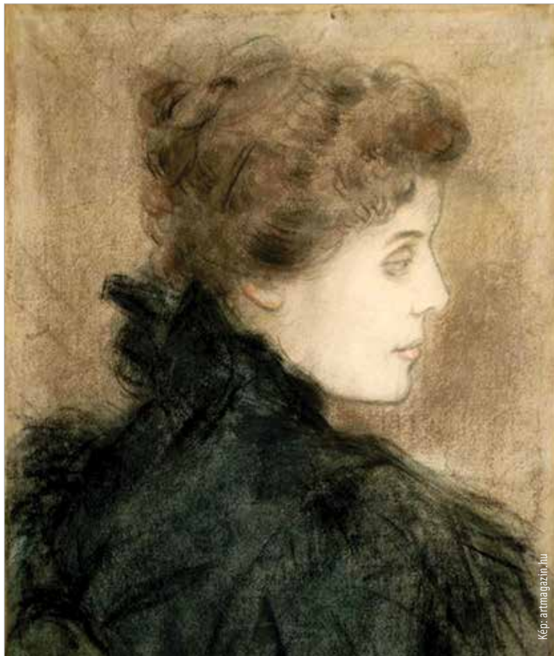
Rippl-Rónai József: Gróf Andrassy Tivadarné Zichy Eleonóra portréja (1896)

A kiegyezés évében született. Alig múlt tizennyolc éves, amikor a kegyeiért tolongó ifjak közül a „szép akasztott” id. Andrassy Gyula idősebb fia, Tivadar nyerte el a kezét. És akkor kiderült, hogy nem áll készen az asszonyi lét testiségi oldalának megtapasztalására. A rá váró szüléseket is megalázóan tartotta. Talán azért bánt szigorúan, majdhogynem kegyetlenül leányával, hogy büntesse őket női létükért. Feltűnő távolságtartással viszonyult gyermekeihez. Az úri társaság visszaemlékezései szerint a vendégeket is kínos helyzetbe hozta azzal, ahogyan jelenlétükben bánt a gyermekeivel. A lányokat alulöltöztette, a legnagyobb hidegben is lenge ruhát adott rájuk, kesztyűt, harisnyát nem viselhettek, egyfolytában fáztak. Jéghideg patakban kellett futniuk mezítláb valamiféle kúra jegyében. Csak a szobáikban étkezhetek elkülönülve. Híre ment a nádpálca gyakori használatának is. Prúd édesanyjuk betegesen féltette leányait a könyvekben megírt érzelmek megismerésétől: a klasszikusok kötetiben áthúzta azokat a sorokat, amelyeket nem olvashattak el, összevarrta azokat a lapokat, amelyek bármilyen érzelmekről szóltak. Valószínűleg a gyermekkori traumák