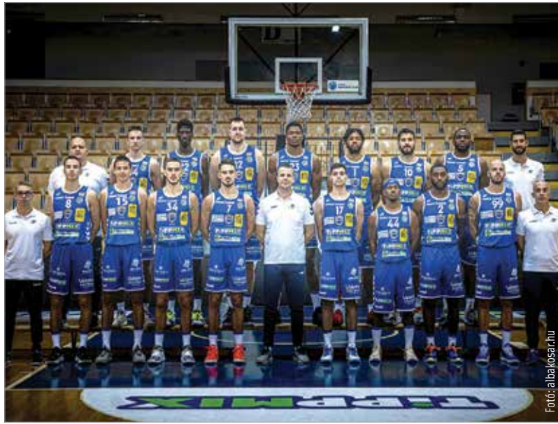
Ez a teljes fehérvári keret – egy ideig még biztos nem lesz mindenki bevethető

Az Alba kérte a mérkőzés elhalasztását, amihez az ellenfélnek kellett volna hozzájárulnia, de nem tette. „A szövetség előírhat halasztást abban az esetben, ha tizenkét játékgendélyvel rendelkező játékosból nincs nyolc, aki játékra alkalmas állapotban van.