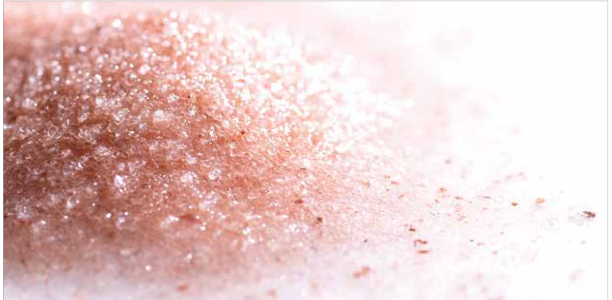
A sóoldat párája jól tesz a légzőszerveknek

Az egyik legegészségesebb párasítási módszer a sós vizes párologtatás, nem véletlenül alkalmazzák a sóbarlangokban is, mint terápiát. Az otthonunkban is alkalmazzuk bátran! Kruppoknak, asztmásoknak, allergiásoknak is sokkal szerencsésebb választás hidegen párasítani, mint meleg folyadékkal gőzölni tele a szobát. Igaz ez a baba-szobákra is. A sós levegő segít tisztán tartani a légutakat. Tegyük egy edénybe tengeri sót és nagyjából háromszor annyi vizet. Helyezzük az edényt asztalra vagy szekrényre. Nem árt egy tálcát is tenni alá, mert a levegőből a sókristályok nemcsak az edény falára, hanem a környezetére is kicsapódnak. A könyvespolc tehát ebből a szempontból nem a legjobb választás!