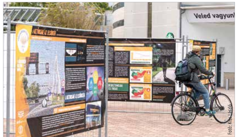
A figyelemfelhívó plakátok online is elérhetők az akozlekedesikulturarnapja.hu oldalon

és előzékeny emberek között nemcsak jó érzés közlekedni, de biztonságosabb is. Ennek felismerése vezetett oda, hogy a szaktárca és társszervezetei a civilekkel karöltve először 2015-ben kezdeményezték a közlekedési kultúra napja című esemény megrendezését, melynek keretein belül a Közlekedéstudományi Egyesület vándor-plakátkiállítást szervezett. A Palotai Kapu téren a különböző közlekedésben érintett szervezetek eredményeit, fontos információit láthatják az érdeklődők. A kültéri installáció október nyolcadikáig látogatható.