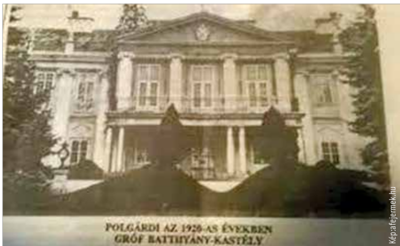
Polgárdi a családi összetartozás biztonságát nyújtotta az Andrássyak számára. Ilyen volt a kastély az 1920-as években.

vályogtörmelék és hat vörösmárvány oszlop maradt meg. A sír környékén katonai lövészárkok, mély gödrök. A sírkövet elmozdították.” A kastélykerti sírdombon ma is megtalálható az elmozdított két lap, rajtuk egy-egy kereszt és egy felirat Zichy Eleonóra halványuló nevével. Az újratemetett családtagok egyike lenne tehát Zichy Eleonóra, a sírfülkét takaró márvány előlap azonban ma még felirat nélküli. Minden sírtábla takar egy izgalmas, lezárt életet. Zichy Eleonórák budapesti sírjából exhumálva a szeretett Polgárdiba, férje mellé temették el leányai a falu részvételével a háborút követő vérzivataros hónapokban. A „szép akasztott” menyé talán csak azért jött a világra – éppen a kiegyezés évében – hogy tehetségével és szépségével az Andrásy család fényét emelje!