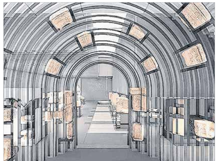
Így mutatják majd be a valamikori koronázobazilika megmaradt köveit a bazilikatörténeti kiállítóhelyen

A beruházás az Árpád-ház-programban betöltött helye mellett egy korábbi ígéret megvalósulását, a volt Köztársaság mozi épületének megmentését is jelenti. Az 1937 és 39 között Hübner Tibor tervei alapján épült egykori Alba, majd Köztársaság mozi és bérház ma már rendkívül rossz állapotban van. Így elsőként a pince és az afölötti födém megerősítése illetve a beázásmentesség biztosítása miatt a tető megerősítése kerül sorra. A belső terek is teljesen átalakulnak majd, és kiegészítő parkolók is létesülnek a központ látogatóinak jobb kiszolgálására. Az egykori moziépület belmagasságát kihasználva létesül egy különleges kiállítóter, mely huszonegyedik századi technikai megoldásokkal lehetőséget ad az egykori bazilika tömbjének bemutatására: a megmaradt kövek és az azok kiegészítésére szolgáló installációk révén ismerhetik meg a látogatók a Székesfehérvár történelmében oly fontos Szent István-i korszakot.