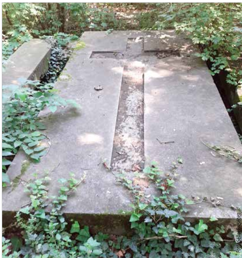
A polgárdi temetőben híres Batthyány és Andrassy családtagok nyugszanak

volt. Édesapja így jellemezte őt: „Az én fiam, ki eddig mindig csak a szülői házban tartózkodott, talán kevésbé fejlődött ki, mint más ifjak, kik már a világban forgolódtak. Talán túlzottan szerény, semmitől nem fél annyira, mint hogy elkápráztasson. Tehetséges, megbízható, gentleman. Hajlama komoly, mélyen olvas és tanulni szeret...” Így már érthető a késői házasság. Andrassy Gyula a békeévek egyik vezető magyar politikusa. Hosszú ideig Ferenc József személye körüli miniszter, 1906 és 1910 között a belügyi tárca birtokosa. Pályája csúcspontja volt, amikor 1918. október 24-én elfoglalhata apja korábbi posztját, és hat napra, a monarchia felbomlásáig külügyminiszter lett. Politikai ellenfele, Andrassy Katinka férje, Károlyi Mihály szépen emlékezett rá: „Apósom jól ismerte és gyűjtötte az olasz reneszánsz mesterműveit. A dunai rakpartra néző szalonja tele volt a quattrocento és a cinquecento festményeivel és más korszakokból való művekkel is. Szeretett ott ülni a félhomályban, ahol csak a képek fölé helyezett rüdlámpák világítottak, és hosszú, vékony lábait törökösen maga alá húzva megosztott figyelemmel hallgatta a körülötte zajló beszélgetéseket. Az ő véleménye megfellebbezhetetlen volt, akár politikai, akár etikai vagy művészeti kérdésekről folyt a vita. A családból soha senkinek nem jutott eszébe, hogy ellentmondjon neki. Nem félelemből, mert szelíd és finom ember volt, hanem csodá-