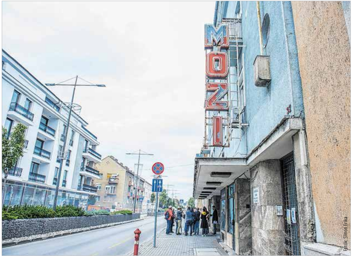
A régi moziépület 2022-ben új életre kel