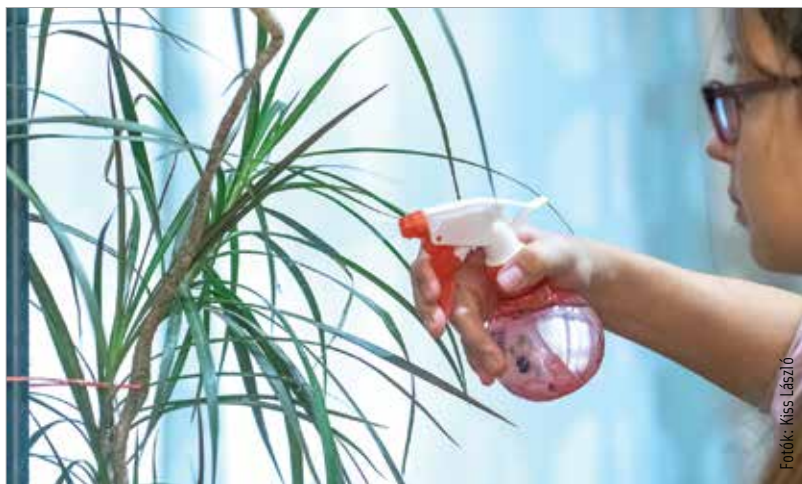
Frissítsük fel a növények leveleit vízpermettel!

A radiátorra, konvektorra teríthetünk nedves, tiszta törölközőt, de helyezhetünk rá egy dekoratív, vízzel teli edényt is. A lényeg, hogy rendszeresen cseréljük, tartsuk tisztán, hogy ne telepedjen meg benne a por. Fokoz-