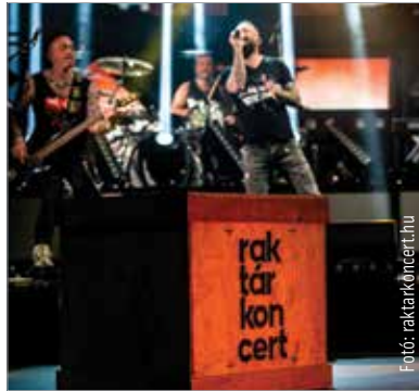
A koncertek már elérhetők a raktarkoncert.hu oldalon

A hazai könnyűzenei ipar támogatására indított koncertsorozat, a Raktárkoncert felvételei már augusztus közepe óta zajlanak. A közönség szeptember 21-étől már teljes egészében láthatja a digitálisan közvetített rendezvény-sorozatot. A projektet koordináló Lounge Group-nál hatalmas apparátus dolgozik azon, hogy a projekt bevonuljon minden idők legnagyobb magyarországi koncertjeinek csarnokába.