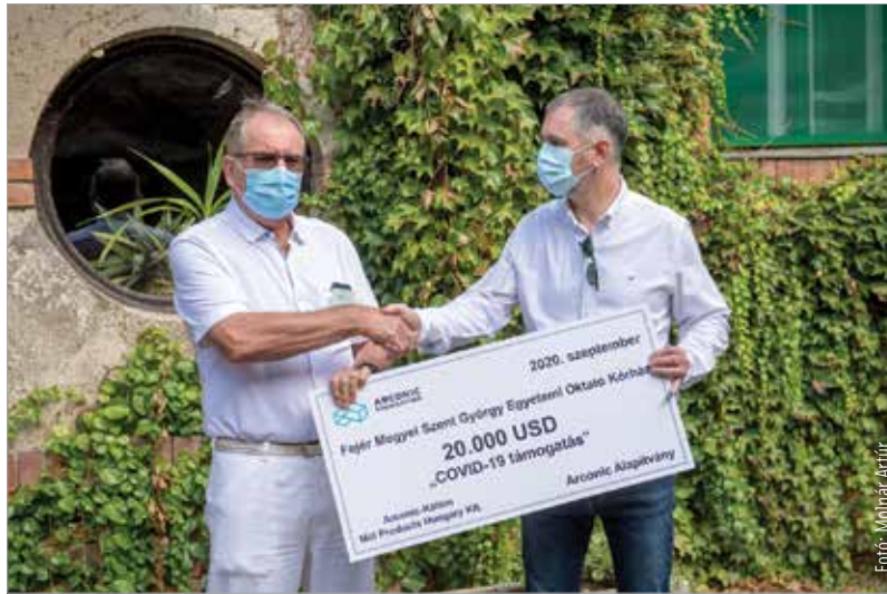
Húszezer dolláros támogatást kapott a Szent György Kórház az Arconic-Köfém Mill Products Hungary Kft. jóvoltából. Ebből egy olyan felületfertőtlenítő berendezést vásárolnak, ami a COVID-részleg fertőtlenítését és vírusmentesítését szolgálja.

Megjelent a jogszabály, miszerint október elsejétől az iskolák mellett az óvodákban is köteles mindenki alávetni magát belépéskor a testhőmérséklet-mérésnek. A gyermekek mellett ez az intézménybe belépésre jogosult valamennyi felnőtt személyre is vonatkozik. A Volánbusz Zrt. is szigorított: a buszvezetők mostantól nem engedik felszállni azokat az utasokat, akik nem viselnek orrot és szájat eltakaró maszkot.