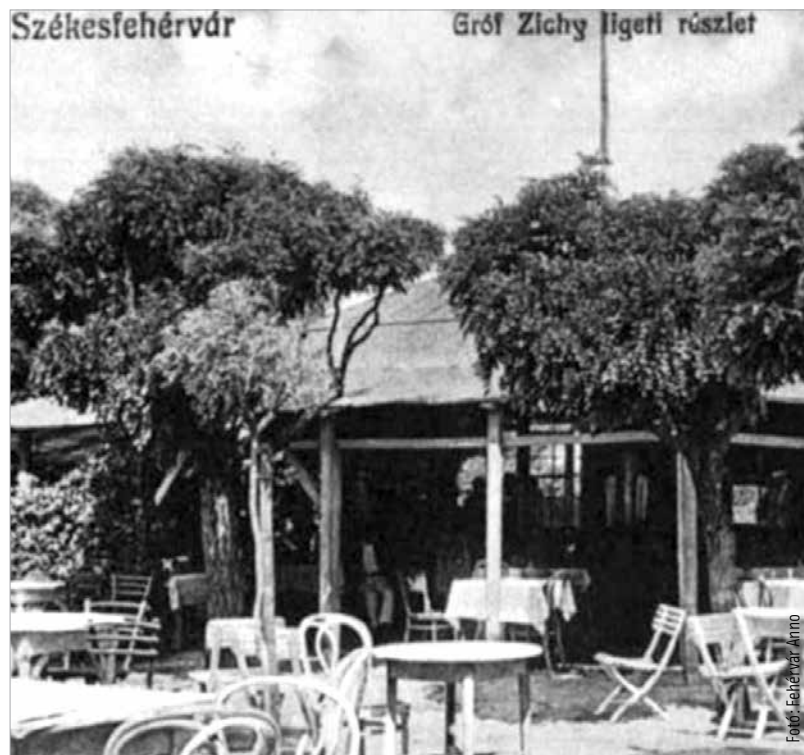
Az örömlányok mozgását szabályozták. Nem mehettek például közparkokba.

Minden tiltakozás ellenére azért az I. világháború utáni román megszállásakor nem volt rossz dolog, hogy a városban működtek piros lámpás házak. A román tiszték hírhedtek voltak kicsapongásaikról. Egyik este a Magyar Királyban vacsoráztak, amikor az est hevében azt követelték a fehérvári rendőröktől, hogy hozzanak nekik hölgyeket, mert különben a lányokat, asszonyokat fogdossák végig. A rendőrkapitány gyorsan megoldotta a kérdést: felkereste az egyik bordélyt, és hozta is a kéjnéket, akik, ha közvetetten is, de megmentették a fehérvári lányokat, asszonyokat.