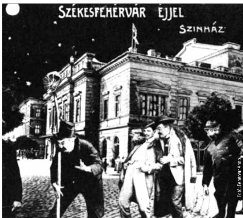
Egy humoros képeslap a fehérvári éjszakai életről

hogy 1945 előtt Fehérváron több bordélyház is ezen a környéken működött.