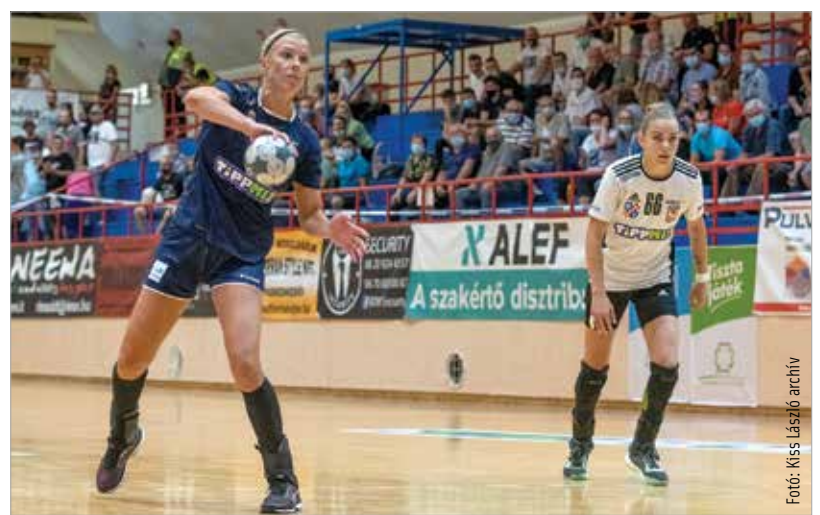
A fehérvári lányok csütörtökön Balatonbogláron javíthatnak!

A fordulás után a vendégek sokkal jobban védekeztek, és Herczeg kapus is remek védekeket mutatott be. Ez el is bizonytalanította a fehérvári lövőket, így a hajrára olyan előnnyel érkeztek a vendégek, hogy nem volt kérdés Tilingerék győzelmére: végül 31-27-nél érte a dudaszó a csapatokat. A játék képe alapján a fehérváriak jövője egyáltalán nem kilátástalan, egy-két mozaikdarabnak kell még a helyére kerülnie elől és hátul is ahhoz, hogy jöjjenek az eredmények. Ebből csütörtökön, a Boglári Akadémia-SZISE otthonában a remények szerint látszik is már valami!