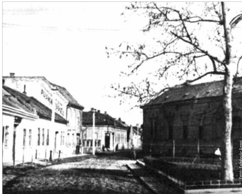
Az Ósz utca a 1930-as években

A történeti hűséghez hozzátartozik, hogy addigra a hölgyek már nem úzhették hivatalosan a legősibb mesterséget, de az kétségtelen,