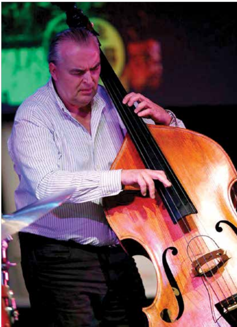
Nagybőgő nélkül nincs dzsesszmuzsika

Volt már olyan, hogy csalódtam, és ez nemcsak szakmai, hanem emberi kérdés is. Egy zenekarnak nagyon fontos, hogy jó emberek alkossák, nem elég, ha valaki csak jó zenész. Ilyen a mi utunk!