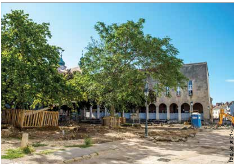
Az uniós forrásból támogatott munkálatok a Bartók Béla tér szabadtér-építészeti megújítása mellett a Csók István Képtár árkádorrá is kiterjednek, amit az önkormányzat saját forrásból finanszíroz. A kivitelezési munkák régészeti megfigyelés mellett zajlanak – hasonlóan az első ütemhez.

burkolt felület épségének megőrzése érdekében. A projekt tervezőivel – és a városi főépítéssel – egyeztetve az a döntés született, hogy a balesetek elkerülése érdekében a tér belső területén a gépjárművel való áthaladás nem lesz megengedett. Az eredeti tervekhez képest a leglényegesebb változás, hogy a feltárt pincék, járatok felett egységesen teherelosztó vasbeton lemez készül. A műszaki akadályok elhárultak, a kivitelezés tovább folytatódik. (Forrás: ÖKK)