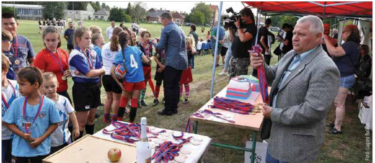
A jubileumi eseményen résztvevő utánpótlás elnézve a fehérvári rögbi jövője is lehet a múlthoz hasonlóan eredményes