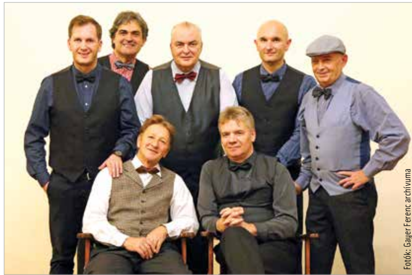
A Budapest Ragtime Band nemcsak jó zenészekből, hanem jó emberekből áll