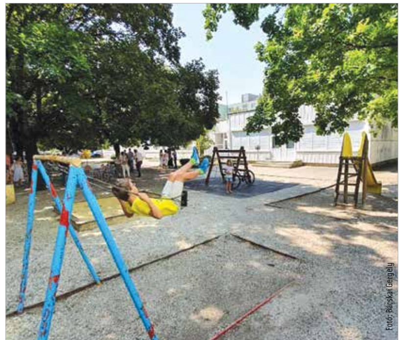
Az előzetes tervek alapján jövő márciusig befejezik a felújítást mind az öt óvoda udvarán

rekortán burkolat, és megérkeztek a játszóeszközök is. Az Arpád Úti Óvodában kettéosztották az udvart: az egyik felén elkezdték elbontani a balesetveszélyes eszközöket, így már ott is előkészítési munkálatok zajlanak a felújításhoz. Az ütemezési terv szerint a Napsugár és a Szivárvány Óvodában ezután kezdenek el dolgozni a kivitelezők. (Forrás: ÖKK)