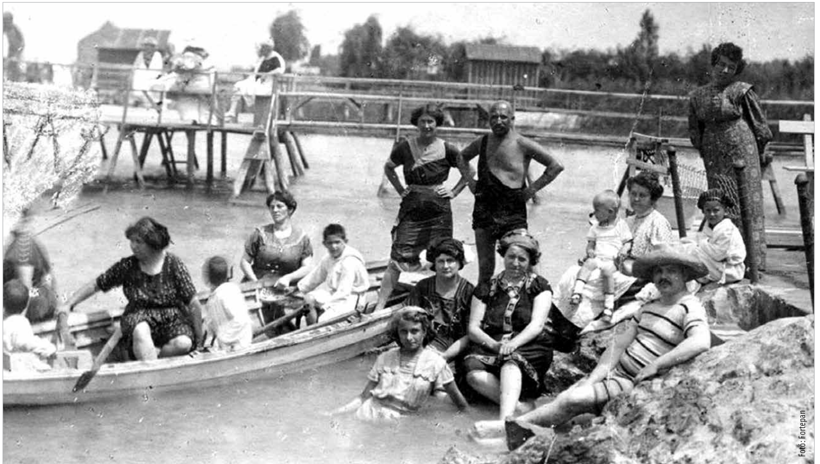
Balatonai fürdőzők a huszadik század elején

kálást a templom környékén. Az összeverődő gavallérok most már azon vetélkedtek, hogy ki küldje el leghamarabb párbajsegédét a kemény főbíró nyakára ... öklelő bajszú tűzmesterek feszítették mellüket a savanyúvizes kút körül, a postaszekér tucat számra hozta a megrendelt pisztolyokat. De a főbíró nem engedett... Blaháné mosolyában élt a magyar női lélek. Blaháné mosolya volt generációnként át minden magyar nőnek, ha tetszeni akart, így mosolyogtak a grófnők, akiket az oregebb Andrássy Gyula porgett az udvari bálokon és így mosolyogtak Tisza Kálmán idejében a Szervita téren a virágáruslányok, akik majdnem grófné lettek. Sok színész nő röp-pent fel a színpaddeszákra, amíg Blaháné hetven esztendő lett. Sokan egyeztettek a botrányt és egyéb feltűnőséget tehetségükkel, hogy