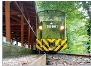
Nyissunk a környék természeti látványosságai felé is, és ahol lehet, járjuk be kisvasúttal az erdőt!

Kezdjük például az ópusztaszeri Nemzeti Történelmi Emlékparkban! A titokzatos krónikás, Anonymus leírása szerint a honfoglaló