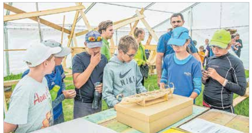
A gyerekek a túra végén a régészeti parkban épülő római kori gályát is megnézték. Egykoron ilyenekkel is hajóztak a Nádor-csatorna elődjén.