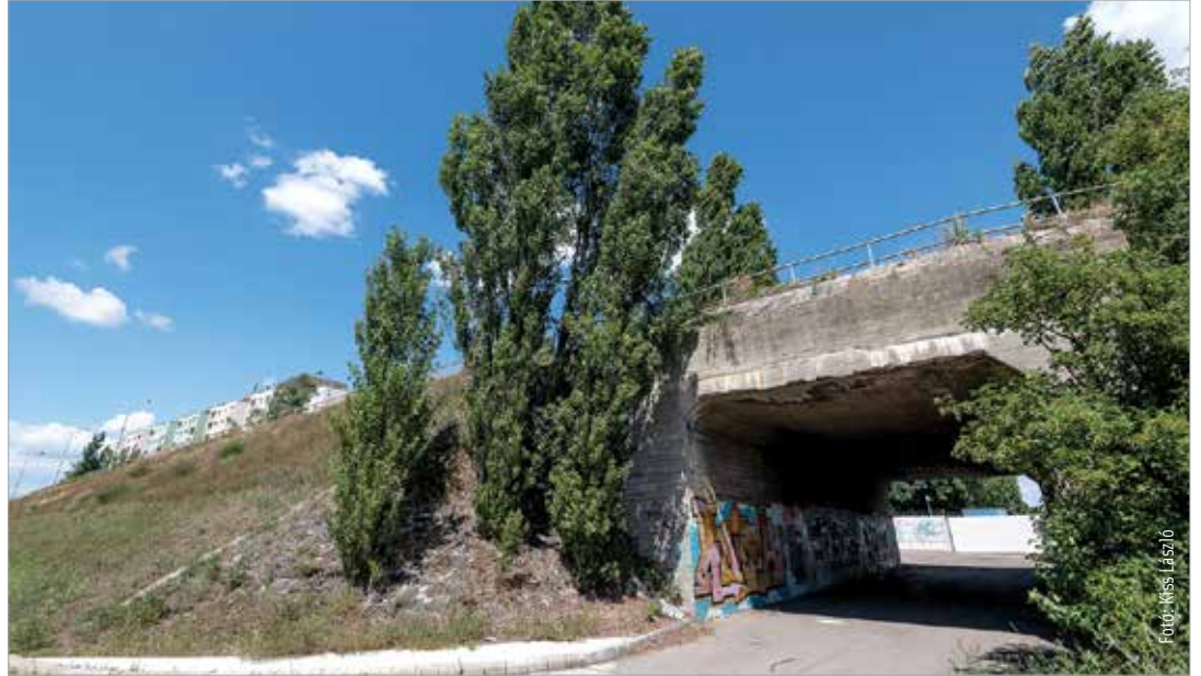
Augusztus végéig nem használható a felüljáró, de az iskolai tanítás kezdetére a tervek szerint befejezik a felújítást

„Komoly megerősítése történik a szerkezetnek, magának az útpályának. Új burkolatot, szegélyeket és vízelvezetést kap. Újraépül a járdarendszer, ami toldása volt a felüljárónak, hiszen eredetileg nem volt rajta. Szakemberek szerint itt van a legnagyobb probléma: a szerkezet megy szét.” – mondta el Székesfehérvár polgármestere.