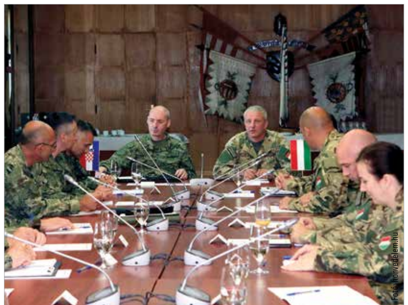
A parancsnokság augusztustól már a horvátokkal kiegészülve nemzetközi katonai szervezetként folytatja feladatait

parancsnokság és egy regionális különleges műveleti parancsnokság létrehozását, amire több mint hárommilliárd forintot biztosít a magyar kormány. A székesfehérvári központtal felálló parancsnokság feladata a térség stabilitásának, a békének a megőrzése, ha pedig a térségben bármilyen konfliktus kialakulna, akkor irányítaná a műveleti tevékenységet. Létszáma várhatóan hetven fő körül lesz.