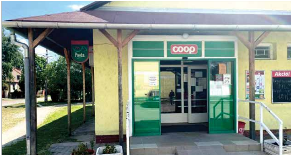
A posta várhatóan július huszadikán nyit, és hétfőtől péntekig reggel nyolctól este hatig várja az ügyfeleket

Az újranitás mellett régi igényük az itt élőknek, hogy bővüljön a jelenleg az egyik áruházlánc tulajdo-