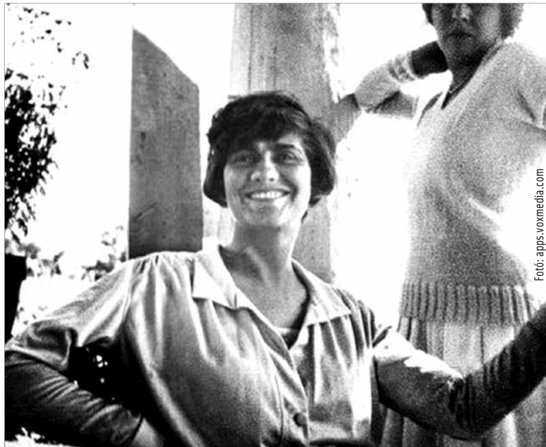
Coco Chanel divattá tette a barnaságot, miután túl sok nap érte a cannes-i jachtúton, és ragyogó bőrrel tért vissza. Barátja, Jean-Louis de Faucigny-Lucigne herceg azt mondta erről: „Azt hiszem, talán feltalálta a napozást. Abban az időben mindent kitalált.”

Volt idő, amikor mindent megtettünk azért, hogy hófehérek maradjunk, egy pici napfény se piríthassa le bőrünket. Szorongattuk napernyőinket és olyan ruhadarabokba bújtunk, amelyen a napnak esélye sem volt bekukkantania. Olomfestékkel fehéritettük bőrünket, nem törődve a mérgeanyagokkal. A lényeg, hogy fehérségünk eleganciát sugározzon! A drasztikus fehérség eléréseért más horrorisztikus eszközökhöz is nyúltak a hölgyek. A közép-korban már púderrel fehéritették magukat, de képesek voltak a vénáikat kékre festeni a kontrasztosabb megjelenés érdekében. Az előkelő hölgyek olykor eret is vágtak magukon: