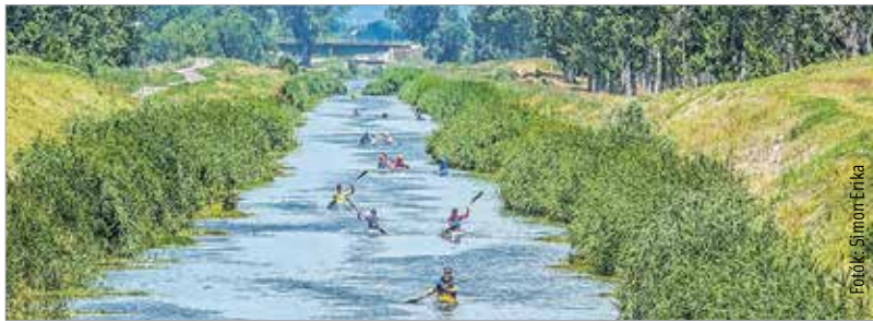
A kisebbek kenuval, a tapasztaltabbak kajakokkal vágta neki a majd tíz kilométeres túrának

Egy a római korban még létező vízi útvonalon, kajakokkal indult el kedden egy csapatnyi gyerek Gorsiumba. A programot a Vital Club Sportegyesület szervezte – egyfajta időutazásra invitálták a sportolókat. A közel tíz kilométeres túra a Nádor-csatornán számtalan érdekességet tartogatott, a végén pedig a régészeti parkban készülő római gályát is megnézték a gyerekek. A tervek szerint a jövőben akár rendszeresek is lehetnek a mostanihoz hasonló túrák.