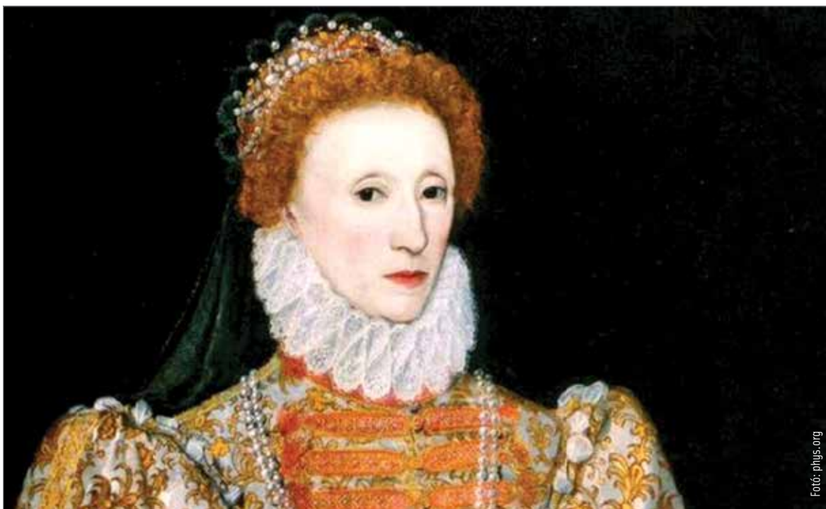
I. Erzsébetet minden képen sápadt-fehérnek ábrázolták

a fogorvosoktól való félelme ahhoz vezetett, hogy fogai tönkrementek és kihullottak, emiatt a külföldi diplomaták nehezen értették a beszédét. A kozmetikai ölommérgezésnek azonban csak 1760-ban lett először dokumentált áldozata: egy ír nemesasszony, Marie Gunning, aki híres volt porcelánszerű bőréről. Habár bizonyítottá vált, hogy a fehérség elérése érdekében használt oldat hosszú távon halálos, a trend sokáig nem változott, s a készítmények sem újultak meg.