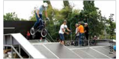
A pályán a sisak kötelező, és erősen ajánlott a különböző védőeszközök használata is!

Kiseb felújítás után újra várja az extrém sportok kedvelőit a Bregyó közti sportcentrum BMX- és gördeszkapályája. A Városgondnokság szakemberei az elemek borítását cserélték ki, ahol szükséges volt. A pálya a nyári szünetben minden nap reggel kilenc és este kilenc között tart nyitva.