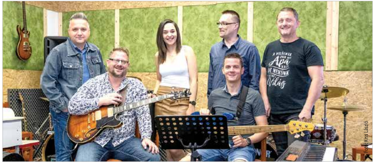
A Hangvilla állandó zenekara már készül az első műsorra

A Hangvilla hétfőként este fél hétkor jelentkezik a Fehérvár Televízióban, első ízben június tizenötödikén.