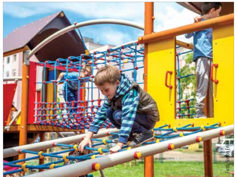
A nagy játszótérben a gyerekek kedvükre mászhatnak, csúszhatnak

a kerítésen kívülről csodálhatták az új birodalmukat. A területen a legmodernebb megoldások kaptak helyet, melyek közül néhány csak ezen a játszótéren van. Ilyen például az a kaptár, amivel egyensúlyukat fejleszthetik a legkisebbek. Ezenkívül egyedi játszótér, baba-mama hinta, többfunkciós, öntött gumból készült felület, rajztáblák és trambulín is helyet kapott, de kialakítottak egy napvitorlával fedett, pados pihenősarkot is. A fejlesztés mintegy ötvenmillió forintból valósult meg.