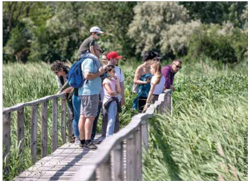
A turisták a városok helyett idén szívesebben látogatnak természetközeli helyekre, ezért Fehérváron a Sóstóra is terveznek több turisztikai programot is