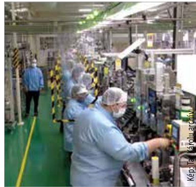
A Densóban több ezer munkahelyet mentettek meg kormányzati támogatással

ezren veszítették el az állásukat, közülük 54 ezren gazdaságilag inaktívvá és 19 ezren munkanélkülivé váltak. Ebben az időszakban átlagosan 174 ezren váltak állásukeresővé Magyarországon. Városunkban március 1. és április 17. között 673 fehérváron élő vagy itt tartózkodó állásukeresőt regisztráltak. A következő héten 277 új fehérvári munkanélkülit regisztráltak. A következő hetekben átlagosan 60-at, majd május második hetében 185-öt. Azóta hetente átlagosan 84-et. A fehérváriak kö-