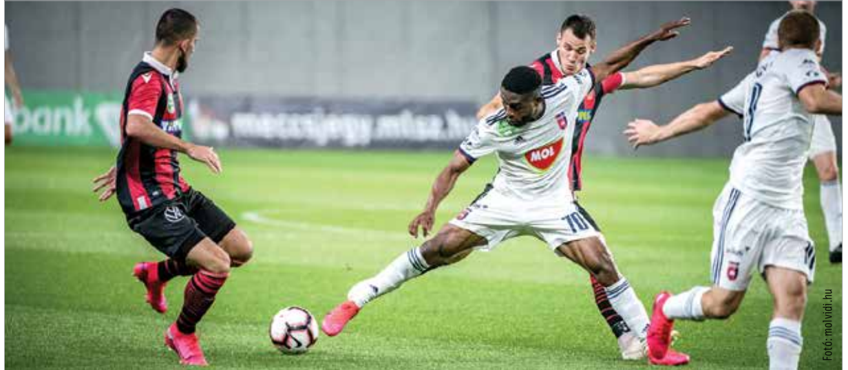
Döntetlennel kellett megelégednie a Vidinek a Honvéd vendégeként

A Mezőkövesd elleni 3-3 a Magyar Kupából való kiesést jelentette, így elúszott a címvédés lehetősége. Pákon szerény, gól nélküli döntetlent játszottak Kovácsék, majd utóbb jött kedden