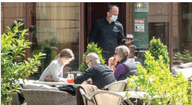
A város mobiltelefonos applikációja az Alba Innovár koordinálásával készült

hivatalos applikációjában legutóbb feltett nem reprezentatív szavazásban arra volt kíváncsi a város önkormányzata, mennyien élnek azzal a lehetőséggel, hogy már be lehet ülni az éttermekbe. Az eredményből az látszik, hogy a kérdőívet kitöltők negyvenkét százaléka még inkább a teraszt választja, ha ebédről vagy kávézásról van szó. A válaszolók negyede azonban nem fél, bátran ül be bármelyik vendéglátóegységbe, ha alkalma van rá. A fennmaradó harminchárom százalék a kérdést csakis az időjárástól teszi függővé, vagyis jó időben a teraszt, rossz időben a benti teret választja.