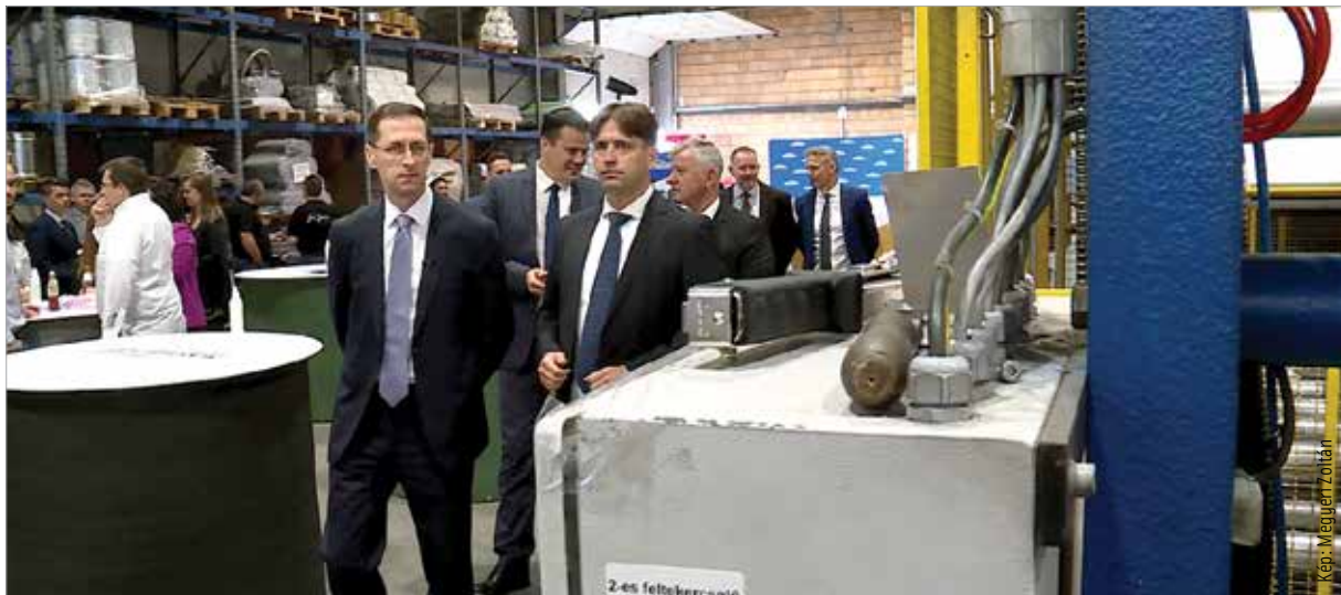
A fejlesztés a meglévő munkahelyek megőrzéséhez és új munkahelyek létesítéséhez is hozzájárul – mondta el lapunknak Varga Mihály pénzügyminiszter

Varga Mihály pénzügyminiszter a támogatási programról elmondta,