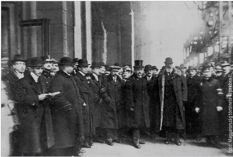
Az Apponyi Albert vezette delegáció elutazása 1920. január ötödikén

Keserű pirula június negyediké mellett november tizenharmadika is, amikor az aláírt békediktátumot a Nemzetgyűlés becikkelyezi és ratifikálja. Egy olyan helyzetből kellett felállni, ami példa nélküli. Ez a tönkretett, agyongyalázott, megcsönkített Magyarország talpra állt, és a húszas évek második felére gyakorlatilag túlszárnyalta az 1914-es gazdasági mutatóit. A gazdaság, a mezőgazdaság helyreállítása, a pénzügyi stabilizáció, az egyre aktívabbá váló magyar külpolitika, a beilleszkedés az európai rendbe, hazánk felvétele a Népszövetségbe mind komoly eredmény! Nem felejthetjük ki a kultúrpolitikát sem, melynek alapjait Klebelsberg Kunó és Hóman Bálint fektette le. Soha nem volt a magyar költségvetésben olyan kiemelt részesedése a kultúrának és az oktatásnak, mint a húszas és harmincas években. Új egyetemeket kellett létrehozni, hiszen a korábbiakat elvették. Ha azt mondjuk, hogy a tatárjárás után fel kellett építeni egy második Magyarországot, akkor kijelenthetjük, hogy Trianon után a magyar politikának egy új honalapítást kellett végigvinnie!