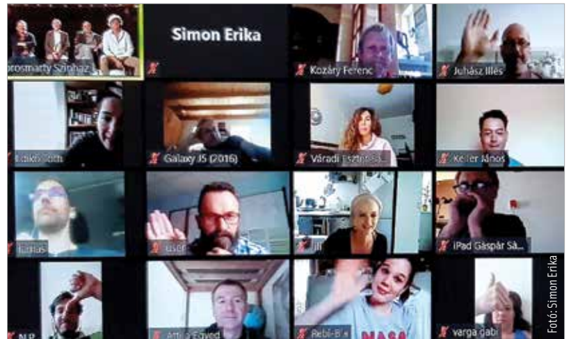
Rövidesen megkezdődik az új évad