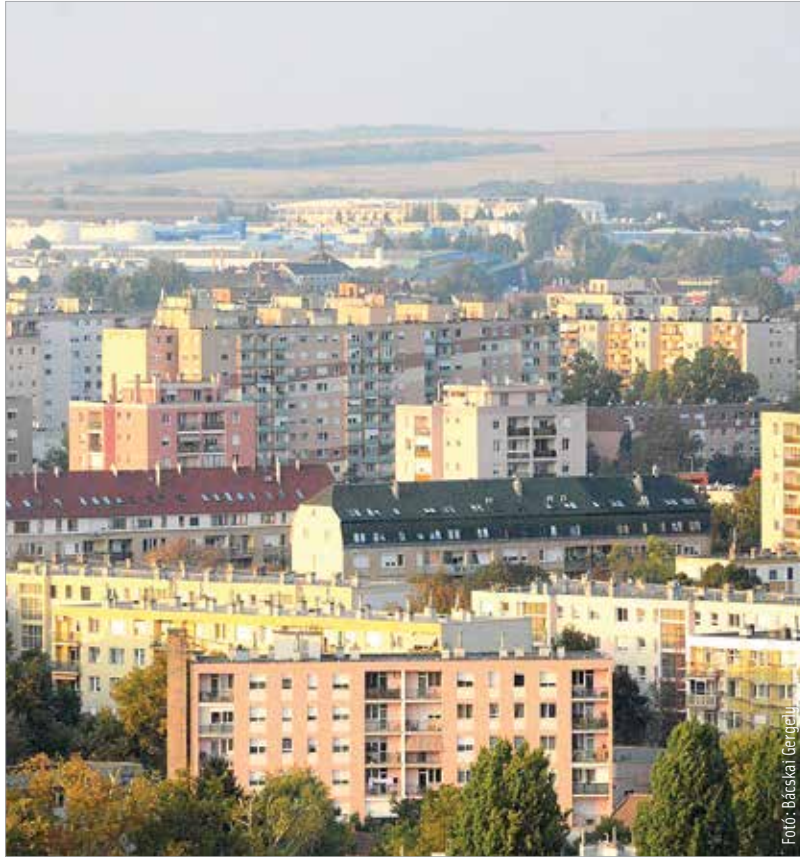
A vidéki nagyvárosok között még mindig élén járunk az ingatlanárakban

Ami az ingatlanárakat illeti, Fejér megyében illetve Fehérvár vonzáskörzetében talán minimális