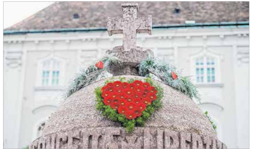
Hét helyszínen dolgoztak a virágkötők: az Anemone Fleur, a Budai 66 Virág-Ajándék, az Oázis Virágüzlet, a Hortenzia Virágszalón, a Tűzvirág Virág-Ajándék, a Virág-Vár Virágüzlet és a Syl De Fleur Virág-Ajándék munkatársai által készített kompozíciókat az Országalmánál, a Tip-Top előtt, a Ciszter templom bejáratánál, az Igézőnél, a Varkocs-szobornál és az Országzászló téren láthatták az arra sétálók.

Az idei pünkösdi virágcsodák közül a látogatók az Anemone Fleur virágüzlet kompozícióját tartották a legszebbnek, a Székesfehérvár applikációban erre voksoltak a legtöbben. A második helyen a VirágVár Varkocs-szobornál látható alkotása, a harmadik helyen pedig a Budai 66. díszítése végzett, mely az Országalmát öltöztette ünneplőbe.