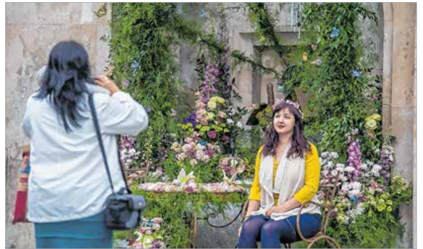
Íme, a győztes kompozíció!