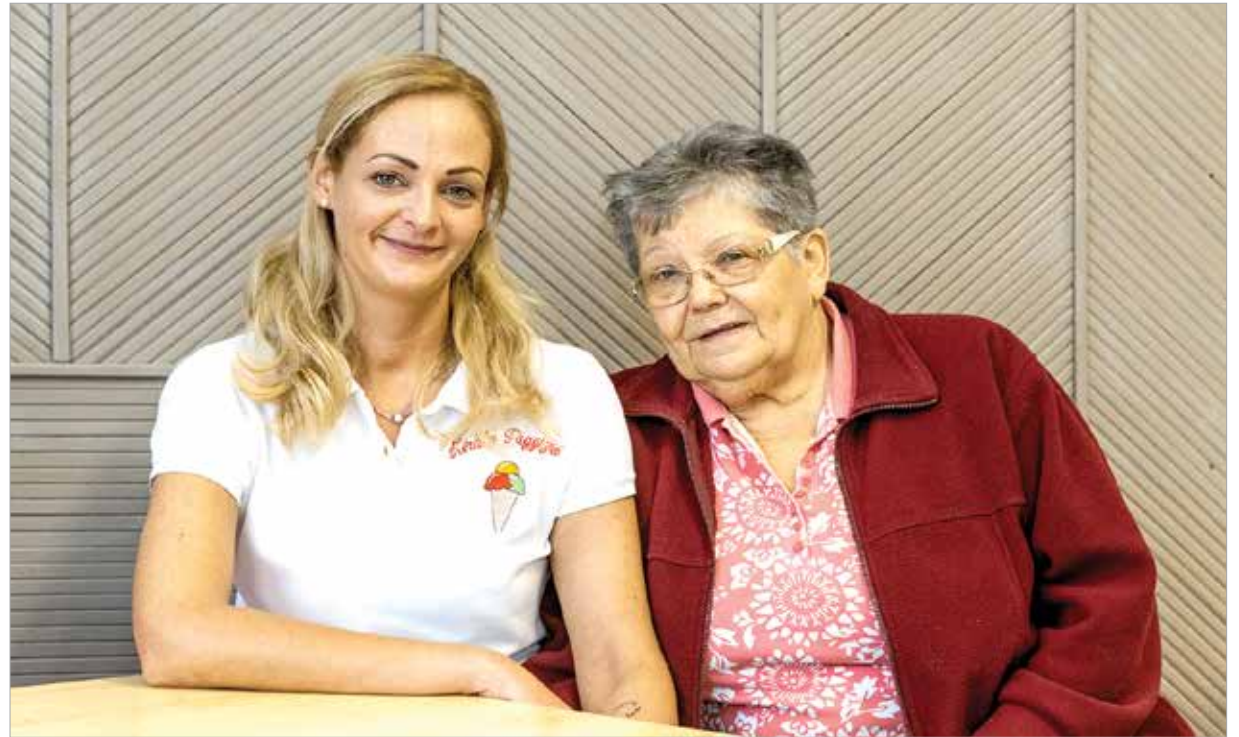
Unoka és a nagymama – egy család, egy hivatás

Nekem öröm, ha valaki továbbviszi a szakmát!”