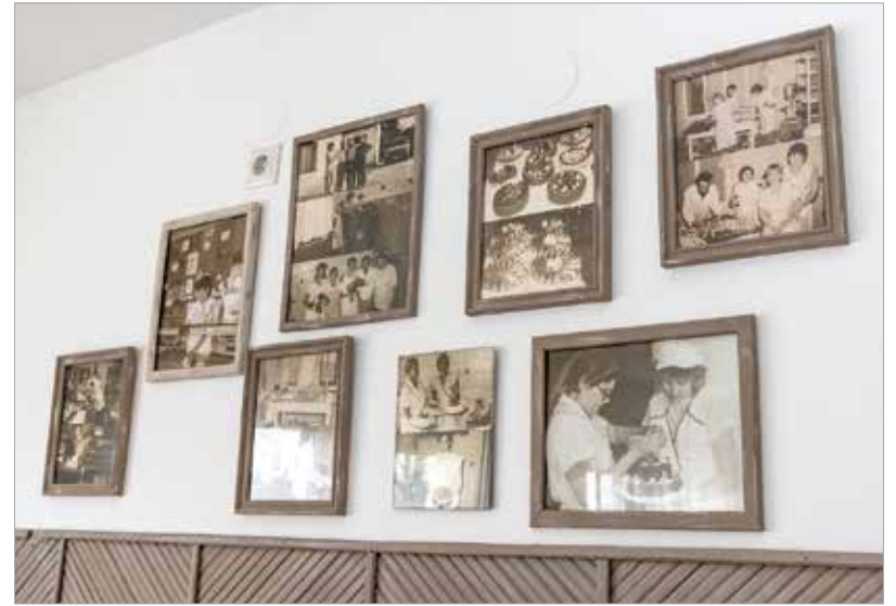
Az emlékfal a cukrászda felújítása után került a helyére: a régi képek a háromgenerációs öreghegyi cukrászda múltjáról mesélnek