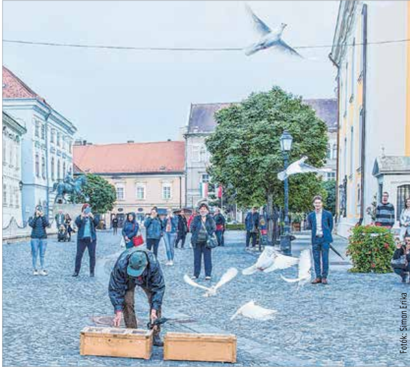
Galambbröptetéssel indult a Pünkösdi Virágálmom

Pünkösöd idejére idén is virágdíszbe öltözött a belváros. A helyi virágüzletek kompozíciói közül a fehérváriak választhatták ki a nekik leginkább tetszőt – ezúttal a Székesfehérvár applikáció segítségével lehetett szavazni.