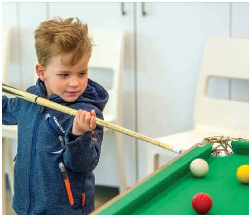
A királyi kaszinóban nem volt korhatáros a belépő, a kicsik is guríthattak nagyot