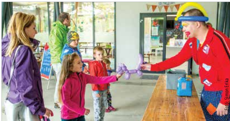
A szivárvány színeiből álló lufikapun átlépve szálló szappanbuborékok között köszöntötte egy-egy lufival Levi bohóc a Koronás Parkba érkező gyermekeket

téssel és a Hetedhét Játékfesztivál legszebb pillanatait felelevenítő történetekkel készült vasárnapra a Hetedhét Játékmúzeum. Mindeközben a Koronás Parkban kézműves foglalkozások, királyi kaszinó, baba-mama sarok, a Fő utcán pedig bohócok várták a családokat.