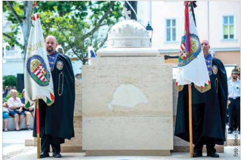
Székesfehérváron az Országzászló tér emlékeztet Trianonra

A megbízást 1919. december végén kapta Apponyi Albert, mint a magyar politikai élet doyenje. Olyan kiváló politikusok voltak a delegáció tagjai, akik aztán az elkövetkezendő évtizedekben a kül- és gazdaságpolitikát, kulturpolitikát meghatározták. Ők már január hetedikén megérkeztek, de a beszédre csak tizenhatodikán került sor, miután előző nap Apponyi Albert átvette a békeszerződés tervezetét. Sok illúziójuk nem volt, tisztában voltak azzal, mi várható. Annál is inkább, mert 1919 tavaszától a békedik-