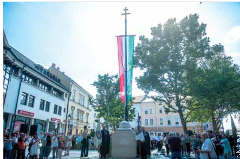
Száz év után sem feledhetjük a békediktátum gyalázatát!

Ezeket a határokat politikai, geopolitikai elvek határozták meg. Csehszlovákiának például szüksége volt arra, hogy a Duna legyen a határa. A magyar-román határ meghúzását semmiféle etnikai elv nem indokolta, gazdasági és közlekedési elv mentén született meg a döntés. Kimondhatjuk, hogy a győztes országok, az utódállamok egy eleve elrendelt helyzetet akartak teremteni már 1918-ban: benyomulni Magyar-