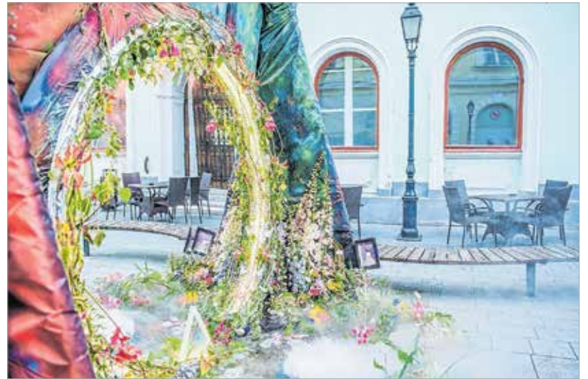
A szép hagyomány idén sem szakadt meg: pünkösöd idejére díszbe öltöztették a várost a virágkötők