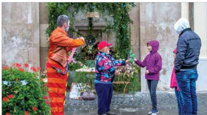
A pünkösdi virágdíszbe öltözött Fő utcán sétálva a legkisebbeket két bohóc lepte meg