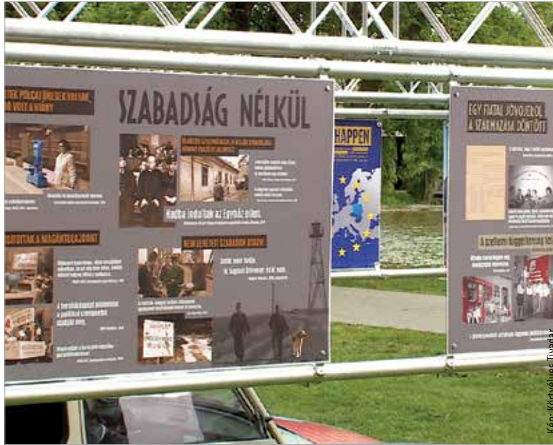
A kiállítás méltó emléket állít a rendszerváltó időszak eseményeinek

Az odavezető út is olyan volt, amire emlékeznünk kell!