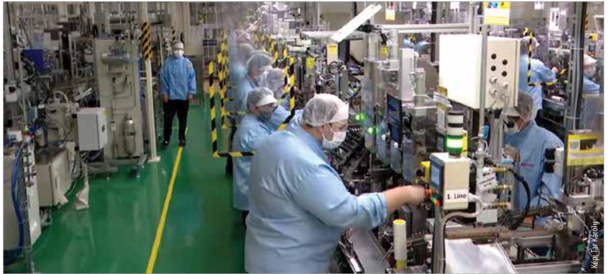
A kormányzati támogatásnak köszönhetően közel négyezer munkavállaló érezheti magát biztonságban a Densónál

A Densónál március végén állt le a termelés a járvány miatt, most már azonban kezd visszaállni az élet a normális kerékvágásba. A cég céljai között különösen fontos szerepet játszott a vírus-helyzetben, hogy minél több ember munkája megmaradjon. A gépjárműalkatrész-gyártó vállalat háromezer-nyolcszáz dolgozójának munkahelyét védte meg a Gazdaságvédelmi Akcióterv keretében a kormány által nyújtott vissza nem térítendő támogatás. Palkovics László miniszter úgy fogalmazott: „Magyarország nem szeretné feladni az elveit, hogy hazánkban ne segélyből, hanem munkából éljenek meg az