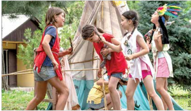
A Napraforgó Városi Tábor hétről hétre mindig valamilyen tematika köré szerveződik. Ezen a korábbi képünkön éppen indiántáborban voltak a gyerekek.

Habár egy hónapja még nem úgy tűnt, de idén is van lehetőség a nyári táborok megszervezésére. Várhatóan pénteken jelennek majd még a részletek az idei Bregyó közti táborokkal kapcsolatban. A koronavírus miatt kialakult helyzet okán a létszám ugyan korlátozott lesz – az eddigi négy száz