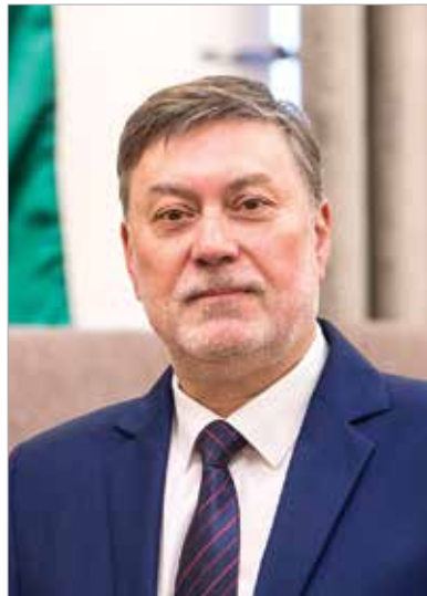
Trianon traumája száz éve velünk van