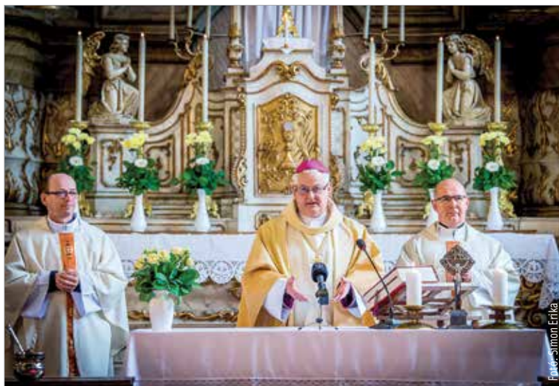
A közösség jelesre vizsgázott a járvány idején – emelte ki a főpásztor

Spányi Antal szentbeszédében köszönetet mondott mindazoknak, akik áldozatos munkájukkal megremtették a lehetőséget arra, hogy a hívők újra az egyházközösségekben tehetnek hitet elkötelezettségükről. A hívek számára nagy öröm, hogy újra közösségben élhetik meg hitüket, és a papságnak is sokat jelent, hogy találkozhatnak a közösség tagjaival: „Nehéz volt megélnünk érzelmileg is azt a helyzetet, hogy a hívek előtt nyitva volt az ajtó, betekinthettek a templomba, de a liturgiába nem tudtak bekapcsolódni. A szentésekben nem tudtak részesülni úgy,