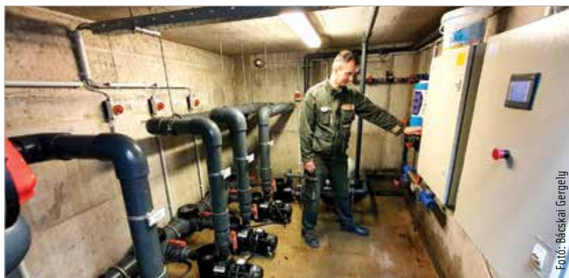
Beüzemelik a szökőkutakat is: minden városi szökőkút esetében rendszeresen takarítják a vízforgató rendszer szűrőit, és pótolják az elpárolgott vizet. A Városgondnokság az úszómedencéknél is használatos vegyszerezéssel kezeli a fehérvári szökőkutak vizét, hogy mindig tiszta legyen a víz, és ne legyen fertőzésveszélyes.

Nyáron mindig lesz nyitva tartó óvoda. Már több mint ezer óvodás és több mint kétszáz bölcsődés jár