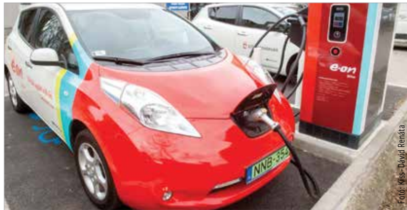
Székesfehérváron már húsz helyszínen tölthetik elektromos autóikat a tulajdonosok