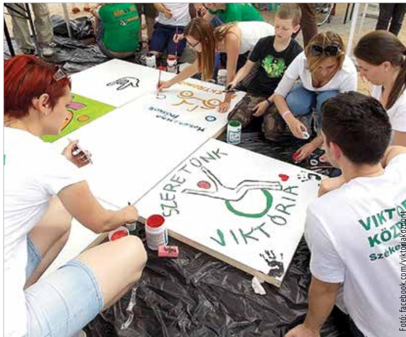
Székesfehérvár önkormányzatának segítségével háromszáz maszk érkezett a napokban a Viktóriába

„A támogató szolgálat tovább működik, kollégáink házhoz kijárva folytatják eddigi tevékenységüket: otthonukban látják el a mozgássérülteket. Ha kell, bevásárolnak nekik vagy bármilyen más segítséget nyújtanak. Az átmeneti és az otthonrészleg is folyamatosan működik telt házzal: mintegy húsz mozgássérült tartózkodik itt, akiket