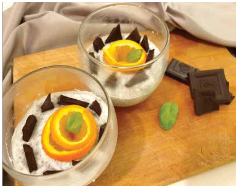
A chiapuding akár reggeliként is megállja a helyét

Egy közepes tálba kanalazzuk a chiamaot. Ráöntjük a kókusztejet és belefacsarjuk a narancs levét. Két teáskanál mézet keverünk bele, majd két pohárba tesszük a masszát. Ízlés szerint teszünk bele étcsokit, narancsleletet. Nagyjából