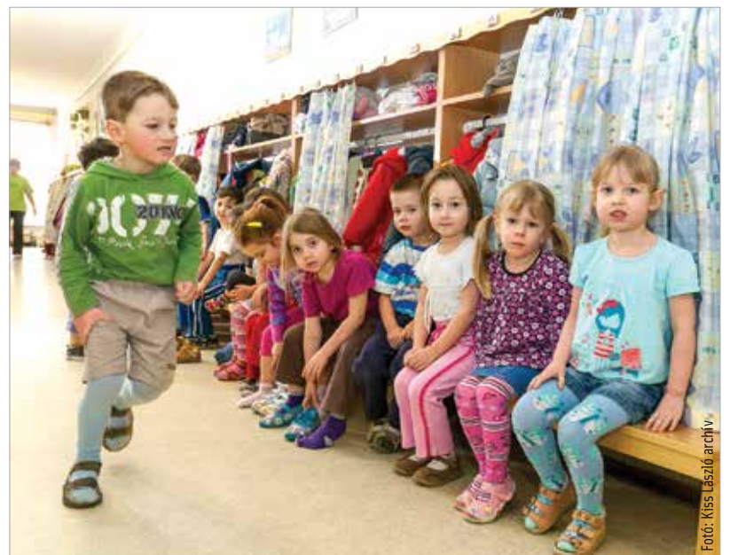
Ha nem körzeti óvodát választunk, akkor április tizenhetedikéig kell a választott intézménynek jelezni a szándékunkat telefonon vagy e-mailben