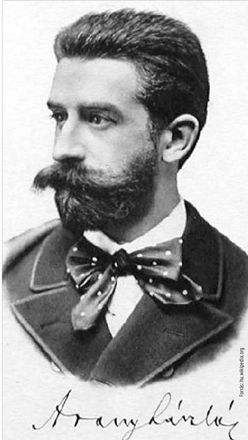
Arany László fiatalkori portréja

Arany László jobbára az alapi kastélyban töltötte életének utolsó szakaszát, Budapest és Alap között megosztva idejét. 1898-ban fiatalon, ötvennégy éves korában halt meg tifuszban. Költői-írói munkásságának legjobb darabjait ekkorra már rég megírta. Alig száradt meg a tinta a Nagykorösi szerzett érettségi bizonyítványán, Juliska nevű nővérével felkerekedett, hogy Erdélyben összegyűjtse a nép ajkán forgó meséket. A mesék ekkorra az irodalom fontos részévé váltak, Szendrey Júlia például Andersen meséit fordította magyarra. Néhány ismert népmese Arany László gyűjtésének köszönhető fennmaradását. Ki ne fújna kívülről a Kiskakas gyémánt félkrajcárját, a Babszem Jankót, a Kis gömböc vagy a Kis ködmön történetét, a Kismalac