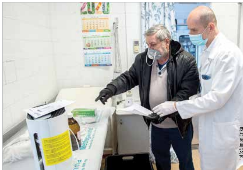
A fehérvári háziorvosok is megkapták a védőfelszerelést és a levegőtisztító gépeket

A Polgármesteri Hivatal a hét minden munkanapján a hét folyamatosan ellátja az ügyfelek tájékoztatását. A koronavírus-járvány miatt kialakult helyzetben, a közösség érdekében személyes ügyfélfogadásra csak szerdai napokon, az Ügyfélszolgálaton van lehetőség 8 és 12 illetve 13 és 16 óra között. A hét többi munkanapján telefonon és e-mailben érhetők el a hivatal munkatársai a 22 537 200-as számon illetve az ügyfélszolgálat@pmhiv.szekesfehervar.hu címen. Az alábbi irodák csak telefonon vagy e-mailben kereshetők: Adóiroda: adoiroda@pmhiv.szekesfehervar.hu Anyakönyvi és Vállalkozásigazgatási Iroda: 22 537 128, 22 537 209, 22 537 222, 22 537 239, anyakonyv@pmhiv.szekesfehervar.hu. KCR Iroda: 22 537 162, 22 537 175, kcr@pmhiv.szekesfehervar.hu. Környezetvédelmi Iroda: 22 537 133, 22 537 163, környezetvedelem@pmhiv.szekesfehervar.hu. Igazgatási Iroda: 22 537 109, igazgatas@pmhiv.szekesfehervar.hu.