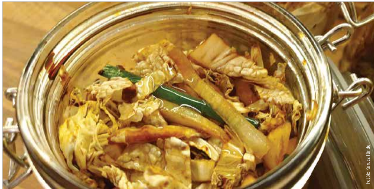
A kimesi minél tovább érlelődik, annál finomabb!

tósni, amit csak keverni és sütni kell. Különbéféle mártogatósokkal, például korianderes tejföllel vagy szójaszósszal a legfinomabb!