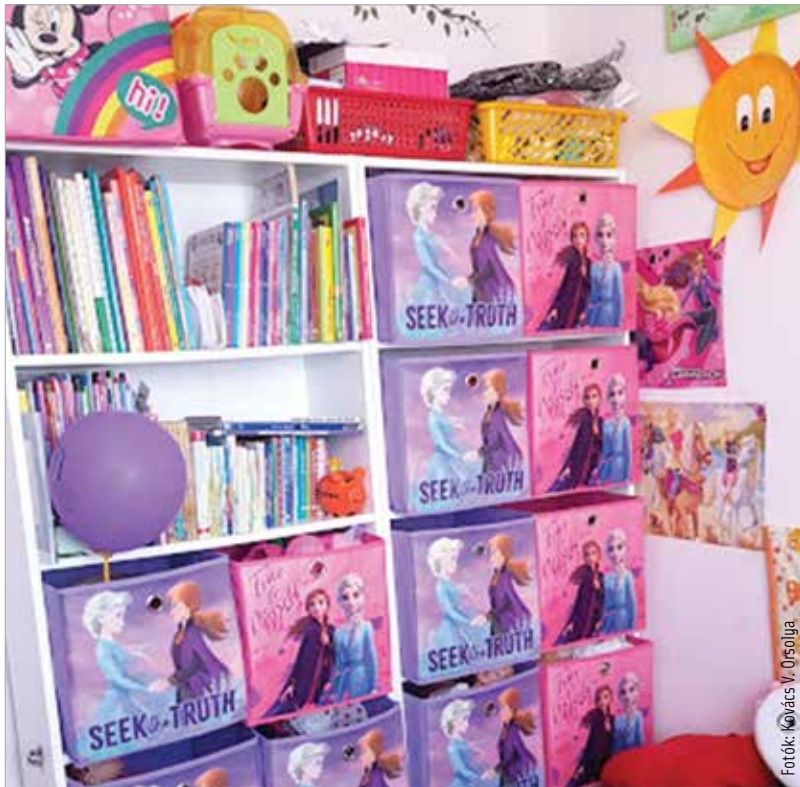
A tárolórekeszek segítenek a rendszerezésben