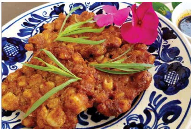
A kukoricatósnit szójaszószbába is mártogathatjuk!

A bakwan jagung gyakorlatilag egy indonéz hagymás kukorica-