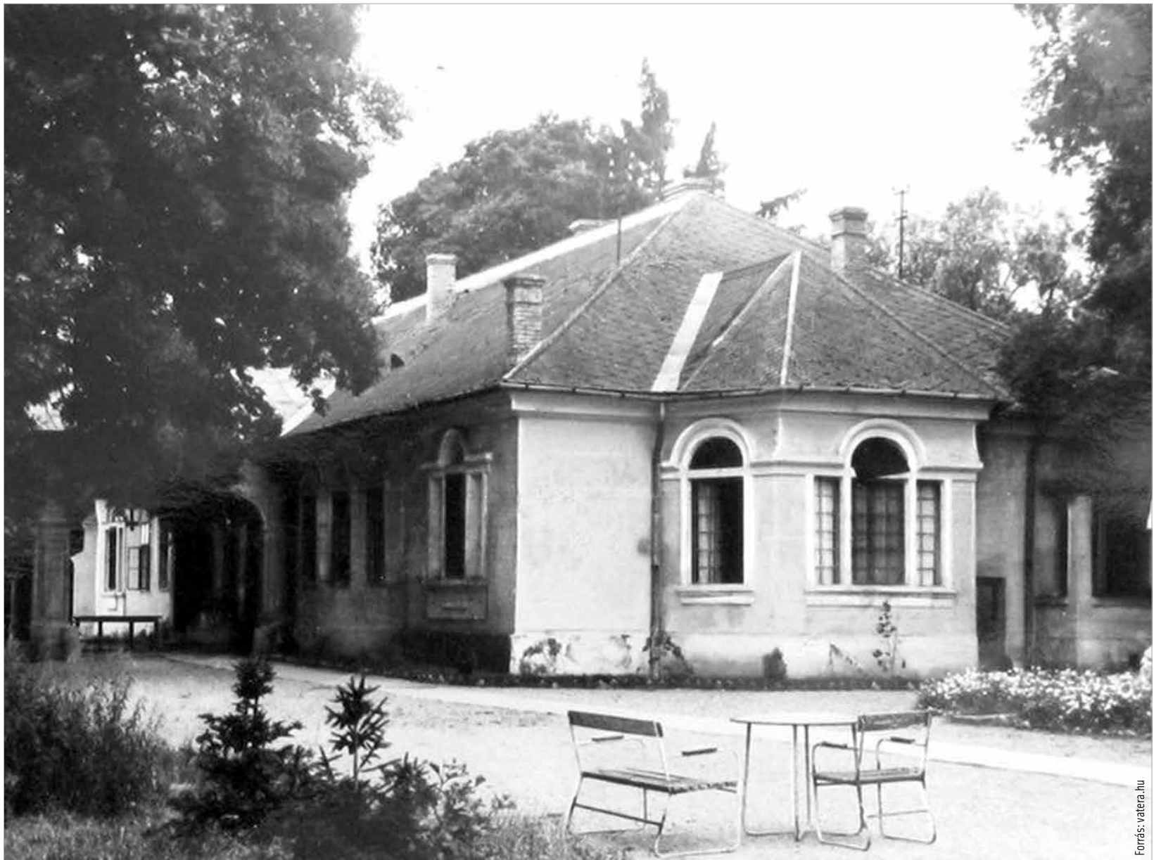
A Salamon-Voinovich-kúria egy ideig SZOT-üdülő volt – ezen a régi képeslapon is ebből a korából láthatjuk