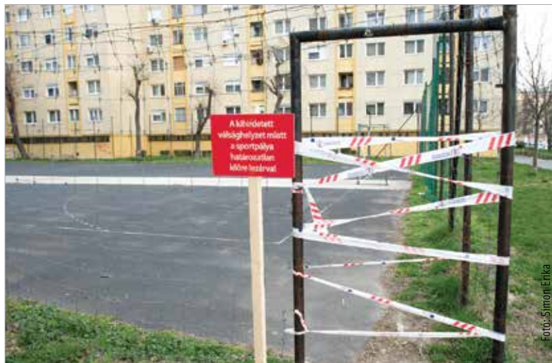
Fehérvár otthon maradt

A koronavírus által okozott járványügyi helyzet kezelésére a székesfehérvári Fidesz-frakció tagjai másfél millió forintot ajánlottak fel a városi adományalapba. Arra kértek mindenkit, hogy aki megteheti, támogassa a megelőzést a városi adományalapon keresztül. Ennek számlaszáma 12023008-00153647-06700001. A közlemény rovatban tüntesse fel: „Koronavírus elleni védekezés”!