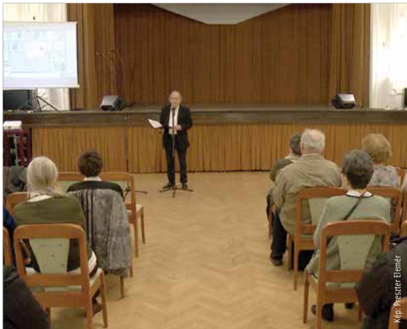
A Csoóri Sándor Társaság gondozza a költő hagyatékát