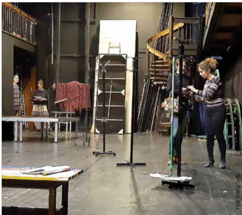
A különleges környezetben játszódó történet huszonegyedik századi problémákra keresi a választ

„Igazából most érte utol a történelem magát a darabot illetve a társadalmi fejlődést. Ez a darab nagyon keményen beszél a nők helyzetéről, a nők elnyomásáról, arról, amit mostanában divatos szóval Stockholm-szindrómának szoktunk nevezni: hogy az áldozat