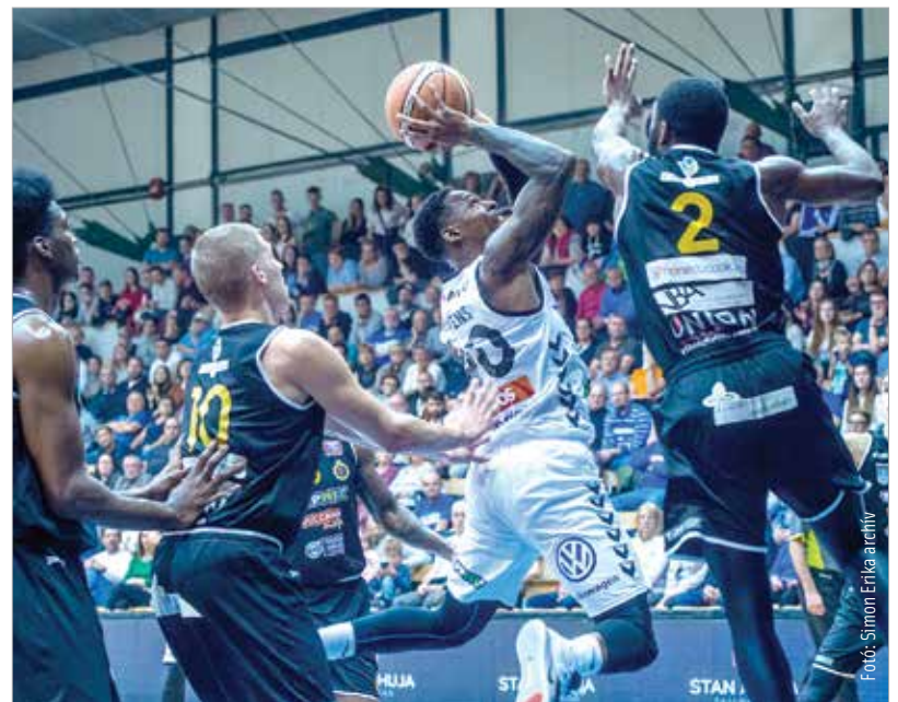
A Falco Szombathelyen is túlerőben volt az Alba Fehérvárral szemben