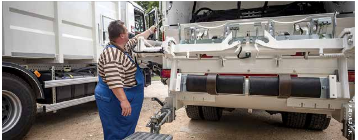
Ákár ötször többen jelentkeznek egy olyan pozícióra, ahol az álláshirdetés béradatot is tartalmaz

A munkaadók hivatalosan a munkavállalók magánéletébe való túlzott mértékű beavatkozást rántották elő a cilinderről, a politikusok pedig kicsit elkenték a dolgot, és a gyakorlati megvalósítás nehézségeivel támasztották meg az állványzatot.