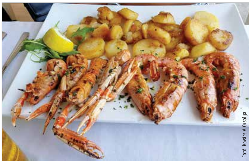
A finom vacsorákra is többet áldozhatunk, ha ügyesen foglalunk!