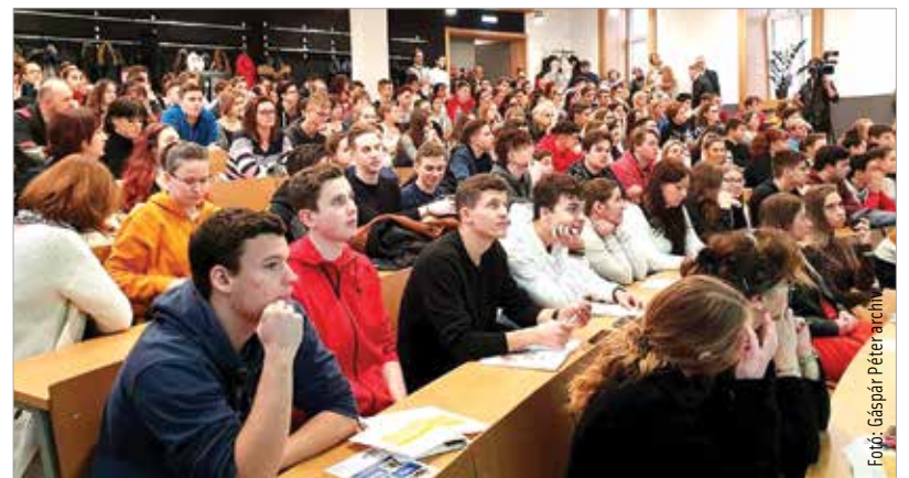
Január végén több száz leendő hallgató vett részt a Corvinus nyílt napján