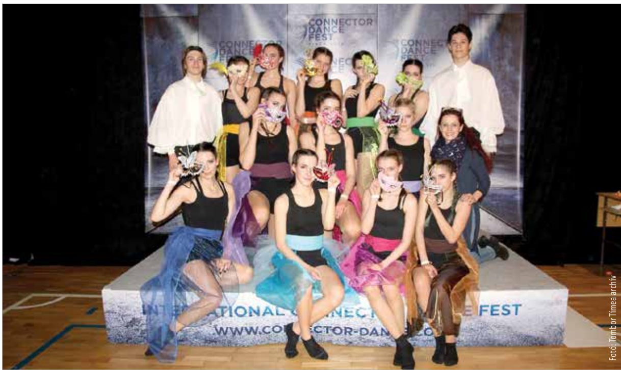
A siker kulcsa az elhivatottság

Kell, mert ha nem jó a technika, muszáj, hogy javítson rajta a