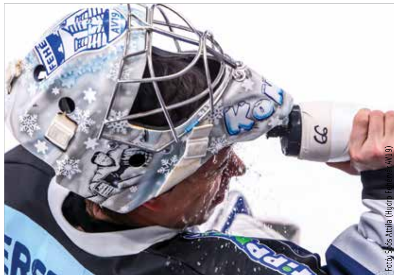
Fel kell frissülnie a Volánoknak a középszakaszkra, a rájátszás eléréséhez kiegyensúlyozott teljesítmény kell!