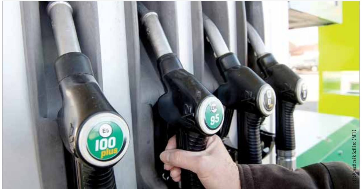
A magasabb bioetanol-tartalmú, E10-es üzemanyag főleg a régebbi autóknál okozhat problémát