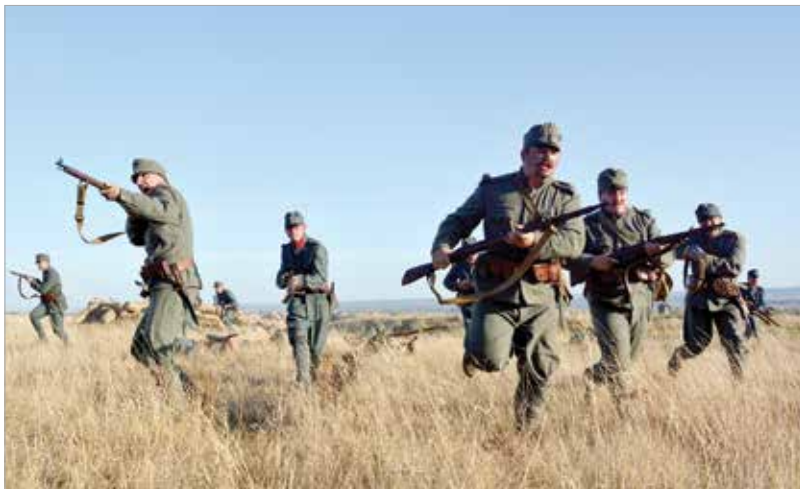
A háború végén, a fegyverszünet után is rengeteg magyar katona esett el vagy vált hadifogollyá

túléltek a háborút, visszatérnek. Az itthon maradt, özvegygé vált asszonyok sorsát is bemutatjuk. Úgy van kitalálva ez a második film, hogy bár a szereplők ugyanazok, mégis érthető lesz azok számára is, akik az első filmet nem látták.