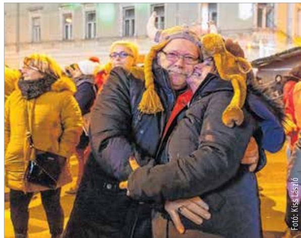
A legtöbben vicces jelmezekben búcsúztatták az óvét

Minden év első napján az új, papírlatú noteszembe felírom a céljaimat, vágyaimat, hogy miket szeretnék az új esztendőben megvalósítani. Ezek néha egészen apró dolgok, mint hogy a diákkori albérlésbe vett régi asztal helyett beszerezzünk egy újat. Vagy cseréljük le az előző tulajtól örökölt konyhakövet, mert az örökös koszt imitáló színével az elmúlt öt évben nem tudtam megbarátkozni. Aztán néha olyan vállalások is bekerülnek a listába, hogy jövőre írok egy könyvet és rendszeresen sportolok. Már éppen befejezném, amikor bejönnek a gyerekeim a dolgozó-sarokba. Az egyik büszkén mutatja, milyen szép katamaránt épített legóból, aztán meg a másik kér segítséget, hogy kapcsoljam fel a villanyt a wc-ben, mert nem éri el. Ilyenkor rájuk nézek, a toll kiesik a kezemből, a lista félbemarad. És dicsérek, villanyt kapcsolok, legósárcányt javítok, kiszedelem a mosógépből a ruhákat, katonaszendvicseket gyártok. Közben hazaesik a férjem. Vacsoránál beszélgetünk és jó esetben az esti rutinba még egy kis közös társasjáték vagy pörgettyűzés is belefér. Mikor a gyerekek végre elalszanak, kisettenkedek a szobájukból. Odabújok a férjemhez a kanapén, és eszembe jut a be nem fejezett lista. Aztán rájövök, nem is olyan fontos az új asztal, a konyhakő, a saját könyv. És az is bőven belefér, ha csak immel-ámmal jutok el futni, mert mindenem megvan, ami boldoggá tesz!