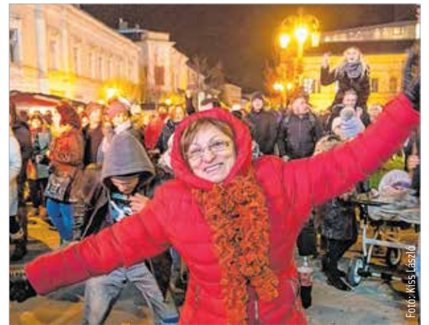
Volt, aki maskara helyett csupán a jókedvét hozta a Fő utcára