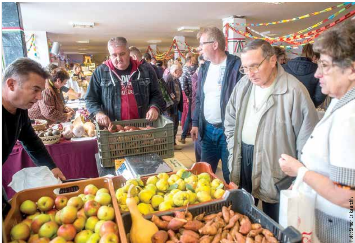
Ha a helyi gazdák termékeit vásároljuk, akkor mi magunk is sokat teszünk a klímaváltozás ellen!

„Most egy elágazásnál vagyunk. Az a kérdés, hogy globálisan a következő évtizedekben még többen eljutunk-e oda, hogy hol eszünk, vagy pedig visszacsúszunk abba, hogy eszünk-e egyáltalán. Ehhez meg kell néznünk az élelmiszer fenntarthatóságát. Vagyis: a mi, a gyerekeink, az unokáink, de még az ükunokáink életében is élelmiszerből ugyanezt a minőséget és mennyiséget elő tudjuk-e állítani? Mindezt természetesen gazdaságosan, belekalkulálva akár húsz rossz évet is. Figyelembe kell venni azt is, hogy a megtermelt alapanyag a szervezet