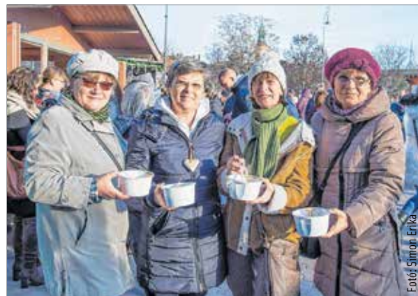
A lencséhez illetve az aprószemű zöldségekből készült ételekhez a néphit a pénzt, a gazdagságot társítja – minél többet eszik belőle valaki az év első napján, annál nagyobb szerencséje lesz és bőség jellemzi majd az évét