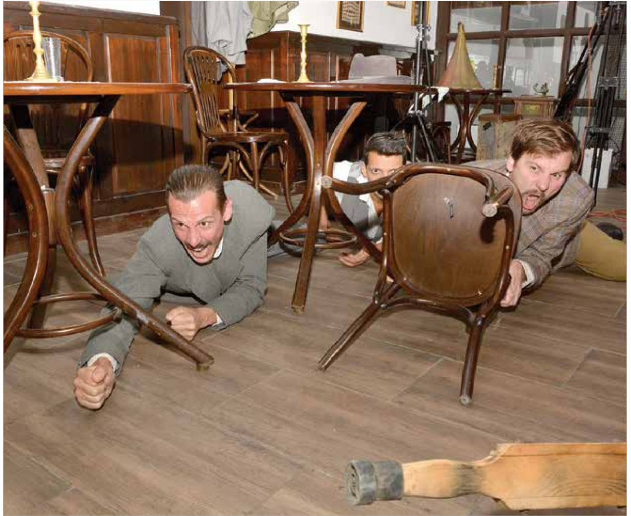
A traumát otthon sem lehet feledni, így válik az egyik jelenetben csatamezővé egy kávéház

Sipos Gyula valós figura, a többi szereplő, ahogy az első filmben, olyan sorsokat jelenít meg, amelyek nagyon általánosak ebben az időszakban. Sokak története ez. A háborús helyzetben egymásért küzdöttek, és nemcsak a katonák, hanem az otthon maradottak is. Erről szólt az első film. Most pedig a hazatérés utáni élet nehézségeibe nyerünk bepillantást, abba az időszakba, amikor az első filmben együtt harcolók közül azok, akik