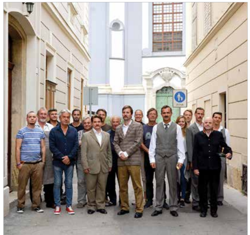
A stáb egy része, köztük sokan fehérváriak

Székesfehérvár önkormányzata támogatja a filmet, azonban ahhoz, hogy el tudjuk készíteni, még szükség van támogatókra. Bizakodó vagyok, mert azt hiszem, ez egy fontos téma, és fontos, hogy beszéljünk róla, hogy a következő nemzedéknek is át tudjuk adni nagyszüleink, dédszüleink történetének legfontosabb, legmeghatározóbb mozzanatait.