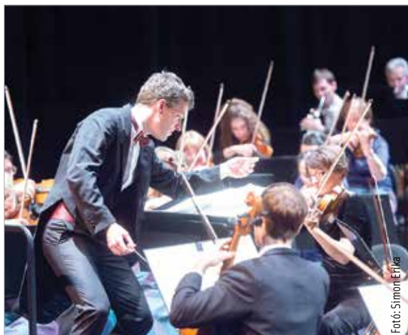
Zenei élménnyel indult az új év a Vörösmarty Színházban: az Alba Regia Szimfonikus Zenekar hagyományos újévi koncertjét láthatta, hallhatta a közönség