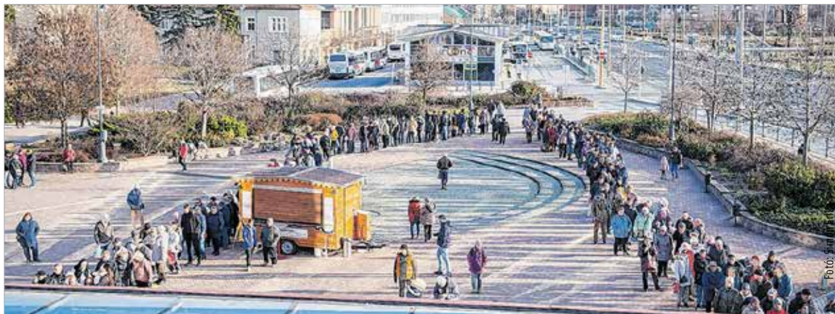
Sokan voltak kíváncsiak az újévi lencse ízére

Nem teszek hát fogadalmat, mert látom, hogy az élet úgyis felülír mindent. Ajándékol időt és életerőt kérnék, hogy elvégezhessem azt, ami rám vár. Az élethez jó társak és szép feladatok kellene!