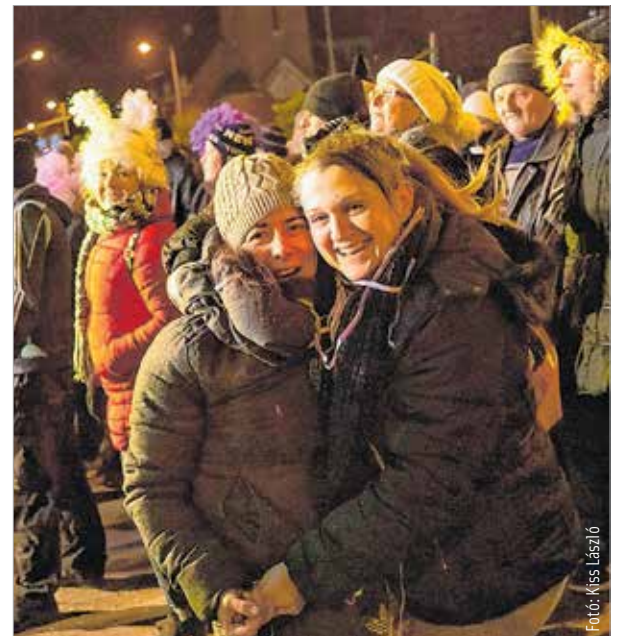
Volt zene, de volt tánc is!