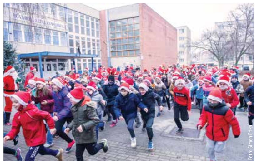
Soha ennyi Mikulást nem láttunk még Fehérváron! Kis és nagy szakállú télapók, hosszú hajú télányók, manók, rénszarvasok, koboldok és vidám, karácsonyi pulcsiba öltözött tóvárosi diákok kezdték futással a napot a Szent Miklós napja utáni szombat. A futás után ajándék is járt a gyerekeknek.