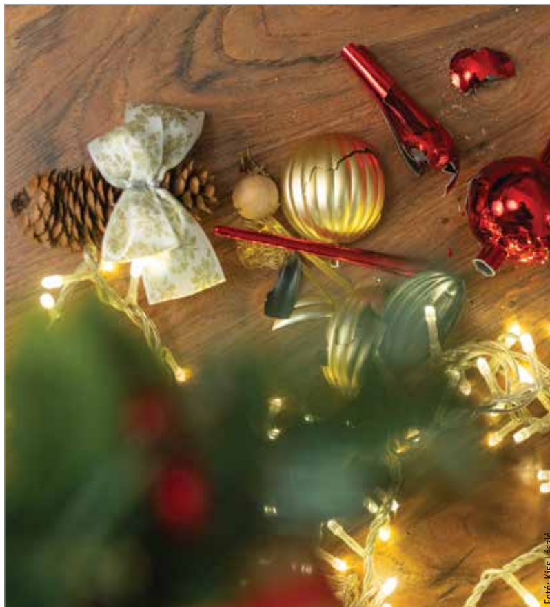
Csak lazán és óvatosan, hogy ne a feszültségekről szóljon a karácsony!

Sok család erején felül igyekszik költekezni karácsonyra, akár hitelek árán is, ami nagyon nagy terhet tesz rájuk. Nem könnyű kitalálni, ki milyen ajándéknak örülne, mi lenne a legjobb meglepetés, örülni fog-neki a másik, illetve az ajándék értéke is gyakran stresszterhet jelent, akár adjuk, akár kapjuk.