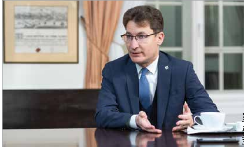
A Cser-Palkovics Andrással készült ünnepi évértékelő beszélgetést teljes egészében a Fehérvár Televízióban tekinthetik meg december huszonötödikén, azt követően pedig elérhető lesz a televízió Youtube-csatornáján!

A digitális oktatás egy-két hétig izgalmas volt, utána viszont egyre nagyobb kihívás. Nagy erőfeszítést igényelt a diákoktól, a tanároktól és a szülőktől egyaránt. Gondoljunk csak bele: egy