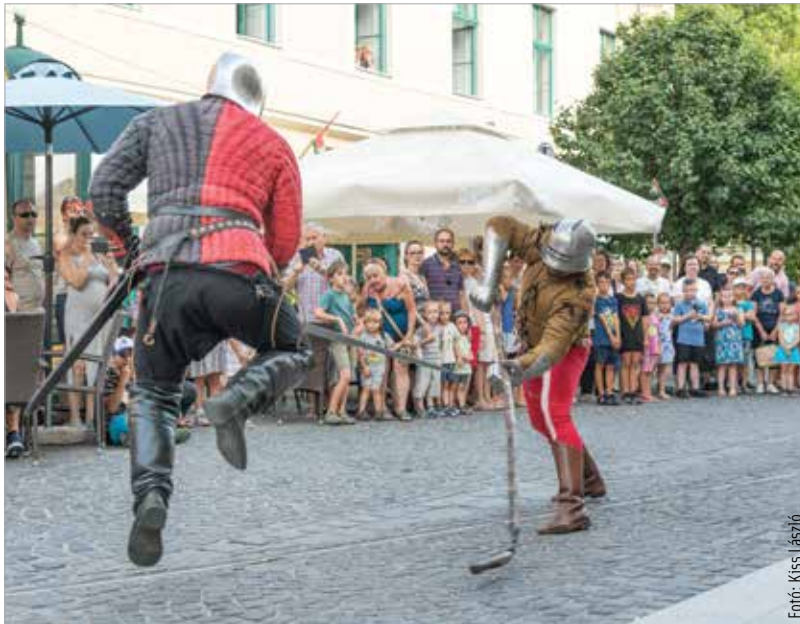
Újra étellel telt meg a királyi város: augusztusban érdekes volt korzózni a belvárosban, mert mindig valami izgalmas, múltat idéző előadásba botlottunk