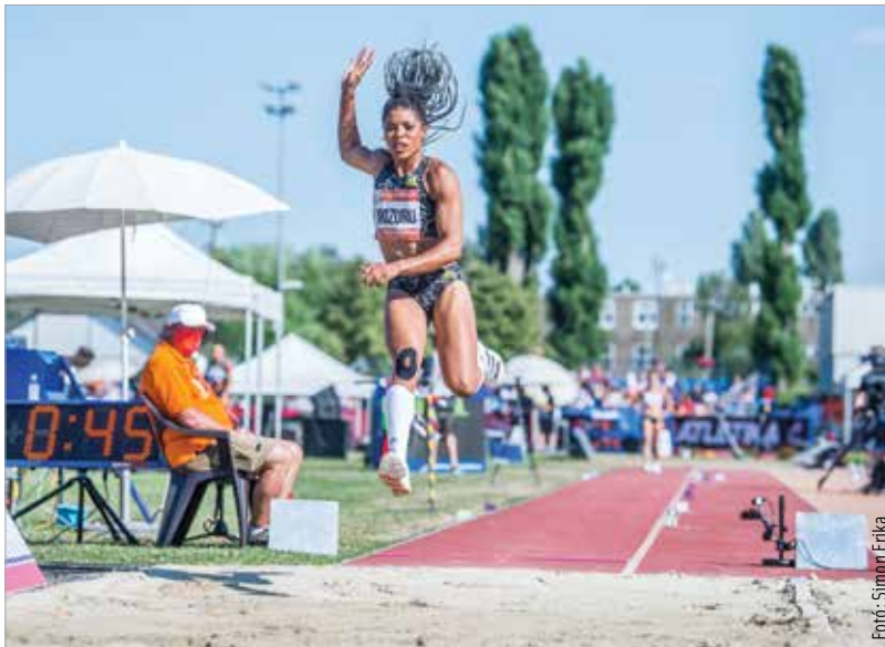
Ha július, akkor Gyulai Memorial! Idén is megrendezték a rangos atlétikai világvserenyt. Soha ennyi látványos „repülést” nem látott a Bregyó!