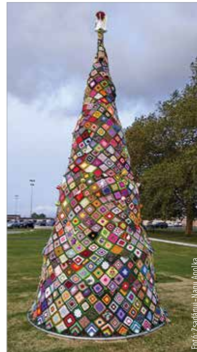
Alternatív karácsonyfa Aucklandben

„A karácsonyt mi is huszonötödikén reggel ünnepeljük. Miután a pizsomás kiskoriat birtokba vették ajándékaikat, jöhet az evés-ivás, később a tengerpartra vonulás, ahová már a nagyobb létszámú család, esetleg a baráti kör is befut. Van, hogy harminc-negyven ember összejön egy ilyen lakomára. Az ételek elég sokfélék, lévén, hogy a társadalom is sokszínű. A Pavlova-torta alap, hiszen új-zélandi nemzeti étel, bár erről az ausztrálok más-képp vélekednek. A ropogós habcsókból, tejszínes krémből, a tetején friss eperből álló sütemény a híres orosz balett-táncos, Anna Pavlova után kapta a nevét, aki 1926-ban Ausztráliában és Új-Zélandon is turnézott. A turné alatt lett ez a finomság a kedvenc süteménye. Bármilyen az igazság, ez a süti minden karácsonyi asztalon ott van!”