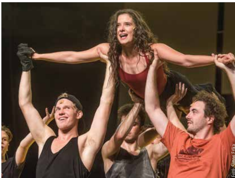
A Fame musical szereplőgárdáját közel ötszáz fiatal közül válogatták ki, a kéthónapos nyári próbafolyamat után pedig ősszel végre műsorára tűzhetette a színház. Az utóbbi időszak egyik leglátványosabb, legnagyobb szabású, legenergiusabb produkciója, ami Fehérváron készült.