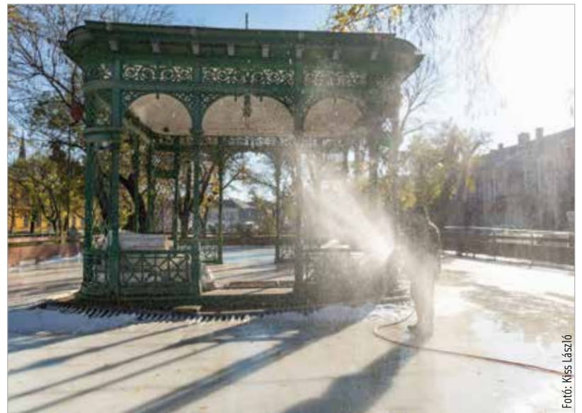
November végére újra megépült a koripálya a Zichy ligetben. A Koriliget a hét minden napján reggel nyolc és este nyolc között várja a sportolni, mozogni vágyókat, és nemcsak advent idején, de az ünnepek után is!