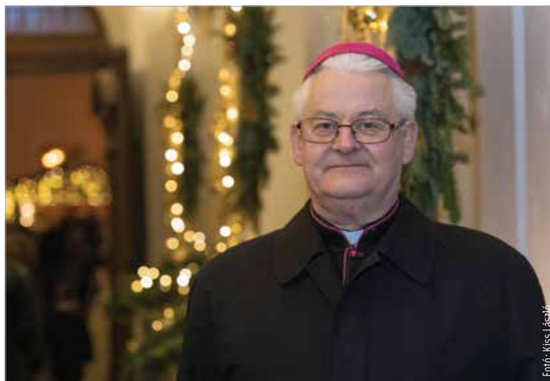
„Advent arra hív bennünket, hogy szabaduljunk fel!”

A fiatalok zarándoklata Bodajkra, az arra való felkészülés, az együtt-