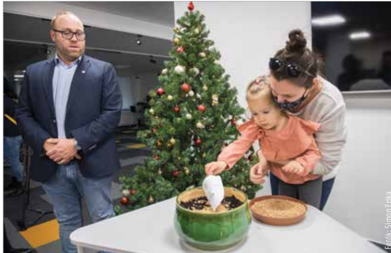
A résztvevők közösen ültettek búzát