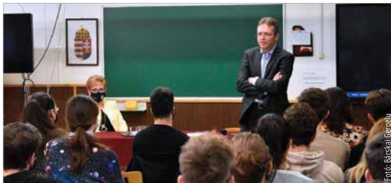
Hankó Balázs kiemelte, hogy az egyetemi alapképzést elvégző hallgató a munkaerőpiacon az átlagbér százötven-százhatvan százalékát, mesterképzés után kétszázhusz százalékát keresheti, ráadásul a munkához jutás átlagos időtartama alig több, mint egy hónap

A helyettes államtitkár arról is beszélt, hogy ma tíz egyetemistából hét-nyolc állami ösztöndíjas, ami nemzetközi viszonylatban is kiemelkedő arány, és ez az új modellben is így marad. Megemlítette, hogy a világ tíz legrangosabb egyeteme közül hét alapítványi formában működik. Az egyetemi élet egyik fontos szegmensének nevezte a sportéletet, melynek megerősítése alapvető cél itthon is. Szeretnék a külföldön már jól bevált aktív egyetemi sportéletet hazánkban is meghonosítani, hiszen a tanulásnak és a mozgásnak együtt kell jól mennie – fogalmazta meg Hankó Balázs.