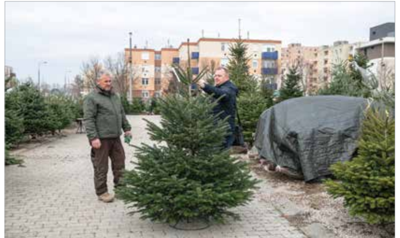
Korábban méterre adták a fát, most viszont gyakoribb a darabás fenyő

iparcikkpiac területén, de az árusok többsége már az azt megelőző héten árulta portékáját. Tavaly óta a fenyő ára is emelkedett. A Díszkertészek Szakmaközi Szervezete szerint nem kizárt, hogy húsz százalékkal fizetünk többet idén a karácsonyfáért. A drágulás részint a szélsőséges időjárási körülményekkel magyarázható, de a szállítási költségek és a növények termelési költségei is emelkedtek tavaly óta. Az általunk megkérdezett öster-