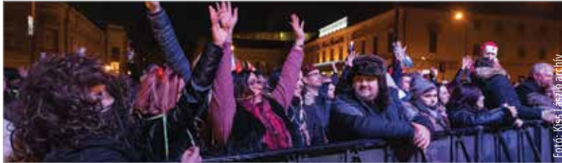
Újra hangos, népes szilveszterre számíthatunk!

pedig a hagyományos Szerencsehozó lencse rendezvénye várja majd a fehérváriakat. A programok csak védettségi igazolvánnyal látogathatók, a maszk használata ajánlott, de nem kötelező. A szilveszteri műsor részleteit idei utolsó, december 21-i lapszámunkban olvashatják!