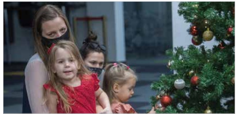
Lucák lehetnek gyermekek, édesanyák, sőt nagymamák is. A Luca-napra minden korosztályból jöttek névnaposok.