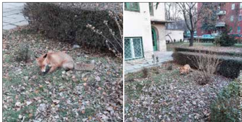
A képeken jól látható, hogy egy társasház előkertjében falatozik a róka

Hogy miért? Ha nem lövik le a rókát, hanem befogják, utána visszaviszik a természetbe. Ez nem jó, két okból sem: egyrészt ezeken a helyeken általában vadgazdálkodás folyik, másrészt mivel territoriális állatról van szó, nagy eséllyel annak a területnek már van „rökagazdája”.