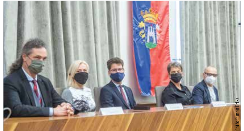
Széles körű összefogással készül Székesfehérvár az Aranybulla-émlékévre

De lesz Arpad-kori kiállítás, Piknik az Aranybulla-émlékműnél, Helyismereti tábor, Aranybulla animációs filmpnap, de keresik majd Fehérvár történetét is, a Fehérvár Hero applikációnak köszönhetően pedig az online térben is megemlékezhetünk az Aranybulla kiadásának kerek évfordulójáról.