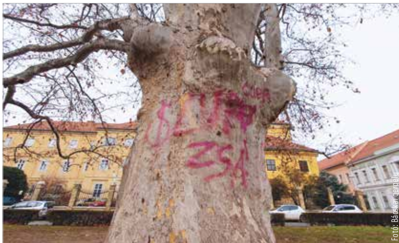
Cupa és Zsá – valaki úgy gondolta, hogy a gyönyörű, védett platánfa törzsén jól mutatnak ezek a feliratok vörössel

A felirat tehát egyelőre marad. Szerencsére a fának nem okoz kárt, ám a vizuális élmény erősen megkérdőjelezhető. És marad a nagy kérdés is: ezt miért kellett?