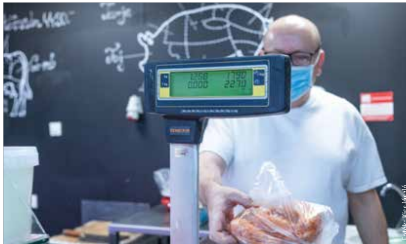
A húskészítmények ára jóval magasabb lett