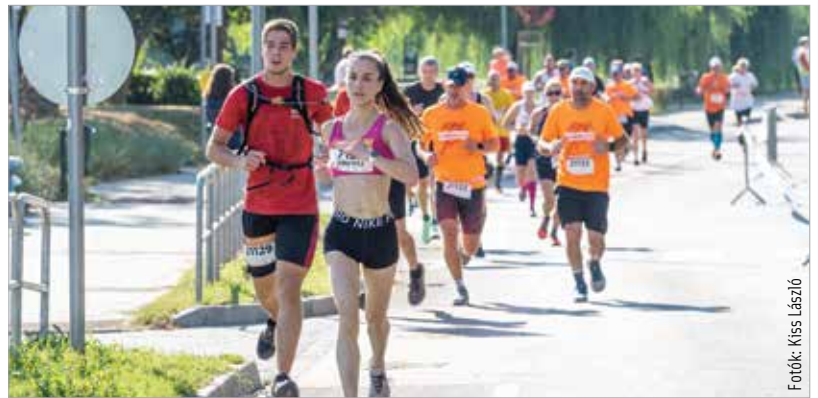
Az amatőrök, hobbifutók is élvezték a változatos pályát Székesfehérvár belvárosában és annak környékén