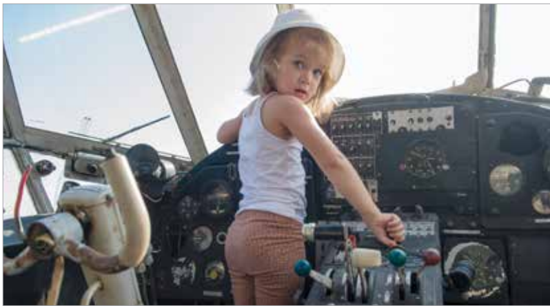
Nemcsak a nagyfiúk, de a kislányok is érdeklődnek a vasmadarak iránt