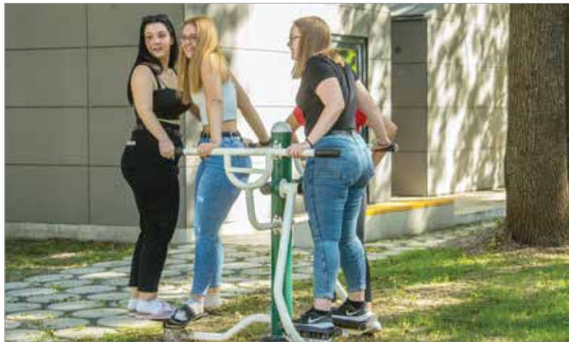
A teljesen megújult épületek mellett sportpálya, sporteszközök és okospadok is várják a fiatalokat

Az egyszerű, elavult kis faházakat újakra cserélték: mindegyik saját fürdőszobával van felszerelve,