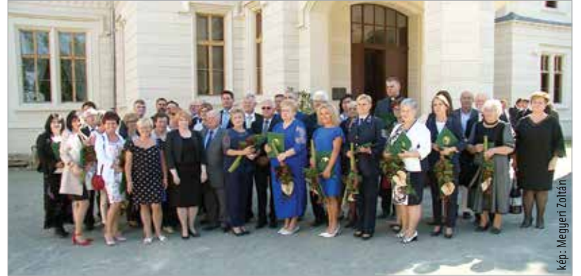
kép: Megyén Zoltán

a Fejér Megyei Közgyűlés elnöke köszöntőjében kiemelte, hogy a Megyenap a Fejér megyében élők ünnepe, amely nekünk és rólunk szól: „Arra szolgál, hogy egyrészt elismerjük azokat a hétköznapi embereket, akik nem hétköznapi tettet hajtanak végre saját szakmájukban, hivatásukban vagy életútjuk során. Emellett fontos rendeltetése a Megyenapnak, hogy áttekintsük a megye helyzetét, mérleget vonjunk, megvizsgáljuk, hogy jó irányba haladnak-e a dolgok, fejlődik-e a megye, a Fejér Megyei Önkormányzat jól végzi-e a tevékenységét.”