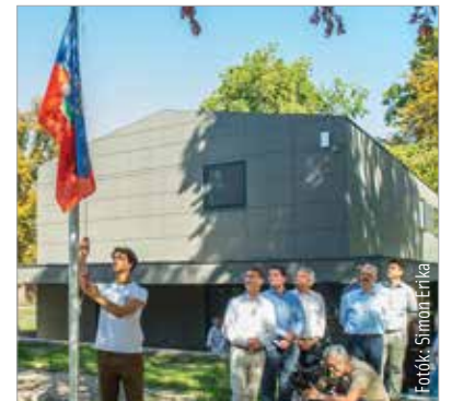
A megnyitót az ünnepélyes kulcsátadással zárult, a zászlófelvonás után pedig a diáktanács tagjai birtokba vehették a tábort

mondta el lapunknak Cser-Palkovics András polgármester. Vargha Tamás a megnyitón saját fiatalkori tábori élményeit is felidézte, azt az időszakot, amikor még egészen másfajta táborok voltak a kisházak. Bár a tábori élmény ugyanolyan jó volt akkor is, az országgyűlési képviselő szerint a megszépült környezet, a komfort is fontos: „Bízom benne, hogy a fehérvári és a környékbeli gyerekek otthona lesz majd itt nyáron, hiszen fantasztikus dolgok épültek, és gyönyörű a park, a Velencei-tó.”