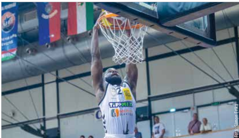
Sima győzelmet aratott az Alba az Oberwart ellen az utolsó felkészülési mérkőzésen

Az eredménynél fontosabb, hogy a Dejan Mihevc vezetőedző által elvárt speciális harcmodorra, a folyamatos letámadásra épülő játék egyre jobban összeálljon. Az utolsó, immár hazai edzőmeccsen, az Oberwart ellen ez hozott is jó néhány pontot, simán győzött az Alba. Ezt már a fehérvári közönség is láthatta, de biztosat azért még kevesen mernének mondani a csapat bajnoki esélyeiről. Ha mindenki egészséges lesz, talán lehet szép idényben bízni. Jövő szerdán Pakson kezdik a szezont Vojvodák, szombaton pedig jön is az első rangadó, itthon, a bajnok Szombathely ellen!