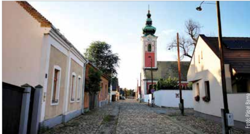
Egy ezeréves, történelmi városrész esett áldozatul a kommunista falanszterépítés lázalmának, melynek jelszava: „A múltat végképp eltörölni!” A Rác utcai épületegyüttes maradt egyedüli hírnemzőnk.

Ezért – a körülményekhez képest – egy nagyon bölcs gondolat született: megtartanak egy