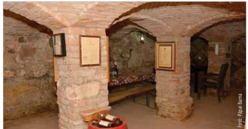
Az előadást követően végigsétáltunk beszélgetőpartneremmel a Rác utcán. A 19-es ház jelenleg is lakott, így belülről is megcsodálhattuk az épületet. A tulajdonos gondos gazdája a háznak, minden szeglete magán viseli a törődést.