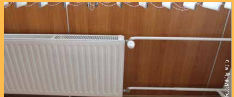
Nyáron nem fűtés, hanem karbantartás miatt meleg átmenetileg a radiátor

Csak így biztosítható az, hogy a lakásokban történt felújítások, átalakítások után a rendszer ismét készen álljon a fűtési szezonra. A művelet okozta esetleges kellemetlenségek miatt a szolgáltató a felhasználók szíves türelmét és megértését kéri!