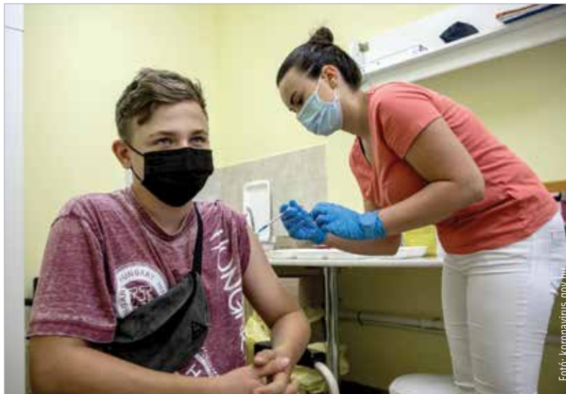
Minél nagyobb számban lesz átoltott a fiatal generáció, annál nagyobb esély van a következő tanévben a jelenléti oktatásra

Magyarország az elsők között ért a tizenkét év feletti oltásához – írja a koronavírus.gov.hu. A szülők június óta tudnak regisztrálni. A tizenkét és tizenhét év közöttiek korosztályában eddig közel kétszázezren jelentkeztek oltásra, és százhatvankétezen már fel is vették azt, ami a regisztráltak több mint nyolcvan százalékát jelenti. Az internetes regisztráció és időpontfoglalás továbbra is nyitott, ez a legegyszerűbb módja a gyermek beoltásának. Emellett augusztus 30-án és 31-én, valamint szeptember 2-án és 3-án az iskolákban is lesz oltási akció – írja az internetes portál. A szülők az iskolától kapnak tájékoztatást, és augusztus huszonötödikéig az iskolának is kell visszajelezniük, hogy kérik vagy nem kérik gyermeküknek az oltást. Az iskolásokat Pfizer-vakcinával oltják majd be az iskolaorvosok és a háziorvosok bevonásával. A cél, hogy az iskolák továbbra is zavartalanul, jelenléti oktatásban