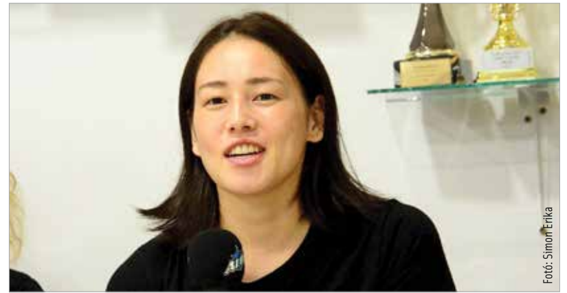
A japán válogatott irányító először játszik külföldi csapatban

A csapat vezetőedzője, Boris Dvoršek elmondta, hogy az elmúlt egy hónap során remekül alakult a felkészülés, jó úton jár a csapat: „Rengeteg munkát végeztünk az edzések folyamán, és máris meglátszik az eredmény, mert az edzőmeccsek közül hármat megnyertünk, és csak egyszer kaptunk ki. Lépésről lépésre haladunk. Folyamatosan zajlanak az erőnléti edzések, és persze labdával is sokat edzünk. Készen leszünk a bajnokság kezdetére!”