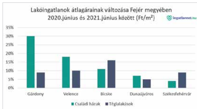
Folyamatosan drágulnak az ingatlanok Fejér megyében

A téglalapítású lakások is drágultak, viszont a családi házakkal ellentétben itt a tizenkét hónapos vizsgált időszak alatt négyzetméterenként átlagosan ötvétezer forinttal kellett többet fizetni. 2020 és 2021 júniusa között 540 ezer Ft/m 2 -ről 594 ezer Ft/m 2 -re ugrott fel a kínálati ár. A városban található panellakások drágultak a legjobban: míg a tavalyi esztendő hatodik hónapjában 435 ezer Ft/m 2 volt az átlagos kínálati ár, addig idén júniusban már 506 ezer Ft/m 2 . Ha a székesfehérvári ingatlanpiaci árak az elmúlt időszak tendenciáit követik, további áremelkedésre számíthatunk.