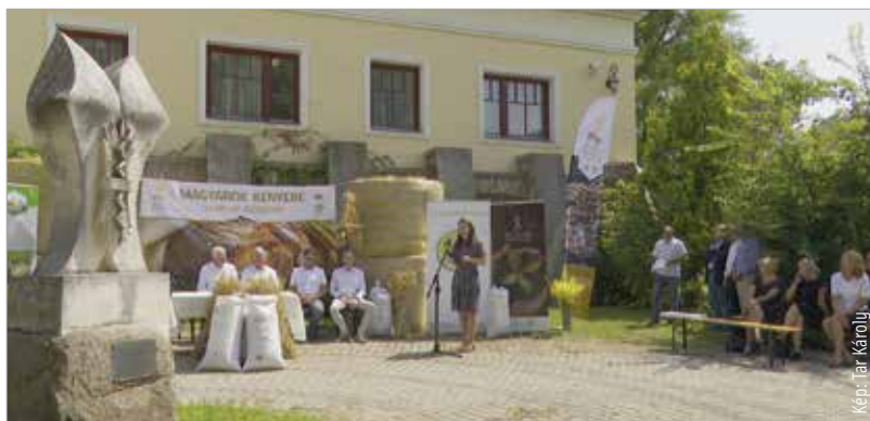
A Fejér megyei gazdák is összefogtak

Jakab István, a Magyar Gazdakörök és Gazdaszövetkezetek Szövetségének elnöke a tavalyi év összefogásának eredményéről is beszélt: „Az elmúlt esztendőben 1100 tonna gabona gyűlt össze. Több mint 540 civilszervezet, egyház, egyházak által fenntartott segélyszervezet működött közre az adományok célbajuttatásában, és több mint százezer gyermek számára jelentett komoly támogatást a felajánlásunk.”