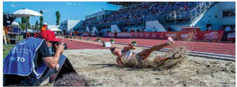
A médiaérdeklődés és a tribün telítettsége is a Continental Tour Gold szériába számító verseny rangjához méltó volt