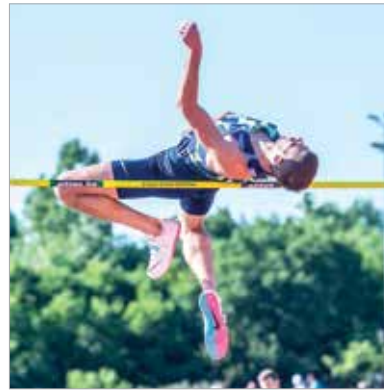
A magasugrás mindig a közönségkedvenc számok közé tartozik, ezúttal is nagyon látványos volt