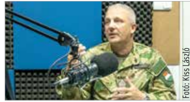
Somogyi Zoltán dandártábornok, a Közép-európai Többnemzeti Hadosztály-parancsnokság törzsfőnöke, aki egyben a parancsnokság magyar katonáinak rangidőse is

A horvát és a magyar katonák közötti kapcsolat igen gyümölcsöző. Az állomány döntő többsége szolgált már korábban nemzetközi környezetben, ennek köszönhetően felkészülten állnak minden kihívás elé, miközben képesek segíteni, mentorálni a társaikat is.