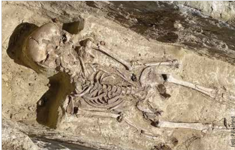
A tervásatás során harminchat veszélyeztetett sírt tártak fel a régészek

Innen alig több mint egy kilométerre helyezkedik el a Cobácai-patak túloldalán az orondpusztai avar kori temető, ahová a hatodik-hetedik században temetkeztek, az úgynevezett kora és középső avar korban. A tavasszal felfedezett újabb temetőben azonban jóval későbből származnak a leletek.