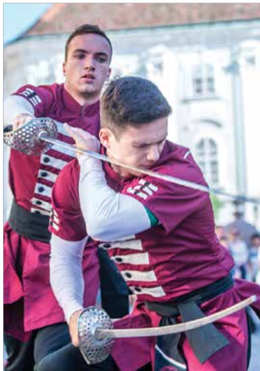
Színre lépnek a hagyományörzők is: hétről hétre újabb csapat tart bemutatót a belvárosban

A Művészkorzót követően a látogatók megtekinthették a Fejér Baranta Hagományörző Sportegyesület tagjainak bemutatóját, akik megidéztek az évszázadokon át ismert, és a magyar nép körében gyakorolt fegyveres és kézi küzdelmi formákat, és az Árpád-házi királyokat idéző történelmi óriásbábok is megjelentek a belvárosban. Végül klasszikus zenei slágerek, közismert dallamok szólaltak meg az Alba Regia Szimfonikus Zenekar fafúvósainak előadásában a Zichy ligetben.