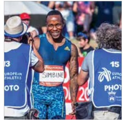
Akani Simbine 9,84 másodpercet futott 100 méteren. Magyarországon soha senki nem futott még ennél gyorsabban!