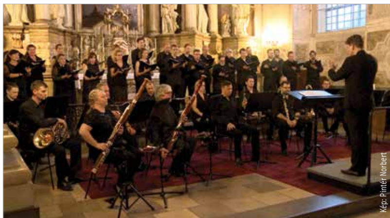
A Szent Imre-templomban kivételes hangversenyen ismerhették meg Bruckner munkásságát a zenerajongók