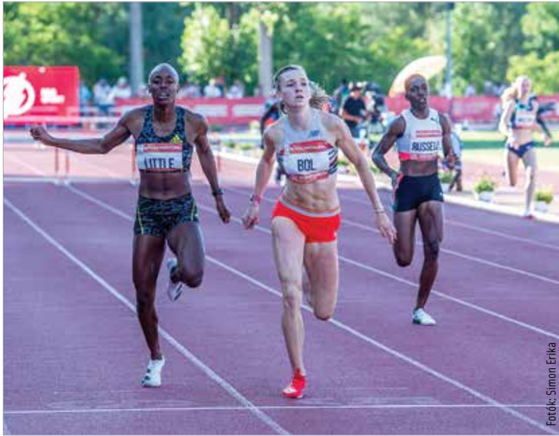
A 400 méteren idén Európa-bajnok Femke Bol a Gyulai Memorialon 400 gáton utasította maga mögé a mezőnyt

Nyolcadszor adott otthont a Breggyó közti Regionális Atlétikai Centrum a Gyulai István Memorialnak. A sztárgárda garantálta a színvonalat, ami talán a vártnál is magasabb volt. Az olimpiai és világbajnokokat felvonultató mezőny olyan eredményeket produkált, hogy azok értékszáma a 2021-es év eddigi legjobb versenyévé tette a fehérvárt, megelőzve több, Gyémánt ligába tartozó viadalt.