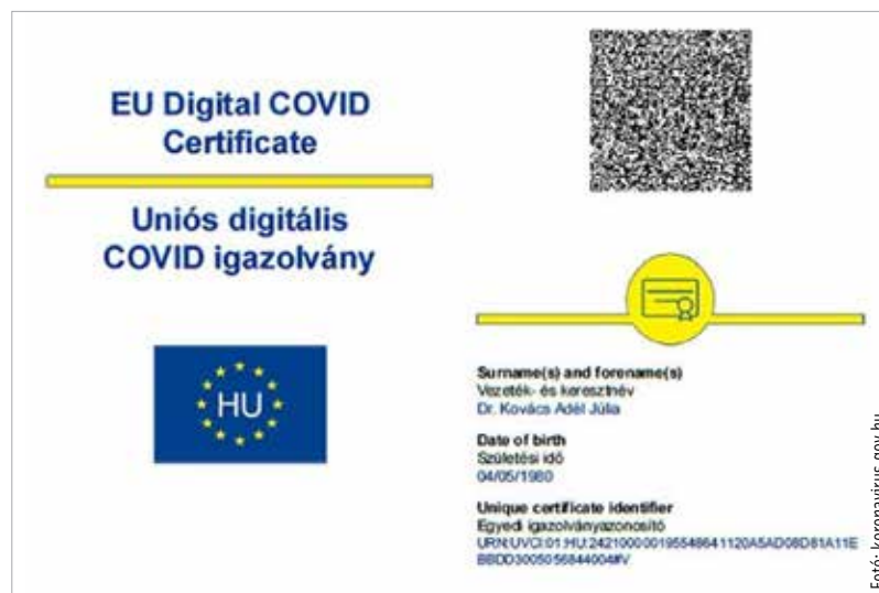
A háziorvosnál is igényelhető

Az igazolást legegyszerűbb elektronikus változatban letölteni, így elkerülhetjük a személyes ügyintézkedést. Ezt a már május eleje óta működő