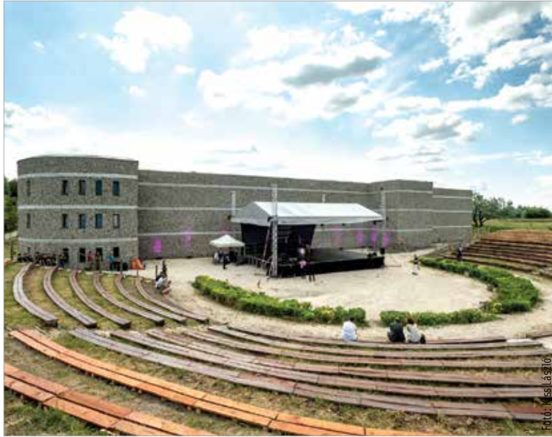
A korszerű színpad húszmillió kormányzati támogatással jöhetett létre