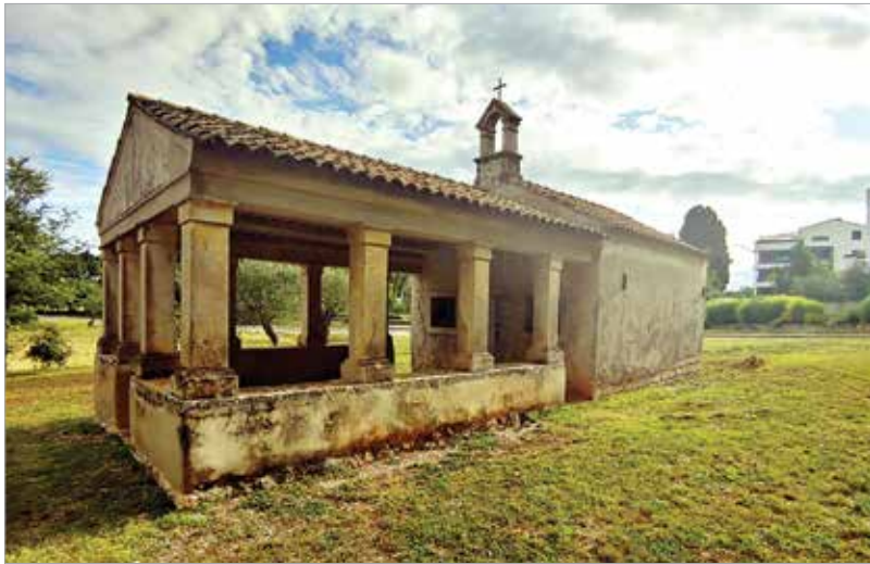
A tenger mellett a történelmi emlékek is vonzóak

A fentiek ellenére sem ugyanolyan egyszerű egy külföldi vakáció megszervezése, mint a járvány előtt, hiszen minden ország más és más beutazási feltételeket határoz meg, melyek akár naponta is változhatnak, ráadásul az egyes oltástípusok elfogadottsága is változó. Az elérhető információk is gyakran pontatlankok, az interneten, főleg a közösségi médiában pedig elképesztő álhírtömeggel találkozhatunk.