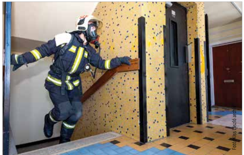
Amúgy sem könnyű, de teljes menetfelszerelésben igazi kihívás a lépcsőfutás!