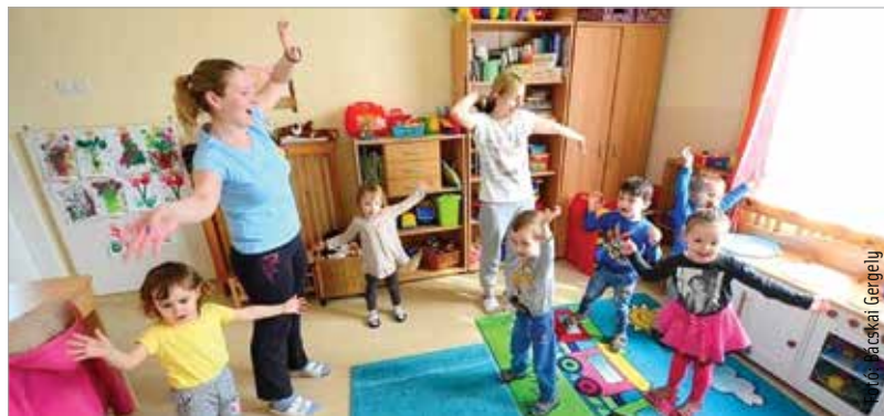
Az utóbbi években a székesfehérvári bölcsődékben sok felújítás történt, így szép, igényes környezetben tudják biztosítani a gyerekek ellátását

szorszép, a Szeder és a Tündérvért Bölcsődében várják a kicsiket. A kérelem az intézmény szakmai programjában meghatározott formanyomtatványon – jelenleg elsősorban online formában – nyújtható be a bölcsődevezetőhöz, de lehetőség van előre egyeztetett időpontban a személyes ügyintézésre is. A bölcsődék elérhetősége, szakmai programja a www.szekesfehervar.hu honlapon, az információk/intézmények/bölcsődék fülön érhető el. Sajátos nevelési igényű gyermekek, valamint korai fejlesztésre és gondozásra jogosult gyermekek ellátására a Százszorszép és a Nyitnikék Bölcsőde rendelkezik a szükséges feltételekkel. (Forrás: ÖKK)