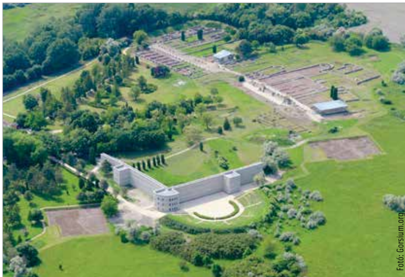
Megújult a színpad és a nézőtér Gorsiumban