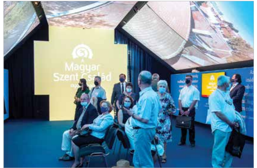
Modern vizuális eszközök, ezeréves tartalom

A polgármester kiemelte az épület létrehozásának jelentőségét, ami a fehérváriakat, Fejér megyeiket, magyarokat vagy az idelátogató külföldi vendégeket fogja megszólítani, méltó körülmények között bemutatva a város és az ország múltját, értékeit.