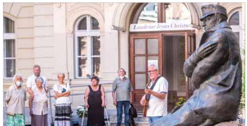
Gyóni Géza költészete ma is hiteles képet mutat az első világháborúról