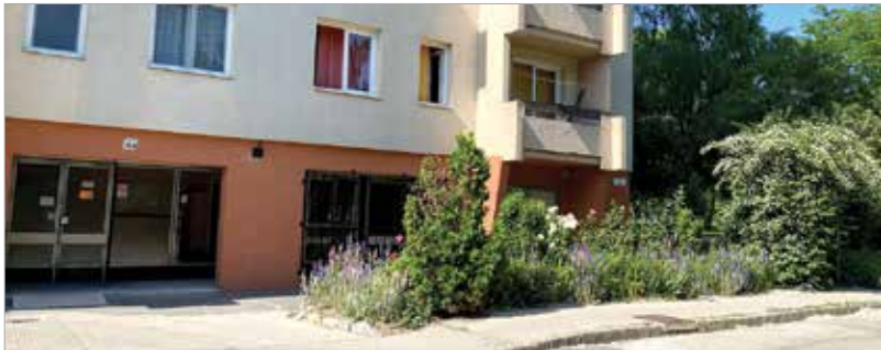
A Budai úton ilyen csodás lila mezőre bukkantunk

Városszerte számtalan társasház tövében pompáznak színes virágoskertek: az ott lakók gondos kezeinek hála idén is gyönyörű látvány fogad a lakótelepeken sétálva is. Körülnéztünk a városban a Kőfém-lakóteleptől a Budai úton és a Rákóczi úton át a Szedreskertig, meg is mutatjuk, milyen szépen gondozott társasházi kerteket találtunk mindenütt!