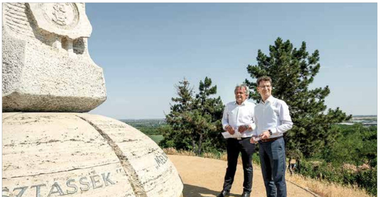
Az Aranybulla kibocsátásának nyolcszázadik évfordulójára méltó módon újulhat meg az emlékmű és környezete

„Nemcsak az emlékmű újul meg, hanem annak környezete is. Lesz egy kilátóterasz, erdei pihenő és sétaút is. A közelben húzódó biciklilit használói számára kerékpáros pihenő épül. Bővítjük a parkolók számát, növényeket telepítünk, úgyhogy ez egy fantasztikus kirándulós hely lesz a fehérváriak és az ide látogatók számára egyaránt.” – tájékoztatott a helyszíni bejárásán Vargha Tamás országgyűlési képviselő, miniszteri biztos. A munkaterületet kedden adták át a kivitelezést végző szakembereknek. A két ütemben zajló rehabilitáció célja, hogy a jelenleg elhanyagolt, illetve az emlékmű körüli kihasználatlan terület alkalmassá, méltóvá váljon komolyabb megem-