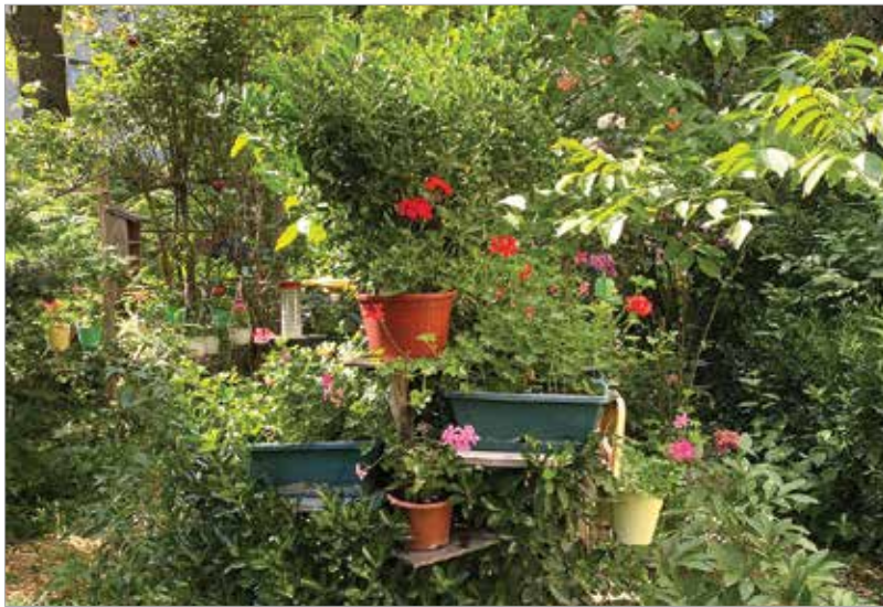
Még mindig a Köfémén, ezúttal a 42. szám előtt: buja kert, eklektikus cserepes elrendezés és rengeteg zöld mindenütt!