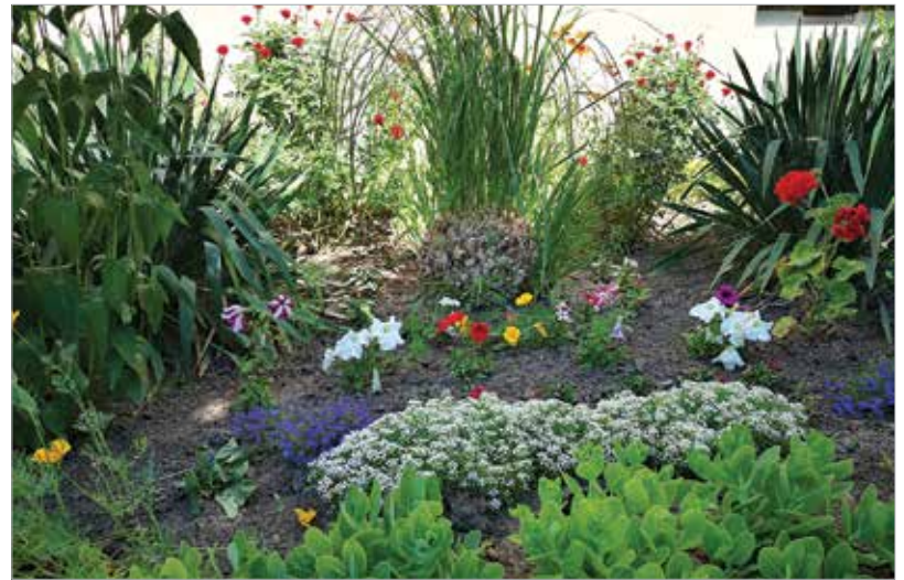
A Rákóczi utcában nagymamánk klasszikus virágokertjét idézi a ház előtti kompozíció