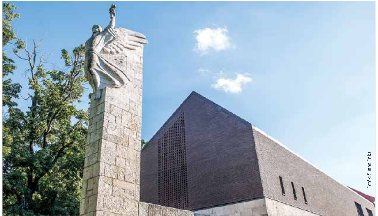
Ez a látvány fogadja a látogatót a Várkörút felől

A látogatóközpont a zarándokút központi állomása, mely interaktív módon, a legkorszerűbb eszközök-