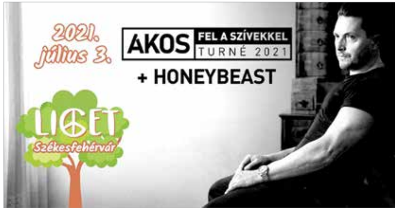
Fel a szívekkel!

területén létrehozott rendezvényhelyszínen, a Ligetben. Pénteken délután ötkor kezdődik ByeAlex koncertje, szombaton pedig négykor ér Fehérvárra Akos Fel a szívekkel! című turnéja, melyen fellép a HoneyBeast is. A rendezvényre csak védettségi igazolvánnyal rendelkezők léphetnek be!