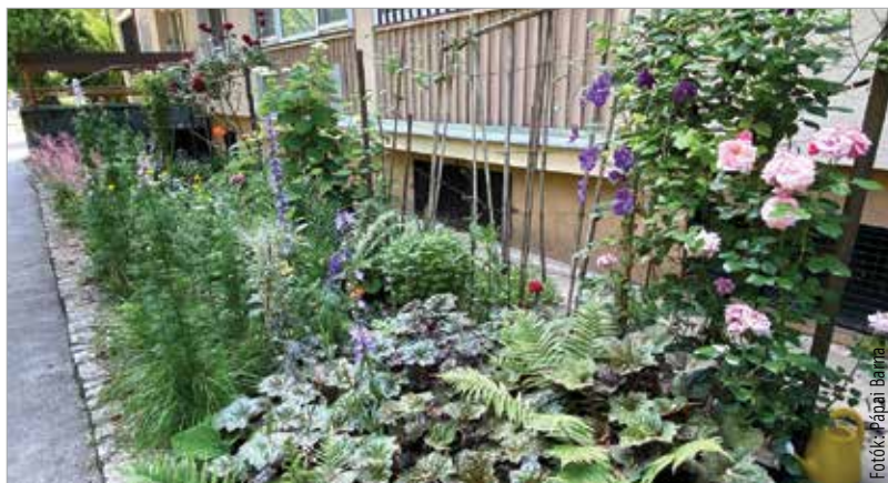
A Kőfém-lakótelep 32-34-es számú háza előtt pompás kertre csodálkozhattunk rá