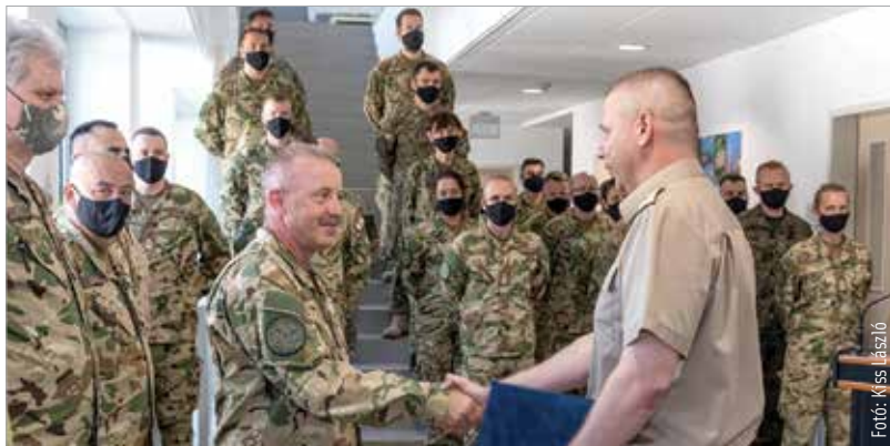
A szervezetnél szolgáló magyar és külföldi állomány az első értékelőgyakorlat óta – a hároméves rotáció miatt – szinte teljesen kicserélődött, a tavaszi gyakorlat így kiváló alkalmat nyújtott a jelenleg itt szolgálók értékelésére

oldottak meg. A Magyar Honvédség Parancsnoksága ellenőrzése és NATO-megfigyelők jelenlétében lezajló művelet újabb kiváló minősítést eredményezett, melyet hétfőn délután Ruszin-Szendi Romulusz vezérőrnagy, a Magyar Honvédség parancsnokának aláírásával hitelesítették a székesfehérvári Nagysándor József laktanyában. Az oklevél-aláíró ünnepségen a tizenkét NATO-nemzet katonai szakembereiből álló alakulat jelenlévő tagjait Topor István ezredes, a NATO-erőket Integráló Elem parancsnoka is köszöntötte.