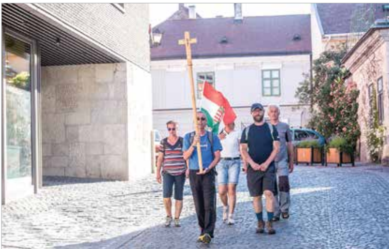
Érkeznek a zarándokok