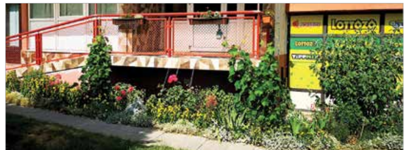
Nyáron a Garzonház is mediterrán arcát mutatja