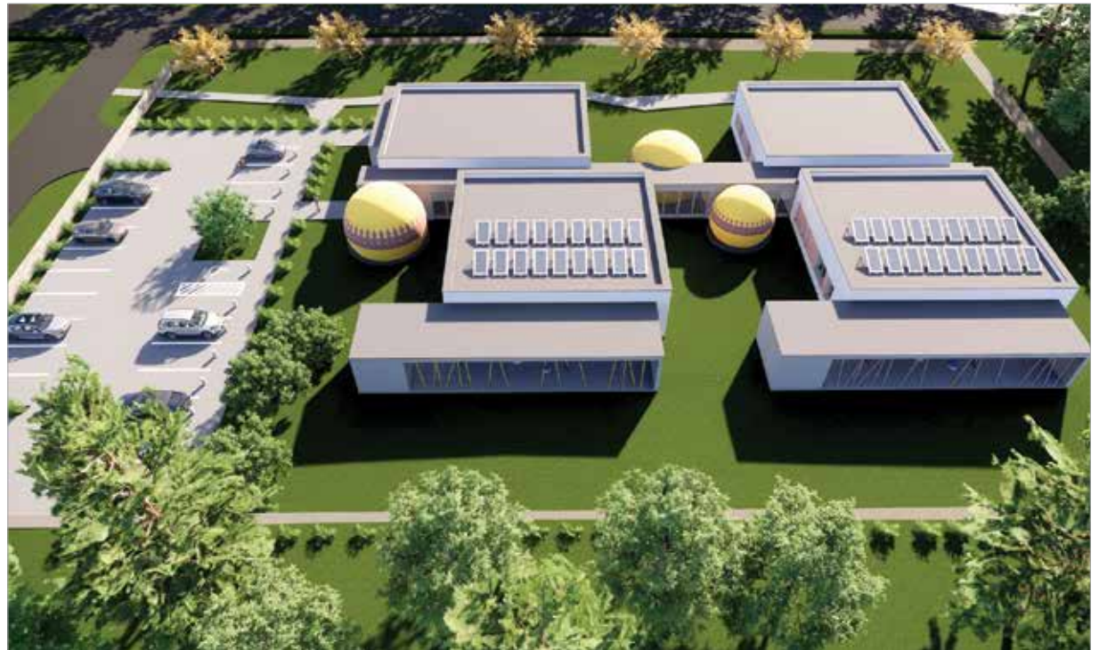
Az épület szerkezete a főtengelyen alapul, ehhez kapcsolódnak a gondozási egységek és a konyhablokk