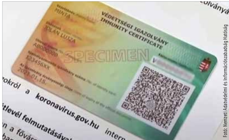
A védettségi igazolvány elektronikus igényléséhez ügyfélkapu-regisztráció szükséges

Ha valaki korábban igazoltan átesett a koronavírus-fertőzésen, akkor a fertőzésből való felgyógyulás napja jelenti a védettség kezdetét. A felgyógyulás napja az, az Elektronikus Egészségügyi Szolgáltatási Térben (EESZT) nyilvántartott dátum, amikor negatív PCR-tesztje vagy antigén-gyorstesztje lett, miután korábban pozitív tesztje vagy tesztjei voltak. Abban az esetben, ha valakinek csak a fertőzést igazoló pozitív tesztje van, de több teszt nem készült – mert például tünetmentes vagy enyhe tünetes volt, és otthoni karanténban maradt – akkor a teszt utáni tizedik nap a felgyógyulás hivatalos napja. A védettségi igazolvány érvényessége az igazolt felgyógyulást követő hat hónap. A kártya ebben az esetben is ingyenes, az állam hivatalból postázza, annak kiállítását külön nem kell kérni.