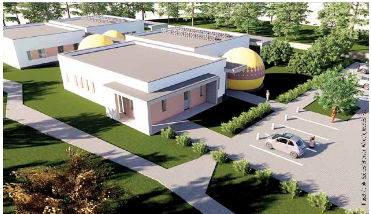
Igy fest majd Maroshegy új bölcsődéje a látványterv szerint

Az új bölcsőde engedélyezési tervei elkészültek, jelenleg a kiviteli tervek kidolgozása zajlik. Az építésre vonatkozó közbeszerzési eljárást várhatóan még idén tavasszal kiírják. Az épület a tervek szerint 2022 végéig megépül, és mindenben megfelel majd a legkorszerűbb szakmai, szolgáltatási, építészeti és energiahatékonysági kívánalmaknak.