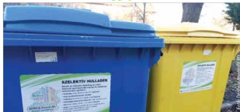
Több szelektív gyűjtőedény lesz a lakótelepeken, és ugyanabba az edénybe tehetjük majd a műanyagot, a fémét és az üveget

„Ezzel jelentősen javul a szállítási hatékonyság, és a gyűjtőpontokon is minden alkalommal teljes rendet tudunk hagyni. A jelenlegi válogatórendszerünk vegyes