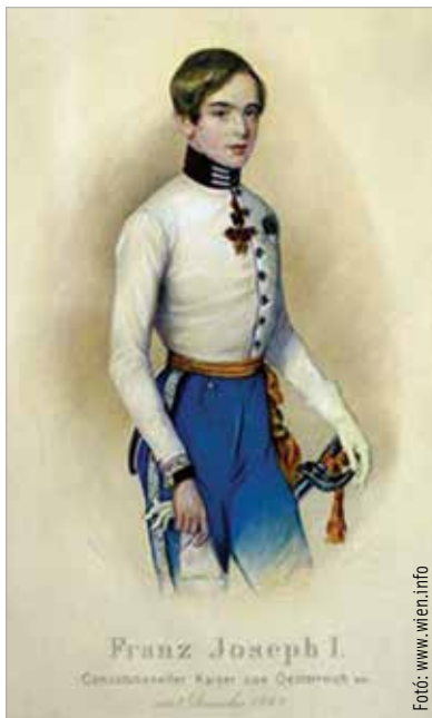
I. Ferenc József, az ifjú császár

Amikor az alcsúti hóvirágmezőn sétálunk, szenteljünk egy gondolatot Erzsébet Franciska emlékének, aki majdnem császárné lett Ferenc József oldalán!