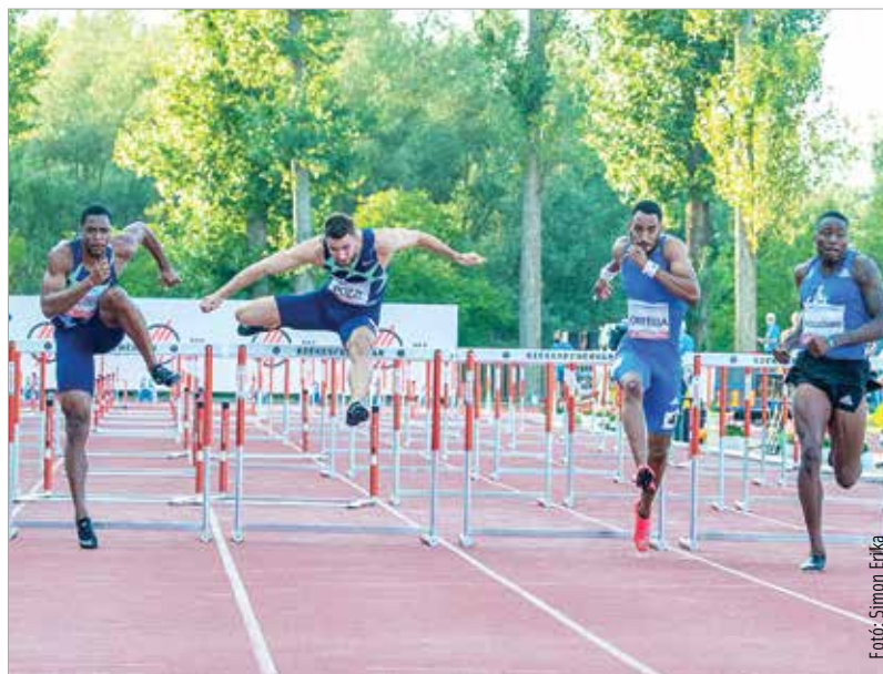
Tavaly a spanyol gátfutó, Orlando Ortega (balról a második) érte el a verseny legjobb eredményét

A szervezők szándéka szerint a versenyen idén is világ- és olimpiai bajnok atléták vesznek részt, köztük a sportág legnagyobb hazai sztárjaival. A Gyulai István Memorial, mint rangos nemzetközi megmérettetés, fontos állomás a 2023-as, budapesti atlétikai világbajnokságra készülő fiatal magyar atlétáknak is, akik így hazai pályán versenyezhetnek a legnagyobb külföldi sztárokkal – remélhetőleg magyar közönség előtt! A szervezők arról, hogy szurkolók jelenlétében vagy zárt kapuk mögött rendezik az idei versenyt, egy későbbi időpontban, az akkor aktuális járványügyi helyzet alapján döntenek majd. A program bővül: a tervek szerint az idei viadalon húsz nemzetközi versenyszám megmérettetéseit kísérhetjük figyelemmel, így ismét kétnapos sztárparádé várható. A már-már elmaradhatatlan, magyar sikerekben gazdag férfi és női kalapácsvetést