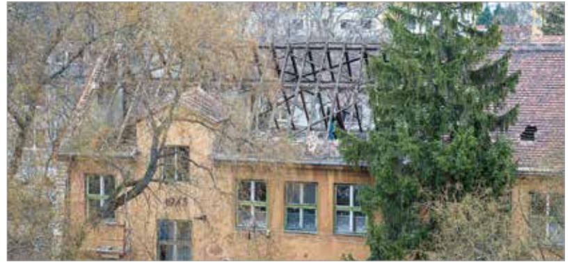
A tetőtér beépítése is megkezdődött

Az új tornaterem mellett táncsterem, kórusterem és foglalkoztatók épülnek, kicserélik a nyílászárókat, és akadálymentesítik az udvart. A nagyszabású felújítással a pedagógusok, a diákok és a szülők régi vágya teljesül, hiszen a nagy múltú intézmény a város zeneoktatásának fellegvára: húsz osztályába ötszázötvennégy gyermek jár, akiket csaknem hatvan pedagógus tanít.