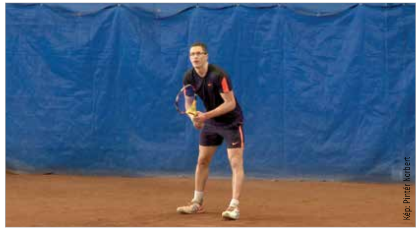
Nézők nélkül a teniszező is magányos!