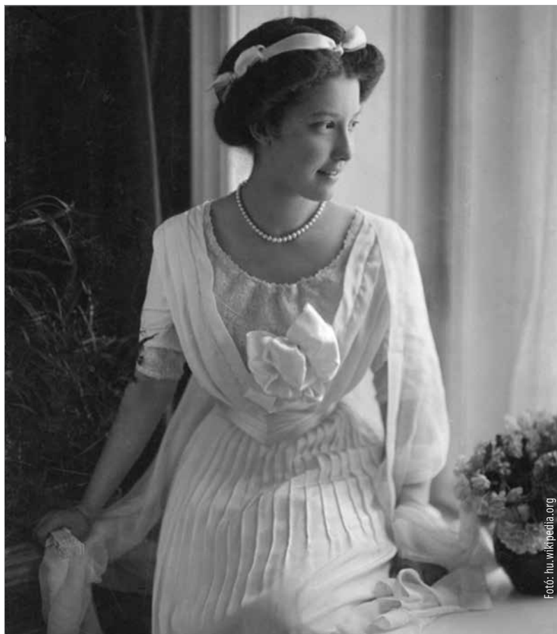
Erzsébet Franciska főhercegnő

A vele egykorú, ifjú Ferenc József császár éppen feleséget keresett magának. Szétnézett a számításba vehető, legszebb hölgyek között, és reménytelenül szerelmes lett a porosz király Anna nevű unokahúgába. De az erős, férfias poroszoknak nem tetszett a természetére nézve meglehetősen „karcsú” ifjú, akinek a fehér kabátja felett egy ábrándosnak tetsző arc mutatkozott, és Krúdy szerint a rossz nyelvű utókor „néha vitázni is mert származásán, az atyaság kérdése felett”. Európa legelső gavallérjának mondták őt, „miután II. Vilmos a hibás karja miatt nem mehetett férfiideálszámba, Angliában pedig a nagy öregasszony uralkodott”. Krúdy Gyula fullánkossá szavait kérem kölcsön, hogy visszaadjam, amit a köznép császára külsejéről gondolt: „A gesztenyeszínű fürtök még abból a korból göndörödtek, amikor a nagyralátó és elszánt édesanya, Zsófia simogatta ezeket a fürtöket a lainzi kastélyban. Vöröskés bajusza ritkásabb, mint egy csapatvezérhez illenek, és tőszomszédságában feketére növekedett az a szakáll, amelyet Kaiser-Bartnak nevezett ötvenmillió alattvaló. A testhez álló formaruhanak a császár nagy kedvelője volt, mert ezeknek nadrágszáraiban pontosan megmutatkoznak a lovaglástól izmos combok és a nyereg mellett növekedett térdek. A szűk kabátok, bár a későbbi korban nagyon hátráltatják a jó emész-