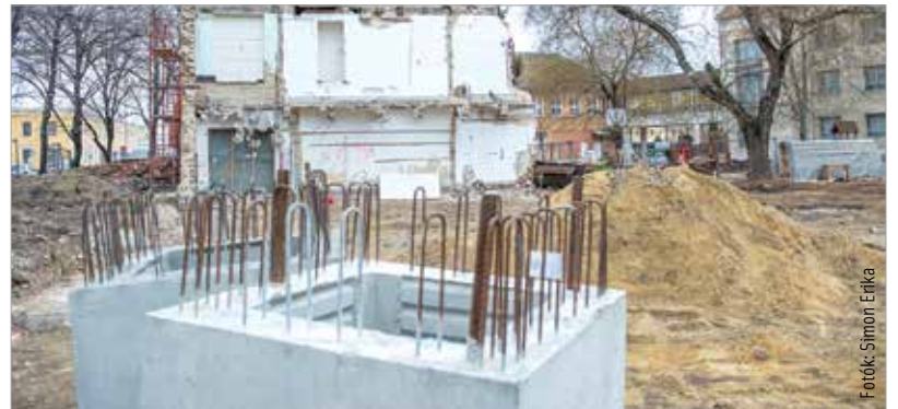
A betonelemek rövidesen a helyükre kerülnek