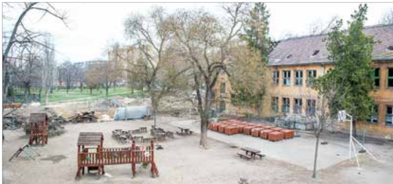
Jövőre teljesen más képet mutat majd az iskola udvara!