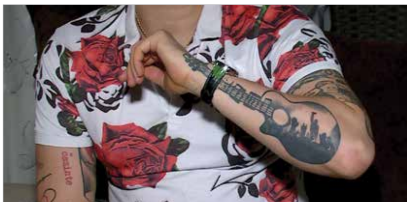
Gábor alapélménye az EDDA iránti rajongás

Vagy tudja mit, elég lenne pár őszinte szó is, mitől érzem, nem csak magamnak létezem, s nemcsak bennem van tengernyi érzélem, hanem másnak is fontos kicsit, hogy vagyok, meg, hogy holnap is leszek, óóó, de szép érzések ezek, ezekből egy egész kosárral veszek, egyszerű vacsora mellé, belőlük nagykanállal eszek. Maradj még álom, kérlek, ne küldd el a nénit, van maszk, no para és még két óra este hétig.