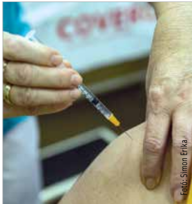
A hatvan év alatti krónikus betegek oltását az AstraZeneca-vakcinával végzik

A további koronavírus-mutációkkal kapcsolatban kiemelte: kilenc főnél a cseh variánst mutatták ki, de brazil és dél-afrikai mutánst még nem tudtak beazonosítani. Találtak továbbá harmincnégy olyan mintát, melyekben járványügyi szempontból nem jelentős mutáns van jelen.