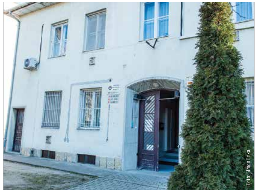
Hétfőn kezdődött a rendelő felújítása, és várhatóan jövő év áprilisáig tart

intézményt. A felújítást követően hét felnőtt háziorvosi és nyolc fogorvosi alapellátást helyeznek el az épületben, a Kégl György utca 3. szám alatti épületből is ide költöznek át a fogorvosok. A háziorvosok a munkálatok alatt a Mészöly Géza utcai rendelőben folytatják a gyógyítást. A csaknem 538 millió forint értékű, uniós forrásból finanszírozott beruházás jövő év áprilisában lesz kész.