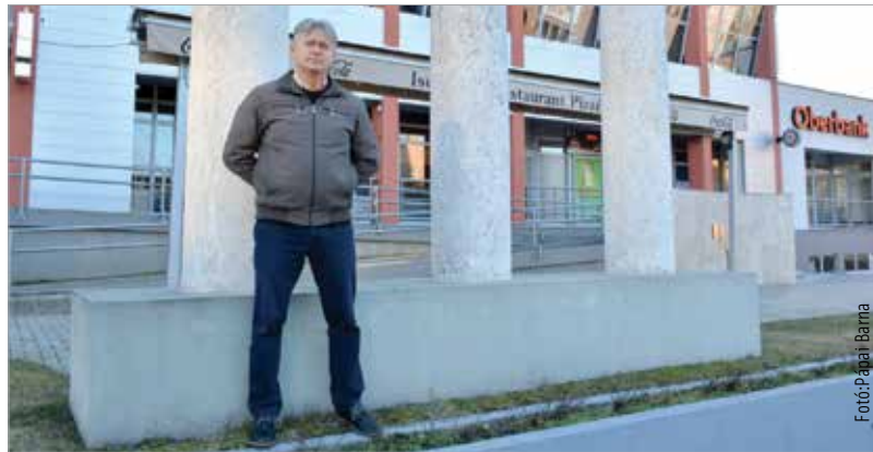
Mai napig jó szívvel gondol vissza egykori munkahelyére

Amikor az ember átvette a műszakot, akkor még nagyon pörgős volt, változatos, mozgalmas. Sok kései vendég akkor érkezett meg a hotelbe. Ejjel beindult az Alba bár, volt, aki oda is a hotelportán keresztül érkezett. A bár zárása után kicsit csendesebb órák következtek. Hogy könnyebben ébren maradjunk, az egyik kollégával nyári esteiken a szálloda lépcsőjén ülve arra kötöttünk fogadást, hogy öt percen belül hány macska fog átkelni előttünk a zebrán. Hajnalban újra fel-