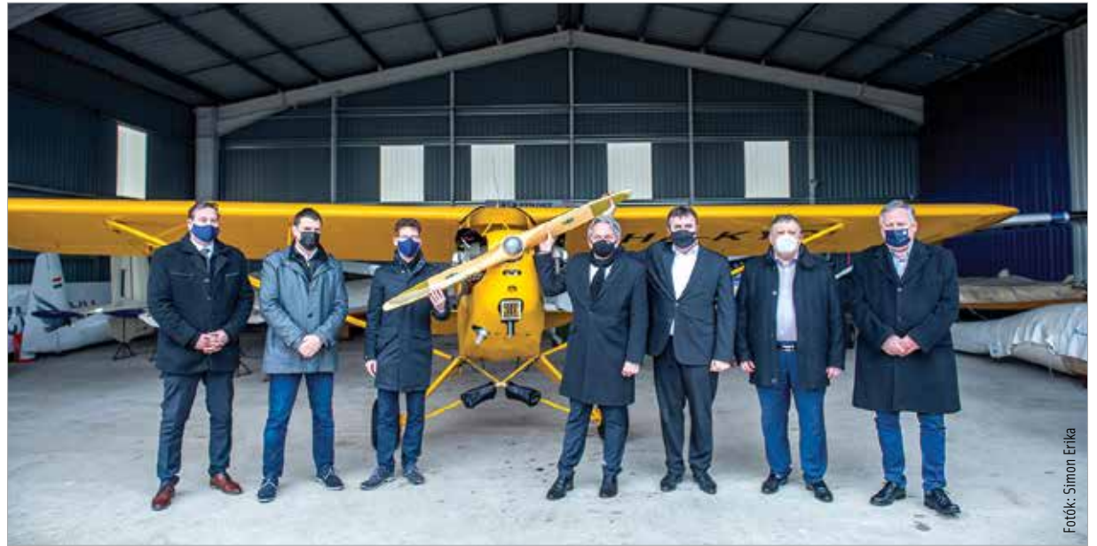
Palkovics László innovációs és technológiai miniszter elsőként az Ikarusnál, majd a börgöndi repülőtéren tárgyalt Vargha Tamás országyűlési képviselővel és Cser-Palkovics András polgármesterrel a székesfehérvári fejlesztésekről

A börgöndi reptér is része lenne annak a drónfejlesztési koncepciónak, amit a minisztérium dolgozott ki, és hamarosan a kormány elé kerül. Palkovics László kiemelte, hogy a szállítási célú alkalmazástól a mezőgazdasági használaton keresztül az időjárásbecslésig egy sor lehetőséget rejt a dróntechnológia. Ehhez kell egy repülőtér, ahol kellő magasságban tudják használni a légtérrel. Hozzátette: az Óbudai Egyetem Alba Regia Műszaki Karának tudományos és technológiai parkját két telephelyen képzelik el: az egyik Székesfehérváron belül, a másik pedig Börgöndön lenne, a repülőtér melletti ipari parkban.