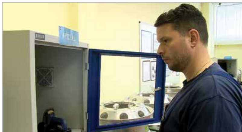
A mérés-technikusok a gyár egyik legrégebben együtt dolgozó csapatát alkotják