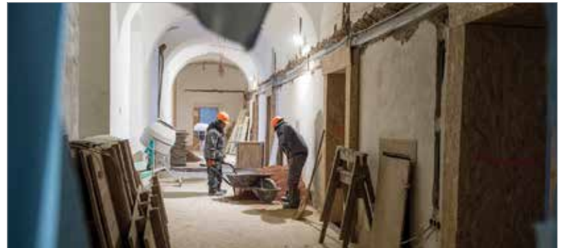
Az akadálymentesített, lifttel felszerelt épületben a tájékoztató, az információátadást digitális tárlatvezetői rendszer segíti majd, automatizált funkciókkal