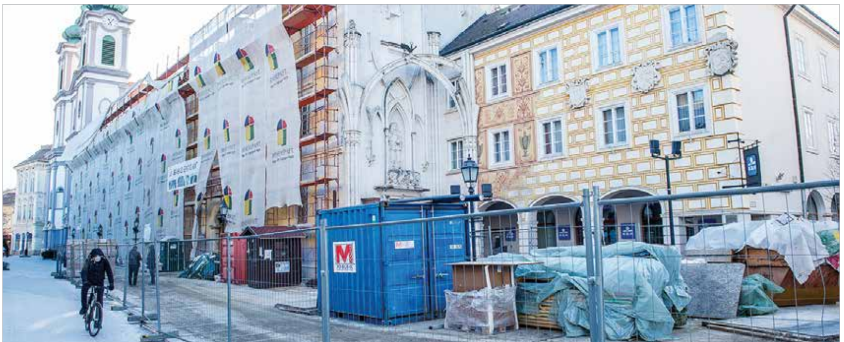
A felújítás a terveknek megfelelően halad. A munkálatok befejezésének céldátuma 2021. október 30.