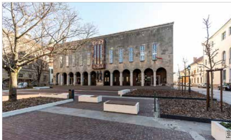
Bár az épületbe most nem léphetünk be, a könyvtári szolgáltatások elérhetők a Bartók Béla téren: az ajtóban-ablakban vehetők át az előre egyeztetett, összekészített kölcsöncsomagok

Sok könyv illetve dokumentum azonban az olvasóknál maradt – őket most arra kéri, hogy hozzák vissza a régóta kint lévő könyveket, hiszen egy-egy darabra sok esetben már fél tucatnyi előjegyzést vettek fel az elmúlt hetekben-hónapokban: „Van olyan sikerkönyv, amire már öt-hat előjegyzést is felvettünk, ezeket várjuk vissza mielőbb! Azt szeretnénk kérni, hogy akinek lehetősége van rá, jöjjön el a nyitvatartási időben, és hozza vissza ezeket a könyveket! A felhalmozott könyvekre nem kérünk most késedelmi díjat, csak azt szeretnénk, hogy érkezzenek vissza ezek a rég várt dokumentumok!” – kéri az olvasókat az igazgató asszony.