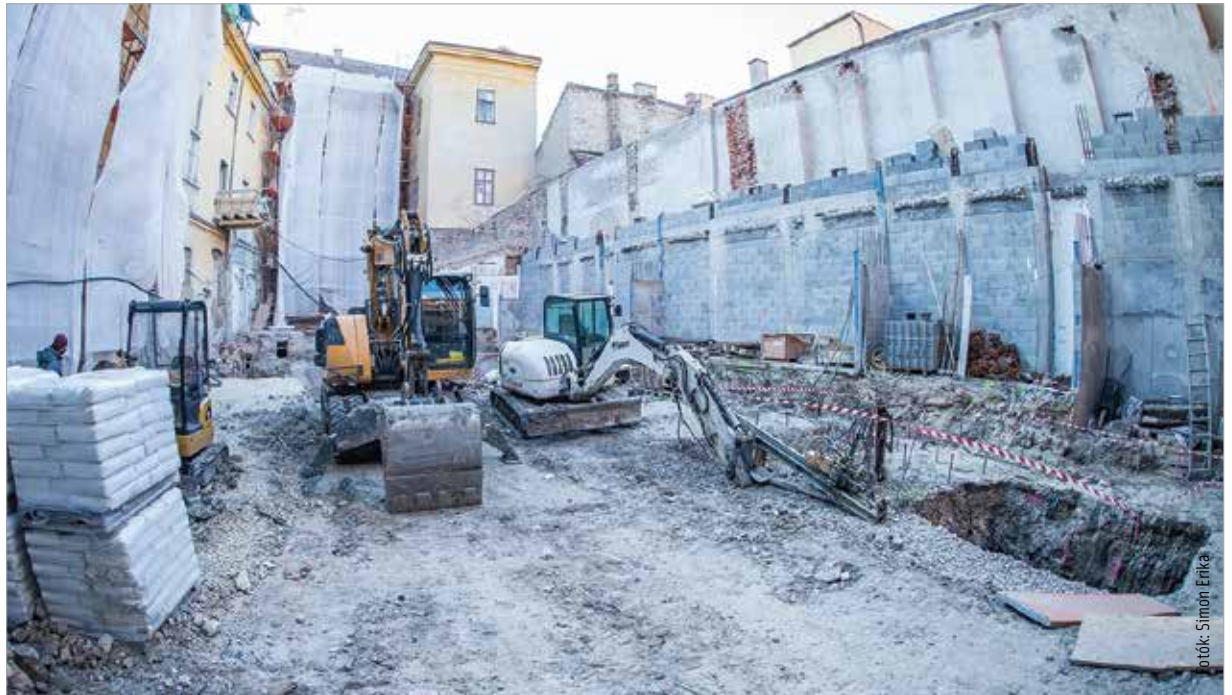
A rekonstrukció keretében beépítik a gazdasági udvart, létrehozva ezzel egy új előcsarnokot, ahol fogadják majd a látogatókat. A több mint nyolc méter belmagasságú tőről a galériaszintre vezető lépcső indítja majd a múzeumi látogatást.

A bruttó 5,3 milliárd forint értékű rekonstrukció során korszerűsítik a védett történelmi értéknek számító épületet, melynek falrendszere változatlan marad. Magas szintű gépészeti és elektromos korszerűsítéssel lehetővé válik, hogy szabályozott légállapotú kiállítóterek jöjjenek létre. Cser-Palkovics András polgármester lapunknak elmondta: „Része az a nagy Árpád-ház-programnak, amelyben rengeteg dolog történik, de talán az egyik legjelentősebb a múzeumépületünk, a rendház épületének teljes megújítása. Olyan korszerű technológia lesz benne, amely lehetővé