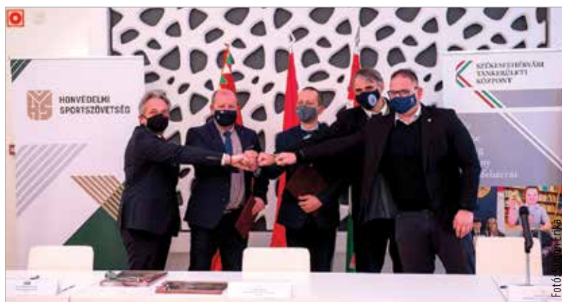
Az ünnepélyes aláírásra a Hiemer-ház báltermében került sor

Január 21-én és 22-én, csütörtökön és pénteken fasorfenntartási munkákat végeznek a Hosszú sétátér Horvát István utca és Torony sor közötti szakaszán. A gallyazás idején a szakaszt lezárják, nem lehet parkolni sem, mert a munkálatok során az autókban anyagi kár keletkezhet.