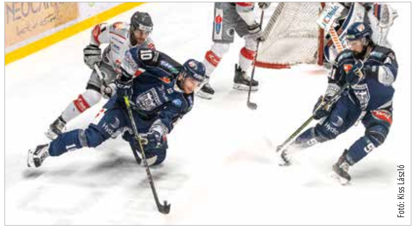
Eddig remekel a Volán!

erősebb támadója, aki harmincnégy mérkőzésen harmincöt pontot szerzett. – „Jobban is szeretem az ilyen időszakot, mint azt, ami most vár ránk!” A január huszonkilencedikei, Bolzano elleni összecsapásig nem játszik mérkőzést a csapat, van idő a finomhangolásra az utolsó négy összecsapás előtt. És hogy a remek szezon ellenére van min dolgozni, arra talán pont az elmúlt hétvége két hazai találkozója mutatott rá: a Dornbirn ellen nem sikerült gölt löni sem (0-3), míg az Innsbruckot csak hosszabbításban verte a gárda. Hogy mennyire kényeztette el szurkolóit a klub, jól mutatja, hogy nem ilyen hétvégékhez szoktunk!