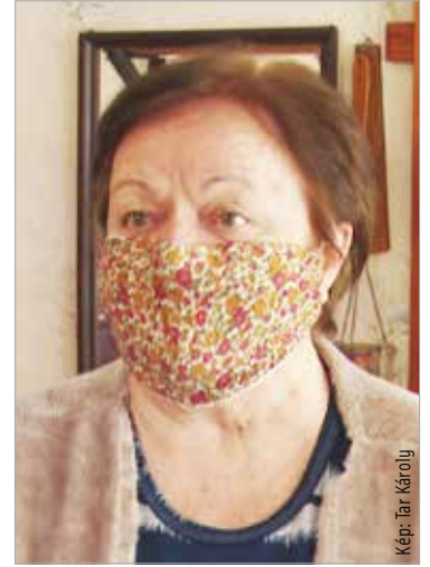
valaki nagyon komoly mellékhatást tapasztalt volna.”

„Számomra nem kérdés, hogy beoltassam magam! Szerintem nincs más esélyünk a vírus legyőzésére. Az önkormányzat igényfelmérést végzett az oltással kapcsolatban a nyugdíjasok körében. Az Öreghegyi Nyugdíjasklub vezetőjeként elmondhatom, hogy a száztizenkét fős klubunk tagjainak nagy része az oltást pártolja. Hetvenöt embert sikerült elérnem, közülük négyen egyértelműen elutasították a vakcinát, de több mint ötvenen regisztráltak már. Néhányan vannak, akik még kívánnak, de nem utasítják el. Mindenkinek át kell gondolni, hogyan tudja megvédeni magát és a családját, mert más védekezési mód ebben a pillanatban nem áll rendelkezésre. Én az influenza ellen is beoltattam magam, nem volt rossz tapasztalatom, és nem is hallottam, hogy