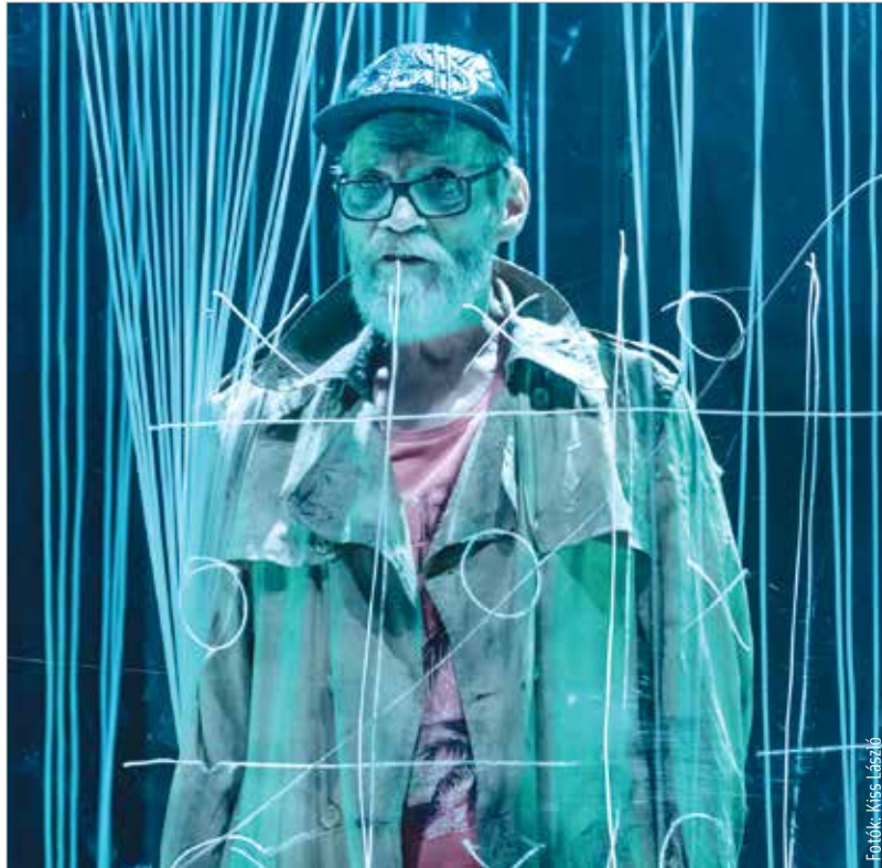
Közeleg az idő: Knuttebarn szerepében

Megérkeztek 2013-hoz, a Vörösmarty Színházhoz. Tudjuk, hogy ezt a társulatot sem a szél fújta össze.