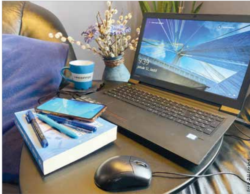
A kék szín segít az elcsendesedésben

Ez a szín nemcsak képes fokozni a szellemi aktivitás, pozitívítást sugároz, de a legerősebb pszichológiai hatással bíró árnyalatnak tartják.