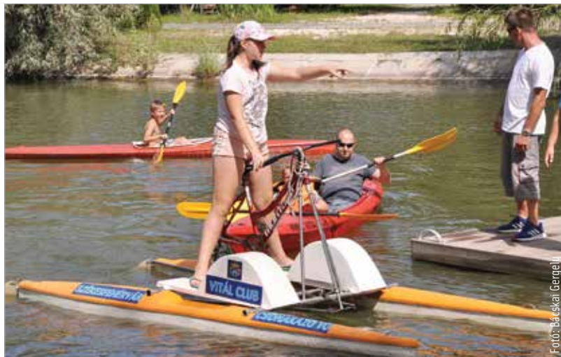
A Csónakázó-tó és környéke kedvelt helyszín a fiatalok körében is

A válaszok további negyven százaléka olyan helyeket jelölt meg, ahová inkább a természeti környezet, az utca vagy a hely adottsága miatt mennek a fiatalok. Sok említést kapott a belváros, a palotavárosi tavak, a Halesz, a Csónakázó tó, a Piac tér, a pláza teteje, a Rózsasziget,