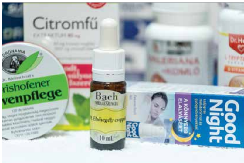
Ma már rengeteg elalvást és mélyalvást segítő szer létezik, közülük az egyik legnépszerűbb a virágterápiás csepp

A mellékvesekéreg gátoltsága vagy gyengesége is okozhat átváltsi zavarokat. Erre is megvannak azok a gyógynövények, amelyek segíteni tudnak. Azt látom azonban, hogy azok a szerek, amelyeket rendszeresen kell szedni, sokszor azért nem érnek célba, mert csak kevesen tudják betartani a rendszerességet. Erre jobban oda kéne figyelni, és türelmesebbnek kellene lenni! Nem biztos, hogy egy hét alatt fogunk visszatérni a normál alváshoz, elképzelhető, hogy több idő kell a szervezetnek.