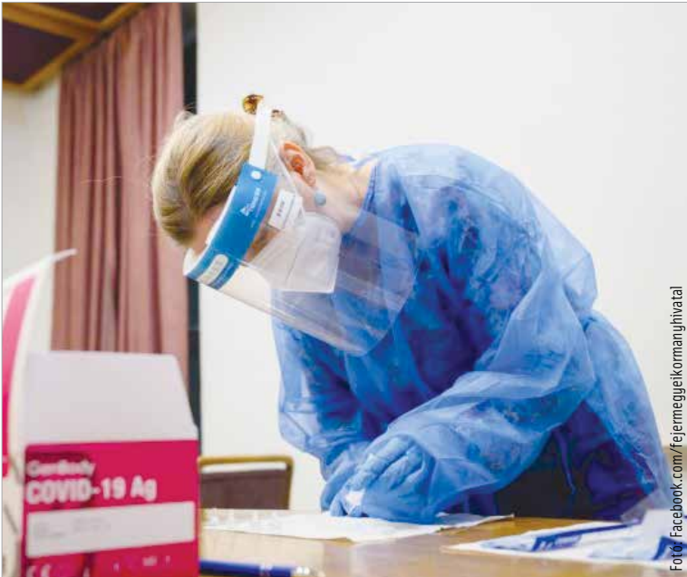
A vizsgálatok célja a járvány terjedésének további lassítása és az emberek egészségének védelme. Az érintettek a várakozás elkerülése érdekében a szoczsures.kh.gov.hu honlapon foglalhatnak időpontot.

A tesztelést a kormányhivatalok szervezik a január 16-17-i hétfő-gén. Országsszerte százhuszonhét mintavételi ponton várják az ágazatban dolgozókat – tájékoztatott a kormányhivatal.