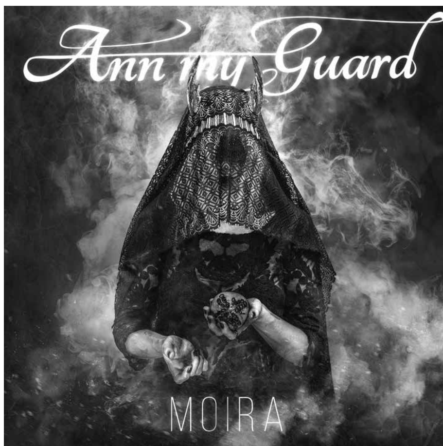
1. kép. A magyar Ann My Guard zenekar Moira című albumának borítója, amelyen Persephoné, az Alvilág királynője kortárs formájában látható

A szóban forgó zenei zsáner első megjelenését az 1960-as évek végére és az 1970-es évek elejére tehetjük, amely szellemi és kulturális értelemben is a nyugati civilizáció számára a nagy átrendeződések időszaka. Az amerikai hippimozgalom, a párizsi diáklázadások, a prágai tavasz, a hidegháború két pólusa, az ellenkultúra létrejötte, 1 valamint az USA határainak megnyitása a távol-keleti bevándorlók előtt 2