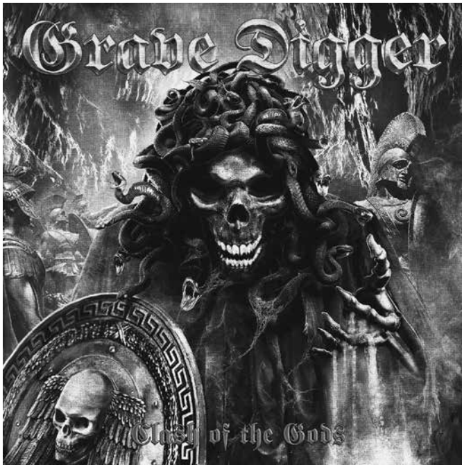
3. kép. A német Grave Digger zenekar Clash of the Gods című tematikus albumának borítója gorgó-parafrázissal

vett téma köré sikerült csoportosítani a szövegeket: kozmológia, teremtés, Alvilág, újjáéledés ( revival ), titkos tudás, az Ilias , az Odysseia , az olymposi tizenkettő, mitológiai helyek, egyéb mitológiai alakok. A homérosi eposzok a világirodalomban elfoglalt helyük miatt kiemelten kezeltetnek, az olymposi istenek is szintén kiemelt jelentőséggel bírnak, míg az „egyéb mitológiai alakok” típusba került az összes többi, a kisebb istenekkel, hősökkel, különös lényekkel, titánokkal foglalkozó dal. A címkézés során ráadásul az adott dalszöveg kiemelt alakja alapján került kategorizálásra egy-egy tétel, így például ha egy dal világosan Medusa alakjára összpontosít, akkor hiába jelenik meg benne Perseus figurája is, a „Medusa” címkét kapta meg (és fordítva). Továbbá minden olyan alak, lény, hely, amely valamilyen módon a halál utáni élettel kapcsolatos, az „Alvilág” címke alá került, legyen az Hádés, a Kerberos, Kharón vagy bármely alvilági folyó. Ennek oka elsősorban a metálzene fentebb hivatkozott gótikus-árnyas-kaotikus érdeklődésében keresendő, hiszen egy alvilági alak nem „pusztán” mitológiai figura, hanem a létezés végső kérdéseivel kapcsolatban álló hatalom.