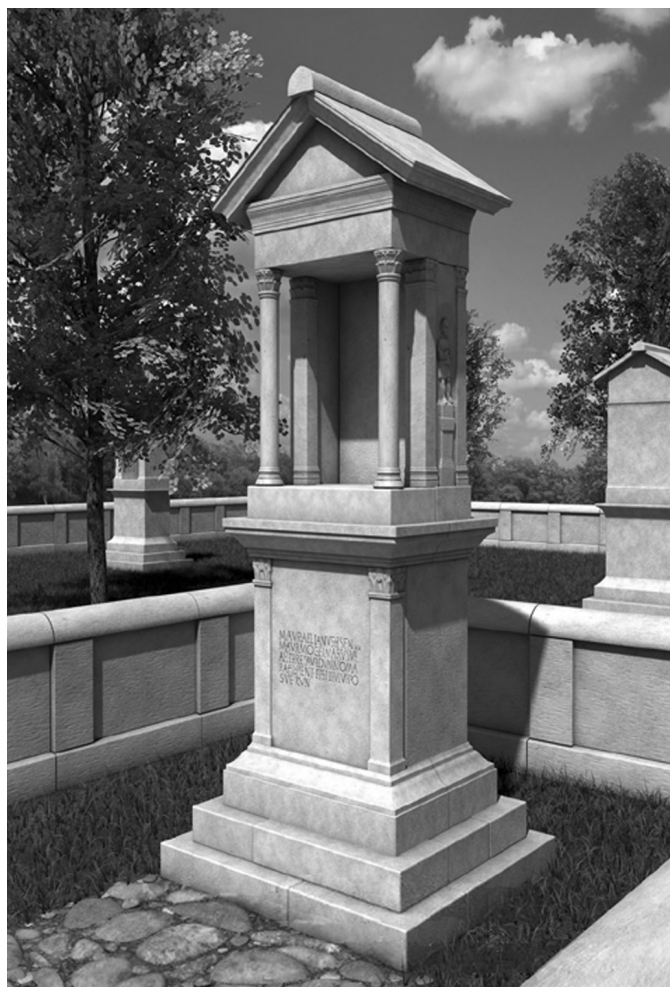
6. kép. A Rupp-hegyi sírépítmény számítógépes rekonstrukciója (Németh Ádám grafikája)

Az Aurelius nemzetségi név ( nomen gentile ) kiegészülve a Marcus névvel arra utal, hogy a római polgárjogot legkorábban Marcus Aurelius császár uralkodási ideje alatt (Kr. u. 161–180), legkésőbb Caracalla császár Kr. u. 212-ben kiadott, széleskörű polgárjog-adományozásról határozó rendeletében kapta meg Mogetmarus (vagy esetleg valamelyik felmenője).