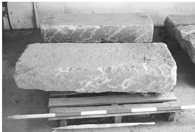
5. kép. A sírépítményhez tartozó díszítetlen kőlapok