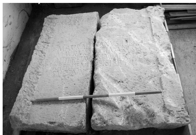
2. kép. A sírépítmény két összeillő feliratos kőlapja

Az aedicularszerű sírépítmények (síraediculák) rendszerint négyzetes alaprajzú, lépcsős alépítményre helyezett magasabb építmények, amelyek földszinti tömbjére egy elől nyitott, három oldalán reliefszerű kőlapokkal lezárt fülkeszerű emeleti szintet került. Az emeleti szintet tetőzet zárta le.