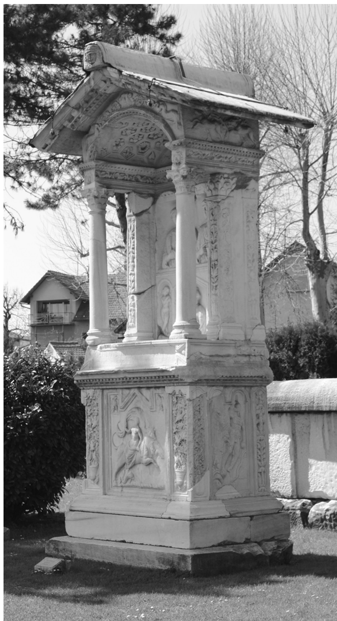
9. kép. Q. Ennius Liberalis és családjának sír építménye Šempeterből (Szlovénia)