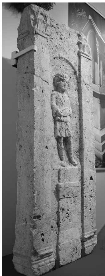
4. kép. A szolgafigurát ábrázoló sírépítményelem keskenyebbik oldala

szolgafíút faragtak ki. Hosszú ujjú, deréktájékon megkötött tunikát, valamint lábbelit visel. A kőlap homlokzati oldalának hosszanti szélein oszlopokat faragtak ki, amelyek közül a bal oldalit a kőlap keskenyebbik oldalán is kidolgozták (3–4. kép).