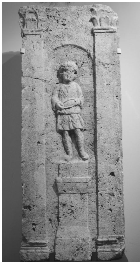
3. kép. Sírépítményelem szolgafigura ábrázolásával