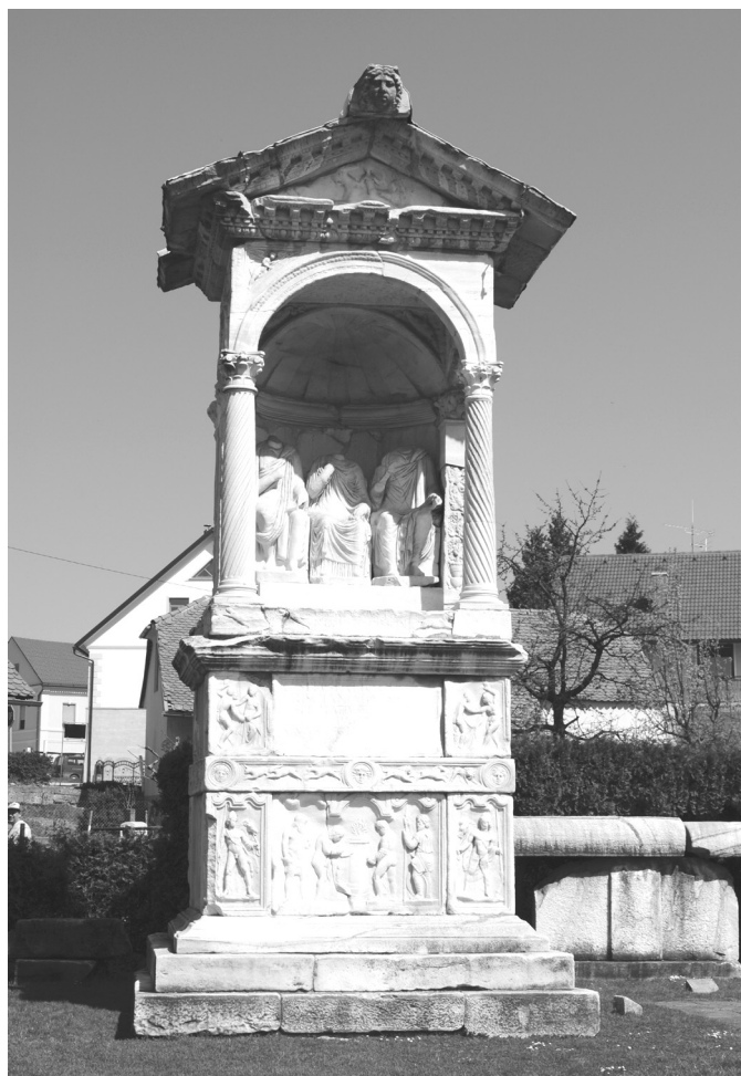
8. kép. C. Spectatius Priscianus és családjának sír építménye Šempeterből (Szlovénia)

oldalon állt (a szemlélő felől nézve), mivel reliefdíszes homlokzati oldala mellett a két keskenyebbik oldal közül csupán a bal oldali volt kifaragva (a reliefdísz mindig a szemlélő felé nézett).