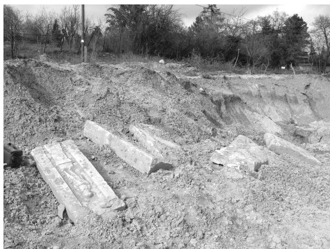
1. kép. A Rupp-hegyi római kori kővek előkerülési helye

Ami pannoniai viszonylatban mégis egyedülállóvá teszi a leleteket, az az, hogy az előkerült köemlékek zöme összetartozott, és az egyes elemekből – más provinciákból ismert analógiák alapján – lehetőség nyílt egy emeletes, ún. aedicula típusú sírépítmény rekonstrukciójára.